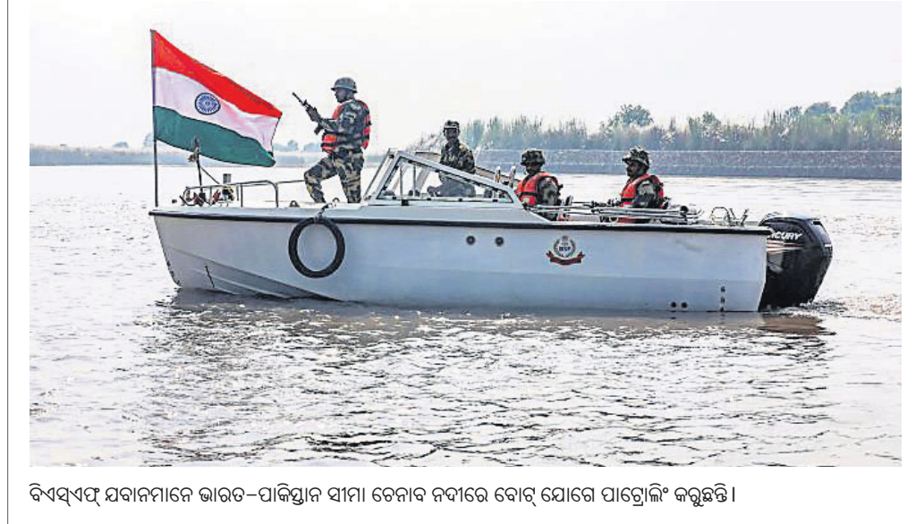
ବିଏସଏଫ୍ ଯବାନମାନେ ଭାରତ-ପାକିସ୍ତାନ ସୀମା ତେନାବ ନଦୀରେ ବୋର୍ଡ ଯୋଗେ ପାଟ୍ରେଲିଂ କରୁଛନ୍ତି।

ନାହିଁ ବୋଲି ତାଙ୍କ ସମେତ କୋଟି କୋଟି ଯୁବବର୍ଗ ଅନୁଭବ କରୁଥିବା କହେୟା କହିଛନ୍ତି।