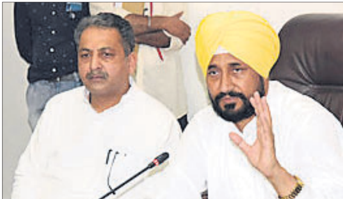
ଚଣ୍ଡିଗଡ଼ରେ ଖବରଦାତା ସମ୍ମିଳନୀକୁ ସମ୍ବୋଧିତ କରୁଛନ୍ତି ପଞ୍ଜାବ ମୁଖ୍ୟମନ୍ତ୍ରୀ ଚରଣଜିତ୍ ସିଂ ଚନ୍ନି।

କ୍ରିକେଟରରୁ ରାଜନେତା ସାଜିଥିବା ନବଜୋତ୍ ସିଂ ସିଦ୍ଧୁ କଂଗ୍ରେସ ସଭାପତି ପଦରୁ ଇସ୍ତଫା ଦେବା ପରେ ପଞ୍ଜାବ ରାଜନୀତିରେ ଅନିଶ୍ଚିତତା ଦେଖାଦେଇଛି।