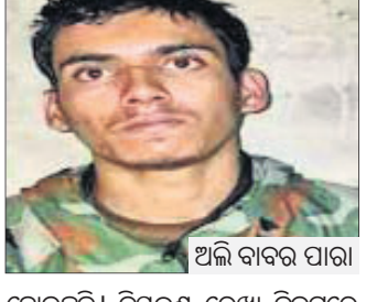
ଅଲି ବାବର ପାରା ହୋଇଛନ୍ତି। ନିୟନ୍ତ୍ରଣ ରେଖା ନିକଟରେ ସନ୍ଦେହଜନକ ଗତିବିଧି ସେନା ନକରକୁ

ଜମ୍ମୁ-କଶ୍ମୀରର ଭରି ସେକ୍ଟର ଅନ୍ତର୍ଗତ ନିୟନ୍ତ୍ରଣ ରେଖା(ଏଲଓସି)ରେ ସୁରକ୍ଷା ବଳର ଅନୁପ୍ରବେଶ ନିରୋଧୀ ଅଭିଯାନ ବେଳେ ଲଶ୍ଚର-ଇ-ତୋଜବା ସଂଘଠନର ଜଣେ ୧୯ ବର୍ଷୀୟ ପାକିସ୍ତାନୀ ଆତଙ୍କବାଦୀ ଗିରଫ ହୋଇଛନ୍ତି।