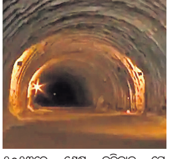
୨୦୨୩ରେ ଶେଷ କରିବାକୁ ସେ ନିର୍ମାଣକାରୀ ସଂସ୍ଥାକୁ ନିର୍ଦ୍ଦେଶ ଦେଇଛନ୍ତି। ଏହି ଟନେଲ ଶ୍ରୀନଗର-କାର୍ଗିଲ-ଲେହ କିଲୋମିଟର ଦୀର୍ଘ ଜୋଜିଲା ଟନେଲ

ଗୁଲମାର୍ଗ, ୨୮।୯: କେନ୍ଦ୍ର ସଡ଼କ ପରିବହନ ଓ ଜାତୀୟ ରାଜପଥ ମନ୍ତ୍ରୀ ନୀତିନ ଗଡ଼କରୀ ମଙ୍ଗଳବାର ଜୋଜିଲା ରିପିଟରରେ ଏସିଆର ଦୀର୍ଘତମ ଟନେଲ ନିର୍ମାଣ କାର୍ଯ୍ୟର ସମାପ୍ତ କରିଛନ୍ତି। ଜମ୍ମୁ-କଶ୍ମୀର ଓ ଲଦାଖ ୫୨ କିଲୋମିଟର ଦୂରତା ମଧ୍ୟରେ ୩୧ ଟନେଲ ନିର୍ମାଣ ହେବ ବୋଲି ଏହି ଅବସରରେ ଗଡ଼କରୀ ଘୋଷଣା କରିଛନ୍ତି। ଏହି ଟନେଲଗୁଡ଼ିକର କାର୍ଯ୍ୟ ଦୁଇବର୍ଷ ମଧ୍ୟରେ ସମ୍ପୂର୍ଣ୍ଣ କରିବାକୁ ଲକ୍ଷ୍ୟ ରଖାଯାଇଛି। ଦେଶର ସର୍ବବୃହତ ଭିଜିଲୁମି ପ୍ରକଳ୍ପ ମଧ୍ୟରୁ ଅନ୍ୟତମ ୧୪.୪ କିଲୋମିଟର ଦୀର୍ଘ ଜୋଜିଲା ଟନେଲ