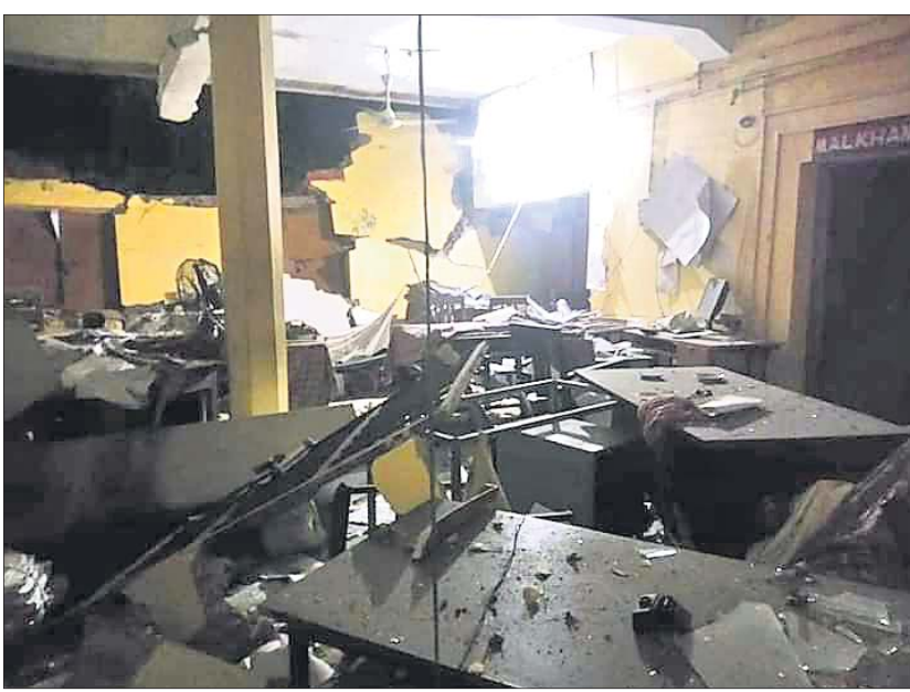
ବିଶ୍ୱୋରଣରେ ବଳଙ୍ଗା ଥାନା ରୁହ ଧସୁଥିବାରୁ ହୋଇଯାଇଛି।

ପୁରୀ ଜିଲ୍ଲା ପିପିଲି ବିଧାନସଭା ଆସନରେ ଉପନିର୍ବାଚନକୁ ବୁଲିବିନ ବାକି ଥିବାବେଳେ ସୋମବାର ମଧ୍ୟରାତ୍ରରେ ବଳଙ୍ଗା ଥାନାରେ ବଡ଼ଧରଣର ବିଶ୍ୱୋରଣ ଘଟିଛି। ଏହା ଏତେ ଶକ୍ତିଶାଳୀ ଥିଲା ଯେ ଥାନା ଓ ମାଲଖାନାର ଛାତ, କାନ୍ଥ ଭୁସ୍ତୁଡ଼ିପଡ଼ିଛି। ଏଥିରୁ ମାଲଖାନାରେ ବୋମା ରହିଥିବା ସ୍ୱପ୍ନ ହେଉଥିବାବେଳେ ତାହା କାହା ବ୍ୟବହାର ପାଇଁ ପୋଲିସ୍ ରଖିଥିଲା ବୋଲି ପ୍ରଶ୍ନ ଉଠିଛି। ଘଟଣାରେ କେହି ଆହତ ହୋଇ ନ ଥିବାବେଳେ ଜଣାପଡ଼େ ଯେ, ରାତିରେ ଥାନା ସମ୍ପୂର୍ଣ୍ଣ କର୍ମଚାରୀବିହୀନ ହୋଇପଡ଼ିଛି।