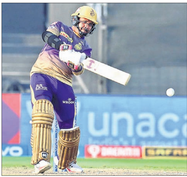
ମ୍ୟାଚ୍ ଅର୍ଦ୍ଧ ଶତକ କରି ନାଟ୍ୟାଳୟ।

ଶାରଳା, ୨୮।୯ ଭିଜୟ, ୩ ପରାଜୟ ସହ ୧୬ ପଏଣ୍ଟ ହାସଲ କରି ଦ୍ୱିତୀୟ ସ୍ଥାନରେ ରହିଛି। ୧୨୮ ଚାର୍ଜରେ ପିଛା କରି କୋଲକାତା ଭେକଟେଜ ଆୟାର (୧୪୪ରନ)କୁ ପ୍ରଥମେ ହରାଇଥିଲା। କୋଲକାତା ଏକଦା ୬୭ ରନରେ ୪ ଭିଜୟ ହରାଇଥିଲା। ତେବେ ନାଟ୍ୟାଳୟ ଚାରି ଓ ନାଟ୍ୟାଳୟ ଚାରି ବ୍ୟାଟି କରି ଦଳକୁ ବିଜୟ କରାଇଥିଲା। ନାଟ୍ୟାଳୟ ସର୍ବାଧିକ ୩୬ ରନ କରି ଅପରାଜିତ ରହିଥିଲେ। ସେହିପରି ଓପନର ଶୁକମନ ଗିଲ ୩୦, ନାଟ୍ୟାଳୟ ୨୧ ରନ କରି ଆଉଟ ହୋଇଥିଲେ। ୧୬୪୦ ଓଭରରେ କାରିଯୋ ରାବାଡ଼ାକୁ ନାଟ୍ୟାଳୟ ୨ ଛକା, ୧ ଚୋକା ସହ ୨୧ ରନ ଦେଇ ବିଜୟ ହରାଇଥିଲା। କୋଲକାତା ୧୧ ମ୍ୟାଚ୍ ଖେଳି ୫ ବିଜୟ ଓ ୬ ପରାଜୟ ସହ ୧୦ ପଏଣ୍ଟ ହାସଲ କରି ଚତୁର୍ଥସ୍ଥାନ ବନ୍ଧା ରହିଛି। ୧୮ ରନ ଦେଇ ୨ ଭିଜୟ ନେବା ସହ ଉପଯୋଗୀ ଭୂତ ୨୧ ରନ (୧୦ ବଲ୍, ୧ ଚୋକା, ୨ ଛକା) କରି ସୁନାମ ନାଟ୍ୟାଳୟ ପ୍ରଥମେ ଅର୍ଦ୍ଧ ଶତକ କରିବା ସହ ଦେଇ ବିଜୟ ହରାଇଥିଲା। ଅନ୍ୟପକ୍ଷେ ଦିଲ୍ଲୀ ୧୧ ମ୍ୟାଚ୍ ଖେଳି ୮