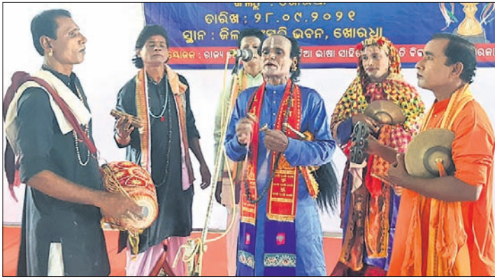
କଳାକାରମାନେ ପାଇଁ ଓ ନୂତନ ପରିବେଷଣ କରୁଛନ୍ତି।