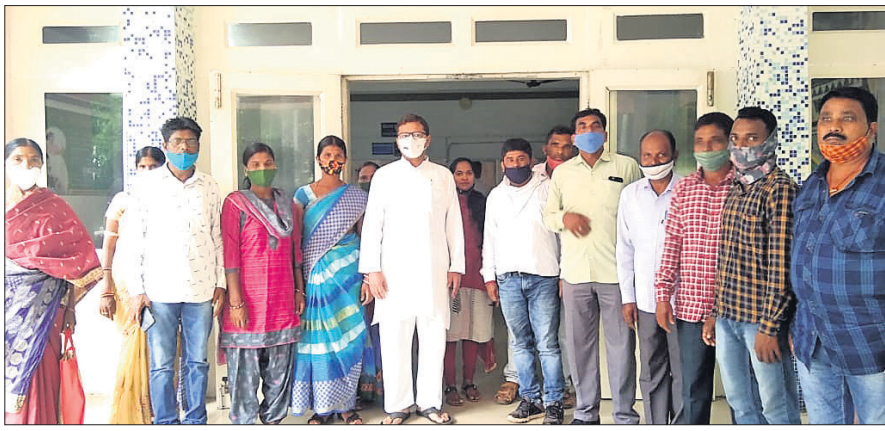
ଦକ୍ଷିଣାଞ୍ଚଳ ଆରୁଡିଏକୁ ଦାବି ଜଣାଇବାକୁ ଆସିଥିବା ଗ୍ରାମବାସୀ ଓ କୋରାପୁଟ ଏମପି।