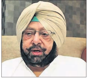
କେନ୍ଦ୍ର କୃଷିମନ୍ତ୍ରୀ ହେବା ନେଇ ଚର୍ଚ୍ଚା