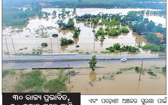
୩୦ ରାଜ୍ୟ ପ୍ରଭାବିତ, ୬୦ ହଜାର ଘରେ ପାଣି

ରାଜଧାନୀ ବ୍ୟାଙ୍କକୁ ବନ୍ୟା କବଳରୁ ସୁରକ୍ଷିତ ରଖିବା ପାଇଁ ସେନା ନିୟୋଜିତ ହୋଇଛନ୍ତି। ସହର ମଧ୍ୟକୁ ପାଣି ନ ଆସିବା ପାଇଁ ବ୍ୟାରିକେଡ୍ ନିର୍ମାଣ କରାଯିବା ସହ ବାଲିବସ୍ତା ଗଦା କରାଯାଇଛି। ବ୍ୟାଙ୍କରୁ ଉତ୍ତରରେ ପ୍ରାୟ ୬୦ କି.ମି. ଦୂରରେ ଥିବା ଅୟୁଧ୍ୟାୟରେ ପ୍ରତ୍ନତାତ୍ତ୍ୱିକ ଅବଶେଷ