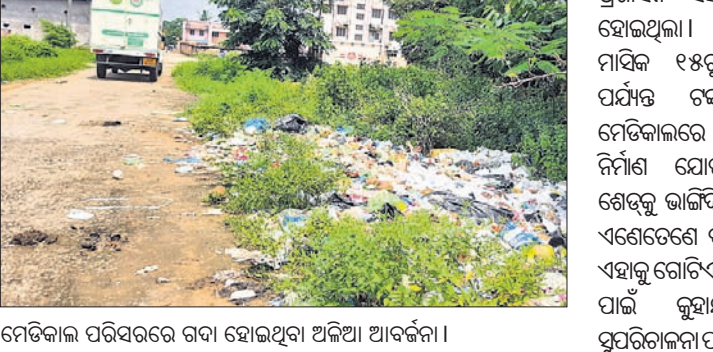
ମେଡିକାଲ ପରିସରରେ ଗଦା ହୋଇଥିବା ଅଳିଆ ଆବର୍ଜନା।