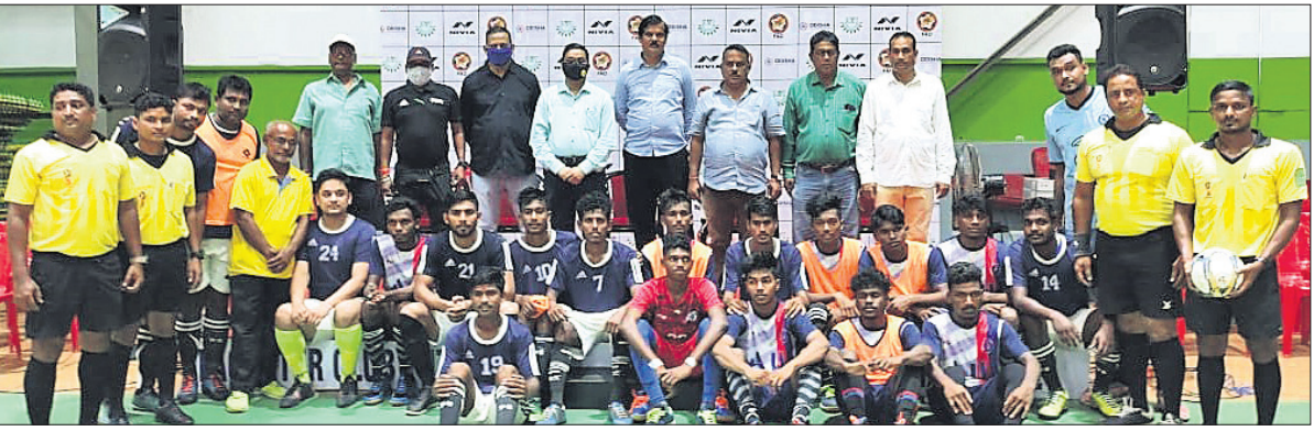
ପୁରସ୍କାର ଉଦ୍‌ଘାଟନୀ ଅବସରରେ ଅତିଥି ଓ କର୍ମଚାରୀଙ୍କ ସହ ଖେଳାଳିମାନେ।

ଭୁବନେଶ୍ୱର, ୨୮।୯ (ପି.ପି.) ପାଲିପାଲିର ପୂର୍ବତନ ଅଧିନାୟକ ତଥା ଅଧିକ ମ୍ୟାଚ୍ ଖେଳିଥିବା କ୍ରିକେଟର ଇଞ୍ଜିନିୟର ଏକ ଘରୋଇ ହସ୍ତିଗାଳରେ ଆଞ୍ଜିପୁରୀ ହୋଇଛି। ସେ ଡାକ୍ ଛାତ୍ରରେ ଯତ୍ନ ସହ ଏବଂ ଶାସ୍ତ୍ର ପ୍ରାଧିକାର ଅଧିକାରୀ ଅନୁଭବ କରିଥିଲେ। ତାଙ୍କୁ ଗୁଣାୟ ଏକ ଘରୋଇ ହସ୍ତିଗାଳକୁ ନିଆଯାଇଥିଲା। ବହୁ ସାମ୍ମୁଖ୍ୟରେ ଚେଷ୍ଟା ପରେ ତାଙ୍କୁ ସାମାନ୍ୟ ସୁବିଧାରେ ହୋଇଥାଇପାରେ ବୋଲି ଅନୁମତି କରାଯାଇଛି। ତାଙ୍କର ଆଞ୍ଜିପୁରୀ କରିବା କରୁଛି ବୋଲି ତାଙ୍କୁ ସମାନଙ୍କର ସୁବିଧା ହୋଇଥିଲା। ଜଣାଶୁଣା ଡାକ୍ତର ପ୍ରଦେବର ଆବାସ କାଳିଙ୍ଗ ଇଞ୍ଜିନିୟର ବିଦ୍ୟାଳୟରେ ରହିବା ପାଇଁ ପରିଲକ୍ଷିତ ହେଉଛି। ସେ ଡାକ୍ତରଖାନାକୁ ଛାଡ଼ି ପାଇଛନ୍ତି।