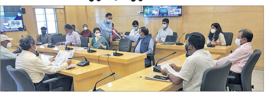
ସମାକ୍ଷା ବୈଠକରେ ସ୍ୱାସ୍ଥ୍ୟ ଓ ପରିବାର କଲ୍ୟାଣ ମନ୍ତ୍ରୀ ନବ କିଶୋର ଦାସ ଓ ଅନ୍ୟମାନେ।