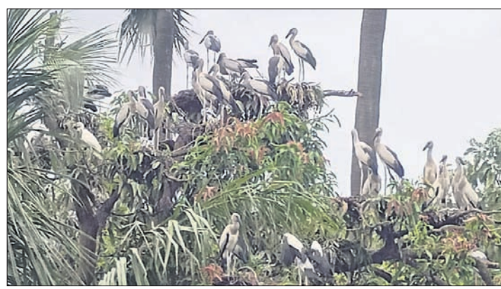
ଚେକୁଳିଆଁ ଗ୍ରାମରେ ବସା ବାସି ଥିବା ଚୋରାଳିଆ ପକ୍ଷୀ।

ଅନେକ ସତେଜନା ପରେ ବି କିଛି ଲୋକ ସୁରୁତ ନାହାନ୍ତି। ବିଲୁପ୍ତ ପ୍ରଜାତିର ପକ୍ଷୀମାନଙ୍କୁ ସେମାନେ ଶିକାର କରୁଛନ୍ତି। ବନବିଭାଗ କର୍ମଚାରୀଙ୍କୁ ଚକ୍ରାନ୍ତ ଦେଇ ଶିକାରୀମାନେ ଦିନକୁ ଦିନ ନିଜର ପକ୍ଷୀ ମେଲାଇ ଚାଲିଛନ୍ତି। ମୟୂରଭଞ୍ଜ ଜିଲ୍ଲା ବୈଶିଙ୍ଗା ଥାନା ଅଧୀନ ଅଁଳା ପଞ୍ଚାୟତରେ ଏପରି ଶିକାରୀମାନେ ସଂରକ୍ଷିତ ପ୍ରଜାତିର ଚୋରାଳିଆ, ବଗ ଏବଂ ପାଣିକୁଆ ସବୁକୁ ଅବାଧରେ ଶିକାର କରୁଛନ୍ତି।