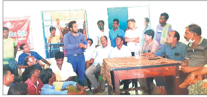
ବୈଠକରେ ରାଜନିତ୍ତ୍ୱ ଚୟନ ପ୍ରକ୍ରିୟା ସମ୍ପର୍କରେ ଆଲୋଚନା କରାଯାଇଛି।

ଅଭିଭାବକ ଶ୍ରୀମତୀ ଧର୍ମା ଅଧୀନ ପାଳିସାହି ପଞ୍ଚାୟତ କାର୍ଯ୍ୟାଳୟରେ ଗୁରୁବାର ରାଜନିତ୍ତ୍ୱ ଚୟନ ପ୍ରକ୍ରିୟାକୁ ନେଇ ଲୋକେ ହୋଇଛି। ଏଥିରେ ଅନିୟମିତତା ହୋଇଥିବା ଅଭିଯୋଗ କରାଯାଇଥିଲା। ପ୍ରକାଶ ଯେ, ୨ ମାସ ପୂର୍ବେ ପ୍ରଧାନମନ୍ତ୍ରୀ ଆବାସ ଯୋଜନାରେ ଗୁରୁ ନିର୍ମାଣ ପାଇଁ ୩୦ଜଣ ରାଜନିତ୍ତ୍ୱ ଚୟନ କରାଯାଇଥିଲା। ଯେଉଁ ହିସାବକାରୀ ୪୫ ଦିନ ମଧ୍ୟରେ ରାମ ସାରିକିଟି ସେମାନଙ୍କ ଚୟନ ପୂରାବଦ୍ଧ କାର୍ଯ୍ୟକ୍ରମ ଜମାଖାତାକୁ ମନୁରି ବାବଦରେ ଅର୍ଥରାଶି ଆସିଥିଲା। ପ୍ରଥମ ପର୍ଯ୍ୟାୟରେ ୩୦ଜଣଙ୍କ ଜମାଖାତାକୁ ଅର୍ଥରାଶି ଆସିଛି। ସେମାନଙ୍କୁ ଚଳିତ ମାସ ୨୯ ଓ ୩୦ ପ୍ରଶିକ୍ଷଣ ଦିଆଯିବାକୁ ଥିବା ହୋଇଥିଲା।