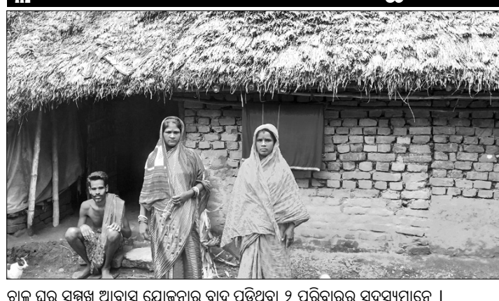
ବାଲ ଘର ସମ୍ମୁଖ ଆବାସ ଯୋଜନାକୁ ବାଦ୍ ପଡିଥିବା ୨ ପରିବାରର ସଦସ୍ୟମାନେ ।

ବାଗଜପତ୍ର ଓ ଘର ବୁଲାଇ ଦେଖାଇଥିଲେ। ଏହାସହ ବିଲ୍ ନ ଥିବାରୁ ସେମାନଙ୍କ ନାମ ତାଲିକାରୁ ବାଦ୍ ଦିଆଯାଇଛି ବୋଲି କହିଛନ୍ତି।