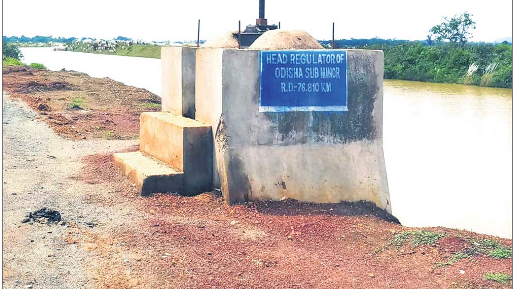
ଡେକାନାଲ ଜିଲା ଭୁବନ ବ୍ଲକର ଓଡ଼ିଶା ନିକଟସ୍ଥ ରେଙ୍ଗାଲି ବାମପାର୍ଶ୍ୱ କେନାଲର ହେଡ୍ ରେଗୁଲେଟର।

ବ୍ରାହ୍ମଣୀ ନଦୀ ଉପରେ ରେଙ୍ଗାଲି ବହୁପୁଖୀ ଯୋଜନାର ବାମପାର୍ଶ୍ୱ କେନାଲର ଆରତି ୨୧.୩୧୩ କିମିରୁ ୧୦୦.୪୯ କିମି ଅଞ୍ଚଳର ବିଭିନ୍ନ ସ୍ଥାନରେ ଫାଟ ସୃଷ୍ଟି ହୋଇଛି। ଫଳରେ ଡେକାନାଲ ଜିଲା ଭୁବନ ବ୍ଲକର ଓଡ଼ିଶାଠାରୁ ସାକପୁର ଜିଲା ସୁଲିଆ ବ୍ଲକ ମାଧ୍ୟମରେ ପର୍ଯ୍ୟନ୍ତ ୨୨ କିମି ଅଞ୍ଚଳରେ ପାଣି ଝରୁଛି। ଗତ ୧୮ ତାରିଖରେ ରେଙ୍ଗାଲି ପ୍ରକଳ୍ପର ଦ୍ୱିତୀୟ ପ୍ରୋଜେକ୍ଟ କୋର୍ଡିନେଶନ କମିଟି (ପିସିସି) ବୈଠକ ବିବରଣୀରୁ ଏହି ସୂଚନା ମିଳିଛି। ଏହାର କେନାଲ ଲାଇଫି ନିର୍ମାଣ ଏକମାତ୍ର ସମାଧାନ ବୋଲି ଜଳ ସମ୍ପଦ ବିଭାଗର ଇଞ୍ଜିନିୟର-ଇନ୍-ଚିଫ୍ ଗୁରୁତ୍ୱାହୀନ ପ କରୁଛନ୍ତି। ଏଥିପାଇଁ କେନାଲ ଲାଇଫି ଆଣ୍ଡ ସିଷ୍ଟମ ରିହାବିଲିଟେସନ୍ ପ୍ରୋଗ୍ରାମ (ସିଏଲ୍ଏସ୍ଆର୍ଏ) ପାଖରୁ ପ୍ରାୟ ୬୬ କୋଟି ଟଙ୍କା ଖର୍ଚ୍ଚ ହେବ ବୋଲି ବିଭାଗୀୟ ସୂତ୍ରରୁ ଜଣାପଡ଼ିଛି; ଯାହା କି ରାଜ୍ୟ ସରକାରଙ୍କ ରାଜକୋଷରୁ ଅତିରିକ୍ତ ଭାବେ ପାଣିରେ ପଡ଼ିବ ବୋଲି ମତପ୍ରକାଶ ପାଇଛି। ତେବେ ଦାୟିତ୍ୱରେ ଥିବା ଠିକାଦାରଙ୍କ ମନମାନି ଏବଂ ନିମ୍ନମାନର ମାଟି, ମୋରମ ଇତ୍ୟାଦି ନିର୍ମାଣ ସାମଗ୍ରୀ ବ୍ୟବହାର ଏହାର ମୁଖ୍ୟକାରଣ ବୋଲି ଅଭିଯୋଗ ହୋଇଛି।