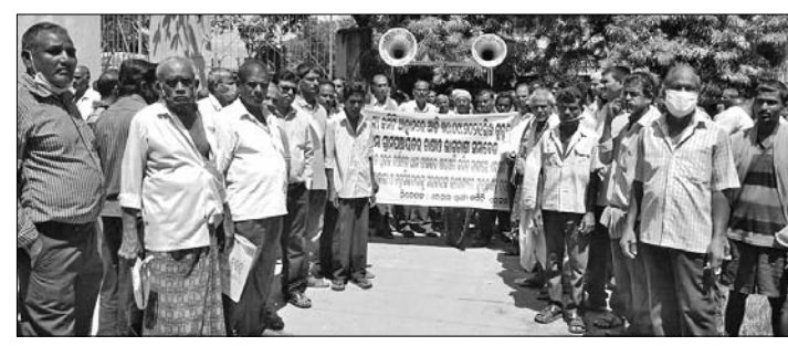
ଏରସମା ତହସିଲ ସମ୍ମୁଖରେ ୮ ଦଫା ଦାବି ପୂରଣ ଲାଗି ବିକ୍ଷୋଭ ପ୍ରଦର୍ଶନ କରୁଛନ୍ତି।

ଏରସମା, ୩୦୯ (ସ.ପ୍ର.) ଏରସମା ଗ୍ରାମ୍ୟ କମିଟି ପକ୍ଷରୁ ଗୁରୁତାର ଶତାଧିକ ଚାଷୀ ୮ ଦଫା ଦାବିରେ ଏରସମା ତହସିଲ ସମ୍ମୁଖରେ ବିକ୍ଷୋଭ ପ୍ରଦର୍ଶନ କରିଥିଲେ।