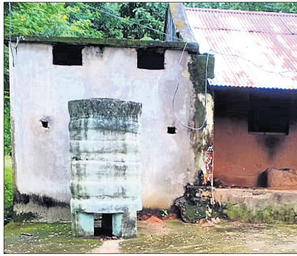
ଅକାମୀ ହୋଇପଡ଼ିଥିବା ପାଣିଟାଙ୍କି ।