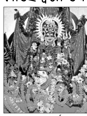
ମାହେଶ୍ୱରୀ ବେଶରେ ସର୍ବମଙ୍ଗଳା ।