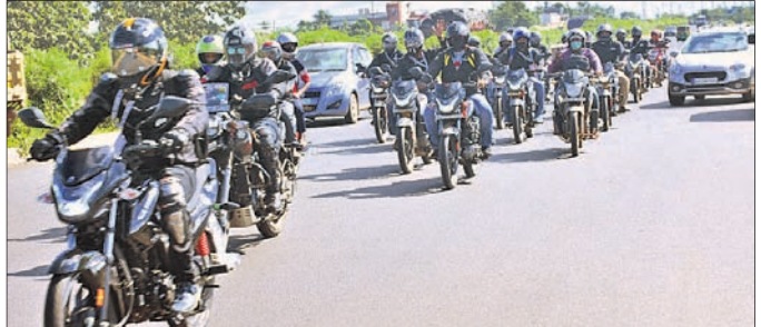
ରୋହନ ଅଟୋ ରାଜତର୍ପ, ଭୁବନେଶ୍ୱର।