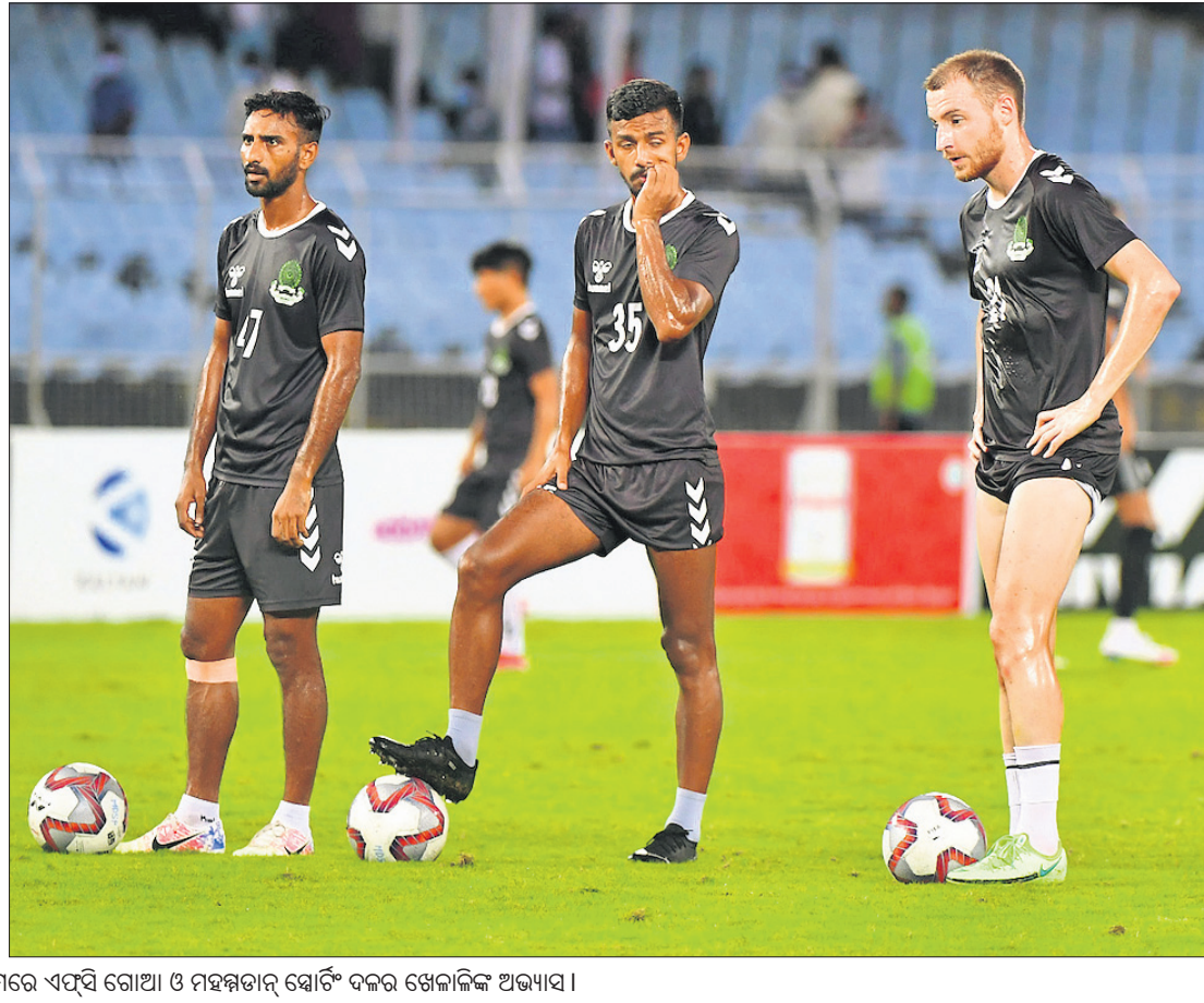
ହୁରାଣ୍ଡ କପ୍ ଫୁଟବଲ୍ ଫାଇନାଲ ପୂର୍ବରୁ ଶନିବାର କୋଲକାତାର ସଲ୍‌ଲେନ୍ ଷ୍ଟାଡ଼ିୟମ୍‌ରେ ଏପ୍‌ସି ଗୋଆ ଓ ମହମ୍ମଦ୍‌ସ୍ ଷ୍ଟାଡ଼ିଂ ଦଳର ଖେଳାଳିଙ୍କ ଅଭ୍ୟାସ।