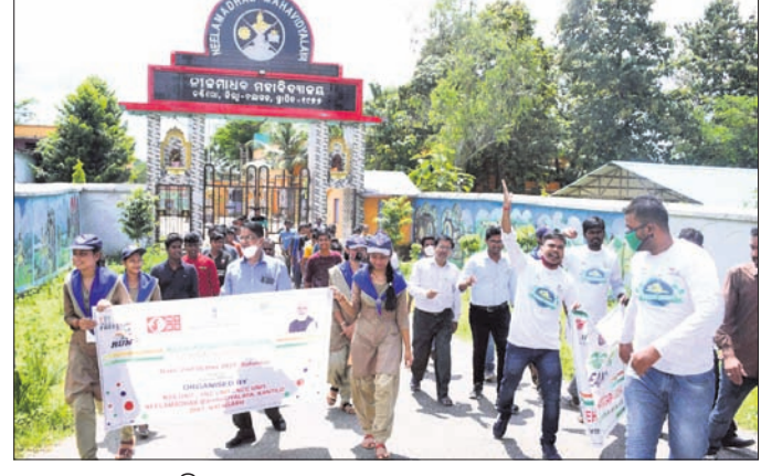
ଶୋଭାଯାତ୍ରାରେ ସାମିଲ ଛାତ୍ରଛାତ୍ରୀ ।