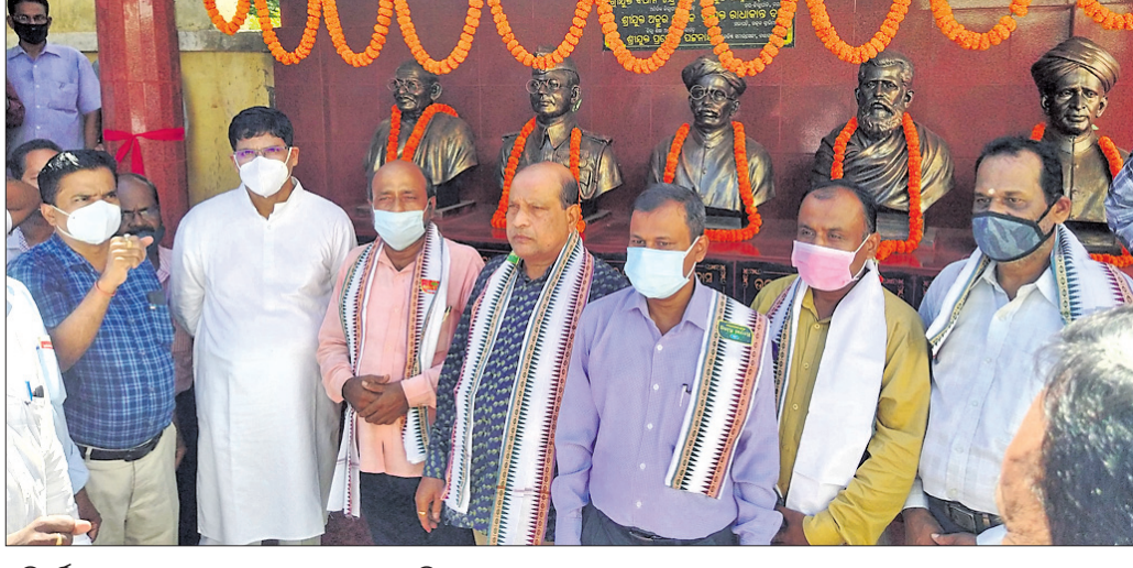
ପ୍ରତିମୂର୍ତ୍ତି ଉନ୍ମୋଚନ ଉତ୍ସବରେ ଯୋଗଦେଇଥିବା ଅତିଥି ବୃନ୍ଦ ।