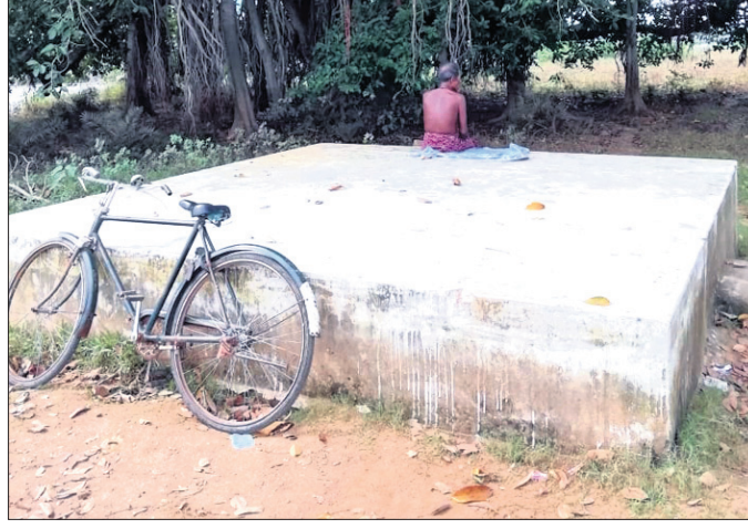
ଅବହେଳିତ ଭାବେ ପଡ଼ିଥିବା ଦଶହରା ପଡ଼ିଆ ।

କ୍ରମଶଃ ସଂକୃତିତ ହେବାରେ ଲାଗିଛି । ସମୟରେ ମରାମତି କରାଯାଇଥିବା ବେଳେ ସମ୍ପ୍ରତି ଏହି ଗାଆଁ ଉପରୁ