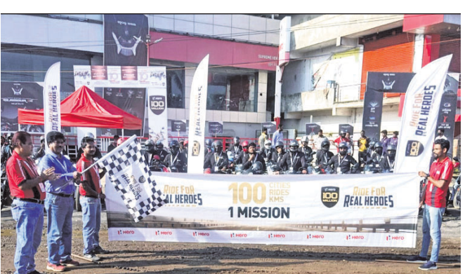
ସୁପ୍ରିମ୍ ସେଲ୍, କୟପୁର।