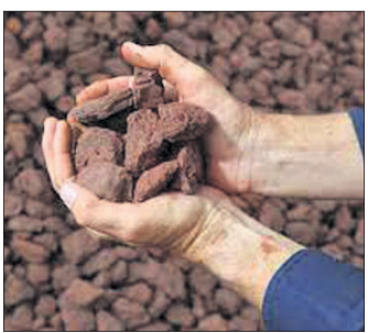
ପ୍ରାଥମିକତା ମିଳିବ ଇସ୍ପାତ ଶିଳ୍ପକୁ

ନେଇ ପ୍ରତିଷ୍ଠିତ ଦେଇଥିବା ଜଣାପଡ଼ିଛି। ରାଜ୍ୟରେ ଥିବା ଶିଳ୍ପଗୁଡ଼ିକର ବିକାଶ ଲାଗି ସରକାର ସବୁ ପ୍ରକାର ପଦକ୍ଷେପ ନେବେ ବୋଲି ସରକାର କହିଛନ୍ତି।