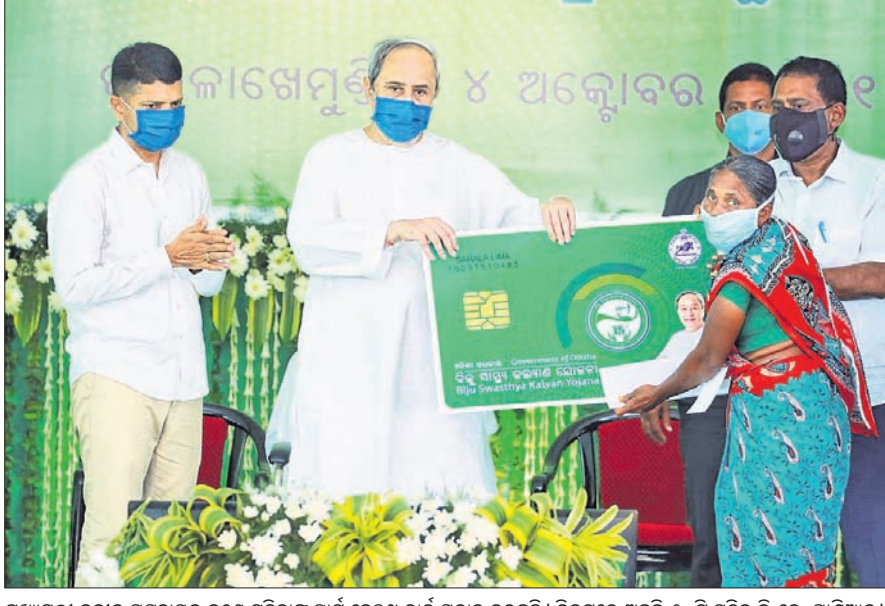
ମୁଖ୍ୟମନ୍ତ୍ରୀ ନବୀନ ପଟ୍ଟନାୟକ ଜଣେ ମହିଳାଙ୍କୁ ସ୍ୱାଗତୀୟ କାର୍ଯ୍ୟ ପ୍ରଦାନ କରୁଛନ୍ତି। ନିକଟରେ ଅଛି ୫-ଟି ସ୍ୱତନ୍ତ୍ର ଲ.କେ. ପାଠଶାଳା।

ମୁଖ୍ୟମନ୍ତ୍ରୀ ନବୀନ ପଟ୍ଟନାୟକ ସୋମବାର ଗଜପତି ଜିଲ୍ଲାରେ ବିଭିନ୍ନ ସ୍ଥାନରେ ଗଜପତି ମୋ' ପାଇଁ ସ୍ୱତନ୍ତ୍ର ନବୀନ ଗଢ଼ାଉ ପ୍ରକଳ୍ପର ଉଦ୍ଘାଟନ କରିଛନ୍ତି। ଏହି ଅବସରରେ ଜନସାଧାରଣଙ୍କୁ ଉଦ୍ଘୋଷଣା ଦେଇ ମୁଖ୍ୟମନ୍ତ୍ରୀ କହିଛନ୍ତି, ଗଜପତି ଜିଲ୍ଲା ସହ ବିଜୁବାବୁଙ୍କର ସମ୍ପର୍କ ବିଷୟରେ ସମସ୍ତେ ଜାଣନ୍ତି। ଗଜପତି ଜିଲ୍ଲା ତାଙ୍କ ପାଇଁ ସ୍ୱତନ୍ତ୍ର ରୁଚୁଥିବା ସହଜ କରାଯାଇଛି। ଗଜପତିରେ ସ୍ୱାଗତୀୟ କାର୍ଯ୍ୟ ଆରମ୍ଭ କରି ସେ ବହୁତ ଖୁସି ବୋଲି କହିଛନ୍ତି। ଗଜପତି ହେଉଛି କଳା ଓ ସଂସ୍କୃତିର ଭୂମି। ଛୋଟିଆ ଜିଲ୍ଲା ହେଲେ ମଧ୍ୟ ଆଧୁନିକ ଓଡ଼ିଶା ପାଇଁ ଗଜପତିର ଅବଦାନ ବହୁତ ବେଶି। ଏହି ଅବସରରେ ସ୍ୱତନ୍ତ୍ର ଉତ୍କଳ ପ୍ରଦେଶ ଗଠନର ଅନ୍ୟତମ ପୁରୋଧା ମହାରାଜା କୃଷ୍ଣଚନ୍ଦ୍ର ଗଜପତିକୁ ମନେପକାଇ ମୁଖ୍ୟମନ୍ତ୍ରୀ କହିଛନ୍ତି, ତାଙ୍କ ଅବଦାନକୁ ଏ ଜାତି କେବେ ଭୁଲି ପାରିବ ନାହିଁ। ସେ ଥିଲେ ବିକାଶ ଓ ସ୍ୱାଭିମାନର ପ୍ରତୀକ। ସେହିପରି କବି ଗୋପାଳ କୃଷ୍ଣ ପଟ୍ଟନାୟକ ତଥା ବିଶିଷ୍ଟ ଐତିହାସିକ ସତ୍ୟନାରାୟଣ ରାଜଗୁରୁଙ୍କୁ ମଧ୍ୟ ମୁଖ୍ୟମନ୍ତ୍ରୀ ଶ୍ରଦ୍ଧାଞ୍ଜଳି ଅର୍ପଣ