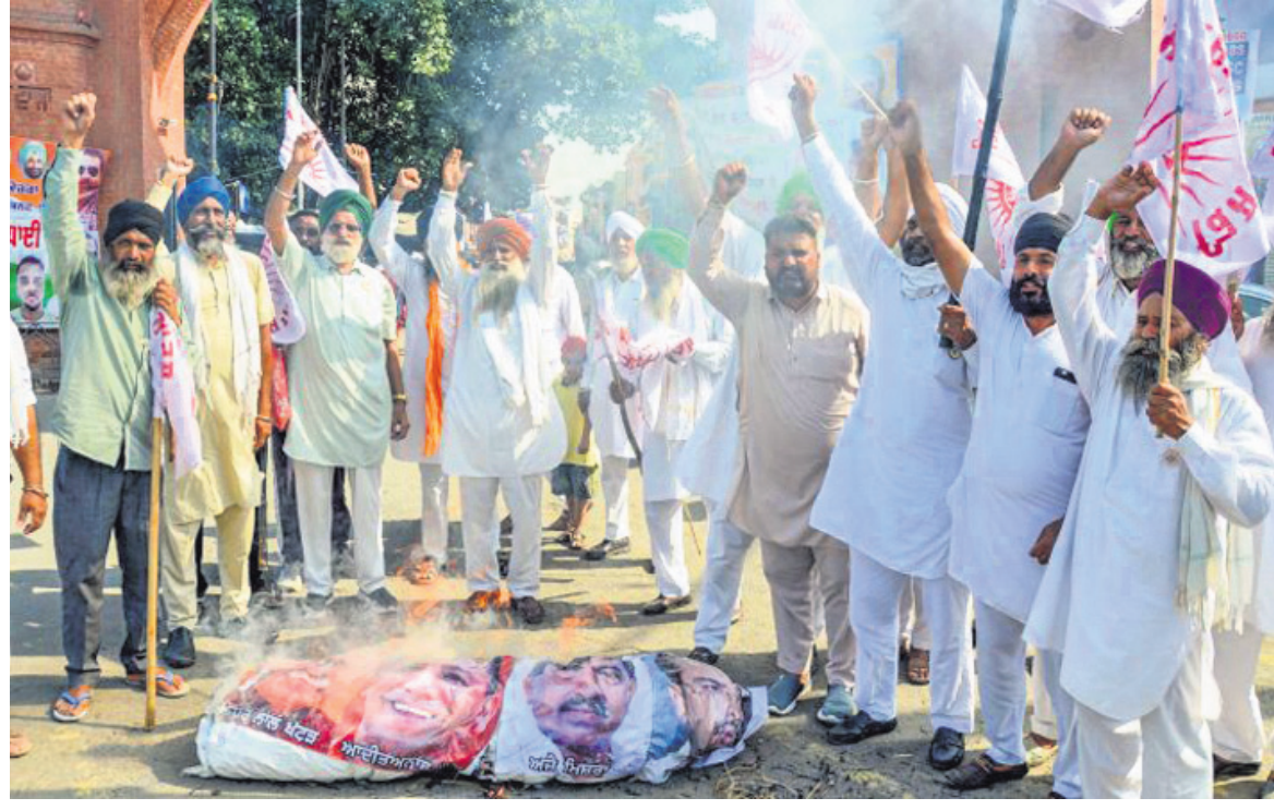
ଲଖ୍ନୁପୁର ଖେରି ହିଂସାକାଣ୍ଡ ବିରୋଧରେ ଲୋକକାତାରେ କଂଗ୍ରେସ କର୍ମୀମାନେ ଛୁପି ପୁଖ୍ୟମନ୍ତ୍ରୀ ଯୋଗୀ ଆଦିବ୍ୟାପକ କୁଶପୁରୁଷାନ୍ତ ବାହ କରୁଛନ୍ତି ।