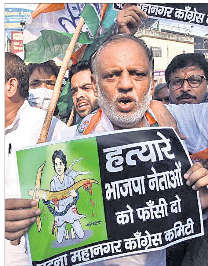
ଲକ୍ଷ୍ମୀପୁର ଖେରି ମାମଲାରେ ଭାଙ୍ଗିବା ନେତାଙ୍କୁ ଫାଂସୀ ଦାବିରେ ପାଟନାରେ କଂଗ୍ରେସ କର୍ମୀଙ୍କ ବିଶୋଭ।

ପରିବାର ସହ ଛିଡ଼ା ହୋଇଛନ୍ତି। ସେହିପରି ପ୍ରିୟଙ୍କାଙ୍କ ଗିରଫଦାରି ସମ୍ପୂର୍ଣ୍ଣ ଦେଖାଯାଇ ନାହିଁ। ପୋଲିସ କେବଳ ଯୋଗାଣ ନିର୍ଦ୍ଦେଶ ମାତ୍ର କାମ କରୁଥିବାକୁ ଯୁଦ୍ଧରେ ଆଇନର ଶାସନ ଚାଲୁ ନାହିଁ ବୋଲି ଏଥିରୁ ସ୍ପଷ୍ଟ ହେଉଥିବା ବରିଷ୍ଠ କଂଗ୍ରେସ ନେତା ପି. ଚିଦାମବରମୁକୁନ୍ଦ କହିଛନ୍ତି। କର୍ମଚାରୀ ପୂର୍ବତନ ପୁଖ୍ୟମନ୍ତ୍ରୀ ସିଦ୍ଧାରାମାୟା ଏହି ଘଟଣା ଜାଣିଆନାହୁଁଲେ ଗଣହତ୍ୟାର ସ୍ମୃତିକୁ ଉଜ୍ଜୀବିତ କରିଥିବା କହିଛନ୍ତି। ସେହିପରି ରାଷ୍ଟ୍ରପତି କୋଠ ଦଳ (ଆର୍କଏଲ୍‌ଡି) ଅଧ୍ୟକ୍ଷ ଜୟନ୍ତ ଚୌଧୁରୀ କହିଛନ୍ତି, ଯୋଗା ସରକାର ସତକୁ ଚପାଇବା ପାଇଁ ଉଦ୍ୟମ କରୁଛନ୍ତି। ଯୁଦ୍ଧରେ ରାଷ୍ଟ୍ରପତି ଶାସନ ଜାରି କରାଯାଇ ବୋଲି ସେ ଦାବି କରୁଛନ୍ତି।