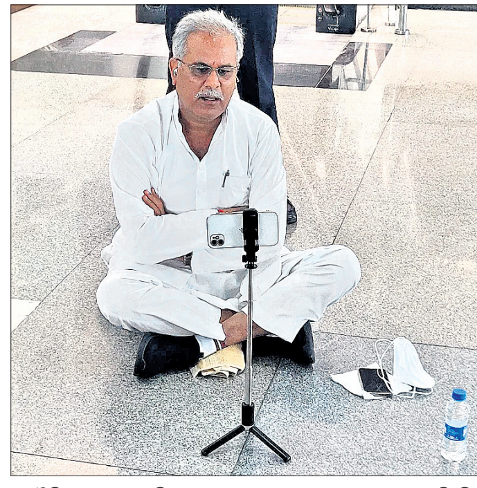
ଲକ୍ଷ୍ମୀ ବିମାନବନ୍ଦରରେ ଛତିଶଗଡ଼ ପୁଖ୍ୟମନ୍ତ୍ରୀ ଭୂପେଶ ବାଗେଲ ଧାରଣାରେ ବସିଥିଲେ।