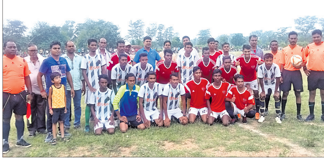
ବିକେତା ଓ ଉପବିକେତା ଦଳ ସହ ଅତିଥିମାନେ।

ପହଞ୍ଚିଥିଲା। ବିତାୟ ସେମିଫାଇନାଲ କୌଡିଆପୁଣ୍ଡା ଓ ଆରାଧ୍ୟା କ୍ଲବ ଏପ୍ରି ମଧ୍ୟରେ ହୋଇଥିଲା। ଏଥିରେ କୌଡିଆପୁଣ୍ଡା ଦଳ ଆରାଧ୍ୟା ଦଳକୁ ୨-୦ ଗୋଲରେ ପରାଜିତ କରି ବିତାୟ ଦଳ ଭାବରେ ଫାଇନାଲରେ ପ୍ରବେଶ କରିଥିଲା। ଫାଇନାଲ ଖେଳ ତୁରୁମ ଓ କୌଡିଆପୁଣ୍ଡା ମଧ୍ୟରେ ହୋଇଥିଲା। ଏଥିରେ ତୁରୁମ ଦଳ କୌଡିଆପୁଣ୍ଡାକୁ ୧-୦ ଗୋଲରେ ପରାଜିତ କରି ଗୋଲକଳ ହାସଲ କରିଥିଲା। ପରେ ଗୋଲରେ ପରାଜିତ କରି ଫାଇନାଲରେ