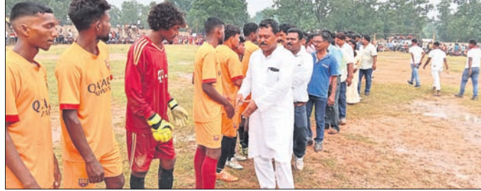
ଖେଳାଳିଙ୍କ ସହ ଅତିଥି କରମର୍ଦନ କରୁଛନ୍ତି।