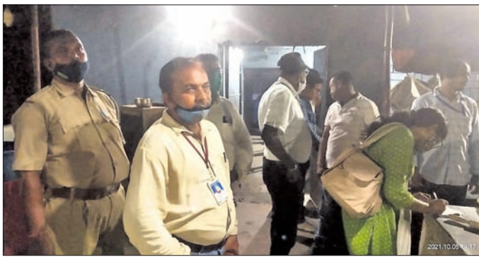
ସୋନପୁରରେ ଏନଫୋର୍ସମେଣ୍ଟ ଟିମ୍ ଖାଦ୍ୟପଦାର୍ଥର ମାନ ଯାଞ୍ଚ କରୁଛନ୍ତି ।

ପୁରୁ ଏନଫୋର୍ସମେଣ୍ଟ ସ୍କ୍ୱାଡ ପକ୍ଷରୁ ସୋନପୁର ସହରର ବିଭିନ୍ନ ହୋଟେଲ, ଜଳଖିଆ ଦୋକାନ ଓ ରାସ୍ତାପାର୍ଶ୍ୱ ଠେଲା ଦୋକାନରେ ମଙ୍ଗଳବାର ତତ୍ତ୍ୱାବ୍ଧି କରାଯାଇଛି । ଖାଦ୍ୟ ନିରାପତ୍ତା, ସ୍ୱାସ୍ଥ୍ୟ, ପୋଲିସ ବିଭାଗ ପକ୍ଷରୁ ମିଳିତ ଭାବେ ଏହି ତତ୍ତ୍ୱାବ୍ଧି କରାଯାଇଥିଲା । ବୁକ୍ ଛକ, ହରିଗଳ ରାସ୍ତା ଓ ବସଷ୍ଟାଣ୍ଡ ଅଞ୍ଚଳର ୨୫ଟି ରେଷ୍ଟୁରାଣ୍ଟ ଓ ଜଳଖିଆ ଦୋକାନର ଖାଦ୍ୟ ନମୁନା ଯାଞ୍ଚ ହୋଇଥିଲା । ନିୟମିତ ଖାଦ୍ୟ ପଦାର୍ଥ ଯାଞ୍ଚ ହେଉ ନ ଥିବାରୁ ରେଷ୍ଟୁରାଣ୍ଟଗୁଡ଼ିକ ବାସି ଖାଦ୍ୟ ପଦାର୍ଥ ବିକ୍ରି କରୁଥିବା ଦୃଷ୍ଟିକୁ ଆସିଥିଲା । ତିନି ସେହି ସବୁ ରେଷ୍ଟୁରାଣ୍ଟର ୩୨ କିଲୋ ବାସି ଖାଦ୍ୟ ନଷ୍ଟ ହୋଇଛି । ବାସି ଖାଦ୍ୟପଦାର୍ଥ ବିକ୍ରି କରୁଥିବା ହୋଟେଲ ମାଲିକଙ୍କ ନିକଟରୁ ମୋଟ ୫ ହଜାର ଟଙ୍କା ଜରିମାନା ଆଦାୟ କରାଯାଇଛି । ଭବିଷ୍ୟତରେ ଏଭଳି ବେଆଇନ କାର୍ଯ୍ୟ କଲେ ଆଇନ ଅନୁଯାୟୀ ଦୃତ