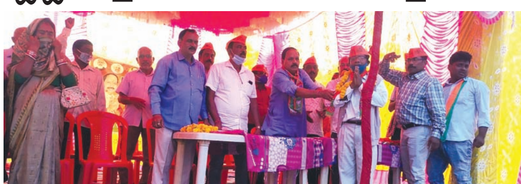
ମିଶ୍ରଣ ପର୍ବରେ ଭାଜପା ନେତା, କର୍ମୀ।