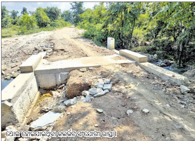
ଧୋଇ ହୋଇଯାଇଥିବା କଲଚିଟ ସଂଯୋଗୀ ରାସ୍ତା।