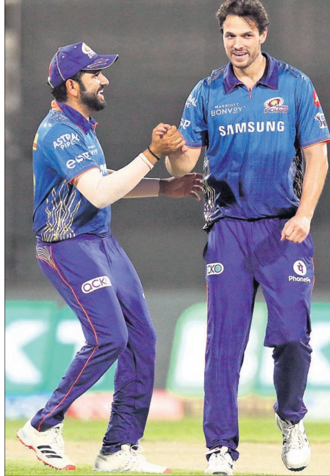
ସଫଳ ବୋଲର ନାଥାନ କୁଲ୍ସ-ନିଲ୍(ଡାହାଣ)ଙ୍କୁ ବଧେଇ ଜଗାଭଣ୍ଡରି ରୋହିତ ଶର୍ମା।

ପଛପୁଅ ରହିଛନ୍ତି। ଯୁନାଇଟେଡ ଆରବ ଏମିରେଟ୍ସ (ୟୁଏଇ)ରେ କିଛି ସର୍ବନିମ୍ନ ଷ୍ଟୋର କରିବାର ରେକର୍ଡ ଆରବିସି ନାମରେ ରହିଛି।