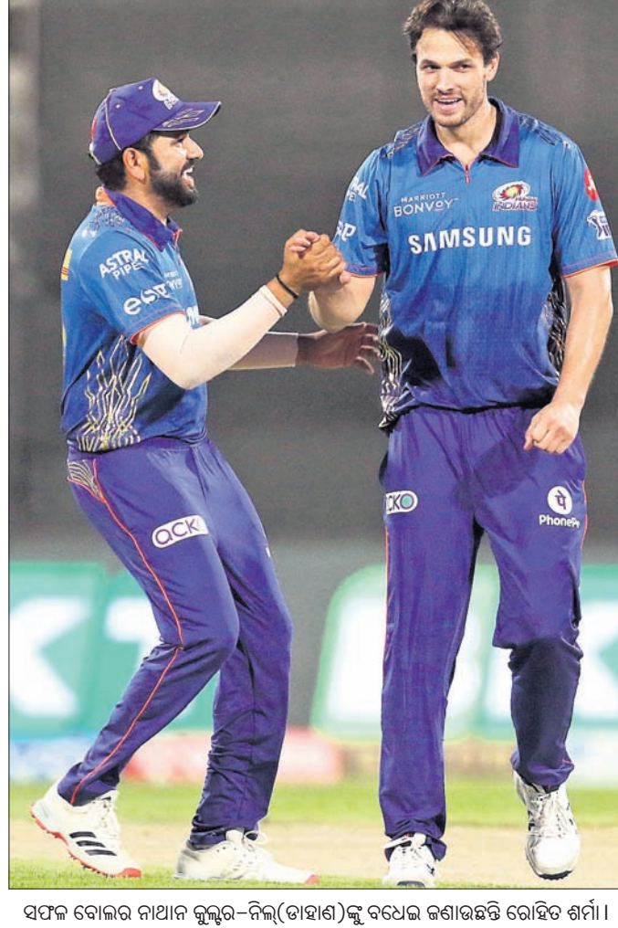
ସଫଳ ବୋଲର ନାଥାନ କୁଲ୍ଲର-ନିଲ୍(ଡାହାଣ)ଙ୍କୁ ବଧେଇ ଜଗାଭଣ୍ଡରି ରୋହିତ ଶର୍ମା।

ପଛପୁଅ ରହିଛନ୍ତି। ସୁନାଲଚେଟ ଆରବ ଏମିରେଟ୍ସ (ୟୁଏଇ)ରେ କିନ୍ତୁ ସର୍ବନିମ୍ନ ଷ୍ଟୋର କରିବାର ରେକର୍ଡ଼ ଆରସିସି ନାମରେ ରହିଛି।