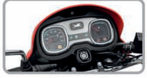
କାର ପରି ସ୍ବାତୋମିଟର