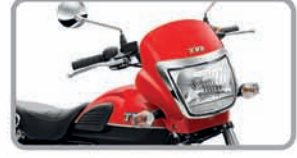
ଝୁକ ବ୍ରେକେଜ୍ ହେଡ୍ଲ୍ୟାମ୍ପ

ନୂଆ RADEON ଡୁଆଲ୍ ଟୋର୍ ଚଳାନ୍ତୁ ଧାକ୍ଷତ ଉତ୍ସବ ପାଳନ୍ତୁ