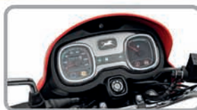
କାର୍ ପରି ସାତୋଟିଟର