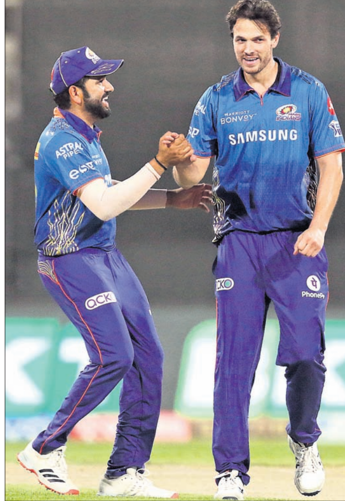
ସଫଳ ବୋଲର ନାଥାନ କୁଲ୍‌ର-ନିଲ୍(ଡାହାଣ)ଙ୍କୁ ବଧେଇ ଜଗାଭଣ୍ଡରି ରୋହିତ ଶର୍ମା।

ପଛକୁ ପଛ ରହିଛନ୍ତି। ଯୁନାଇଟେଡ୍ ଆରବ ଏମିରେଟ୍ସ (ୟୁଏଇ)ରେ କିନ୍ତୁ ସର୍ବନିମ୍ନ ଷ୍ଟରୋ କରିବାର ରେକର୍ଡ ଆରବିସି ନାମରେ ରହିଛି।