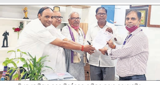
ଭିଏସ୍‌ଏସ୍ ବିମାନ ବନ୍ଦର ନିର୍ଦ୍ଦେଶକଙ୍କୁ ଦାବିପତ୍ର ପ୍ରଦାନ କରାଯାଇଛି।

ବିମାନ ବନ୍ଦରର ବ୍ୟବସାୟିକ ଅଭିବୃଦ୍ଧି ହୋଇଛି। ମହାମାରୀ କୋଭିଡ୍ ସମୟରେ ଉତ୍ତାନ ପ୍ରଭାବିତ ହୋଇଥିଲେ ମଧ୍ୟ ବିମାନ ବନ୍ଦରକୁ ଲୋକାର୍ପିତ କରିଥିଲେ। କେନ୍ଦ୍ର ସରକାରଙ୍କ ଏହା ଏକ ଲାଭଦାୟକ ବିମାନ ବନ୍ଦର ହୋଇଥିବାବେଳେ ଏବେ ଉଡ଼ାଣ ଆରମ୍ଭ କରିଛି। ଏଥିପ୍ରତି ବିମାନ ପ୍ରୟାସ କରାଯାଇଛି। ଏହା ସହିତ ଏହି ବିମାନ ବନ୍ଦରକୁ ଦେଶର କେତେକ ପ୍ରମୁଖ ସହରକୁ ଉଡ଼ାଣ କରୁଥିବା ବିମାନକୁ ବ୍ୟବସାୟରେ ଏଡ଼େଟା କ୍ଷତି ହୋଇନାହିଁ। ଏଥିପ୍ରତି ବିମାନ ପ୍ରମୁଖ, ବେଙ୍ଗାଲୁରୁ ଆଦି ରହିଛି। ଅନେକ ସମୟରେ ବିମାନକୁ ବାଟିଲ କରାଯାଇଛି। ଫଳରେ ବିମାନ