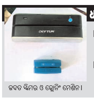
କବଚ ସିମ୍‌କାର୍ଡ ଓ କ୍ଲୋନ୍ ମେଶିନ୍।