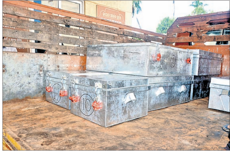
ବଡ଼ ବଡ଼ ଚିଶ ବାଙ୍କୁରେ ରୁପାକୁ ଗ୍ରହଣ କରାଯାଇଛି। କୋଷାଗାରକୁ ନିଆଯାଇଛି।

ଶ୍ରୀମନ୍ଦିରର ସାତ ଦ୍ଵାର ରୁପା ଛାଉଣି ସରିଥିବାବେଳେ କଳାହାଟ ଦ୍ଵାରର ରୁପା ଛାଉଣି ହୋଇପାରିନାହିଁ। ଆସନ୍ତା ବର୍ଷ ଶ୍ରୀଗୁଣ୍ଡିଚା ଯାତ୍ରା ସମୟରେ କଳାହାଟ ଦ୍ଵାରର ରୁପା ଛାଉଣି କରାଯିବ। ଏଥିପାଇଁ ଶ୍ରୀମନ୍ଦିର ପ୍ରଶାସନ ପକ୍ଷରୁ ନାକାନ୍ତ୍ରି ଭଦ୍ରନିବାସ ଖୁଜୁରୁମ୍ଫରେ ୧୧ଟି ବଡ଼ ବାଙ୍କୁରେ ରଖାଯାଇଥିବା ୫କ୍ଷୁଦ୍ରରୁପାକୁ ମଙ୍ଗଳବାର କଟା ପୁରଣା ମଧ୍ୟରେ ଜିଲ୍ଲା କୋଷାଗାରକୁ ନିଆଯାଇଛି।