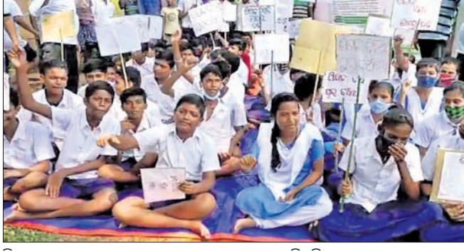
ବିଦ୍ୟାପାଠ ସମ୍ମୁଖରେ ଛାତ୍ରଛାତ୍ରୀମାନେ ଧାରଣାରେ ବସିଛନ୍ତି।