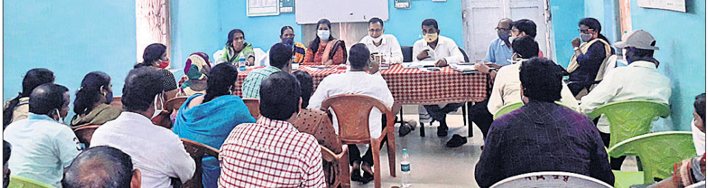
ଓପିସା ପଞ୍ଚାୟତ ସମିତି ବୈଠକରେ ବିଧାୟକ ସୁଜାତ ନାୟକ ଓ ଅନ୍ୟମାନେ।