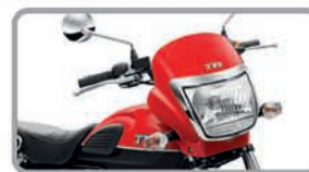
ଭୁକ୍ତ ବ୍ରେକେଲ୍ ହେଉଁଲ୍ୟାମ୍

ନୂଆ RADEON ଡୁଆଲ୍ ଟୋର୍ ଚଳାନ୍ତୁ ଧାକ୍ତ ଉତ୍ସବ ପାଳନ୍ତୁ