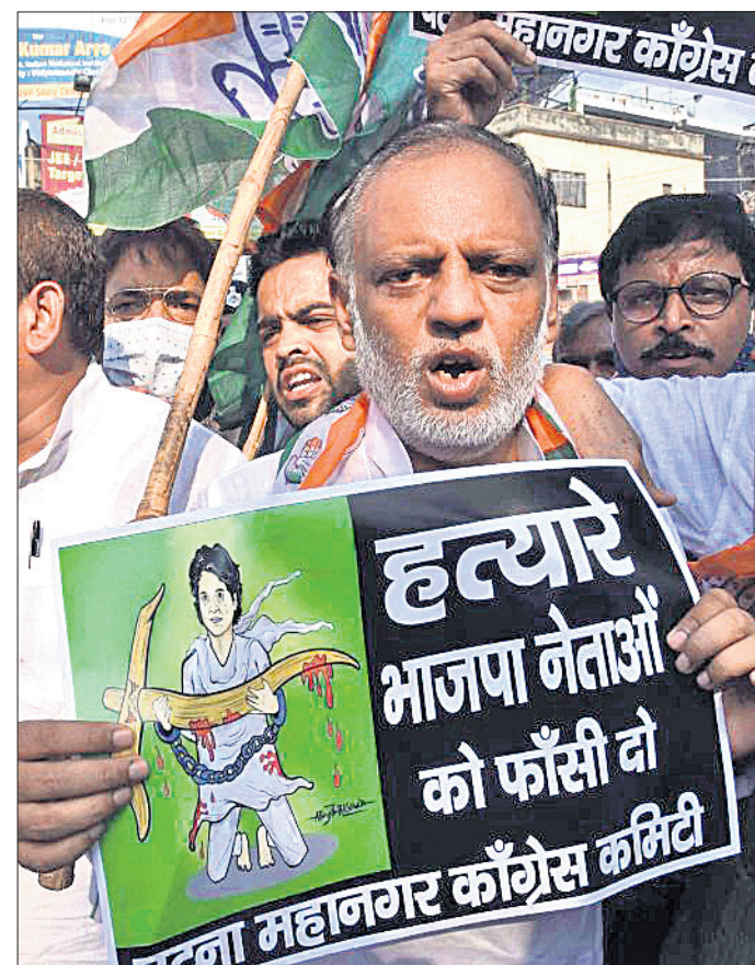
ଲକ୍ଷ୍ମୀପୁର ଖେରି ମାମଲାରେ ଭାଙ୍ଗପା ନେତାଙ୍କୁ ଫାଂସୀ ଦାବିରେ ପାଟନାରେ କଂଗ୍ରେସ କର୍ମୀଙ୍କ ବିଶୋଭ।

ପରିବାର ସହ ଛିଡ଼ା ହୋଇଛନ୍ତି। ସେହିପରି ପ୍ରିୟଙ୍କାଙ୍କ ଗିରଫଦାରି ସମ୍ପୂର୍ଣ୍ଣ ଦେଖାଯାଇଛି। ପୋଲିସ କେବଳ ଯୋଗାଣ ନିର୍ଦ୍ଦେଶ ମାତ୍ର କାମ କରୁଥିବାକୁ ଯୁଦ୍ଧରେ ଆଇନର ଶାସନ ଚାଲୁ ନାହିଁ ବୋଲି ଏଥିରୁ ସ୍ପଷ୍ଟ ହେଉଥିବା ବରିଷ୍ଠ କଂଗ୍ରେସ ନେତା ପି. ଚିଦାମ୍ବରମ୍ କହିଛନ୍ତି। କର୍ମଚାରୀ ପୂର୍ବତନ ପୁଖ୍ୟମନ୍ତ୍ରୀ ସିଦ୍ଧାରାମାୟା ଏହି ଘଟଣା ଜାଣିଆନାଖିଲାବାର ଗଣହତ୍ୟାର ସ୍ମୃତିକୁ ଉଜ୍ଜୀବିତ କରିଥିବା କହିଛନ୍ତି। ସେହିପରି ରାଷ୍ଟ୍ରୀୟ ଲୋକ ଦଳ (ଆର୍କଏଲ୍‌ଡି) ଅଧ୍ୟକ୍ଷ ଜୟନ୍ତ ଚୌଧୁରୀ କହିଛନ୍ତି, ଯୋଗା ସରକାର ସତକୁ ଚପାଇବା ପାଇଁ ଉଦ୍ୟମ କରୁଛନ୍ତି। ଯୁଦ୍ଧରେ ରାଷ୍ଟ୍ରପତି ଶାସନ ଜାରି କରାଯାଇ ବୋଲି ସେ ଦାବି କରିଛନ୍ତି।