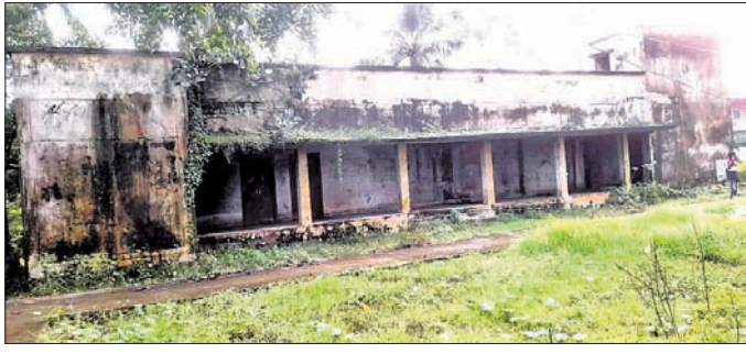
ଅଗ୍ରାୟା କୋର୍ଟ ପ୍ରତିଷ୍ଠା ପାଇଁ ଚିହ୍ନ ହୋଇଥିବା ପୁରୁଣା ବାଲିକା ବିଦ୍ୟାଳୟ ଗୃହ।

ବାଲେଶ୍ୱର ଜିଲ୍ଲା ଅଧୀନ ଖଇରା ବ୍ଲକରେ ପ୍ରଥମ ଶ୍ରେଣୀ ବିଚାର ବିଭାଗୀୟ ଅଫିସ୍‌ରେ ଖୋଲିବା ପାଇଁ ବିଜ୍ଞାପନ ପ୍ରକାଶ ପାଇବାର ୧୪ମାସ ପରେ ବି ସ୍ଥାୟୀ କୋର୍ଟ ସ୍ଥାପନ ଲାଗି ଜାଗା ନିରୂପଣ ହୋଇପାରିନାହିଁ। ଏକଲିକ ଅଗ୍ରାୟା କୋର୍ଟ ଲାଗି ଯେଉଁ ସରକାରୀ ଗୃହ ଚିହ୍ନ କରାଯାଇଥିଲା ଗ୍ରାମ୍ୟ ଉନ୍ନୟନ ବିଭାଗ ତରଫରୁ ଏ ପର୍ଯ୍ୟନ୍ତ ମରାମତି କରାଯାଇ ନ ଥିବାରୁ ଖଇରାରେ କୋର୍ଟ ପ୍ରତିଷ୍ଠା ଆଶା ମଉଜିବରେ ଲାଗିଛି। ଖଇରାବାସୀଙ୍କ ଦାୟିତ୍ୱ ନାହିଁ ଓ କୋର୍ଟ ସ୍ଥାପନାକୁ ପୁରୁସ୍କୃତ ଉପଲକ୍ଷି କରି ତୁରନ୍ତ ଅଗ୍ରାୟା କୋର୍ଟ ଖୋଲିବା ପାଇଁ ପଦକ୍ଷେପ ଗ୍ରହଣ କରିବାକୁ ବିଜିଲ ସଙ୍ଗଠନ ତଥା ଖଇରା ଜନସାଧାରଣଙ୍କ ତରଫରୁ ଦାବି ହୋଇଛି।