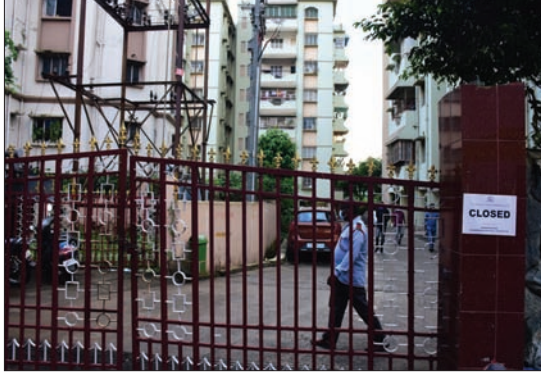
କଣ୍ଠେନ୍ ମେଣ୍ଟ ଯୋଗଣ ହୋଇଥିବା ରାଜେନ୍ଦ୍ର ବିହାର ଆପାର୍ଟମେଣ୍ଟ ଓ ଏକ ବୋକାନରେ ବିଏମ୍.ଏ. ଅଧିକାରୀ ମୋଟିସ୍ ଜଣାପଡିଛି।

ଭୁବନେଶ୍ୱର, ୧୧/୧୦(ବୁଧବୋ) ରାଜଧାନୀ ଭୁବନେଶ୍ୱରକୁ ପୁଣି ଫେରିଛି କଣ୍ଠେନ୍ ମେଣ୍ଟ। ଏକାଧରକେ ଏକାଧିକ ପକ୍ଷରୁ ବାହାରିବା ପରେ ଫରେଷ୍ଟ ପାର୍କ ଅଞ୍ଚଳରେ ଥିବା ରାଜେନ୍ଦ୍ର ବିହାର ଆପାର୍ଟମେଣ୍ଟକୁ ଭୁବନେଶ୍ୱର ମହାନଗର ନିଗମ (ବିଏମ୍.ଏ.) କଣ୍ଠେନ୍ ମେଣ୍ଟ ଯୋଗଣ କରିଛି। ସମ୍ପୂର୍ଣ୍ଣ ଅଞ୍ଚଳକୁ କେହି ଆସିପାରିବେ ନାହିଁ କି ସେଠାକୁ କେହି ଯାଇପାରିବେ ନାହିଁ। କଣ୍ଠେନ୍ ମେଣ୍ଟ ଜୋନରେ ବିଏମ୍.ଏ. ଅତ୍ୟାବଶ୍ୟକ ସାମଗ୍ରୀ ଓ ମେଡିକାଲ ଆବଶ୍ୟକତା ଯୋଗାଇଦେବ। ୫୨ ନମ୍ବର ଓଡ଼ିଶରେ ଥିବା ଏହି ଆପାର୍ଟମେଣ୍ଟରେ ୩୦୦ ପରିବାର ରହୁଛନ୍ତି। ୧୧ଟି ପରିବାରକୁ ପ୍ରାୟ ୨୦୦୦ ପିଠିକିତ ଟିକ୍ସ ହୋଇଛି। ତେବେ ଏମାନେ ସମସ୍ତେ ଗ୍ଲାନାୟ ଆକ୍ରାନ୍ତ ବୋଲି ଜଣାପଡିଥିବାବେଳେ