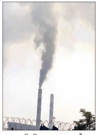
ବେଦାନ୍ତ ଚିମ୍ନିରୁ ବାହାରିଥିବା ପାଠାଳୟ