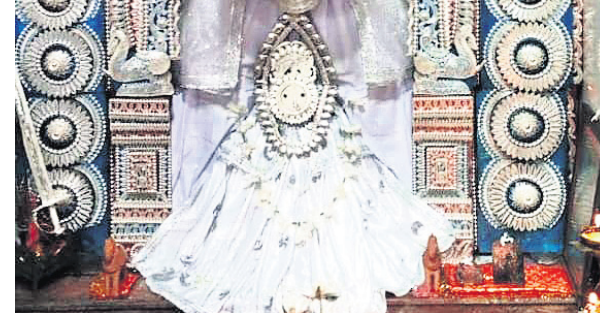
ବରଗଡ଼ରେ ମା ସମଲେଶ୍ୱରୀଙ୍କ ଧବଳପୁଷ୍ପ ବେଶ।