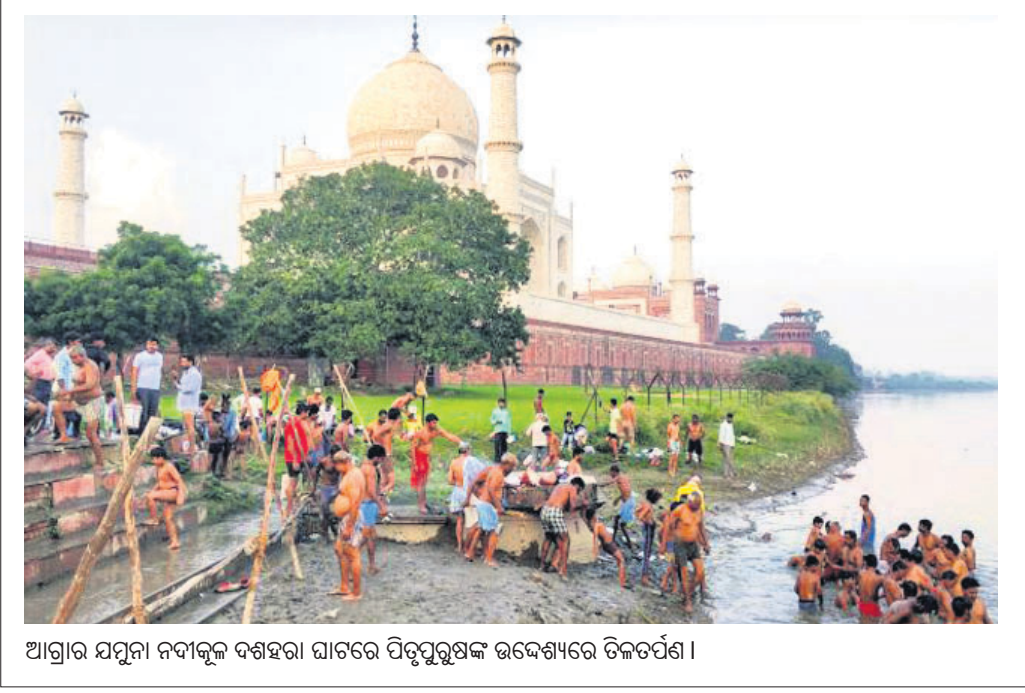
ଆଗ୍ରାର ଯମୁନା ନଦୀକୂଳ ଦଶହରା ଘାଟରେ ପିତୃତୃଷ୍ଣକ ଉଦ୍ଦେଶ୍ୟରେ ଡିକଟର୍ପଣ।

ବାଣ ନିର୍ମାତା ନିୟମ ଉଲ୍ଲଙ୍ଘନ କଲେ ସମ୍ପୂର୍ଣ୍ଣ ଶିଳ୍ପକୁ ଦଣ୍ଡିତ କରାଯାଇପାରିବ ନାହିଁ ବୋଲି ଅନ୍ୟ ଜଣେ ଆଇନଜୀବୀ ମୁକ୍ତ ବାବୁଥିଲେ। ଖଣ୍ଡପୀଠ ଆସନ୍ତା ୨୬ ତାରିଖରେ ଏହାର ପରବର୍ତ୍ତୀ ଶୁଣାଣି କରିବାକୁ ଧାର୍ଯ୍ୟ କରିଛନ୍ତି।