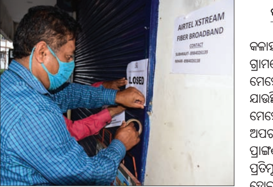
କଣ୍ଠେନ୍ ମେଣ୍ଟ ଯୋଗଣ ହୋଇଥିବା ରାଜେନ୍ଦ୍ର ବିହାର ଆପାର୍ଟମେଣ୍ଟ ଓ ଏକ ବୋକାନରେ ବିଏମ୍.ଏ. ଅଧିକାରୀ ମୋଟିସ୍ ଜଣାପଡିଛି।

ବିଏମ୍.ଏ. ସେମାନଙ୍କ କଣ୍ଠକୁ ଚୋପି ଆରମ୍ଭ କରିଛି। ଏଥିସହ ସମସ୍ତ ବାସିନ୍ଦାଙ୍କ ଚୋପି ବାଧ୍ୟତାମୂଳକ କରାଯାଇଛି। ସକାଳୁ ବିଏମ୍.ଏ. ଅଧିକାରୀମାନେ ଉକ୍ତ ଆପାର୍ଟମେଣ୍ଟରେ ପହଞ୍ଚି କଣ୍ଠେନ୍ ମେଣ୍ଟ ଯୋଗଣ କରିବା ସହ କମିଶନରଙ୍କ ପକ୍ଷରୁ ଜାରି କଟକଣା ନୋଟିସ୍ ଜଣାଇଥିଲେ। ଏହାସତ୍ତ୍ୱେ