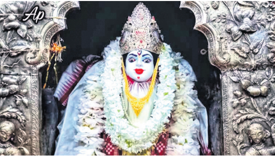
ସୋନପୁର: ମା' ସୁବେଶ୍ୱରୀ ଧବଳପୁଷ୍ପ ବେଶରେ ଭକ୍ତଙ୍କୁ ଦର୍ଶନ ଦେଉଛନ୍ତି।

ଯୋଗାଣ ବିଭାଗକୁ ଏକାଧିକ ଥର ନିଗମ ପକ୍ଷରୁ ଆବେଦନ ଦିଆଯାଇଥିବା ସତ୍ତ୍ୱେ ମଧ୍ୟ ଚାଉଳ ଆମ୍ବାତ କରିବାକୁ ନିର୍ଦ୍ଦେଶ ଦିଆଯାଇ ନଥିବାରୁ ଚାଉଳ ଆମ୍ବାତ କରିବାକୁ ନିର୍ଦ୍ଦେଶ ଦିଆଯାଇଛି।