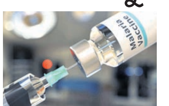
ହେଉଛି ୫ ବର୍ଷରୁ କମ୍ ବୟସର ପିଲା। ପୁଣ୍ୟତଃ ଆଫ୍ରିକା ମହାଦେଶରେ ଏହି ରୋଗ ଦେଖାଦେଇଥାଏ।

କେନେଡା, ୬।୧୦ ମ୍ୟାଲେରିଆ ନିରାକରଣ ପାଇଁ ପ୍ରସ୍ତୁତ ପ୍ରଥମ ଚିକିତ୍ସା ବିଶ୍ୱ ସ୍ୱାସ୍ଥ୍ୟ ସଂଗଠନ (ଡକ୍ଟର ଏବଂ) ରୁଧିରୀ ମଞ୍ଜୁରୀ ପ୍ରଦାନ କରିଛି। ମ୍ୟାଲେରିଆ ବିରୋଧୀ ଲକ୍ଷ୍ମପୁରରେ ଏହା ଏକ ଐତିହାସିକ ସଫଳତା ବୋଲି କୁହାଯାଉଛି। ଉକ୍ତ ଚିକିତ୍ସା ଲକ୍ଷ୍ମ ଲକ୍ଷ ଲୋକଙ୍କ ଜୀବନ ବଞ୍ଚାଇବାରେ ସହାୟକ ହୋଇପାରିବ ବୋଲି ଆଶା କରାଯାଉଛି। ସବୁଠୁ ପୁରୁଣା ଏବଂ ମାରାତ୍ମକ ସଂକ୍ରମଣ ରୋଗ ମ୍ୟାଲେରିଆରେ ପ୍ରତିବର୍ଷ ପ୍ରାୟ ୫ ଲକ୍ଷ ଲୋକ ପ୍ରାଣ ହରାଇଥାନ୍ତି। ସେଥିରୁ ୨,୬୦,୦୦୦