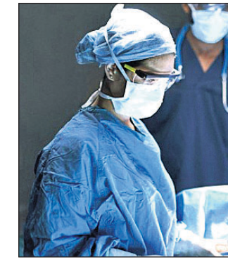
ବିଶ୍ୱରେ କେବଳ ୨ ରୁ ୩ ଟି ଏଭଳି ଘଟଣା ଘଟିଛି ।

ନୋଏଡ଼ା: କଥାରେ ଅଛି ରଖେ ହରି ମାରେ କିଏ । ଏଭଳି ଏକ ଚମତ୍କାର ଭାବରେ