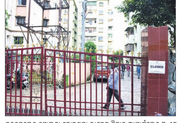
କଣ୍ଠେନ୍ ମେଣ୍ଟ ଶାସନା ହୋଇଥିବା ରାଜଧାନୀ ଆପାର୍ଟମେଣ୍ଟ ଓ ଏକ ଦୋକାନରେ ବିଏମ୍ପି ଅଧିକାରୀ ଗୋଟିଏ ଲଗାଉଛନ୍ତି।

ରାଜଧାନୀ ଆପାର୍ଟମେଣ୍ଟ, ବ୍ୟବସାୟିକ ପ୍ରତିଷ୍ଠାନ ବନ୍ଦ