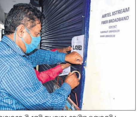
କଣ୍ଠେନ୍ ମେଣ୍ଟ ଶାସନା ହୋଇଥିବା ରାଜଧାନୀ ଆପାର୍ଟମେଣ୍ଟ ଓ ଏକ ଦୋକାନରେ ବିଏମ୍ପି ଅଧିକାରୀ ଗୋଟିଏ ଲଗାଉଛନ୍ତି।

ଭୁବନେଶ୍ୱର, ୨୧.୧୦.୨୧ (ବୁଧବେ) ରାଜଧାନୀ ଭୁବନେଶ୍ୱରକୁ ପୁଣି ଫେରିଛନ୍ତି କଣ୍ଠେନ୍ ମେଣ୍ଟ। ଏକାଧାରରେ ଏକାଧାର ପଲିଟିକ୍ସ ବାହାରିବା ପରେ ଫରେଷ୍ଟ୍ ପାର୍କ ଅଞ୍ଚଳରେ ଥିବା ରାଜଧାନୀ ଆପାର୍ଟମେଣ୍ଟକୁ ଭୁବନେଶ୍ୱର ମହାନଗର ନିଗମ (ବିଏମ୍ପି) କଣ୍ଠେନ୍ ମେଣ୍ଟ ଘୋଷଣା କରିଛି।