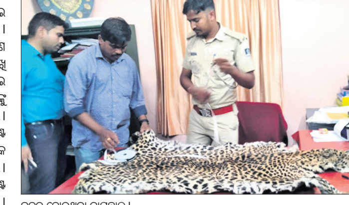
କଳରାପଡରିଆ ବାଉଛାଇ ଜବତ ହୋଇଥିବା ବାଉଛାଇ।

କଳରାପଡରିଆ ବାଉଛାଇ ଜବତ କରାଯାଇଛି। ଏହି ଘଟଣାରେ ବାଲିଗୁଡ଼ା ହାତରେ ବାଉଛାଇ ବନ୍ଦୀକୁ ଗିରଫ କରାଯାଇଛି।