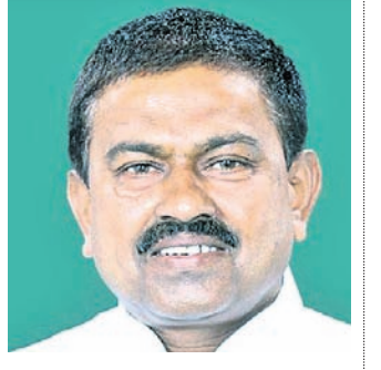
ପ୍ରଥମ ଥର ପାଇଁ ସରକାରୀ ଶାହାଙ୍କୁ ତାଙ୍କ ବାସଭବନରେ ଭେଟିଛନ୍ତି । ରୁକ୍ତନେତାଙ୍କ ମଧ୍ୟରେ ଅଧ୍ୟୟନ ଧରି ଆଲୋଚନା ହୋଇଥିଲା । ଏହା ପରେ ଅଜୟ ନର୍ଥ ବ୍ଲକ୍ ପାଠ୍ୟ ପୁସ୍ତକରେ ଥିବା ନିଜ ଅଧ୍ୟୟନ ଯାଇ କାର୍ଯ୍ୟରେ ଯୋଗଦେଇଥିଲେ ।

ଲକ୍ଷ୍ମୀପୁର ଖେରି ହିନ୍ଦୀ ମାମଲାରେ ବୃତ୍ତାନ୍ତମୟ ଅନିର୍ଦ୍ଧାରଣ କରାଯାଇଛି । ନିର୍ଦ୍ଧାରଣ ଅନୁସାରେ ପୁଞ୍ଜି ଆକ୍ରମଣ ସମ୍ପର୍କିତ ଏକାଧିକ ଭିତ୍ତିରେ ସାମ୍ରାଜ୍ୟ ଆସିଛି । ଏହି ଘଟଣାକୁ ନେଇ ସରକାରୀ ରାଷ୍ଟ୍ରମନ୍ତ୍ରୀ ଅଜୟ ମିଶ୍ରା ଲକ୍ଷ୍ମୀପୁର ଦିଆରୁ ବୋଲି ବିଜେପି ମହଲରେ ବିଶେଷକରି ବିରୋଧୀଙ୍କ ପକ୍ଷରୁ ଦାବି ହେଉଛି । ତେବେ ଅଜୟ ଲକ୍ଷ୍ମୀପୁର ଦେବେ ନାହିଁ ବୋଲି ସରକାରୀ ସୂତ୍ରରୁ ପ୍ରକାଶ । ଅଜୟ ଧର କି ଦୁଇଥର ନୁହେଁ, ଅନେକ ଥର ସଫେଇ ଦେଲେଣି ଯେ, ସେଠାରେ ସେ କିମ୍ପା ତାଙ୍କର ପୁଅ ନ ଥିଲେ । ତେଣୁ ପଦ ଛାଡ଼ିବାର ଚାପ ନାହିଁ । ଲକ୍ଷ୍ମୀପୁର କାର୍ଯ୍ୟକ୍ରମ ଦେବେ ବୋଲି ଅଜୟ ପ୍ରଶ୍ନ କରିଛନ୍ତି । ଏହି ଘଟଣାରେ ହତ୍ୟା ମାମଲା ରୁକ୍ତ ହେବା ପରେ ଅଜୟ ଯୋଗଦେଇଥିଲେ ।