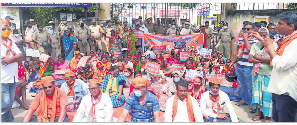
ଭାଇପା ପକ୍ଷରୁ ଥାନା ଘେରାଇ କରାଯାଇଛି।