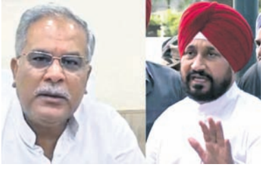
ଭୂପେଶ ବସେଇ ଓ ଚରଣଜିତ୍ ସିଂ ଚନି ରୁଧିବାର ଘୋଷଣା କରିଛନ୍ତି । ଚନି ଲକ୍ଷ୍ମୀପୁର ହିନ୍ଦୀକୁ ୧୯୯୯ର ଚାଲିଆନାଠାଲା ବାନ୍ ଗଣହତ୍ୟା ଭାଷାରେ ସମାଲୋଚନା କରିଛନ୍ତି ।

କଂଗ୍ରେସ ଶାସିତ ରାଜ୍ୟ ପଞ୍ଜାବ ଓ ଛତିଶଗଡ଼ ସରକାର ଯୁପିର ଲକ୍ଷ୍ମୀପୁର ଖେରି ହିନ୍ଦୀରେ ପ୍ରାଣ ହରାଇଥିବା ଲୋକଙ୍କ ପରିବାରକୁ ୫୦ ଲକ୍ଷ ଟଙ୍କା ଲେଖାଏ ଅନୁକମ୍ପାମୂଳକ ସହାୟତା ରାଶି ଦେବେ । ଏନେଇ ଛତିଶଗଡ଼ ମୁଖ୍ୟମନ୍ତ୍ରୀ ଭୂପେଶ ବସେଇ ଓ ପଞ୍ଜାବ ମୁଖ୍ୟମନ୍ତ୍ରୀ ଚରଣଜିତ୍ ସିଂ ଚନି ରୁଧିବାର ଘୋଷଣା କରିଛନ୍ତି । ଚନି ଲକ୍ଷ୍ମୀପୁର ହିନ୍ଦୀକୁ ୧୯୯୯ର ଚାଲିଆନାଠାଲା ବାନ୍ ଗଣହତ୍ୟା ଭାବେ ଅଭିହିତ କରିଥିବାବେଳେ ଚନି ଲକ୍ଷ୍ମୀପୁର ହିନ୍ଦୀକୁ ୧୯୯୯ର ଚାଲିଆନାଠାଲା ବାନ୍ ଗଣହତ୍ୟା ଭାଷାରେ ସମାଲୋଚନା କରିଛନ୍ତି ।