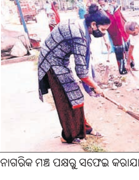
ନାଗରିକ ମଞ୍ଚ ପକ୍ଷରୁ ସଫେଇ କରାଯାଇଛି।

ଅନୁଷ୍ଠାନ, ବଣଭୋଜିସ୍ଥଳ, ମେଳା ପରିସର, ସମସ୍ତ କୁଳ ଆଦି ସ୍ଥାନକୁ ଆବର୍ଜନାଗୁନ୍ଥ୍ୟ ରଖିବାକୁ ପ୍ରାର୍ଥନା କରି କରାଯାଇଛି। ଏହି ପରିପ୍ରେକ୍ଷାରେ ମଞ୍ଚର ସ୍ୱେଚ୍ଛାସେବୀମାନେ ଗାନ୍ଧୀ ଜୟନ୍ତୀରେ ସକାଳ ୬ଟାରୁ ୮ଟା ପର୍ଯ୍ୟନ୍ତ ସଫେଇ କାର୍ଯ୍ୟ କରିଥିଲେ। ସଫେଇ ପରେ ଏକ ସଭା ଅନୁଷ୍ଠିତ ହୋଇଥିଲା। ପୁଖ୍ୟଅତିଥି ସାକାର କରିବା ନିମନ୍ତେ ନାଗରିକ ମଞ୍ଚ ସ୍ୱେଚ୍ଛାସେବୀମାନେ ୨୦୧୪ ମସିହା ଗାନ୍ଧୀ ଜୟନ୍ତୀର ବର୍ତ୍ତମାନ ପର୍ଯ୍ୟନ୍ତ ପ୍ରତ୍ୟେକ ରବିବାର ସକାଳେ ବିଭିନ୍ନ ଦପ୍ତର ପରିସର, ବଜାର ସ୍ଥଳ, ଧାର୍ମିକ