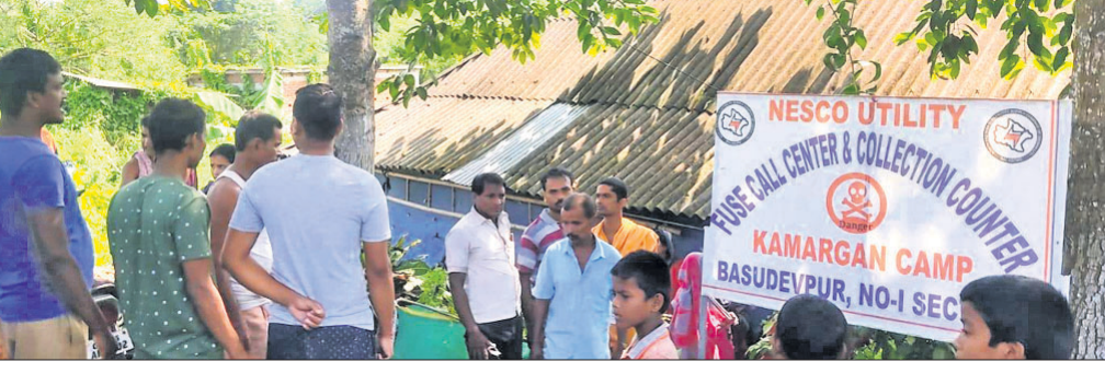
ଦୁଧ କଲ୍ ସେଣ୍ଟର ସାମ୍ନାରେ ଉଦ୍ଦ୍ୟତ ଉପଭୋକ୍ତାମାନେ।