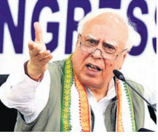
ନାଗରିକମାନଙ୍କ ଉପରେ ଗାଡ଼ି ଚକାଇ ହତ୍ୟା କରାଯାଇଛି । ଅଦାଲତ ଏହା ଉପରେ ପଦକ୍ଷେପ ନିଅନ୍ତୁ ବୋଲି ବରିଷ୍ଠ ଆଇନଜୀବୀ ସିବଲ ଅନୁରୋଧ କରିଛନ୍ତି ।

୪ କୃଷକ ସମେତ ୮ ଜଣଙ୍କ ଜୀବନ ଯାଇଥିବା ଲକ୍ଷ୍ମୀପୁର ଖେରି ହିନ୍ଦୀ ଘଟଣାରେ ସୁପ୍ରିମକୋର୍ଟ ନିଜ ଆଡୁ ମାମଲା ରୁକ୍ତ କରି କାର୍ଯ୍ୟାନୁଷ୍ଠାନ ନିଅନ୍ତୁ ବୋଲି ବରିଷ୍ଠ କଂଗ୍ରେସ ନେତା କପିଳ ସିବଲ ଅନୁରୋଧ କରିଛନ୍ତି । ସେ ରୁକ୍ତ କରି କହିଛନ୍ତି, ପୂର୍ବରୁ ମୁକ୍ତ୍ୟୁକ୍ତ, ସୋସିଆଲ ମିଡିଆ ନ ଥିଲା । ସୁପ୍ରିମକୋର୍ଟ ପ୍ରିକ୍ସ ମିଡିଆର ଖବରକୁ ଭିଜିକରି କାର୍ଯ୍ୟାନୁଷ୍ଠାନ ନେଉଥିଲେ । ସ୍ୱର ଉତ୍ତୋଳନ କରିପାରୁ ନ ଥିବା ଲୋକଙ୍କ କଥା ଶୁଣୁଥିଲେ । ଆଜି ଆମ ନାଗରିକମାନଙ୍କ ଉପରେ ଗାଡ଼ି ଚକାଇ ହତ୍ୟା କରାଯାଇଛି । ଅଦାଲତ ଏହା ଉପରେ ପଦକ୍ଷେପ ନିଅନ୍ତୁ ବୋଲି ବରିଷ୍ଠ ଆଇନଜୀବୀ ସିବଲ ଅନୁରୋଧ କରିଛନ୍ତି ।