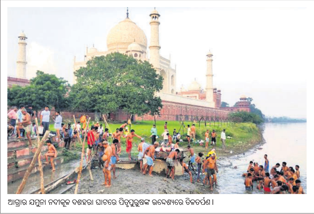
ଆଗ୍ରାର ଯମୁନା ନଦୀକୂଳ ଦଶହରା ଘାଟରେ ପିତୃତୃଷ୍ଣକ ଉଦ୍ଦେଶ୍ୟରେ ଚଳିତପର୍ବ।