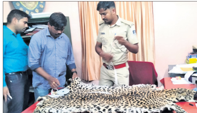
ଜବତ ହୋଇଥିବା ବାଘଛାଲ।

କନ୍ଧମାଳ ଜିଲ୍ଲା ବାଲିଗୁଡ଼ା ବନଖଣ୍ଡ ଏହି ଘଟଣାରେ ବାଲିଗୁଡ଼ା ହାଟପଦା ସାହରା ବିଦ୍ୟାଧର ନାୟକଙ୍କୁ ଗିରଫ କରାଯାଇଛି।