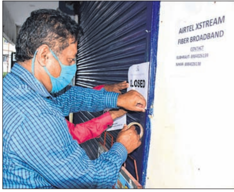
କଣ୍ଠେନ୍‌ମେଣ୍ଟ ଘୋଷଣା ହୋଇଥିବା ରାଜ୍ୟର ବିହାର ଆପାର୍ଟମେଣ୍ଟ ଓ ଏକ ବୋକାନରେ ବିଏମ୍‌ସି ଅଧିକାରୀ ନୋଟିସ୍ ଲଗାଉଛନ୍ତି।

୫୯୩ ନୂଆ ଆକ୍ରାନ୍ତ ମଧ୍ୟରୁ ଖୋର୍ଦ୍ଧାରୁ ୨୯୦ ରାଜ୍ୟରେ କରୋନା ତଳମୁହାଁ ଥିଲେ ମଧ୍ୟ ଖୋର୍ଦ୍ଧା ଜିଲ୍ଲାରୁ ସର୍ବାଧିକ ପଜିଟିଭ୍ ଚିହ୍ନଟ ହେଉଛନ୍ତି।