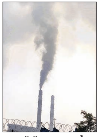
ବେଦାନ୍ତ ଚିମ୍ନିରୁ ବାହାରିଥିବା ପାଠାଳୟ ଆଖିଛନ୍ତି। ସେ କହିଛନ୍ତି, ବେଦାନ୍ତ କମ୍ପାନୀର ବେଆଇନ ପାଠାଳୟ ଚଳି ଝାରସୁଗୁଡ଼ା ଜିଲ୍ଲାକୁ ପ୍ରଦୂଷିତ କରିଚାଲିଛି। ପ୍ରକଳ୍ପରୁ ନିର୍ଗତ ଉତ୍ତରା ପାଠାଳୟ ଜନଜୀବନକୁ ଅସ୍ତବ୍ୟସ୍ତ