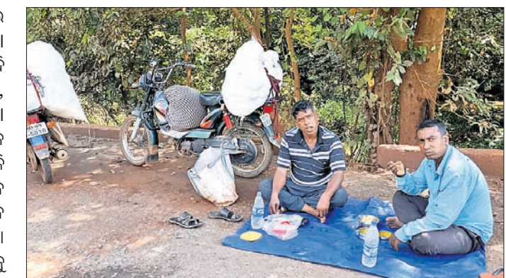
ରାସ୍ତାପାର୍ଶ୍ୱରେ ବୁଲି ବେପାରୀ ଖାଉଛନ୍ତି। ତଙ୍କ ରୋଜଗାର କରିଥାନ୍ତି। ଆଗରୁ ତୁଳା, କପା ସବୁର ଦାମ୍ କମ ଥିଲା। ଏବେ ସବୁ ମହଙ୍ଗା ହୋଇଗଲାଣି। ଏଣୁ ଆଗଭଳି ଲାଭ ହେଉନାହିଁ ବୋଲି ସେମାନେ କୁହନ୍ତି। ସକାଳ ୮ଟାରେ ଘରୁ ଲୁନା ଗାଡିରେ ତୁଳା ଓ ରେଜେକ ପ୍ରସ୍ତୁତ

ସମୟରେ ପରିଶ୍ରମ ଅନୁଯାୟୀ ଲାଭ ମିଳୁନାହିଁ ବୋଲି ସେମାନେ କହିଛନ୍ତି। ଆଜିକାଲି ବିଭିନ୍ନ କମ୍ପାନୀର ଗଦି ବଜାରରେ ମିଳୁଥିଲେ ହେଁ ଏହି ତୁଳା ଗଦି, ରେଜେକ, ଚକିଆ ଆଦିର ଚାହିଦା ରହିଛି। ବିଶେଷ କରି ଗ୍ରାମାଞ୍ଚଳରେ ଅଧିକ ରହିଛି। ବିଭିନ୍ନ କାରଣରୁ କପା, ଶିମିଳି ତୁଳାର ଉତ୍ପାଦନ କମିଯିବାରୁ ଏହାର ସ୍ଥାନ ଆଜିକାଲି ଶସ୍ତା ସଞ୍ଜ ଚୁଲ୍ଲା ବା ନାଇଲନ ଚୁଲ୍ଲା ନେଇଛି। କିନ୍ତୁ କପା, ଶିମିଳି ତୁଳା ଦେହ ପକ୍ଷେ ସ୍ୱାସ୍ଥ୍ୟ କର। ଏଣୁ ଏହାକୁ ବଦଳିଥିବା ମାନେ ଅଧିକ ବ୍ୟବହାର କରୁଛନ୍ତି। ସେମାନେ ବାଲେଶ୍ୱରରୁ ତୁଳା କିଣି ଆଣି ଗାଁ ଗାଁ ବୁଲି ଲୋକଙ୍କ ଆବଶ୍ୟକତା ଅନୁଯାୟୀ କାମ କରିଥାନ୍ତି। ମାସକୁ ପରିଶ୍ରମ କରି ୧୦/୧୨ ହଜାର