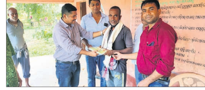
କର୍ମଶାଳାରେ ଜଣେ ଚାଷୀ ପୁରସ୍କାର ଗ୍ରହଣ କରୁଛନ୍ତି।