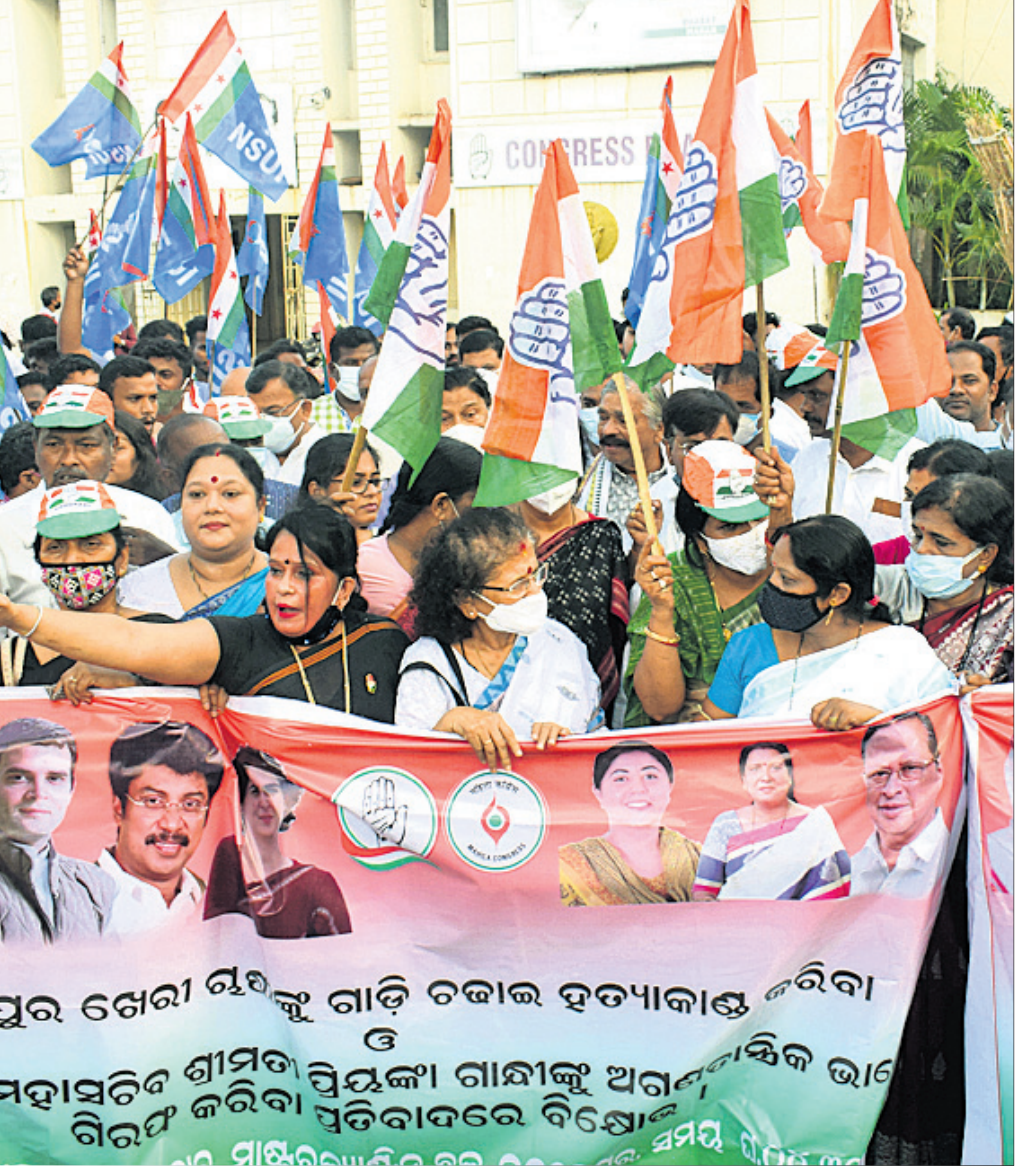
ପ୍ରିୟଙ୍କା ଗାନ୍ଧୀଙ୍କୁ ଭଉରପ୍ରଦେଶରେ ଗିରଫ ପ୍ରତିବାଦରେ ଭୂବନେଶ୍ୱର ମାଷ୍ଟରକ୍ୟାଣ୍ଟିନରେ କଂଗ୍ରେସ ପକ୍ଷରୁ ବିରୋଧ ପ୍ରଦର୍ଶନ ।