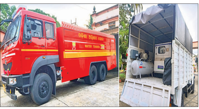
ଅତ୍ୟାଧୁନିକ ଟ୍ୟାଙ୍କର ଓ ପ୍ରାକୃତିକ ଟ୍ୟାଙ୍କର

ହଜାର ଲିଟର ବିଶେଷ ତିନୋଟି ପାଣି ଟ୍ୟାଙ୍କର, ୨ ଡିଜିଲ୍ ଟ୍ୟାଙ୍କର ଗାଡ଼ି ରହିଛି। ପୁଣି ଏଥିରେ ଆଧୁନିକ ହୋଇଛି ଅତ୍ୟାଧୁନିକ ଟ୍ୟାଙ୍କର। ଯାହାର ମୂଲ୍ୟ ୫୦ ଲକ୍ଷ ଟଙ୍କା। ଏଥିସହ ଏକ ପ୍ରାକୃତିକ ଟ୍ୟାଙ୍କର ଗାଡ଼ି। ଏହି ଅତ୍ୟାଧୁନିକ ଟ୍ୟାଙ୍କରଟିର ଲାମ୍ବ ୩୨ ଫୁଟ, ଓଷାଠ ଦାଢ଼େ ୧୦ ଫୁଟ ଏବଂ ଉଚ୍ଚତା ୧୩ ଫୁଟ ରହିଛି। ଯାହା ୧୬ ହଜାର ଲିଟର ପାଣି ରହିବାର କ୍ଷମତା ରହିଛି। ନିର୍ମାଣ କାମ ସମାପ୍ତ ହେବା ପରେ କୌଣସି ଦୋଷ ଖୋଜିବା କି ନକରୁଥିବାର ନିଶ୍ଚିତ ହେବ ବୋଲି ଅଗ୍ନିଶମ ବିଭାଗର ଅଧିକାରୀ କହିଛନ୍ତି।