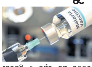
ହେଉଛନ୍ତି ୫ ବର୍ଷରୁ କମ୍ ବୟସର ପିଲା। ପୁଞ୍ଜ୍ୟତଃ ଆଫ୍ରିକା ମହାଦେଶରେ ଏହି ରୋଗ ଦେଖାଦେଇଥାଏ।

କେନେଡା, ୬୧୦ ମ୍ୟାଲେରିଆ ନିରାକରଣ ପାଇଁ ପ୍ରସ୍ତୁତ ପ୍ରଥମ ଟିକାକୁ ବିଶ୍ଵ ସ୍ଵାସ୍ଥ୍ୟ ସଂଗଠନ (ଡବ୍ଲୁଏଚ୍‌ଓ) ରୁଧିରୀ ମଞ୍ଜୁରୀ ପ୍ରଦାନ କରିଛି। ମ୍ୟାଲେରିଆ ବିରୋଧୀ ଲକ୍ଷ୍ମଣପୁର ଏହା ଏକ ଐତିହାସିକ ସଫଳତା ବୋଲି କୁହାଯାଉଛି। ଉକ୍ତ ଟିକା ଲକ୍ଷ ଲକ୍ଷ ଲୋକଙ୍କ ଜୀବନ ବଞ୍ଚାଇବାରେ ସହାୟକ ହୋଇପାରିବ ବୋଲି ଆଶା କରାଯାଉଛି। ସବୁଠୁ ପୁରୁଣା ଏବଂ ମାରାତ୍ମକ ସଂକ୍ରାମକ ରୋଗ ମ୍ୟାଲେରିଆରେ ପ୍ରତିବର୍ଷ ପ୍ରାୟ ୫ ଲକ୍ଷ ଲୋକ ପ୍ରାଣ ହରାଇଥାନ୍ତି। ସେଥିରୁ ୨,୬୦,୦୦୦