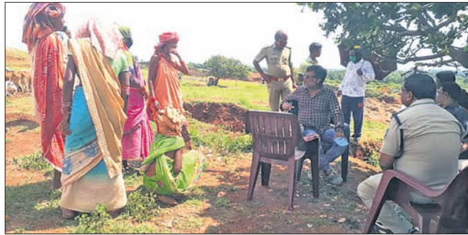
ପଥର କ୍ୱାରିରେ କାମ ଚାଲିଛି।

୨ ଦିନ ଧରି ଲାଗିଥିଲା ଭଡ଼େଜନା ପାପଡ଼ାହାଣ୍ଡି, ୬।୧୦(ଡି.ଏନ୍.ଏ.)