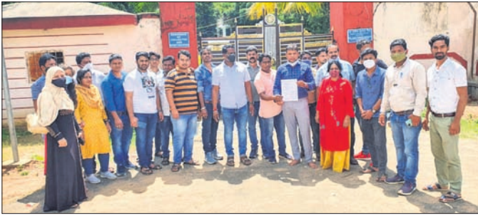
ଦାବି କରାଯାଇଥିବା ଆସିଥିବା କର୍ମଚାରୀମାନେ।

ଡିପିଜି, ସିପିଜି ନିୟୁତ୍ତି ପାଇ କାମ କରୁଛି। ଅକ୍ଟୋବର ୩୧ ପର୍ଯ୍ୟନ୍ତ ସରକାରଙ୍କ ସୁବନ୍ଧିତ ଏମ୍‌ଏସ୍‌ସି ସାମ୍ବନ୍ଧରେ