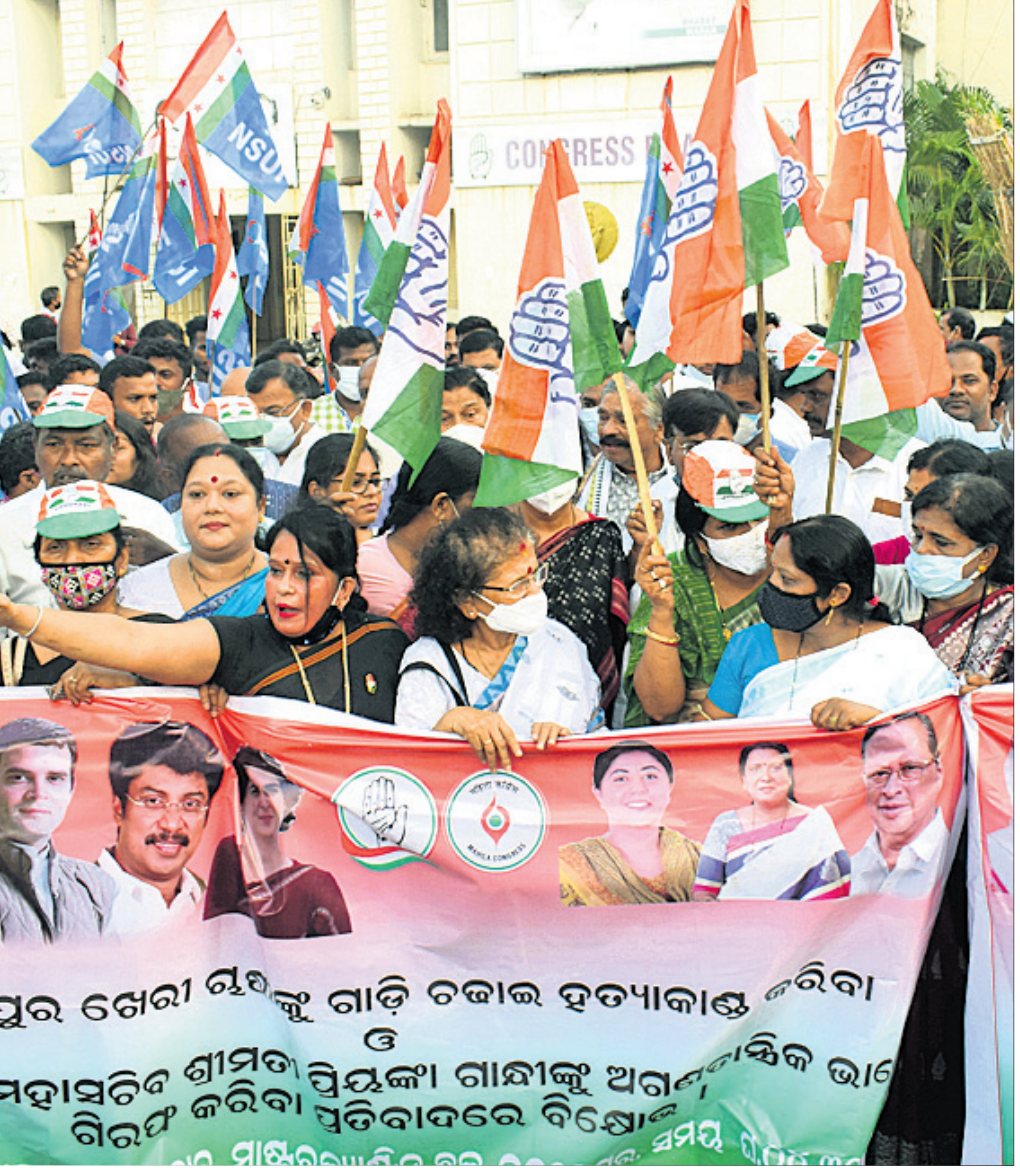
ପ୍ରିୟଙ୍କା ଗାନ୍ଧୀଙ୍କୁ ଉତ୍ତରପ୍ରଦେଶରେ ଗିରଫ ପ୍ରତିବାଦରେ ଭୁବନେଶ୍ୱର ମାଣ୍ଡବିକାଙ୍କୁ ନେଇ କଂଗ୍ରେସ ପକ୍ଷରୁ ବିରୋଧ ପ୍ରଦର୍ଶନ ।