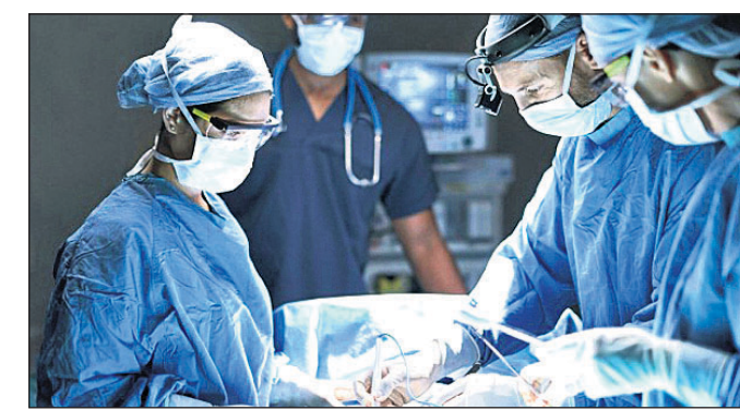
ବିଶ୍ୱରେ କେବଳ ୨ ରୁ ୩ ଟି ଏଭଳି ଘଟଣା ଘଟିଛି । ଯେତେବେଳେ ଜଣକର ହାର୍ଟ ଅକାମୀ ହୋଇଯାଏ ତାଙ୍କୁ ମେଦିନ ଦ୍ୱାରା ସାଧାରଣତଃ ଜୀବିତ ରଖାଯାଇଥାଏ ।

ନୋଏଡ଼ା: କଥାରେ ଅଛି ରଖେ ହରି ମାରେ କିଏ । ଏଭଳି ଏକ ଚମତ୍କାର ଭାବରେ ଘଟିଛି । ହାର୍ଟ (ହୃଦ୍‌ପିଣ୍ଡ) କାମ କରିବା ବନ୍ଦ କରିବାର ୩ ବର୍ଷ ପରେ ପୁଣି ଥରେ ସ୍ୱାଭାବିକ ଭାବେ କାମ କରିବା ଆରମ୍ଭ କରିଛି ।