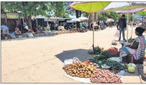
ନୂତନ ବ୍ୟୟାହାର ରାସ୍ତା ପାର୍ଶ୍ୱରେ ବେପାର ଚାଲିଛି।