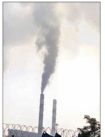
ବେଦାନ୍ତ ଚିମ୍ନିରୁ ବାହାରିଥିବା ପାଇଁ