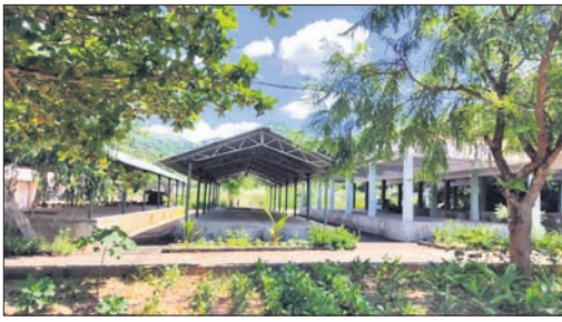
ଅବ୍ୟବହୃତ 'ଆମର ବଜାର'।

ରାୟଗଡ଼ା ଜିଲ୍ଲା ଗୁଣପୁର ପୌରାଞ୍ଚଳରେ ଗ୍ରାଫିକ୍ ବ୍ୟବସାୟ ବିପର୍ଯ୍ୟୟ ହୋଇପଡ଼ିଛି। ବିଶେଷକରି ଉଠା ବ୍ୟବସାୟୀ ଗ୍ରାଫିକ୍ ସମସ୍ୟାର ପୃଷ୍ଠା କାରଣ ସାଜିଛନ୍ତି। ଗୁଣପୁର ନୂତନ ବ୍ୟୟାହାର ଉଭୟ ପାର୍ଶ୍ୱ ରାସ୍ତାକୁ ପରିବା ବ୍ୟବସାୟୀ ଓ ଉଠା ବୋକାଳମାନେ କଦଳା କରିଛନ୍ତି। ଫଳରେ ଗ୍ରାଫିକ୍ ସମସ୍ୟା ବୃଦ୍ଧି ପାଇବା ସହ ଅନେକ ସମୟରେ ଦୁର୍ଦ୍ଦିଗା ଘଟୁଛି। ଅନ୍ୟପକ୍ଷରେ ପରିବା ବ୍ୟବସାୟୀ ଓ ଉଠାବୋକାଳମାନଙ୍କ ପାଇଁ ୨୦୧୯ରେ ୧ କୋଟି ୨୦ ଲକ୍ଷ ଟଙ୍କା ବ୍ୟୟରେ ନିର୍ମାଣ ହୋଇଥିବା ଆମର ବଜାର ଏବେ ଅବ୍ୟବହୃତ ଅବସ୍ଥାରେ ପଡ଼ିରହିଛି। ରାସ୍ତାଘାଟି କିମ୍ବା ବିକାଶ ଯୋଜନା ପାଣ୍ଠିରୁ ରାସ୍ତାଘାଟି କିମ୍ବା ବିକାଶ ଯୋଜନା ପାଣ୍ଠିରୁ ୬୨ଲକ୍ଷ ଟଙ୍କା ଏବଂ ଗୁଣପୁର ନିୟନ୍ତ୍ରଣ ବଜାର କମିଟି(ଆର୍‌ଏମ୍‌ସି) ପକ୍ଷରୁ ୪୮ ଲକ୍ଷ ଟଙ୍କା ବ୍ୟୟରେ ଏହି ବଜାର ହୋଇଥିଲା। ଏଠାରେ ବ୍ୟବସାୟୀମାନେ ବସି ବିକ୍ରି କରିବା ପାଇଁ ଫିକ୍ସି ଏବଂ ବିକ୍ରି କରି ପରିବା ଗଢ଼ିତ ରଖିବା ପାଇଁ ଗୋଦାମ ଗୃହ ନିର୍ମାଣ କରାଯାଇଥିଲା।