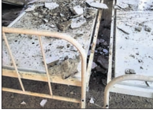
ଛାତ୍ରରୁ ସିମେଣ୍ଟ ଖସି ରୋଗୀଙ୍କ ବେଡ଼ ଉପରେ ପଡ଼ିଛି। ଥିବା କାର୍ଡିଫର ରୋଗୀ ସାମ୍ବଲକେନ୍ଦ୍ର ଚିକିତ୍ସାଳୟ ନେତ୍ରାନ୍ତର ନାୟକଙ୍କୁ ପଚାରିବାରୁ, ଏ ବିଷୟରେ ସିପିଏମ୍‌ଏସ୍ ଅବଗତ କରାଯାଇଥିବା କହିଛନ୍ତି।