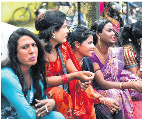
ତୃତୀୟ ଲିଙ୍ଗୀ(କିନ୍ଦର)ମାନେ କୌଣସି କ୍ଷେତ୍ରରେ ଅବହେଳିତ ହେବେ ନାହିଁ।

ତୃତୀୟ ଲିଙ୍ଗୀ(କିନ୍ଦର)ମାନେ କୌଣସି କ୍ଷେତ୍ରରେ ଅବହେଳିତ ହେବେ ନାହିଁ। ସେମାନଙ୍କୁ ଅନ୍ୟମାନଙ୍କଠାରୁ ବାହାରିବାର କରାଯିବ ନାହିଁ। ବିଭିନ୍ନ କ୍ଷେତ୍ରରେ ଅନ୍ୟମାନଙ୍କ ଭଳି କିନ୍ଦରମାନଙ୍କୁ ସମାନ ସୁବିଧାସୁଯୋଗ ଦେବା ଲାଗି ରାଜ୍ୟ ସରକାର ନିଷ୍ପତ୍ତି ନେଇଛନ୍ତି।