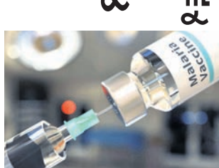
ହେଉଛନ୍ତି ୫ ବର୍ଷରୁ କମ୍ ବୟସର ପିଲା। ପୁଞ୍ଜ୍ୟତଃ ଆଫ୍ରିକା ମହାଦେଶରେ ଏହି ରୋଗ ଦେଖାଦେଇଥାଏ।

ମ୍ୟାଲେରିଆ ନିରାକରଣ ପାଇଁ ପ୍ରସ୍ତୁତ ପ୍ରଥମ ଟିକାକୁ ବିଶ୍ଵ ସ୍ଵାସ୍ଥ୍ୟ ସଂଗଠନ (ଡବ୍ଲୁଏଚ୍‌ଓ) ରୁଧିରୀ ମଞ୍ଜୁରୀ ପ୍ରଦାନ କରିଛି। ମ୍ୟାଲେରିଆ ବିରୋଧୀ ଲକ୍ଷ୍ମପୁରରେ ଏହା ଏକ ଐତିହାସିକ ସଫଳତା ବୋଲି କୁହାଯାଉଛି। ଉକ୍ତ ଟିକା ଲକ୍ଷ ଲକ୍ଷ ଲୋକଙ୍କ ଜୀବନ ବଞ୍ଚାଇବାରେ ସହାୟକ ହୋଇପାରିବ ବୋଲି ଆଶା କରାଯାଉଛି। ସବୁଠୁ ପୁରୁଣା ଏବଂ ମାରାତ୍ମକ ସଂକ୍ରାମକ ରୋଗ ମ୍ୟାଲେରିଆରେ ପ୍ରତିବର୍ଷ ପ୍ରାୟ ୫ ଲକ୍ଷ ଲୋକ ପ୍ରାଣ ହରାଇଥାନ୍ତି। ସେଥିରୁ ୨,୬୦,୦୦୦