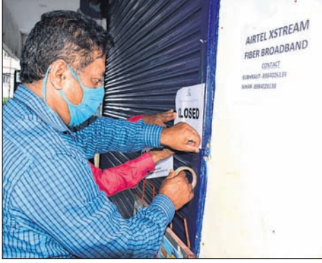
କଣ୍ଠେନ୍‌ମେଣ୍ଟ ଘୋଷଣା ହୋଇଥିବା ରାଜେନ୍ଦ୍ର ବିହାର ଆପାର୍ଟମେଣ୍ଟ ଓ ଏକ ଦୋକାନରେ ବିଏମ୍‌ସି ଅଧିକାରୀ ନୋଟିସ୍ ଲଗାଉଛନ୍ତି।

ପୁଲବାଣୀ ଅପିସ୍/ବାଲିଗୁଡ଼ା (ଡି.ଏନ୍.ଏ), ୨୧୧୦