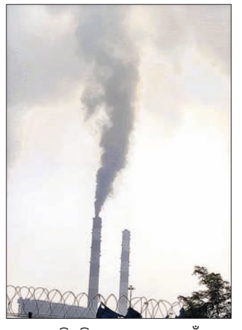
ବେଦାନ୍ତ ଚିମ୍ନିରୁ ବାହାରିଥିବା ପାଞ୍ଚଶ।

ଝାରସୁଗୁଡ଼ା ଜୁର୍ନାଲିଷ୍ଟ୍ରୀ ବେଦାନ୍ତ ପ୍ରକଳ୍ପରୁ ମଙ୍ଗଳବାର ରାତିରେ ପାଞ୍ଚଶ ଉଡ଼ି ଆଖପାଖ ଅଞ୍ଚଳରେ ଆହୁରିତ ହୋଇପଡିଥିଲା। ବୁଧବାର ସକାଳୁ ଉତ୍ତରା ପାଞ୍ଚଶ ଲୋକଙ୍କ ବାସଗୃହ, ଚାଷଜମି, ରାସ୍ତାଘାଟରେ ପଡିଥିବା ଦେଖିବାକୁ ମିଳିଥିଲା। ପାଞ୍ଚଶ ବାୟୁମଣ୍ଡଳରେ ଉଡିବା ଫଳରେ ଲୋକଙ୍କ ମନରେ କୁହୁଡିର ଭ୍ରମ ସୃଷ୍ଟି କରିଥିଲା। ଏହା ଉଡ଼ି ଲୋକଙ୍କ ଆଖି, କାନ ଓ ନାକରେ ପଶୁଥିବାରୁ ଯାତାୟାତ ବାଧାପ୍ରାପ୍ତ ହୋଇଥିଲା। ଏଥିରେ ଘରର ଆସବାପତ୍ର, ପରିପରିବା ଚାଷ, ଧାନ ଫସଲ ପ୍ରଭାବିତ ହୋଇଥିବାରୁ ଲୋକେ ଆତଙ୍କିତ ଅବସ୍ଥାରେ ରହିଛନ୍ତି। ପୂର୍ବରୁ ଅନେକଥର ବେଦାନ୍ତ ପ୍ରକଳ୍ପରୁ ପାଞ୍ଚଶ ଉଡି ଅଞ୍ଚଳ ପ୍ରଭାବିତ ହୋଇଥିବା ଝାରସୁଗୁଡ଼ାର ସାମାଜିକ କର୍ମୀ ବେଦାନ୍ତ ବାରିକ ଅଭିଯୋଗ