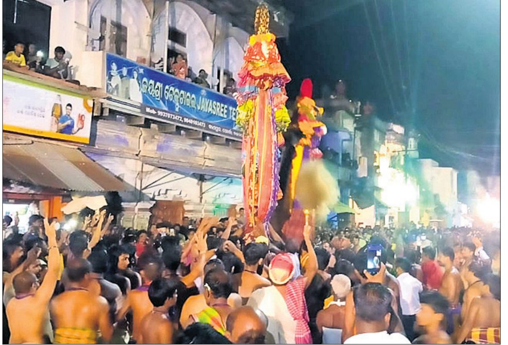
ବାଣପୁର ବଜାରରେ ମା' ଭଗବତୀ ଓ ମା' ବିରଜାଲକ୍ଷ୍ମୀ ଭେଟ ଯାତ୍ରା ଉତ୍ସବ ପାଳନ ହେଉଛି।