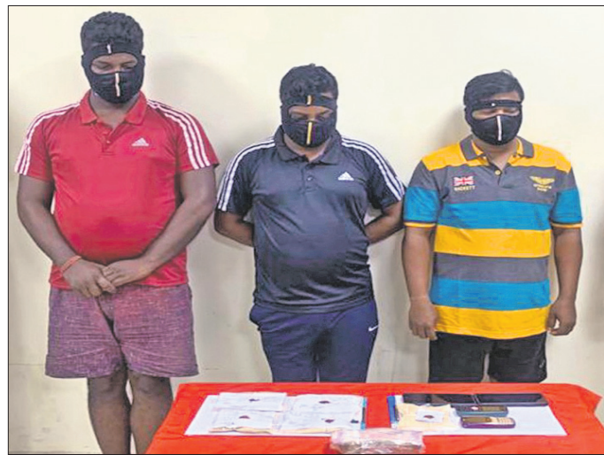
ଗିରଫ ୩ ଅଭିଯୁକ୍ତ। ଜବତ ବ୍ରାଉନସୁଗାର, ମୋବାଇଲ୍ ଓ ଟଙ୍କା।

ଚଳିତବର୍ଷ କଟକ ସହରାଞ୍ଚଳ ପୋଲିସ ମୋଟ ୪ କିଲୋ ୬୪୬ ଗ୍ରାମ ବ୍ରାଉନସୁଗାର ଜବତ କରିଛି। ଏହାର ଆନୁମାନିକ ମୂଲ୍ୟ ୪ କୋଟି ୬୪ ଲକ୍ଷ ଟଙ୍କା ହେବ।