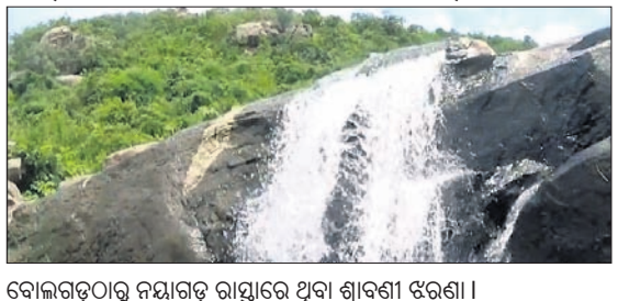
ବୋଲପଡ଼ଠାରୁ ନୟାଗଡ଼ ରାସ୍ତାରେ ଥିବା ଶ୍ରାବଣୀ ଝରଣା।

କିଛି ମିଟିରି ଶବ୍ଦ ସାଙ୍ଗକୁ ଝର ଝର ହୋଇ ପାହାଡ଼ ପାରଦେଶକୁ ବୋହି ଯାଉଥିବା ଝରଣାର ପାଣି ପର୍ଯ୍ୟଟକଙ୍କୁ ବିମୋହିତ କରିଥାଏ। ଖୋର୍ଦ୍ଧା-କଲକାଟି ୫୭ନଂ ଜାତୀୟ ରାଜପଥ ବୋଲପଡ଼ଠାରୁ ନୟାଗଡ଼ ରାସ୍ତା ବିଜୁପୁର ରେଳଠାରୁ ବାମ ପଟକୁ ୨କି.ମି. ପରେ ପଡ଼େ କାଉଡ଼ରା ଉଚ୍ଚ ବିଦ୍ୟାଳୟ। ଏହି ବିଦ୍ୟାଳୟରୁ ଅଳ୍ପଦୂରରେ ଥିବା ପାହାଡ଼ ଉପରୁ ଏହି ଝରଣା ବୋହିଯାଇଛି। ଉଚ୍ଚ ଝରଣାକୁ ସ୍ଥାନୀୟ ଲୋକେ ଶ୍ରାବଣୀ ଝରଣା ବୋଲି କହିଥାନ୍ତି। ଅଳ୍ପଦୂରରେ ଥିବା ପାହାଡ଼ ଚାରିପଟେ ରହିଥିବା ଘାଟ ଲଙ୍ଗା, ପକ୍ଷୀଙ୍କ ହୋଇ ଯାଇଥିବା ରାସ୍ତା ବେଳ