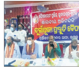
ପୁଲକଣା, ୭୧୦ (ଡି.ଏନ.ଏ.)