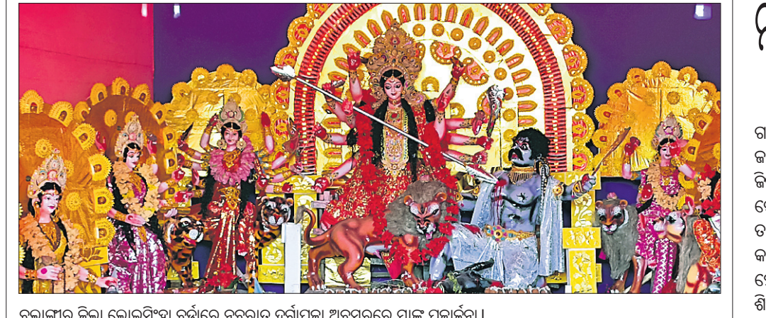
ବଲାଙ୍ଗୀର ଜିଲ୍ଲା ଲୋକସିଂହା ବୃତ୍ତରେ ନବରାତ୍ର ବୃତ୍ତାପୂଜା ଅବସରରେ ମାଙ୍କ ପୂଜାର୍ଚ୍ଚନା।

ନୂଆପଡ଼ା ଅର୍ଦ୍ଧସା, ୭୧୦: ନୂଆପଡ଼ା ଜିଲ୍ଲା ସିନାପାଲି ଅବକାରୀ ବିଭାଗ କର୍ମଚାରୀ ଗୁରୁତର ୧୫୦ ବୋତଲ କମ୍ପ କମ୍ପ ସିରପ୍ ଜବତ କରି ଜଣେ କୋରେକ୍ଟ ବ୍ୟାପାରୀଙ୍କୁ ଗିରଫ କରିଛନ୍ତି। ଗିରଫ କରାଯାଇଥିବା କମ୍ପ କୋମ୍ପାନୀ ଗାଡ଼ାକୃଷ୍ଣ ସରାଫ। ସକାଳୁ ସିନାପାଲି ଅବକାରୀ ବିଭାଗ କର୍ମଚାରୀମାନେ ପାଟ୍ରେଲିଂ କରୁଥିବା ବେଳେ ଖତିଆଳ-ବୋତେନ ରାସ୍ତା ପଲସଦା ଗାଁ ଛକ ନିକଟରେ ଗାଡ଼ାକୃଷ୍ଣ ସରାଫର ଛିଡା ହୋଇଥିବା ବେଳେ ତାଙ୍କୁ ସନ୍ଦେହ କରି ପରବରାନ୍ତର କରିଥିଲେ। ବସ୍ତା ଖୋଲି ଦେଖିବାକୁ ଭିତରୁ ୧୫୦ଟି ବୋତଲ କମ୍ପ ସିରପ୍ ବାହାରିଥିଲା। ଏ ସଂସ୍କୃତିରେ ଏକ ମାମଲା ରୁଜୁ କରି ଯୁବକଙ୍କୁ ଗିରଫ କରି କୋର୍ଟ ଚାଲିଯାଇଛି।