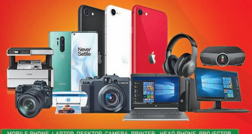
MOBILE PHONE, LAPTOP, DESKTOP, CAMERA, PRINTER, HEAD PHONE, PROJECTOR

OPENING ON 10 th OCTOBER GUPTA FURNITURE PLAZA NAYAGARH Near Fire Station, Khandapada Road Mob: 7008989306