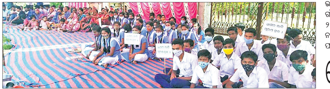
ବିଦ୍ୟାଳୟ ସମ୍ମୁଖରେ ଧାରଣାରେ ଛାତ୍ରାଛାତ୍ର, ଅଭିଭାବକ।