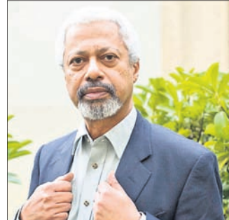
ଅବଦୁଲ ରଜାକ ଗୁରନାହ

ତାଜାନିଆ ଔପନ୍ୟାସିକ ଅବଦୁଲ ରଜାକ ଗୁରନାହ ଚଳିତ ବର୍ଷ ଲାଗି ସାହିତ୍ୟରେ ନୋବେଲ ପୁରସ୍କାର ପାଇବାକୁ ଯାଉଛନ୍ତି। ଉପନିବେଶବାଦର ପ୍ରଭାବ ଏବଂ ସଂସ୍କୃତି ଓ ମହାଦେଶଗୁଡ଼ିକ ମଧ୍ୟରେ ଶରଣାର୍ଥୀଙ୍କ ଭାଗ୍ୟକୁ ନେଇ ତାଙ୍କର ସାହିତ୍ୟିକତା ଉପରେ ସହାୟତା ଲେଖନୀ ତାଙ୍କ ନାମ ନିମନ୍ତେ ତାଙ୍କୁ ଏହି ସର୍ବୋଚ୍ଚ ପୁରସ୍କାର ଲାଗି ମନୋନୀତ କରାଯାଇଛି। ୧୯୪୮ରେ ଜାତୀୟତାରେ ଜନ୍ମିତ ଅବଦୁଲରଜାକ ୬୦ ବର୍ଷକ ଶେଷ ଭାଗରେ ଜଣେ ଶରଣାର୍ଥୀ ଭାବେ ଜର୍ମାନୀରେ ରାଜିନିଆସିଥିଲେ। କେନ୍ଦ୍ର ବିଶ୍ୱବିଦ୍ୟାଳୟରେ ସେ ଜଣେ ପ୍ରଫେସର