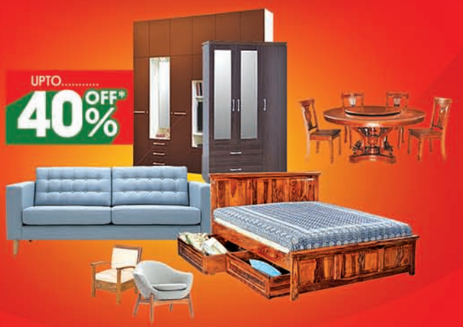
Furniture Available at (CDA) CUTTACK, KALAPATHAR, JAGATSingHPUR, NIMAPADA, NAYAGARH, BALUGAON, JAJPUR TOWN, ANGUL & CHANDIKHOLE