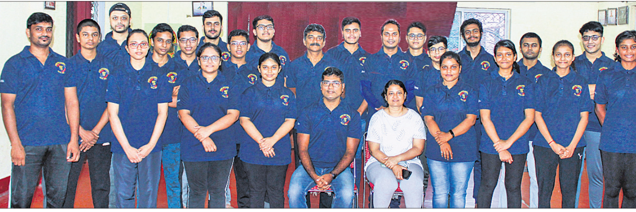
ସର୍ବଭାରତୀୟ ଡି.ଭି. ମାଇକ୍ରୋ ଷ୍ଟାଗ୍ ଚାମ୍ପିୟନଶିପ୍ ପାଇଁ ମନୋନୀତ ଓଡ଼ିଶା ଦଳ କର୍ମଚାରୀଙ୍କ ଗହଣରେ।