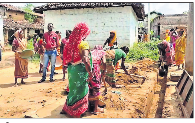
ଦେଓଗାଁ ବ୍ଲକ ବନ୍ଧୁପାଲିରେ ମହିଳା ଗୋଷ୍ଠୀ ଭେଦ ସଫେଇ କରୁଛନ୍ତି।