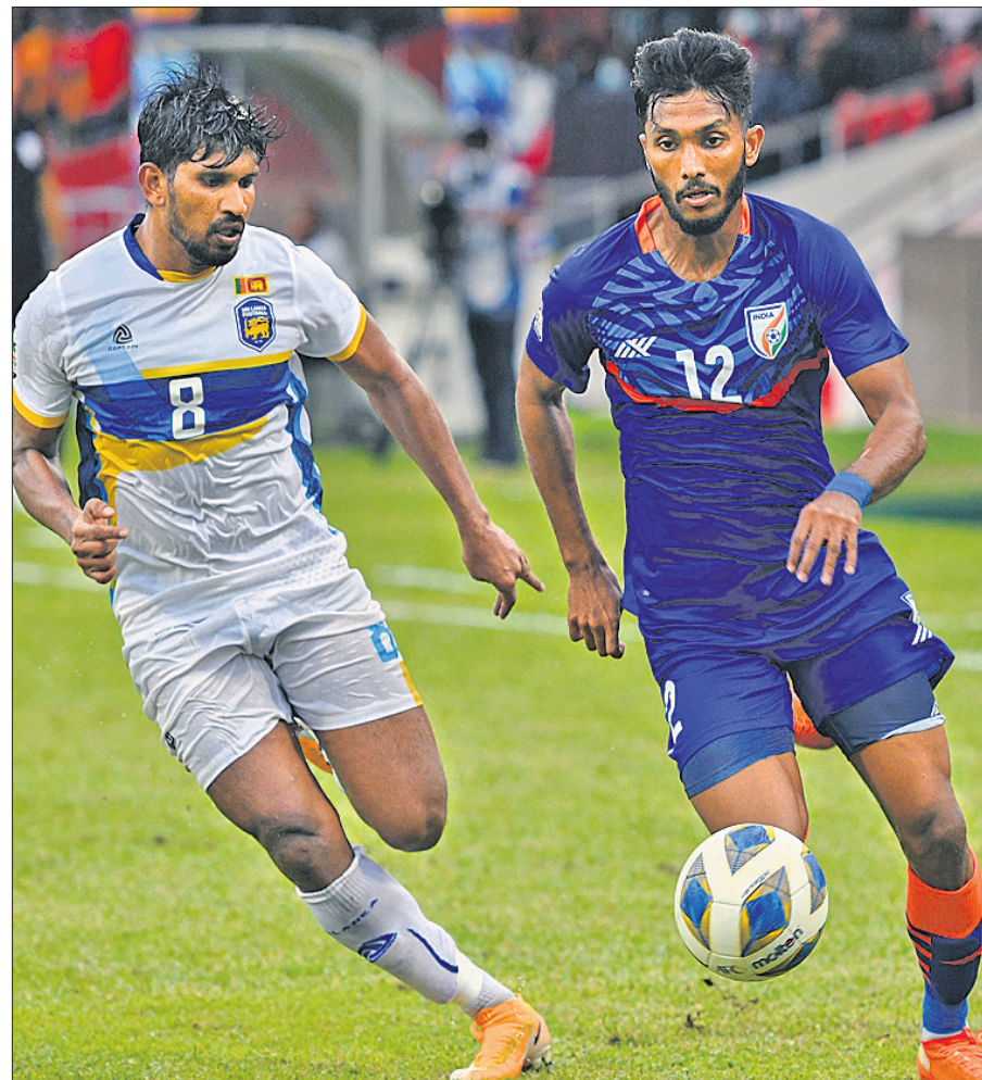
ସାମୁ ପୁଟ୍ଟବଲ ଚାମ୍ପିୟନଶିପ୍ରେ ଚୁରୁବାର ଭାରତ ଓ ଶ୍ରୀଲଙ୍କା ମଧ୍ୟରେ ଅନୁଷ୍ଠିତ ମ୍ୟାଚ।