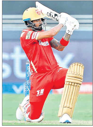
ମ୍ୟାଚ ଅର୍ଦ୍ଧ ଦି ମ୍ୟାଚ ଲୋକେଶ ରାହୁଲ।

ଦୁଇ-ଅର୍ଦ୍ଧ ଖେଳିବା ପୂର୍ବରୁ ମହେନ୍ଦ୍ର ସିଂ ଧୋନୀଙ୍କ ଚେନାଲ ସୁପର କିକ୍ସ୍ ଜବରଦସ୍ତ ଝଟକା ଲାଗିଛି। ଗୁରୁବାର ଖେଳାୟୀଙ୍କୁ ପ୍ରଥମ ମ୍ୟାଚରେ ଲୋକେଶ ରାହୁଲଙ୍କ ନେତୃତ୍ୱାଧୀନ ପଞ୍ଜାବ କିକ୍ସ୍ ଅତି ସହଜରେ ୭ ଓଭର ବାକି ଆଇ ୬ ଭଲକେଟରେ ଚେନାଲକୁ ହରାଇଛି। ଉଭୟ ଦଳ ପାଇଁ ଏହି ମୁକାବିଲା ଅତିମ ଲିଭି ମ୍ୟାଚ ଥିଲା। ଏଥିସହ ଚେନାଲ କ୍ରମାଗତ ତୃତୀୟ ପରାଜୟ ବରଣ କରିଛି। ୧୪ ମ୍ୟାଚ ଖେଳି ଚେନାଲ ୯ ବିଜୟ ଓ ୫ ପରାଜୟ ସହ ୧୮ ପଏଣ୍ଟ ହାସଲ କରି ତାଲିକାର ବିତ୍ୟାୟ ଘାତନକା ସୃଷ୍ଟି କରିଛି। ଅନ୍ୟପଟେ ପଞ୍ଜାବ କିକ୍ସ୍ ସବୁ ୧୪ ମ୍ୟାଚ ଖେଳି ୬ ବିଜୟ, ୮ ପରାଜୟ ସହ ୧୨ ପଏଣ୍ଟ ହାସଲ କରି ପ୍ରଥମ ସ୍ଥାନରେ ରହିଛି। ପୂର୍ବରୁ ପଞ୍ଜାବ ଦଳ-ଅର୍ଦ୍ଧ ଚେନାଲକୁ ପରାସ୍ତ କରିଥିଲା। ତେଣୁ ଏହି ବିଜୟ ପଞ୍ଜାବ ପାଇଁ ଯେତେବେଳେ ଗୁରୁତ୍ୱ ବହନ କରୁନାହିଁ। ତେବେ ବିଜୟ ସହ ପଞ୍ଜାବ ଚଳିତ ଆଇପିଏଲରେ ଅଭିଯାନ ଶେଷ କରିଛି।