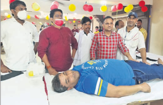
ଶିବିରରେ ଜଣେ ଯୁବକ ରକ୍ତଦାନ କରୁଛନ୍ତି।