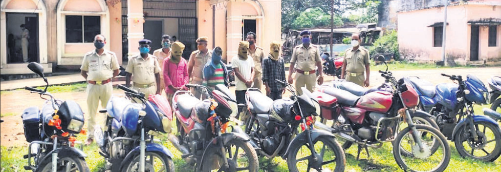
ରିମଫ ୪ ଲୁଚେରା ଓ ଜବତ ୧୨ ବାଇକ୍ ।