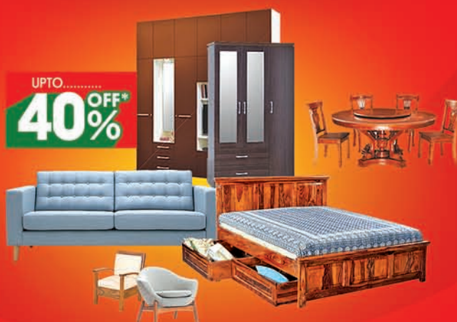
Furniture Available at (CDA) CUTTACK, KALAPATHAR, JAGATSINGHPUR, NIMAPADA, NAYAGARH, BALUGAON, JAJPUR TOWN, ANGUL & CHANDIKHOLE