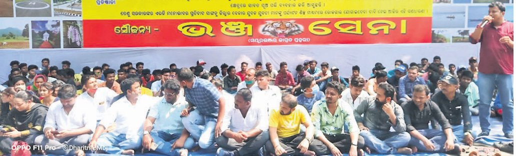
ଜିଲାପାଳଙ୍କ କାର୍ଯ୍ୟାଳୟ ଆଗରେ ଧାରଣାରେ ବସିଥିବା ଭଞ୍ଜସେନା କର୍ମକର୍ତ୍ତା।