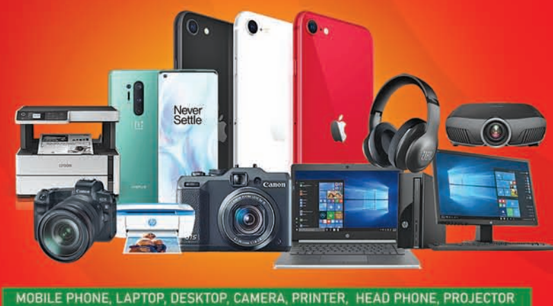
MOBILE PHONE, LAPTOP, DESKTOP, CAMERA, PRINTER, HEAD PHONE, PROJECTOR

OPENING ON 10 th OCTOBER GUPTA FURNITURE PLAZA NAYAGARH Near Fire Station, Khandapada Road Mob: 7008989306