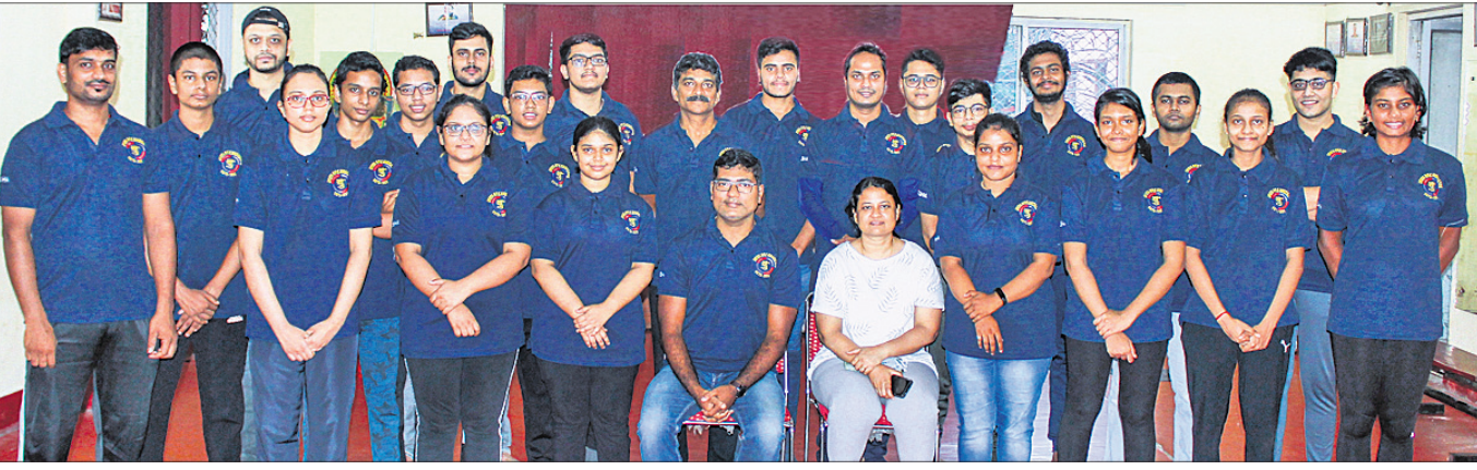
ସର୍ବଭାରତୀୟ ଡି.ଭି. ମାଲକ୍ରୋପୋର୍ନ୍ ଚାମ୍ପିୟନଶିପ୍ ପାଇଁ ମନୋନୀତ ଓଡ଼ିଶା ଦଳ କର୍ମଚାରୀଙ୍କ ଗହଣରେ ।