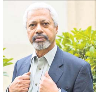
ଅବଦୁଲ ରକାବ ଗୁରନାହ

ତାଜାନିଆ ଔପନ୍ୟାସିକ ଅବଦୁଲ ରକାବ ଗୁରନାହ ଚଳିତ ବର୍ଷ ଲାଗି ସାହିତ୍ୟରେ ନୋବେଲ ପୁରସ୍କାର ପାଇବାକୁ ଯାଉଛନ୍ତି। ଉପନିବେଶବାଦର ପ୍ରଭାବ ଏବଂ ସଂସ୍କୃତି ଓ ମହାଦେଶଗୁଡ଼ିକ ମଧ୍ୟରେ ଶରଣାର୍ଥୀଙ୍କ ଭାଗ୍ୟକୁ ନେଇ ତାଙ୍କର ସାହିତ୍ୟିକ ସୃଜନ ତଥା ସହାୟତାଗ୍ରାହୀ ଲେଖନୀ ଚାକନା ନିମନ୍ତେ ତାଙ୍କୁ ଏହି ସର୍ବୋଚ୍ଚ ପୁରସ୍କାର ଲାଗି ମନୋନୀତ କରାଯାଇଛି। ୧୯୪୮ରେ ଜାତୀୟତାରେ ଜନ୍ମିତ ଅବଦୁଲରକାବ ୬୦ ବର୍ଷକ ଶେଷ ଭାଗରେ ଜଣେ ଶରଣାର୍ଥୀ ଭାବେ ଜର୍ମାନୀରେ ରାଜିଆସିଥିଲେ। କେନ୍ଦ୍ର ବିଶ୍ୱବିଦ୍ୟାଳୟରେ ସେ ଜଣେ ପ୍ରଫେସର