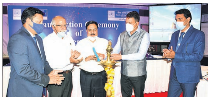
ଭୁବନେଶ୍ୱର, ୭ ଅକ୍ଟୋବର, ୨୦୨୧

ବ୍ୟାଙ୍କ ଅର୍ଥ ମହାରାଷ୍ଟ୍ରର ଜୋନାଲ କାର୍ଯ୍ୟାଳୟ ଓଡ଼ିଶାରେ ଆରମ୍ଭ ହୋଇଛି। ଗ୍ରାହକଙ୍କ ସୁବିଧା ବୃଦ୍ଧି ଆବଶ୍ୟକତା ପୂରଣ ଦିଗରେ ଏହା ଯୋଗଦାନ ରଖିବ।