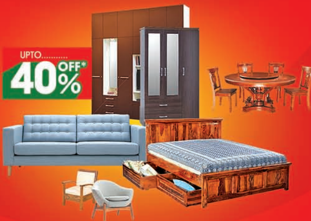
Furniture Available at (CDA) CUTTACK, KALAPATHAR, JAGATSINGHPUR, NIMAPADA, NAYAGARH, BALUGAON, JAJPUR TOWN, ANGUL & CHANDIKHOLE