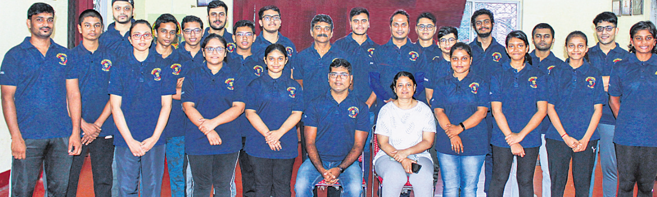
ସର୍ବଭାରତୀୟ ଡି.ଜି. ମାଇକ୍ରୋ ଷ୍ଟର୍ ଚାମ୍ପିୟନଶିପ୍ ପାଇଁ ମନୋନୀତ ଓଡ଼ିଶା ଦଳ କର୍ମଚାରୀ ଗଣସମାଜ।

ଅଧିକାଂଶ ଜଣଙ୍କର ପାନୀୟ ପ୍ରାଥମିକ ଚୟନ ହେଉଛି ଡିଜିଟାଲ ପ୍ୟାକେଜିଂଡ୍ ଡ୍ରାଣ୍ଟିଂ ଓ ଅନ୍ୟାନ୍ୟ ପ୍ୟାକେଜିଂଡ୍ ଡ୍ରାଣ୍ଟିଂ ପାନୀୟ ଉପରେ।