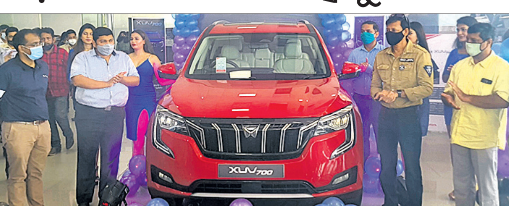
ଭୁବନେଶ୍ୱର, ୭ ଅକ୍ଟୋବର, ୨୦୨୧

ଆଜ୍ଞା ମହିନ୍ଦ୍ରା ଆର୍ଭିଏସ୍‌ଏଫ୍ ବିକ୍ରୟ ଆଜ୍ଞା ମହିନ୍ଦ୍ରା ଲିମିଟେଡ୍ ପକ୍ଷରୁ ଏକ୍ସୟୁଭି ୭୦୦ ମଡେଲ ପ୍ରଚାରଣ କାର୍ଯ୍ୟକ୍ରମରେ ପ୍ରବେଶ କରିଛି।