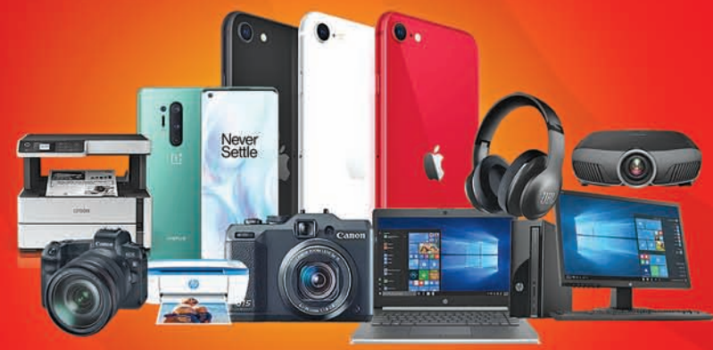
MOBILE PHONE, LAPTOP, DESKTOP, CAMERA, PRINTER, HEAD PHONE, PROJECTOR

OPENING ON 10 th OCTOBER GUPTA FURNITURE PLAZA NAYAGARH Near Fire Station, Khandapada Road Mob: 7008989306