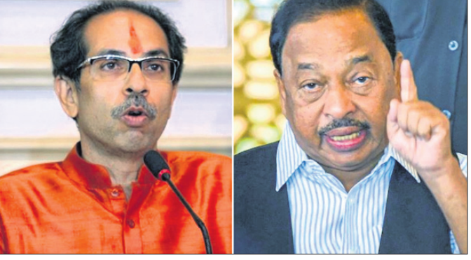
ଉତ୍ତର ଓ ରାଣେ

କହି ରାଣେ ସମାଲୋଚନା କରିବା ସହ ସେ ସେଠାରେ ଉପସ୍ଥିତ ଥିଲେ ତାପୁତା ମାରିଆଡ଼େ ବୋଲି କହିଥିଲେ। ଏଭଳି ମନ୍ତବ୍ୟ ପାଇଁ ମହାରାଷ୍ଟ୍ର ପୋଲିସ୍ ତାଙ୍କୁ ଗିରଫ କରିଥିଲା। ଏହା ପରେ ବୁଲ୍ ନେତା ପରସ୍ପରକୁ ସମାଲୋଚନା କରିବା ସହ ଗୋଟିଏ ଖୋଳା ଖୋଲିଥିଲେ। ଶିବସେନାକୁ ରାଣେ ହାସଲିୟତା ପ୍ରାୟ ୧୬ ବର୍ଷ ହୋଇଛି। ମୁଖ୍ୟମନ୍ତ୍ରୀ ଉତ୍ତର ଓ ରାଣେଙ୍କୁ ଦେଶ ସାଧନ ହୋଇଥିବା ବର୍ଷ ଜଣାନ୍ତୁ।