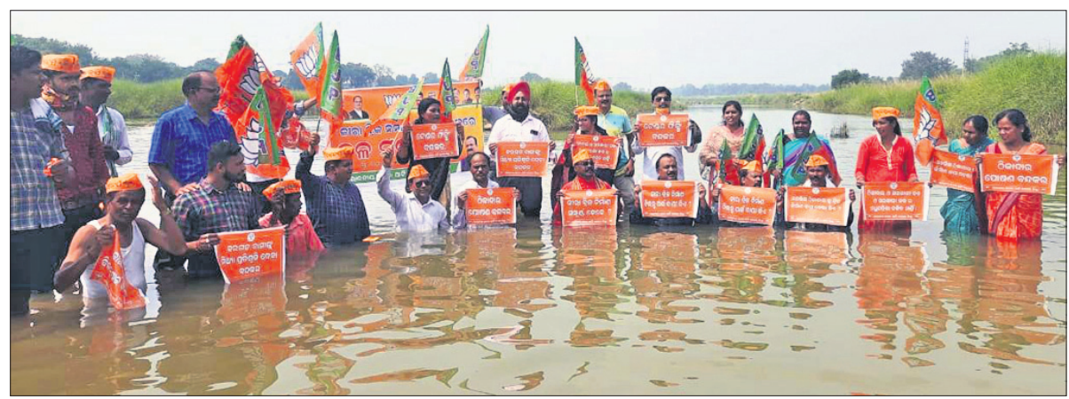
ଜିରା ନଦୀରେ ଭାଜପାର ଜଳ ସତ୍ୟାଗ୍ରହ।