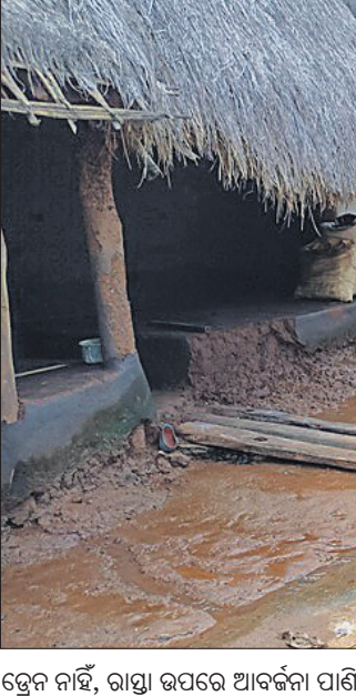
ଡ୍ରେନ ନାହିଁ, ରାସ୍ତା ଉପରେ ଆବର୍ଜନା ପାଣିର ସୁଅ।

ଆବର୍ଜନା ସୂଚକ କରିବା, କୂଅ, ନଳକୂଅ ପାଖରେ ପାଣି ନ ଜମିବାର ବ୍ୟବସ୍ଥା ରହିଛି। କିନ୍ତୁ କାସ୍ତ୍ରାପଲ୍ଲୀ, ପାରାଡିପ ଓ ଜାକେଡ଼ା ପଞ୍ଚାୟତର ଆଦିବାସୀ ବହୁ ଗ୍ରାମରେ ଏହି ଯୋଜନା ସମ୍ପୂର୍ଣ୍ଣ ବାଟବନ୍ଧା ହେଉଛି। କେତେକ ପଞ୍ଚାୟତରେ ଅଳ୍ପ କିଛି କାମ କରାଯାଇ କାଗଜ କଳମରେ ସରକାରୀ ଅନୁଦାନକୁ କରାଯାଉଥିବା ଅଭିଯୋଗ ହେଉଛି। କାସ୍ତ୍ରାପଲ୍ଲୀ ପଞ୍ଚାୟତର ପୋକପୁଞ୍ଜା, ଗୋହରିବାସୁ, ଚତୁକମରା, ଗୁଣ୍ଡୁରାସାହି ଆଦି ଗ୍ରାମରେ