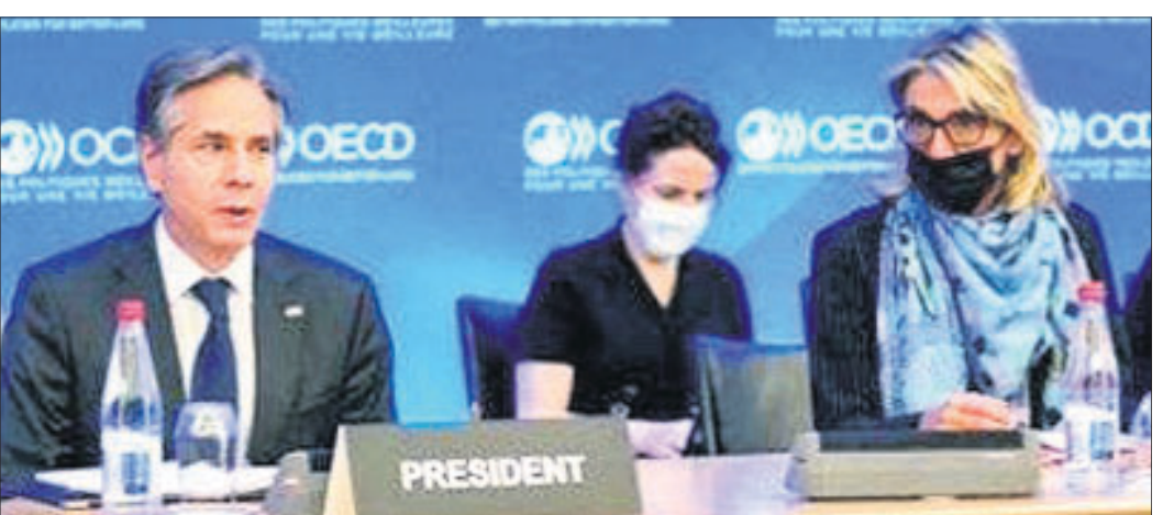
ଓଇସିଡିର ବୈଠକରେ ଉପସ୍ଥିତ ବିଭିନ୍ନ ଦେଶର ପ୍ରତିନିଧିମାନେ ।

ଅନ୍ତର୍ଜାତୀୟସ୍ତରରେ ଟିକସ ପ୍ରଦାନ ଉପରେ ଅର୍ଥନୈତିକ ସହଯୋଗ ଓ ବିକାଶ ସଙ୍ଗଠନ (ଓଇସିଡି)ର ଏକ ବୈଠକରେ କେତେକ ସଂସ୍କାରକୁ ଅନୁମୋଦନ ମିଳିଛି ।