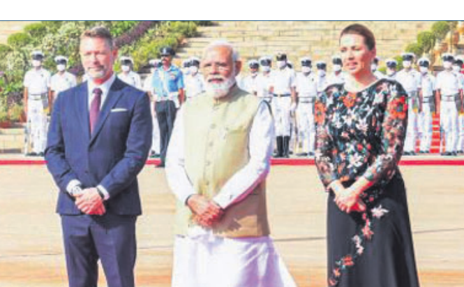
ରାଷ୍ଟ୍ରପତି ଭବନ ପରିସରରେ ପ୍ରଧାନମନ୍ତ୍ରୀ ନରେନ୍ଦ୍ର ମୋଦିଙ୍କ ସହ ଡେନ୍‌ମାର୍କ ପ୍ରତିପକ୍ଷ ମେଡେଟ୍‌ରେ ଡେନିସ୍‌ସେନ ଓ ତାଙ୍କ ସାଥୀ ।

ପୁରୁଷା ସହଯୋଗ ବଢ଼ାଇବା ଲାଗି ଭାରତ ଓ ଡେନ୍‌ମାର୍କ ଶନିବାର ରାତି ହୋଇଛନ୍ତି । ସବୁଜ ପ୍ରଯୁକ୍ତି ଏବଂ ଭୂତଳ ଜଳ ଭଳି ପ୍ରାକୃତିକ ସମ୍ପଦ ପରିଚାଳନାରେ ସହଯୋଗ ବଢ଼ାଇବା ଲକ୍ଷ୍ୟରେ ଦୁଇ ଦେଶ ମଧ୍ୟରେ ୪ଟି ଚୁକ୍ତିନାମାପତ୍ର (ଏମ୍‌ଓୟୁ) ସ୍ୱାକ୍ଷର ହୋଇଛି ।