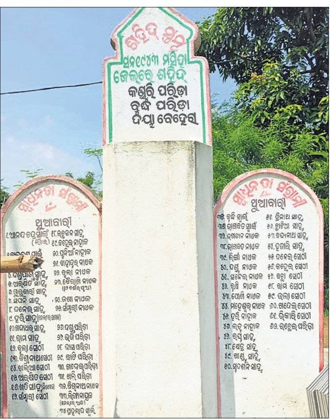
ଥୁଆବାରୀରେ ଗ୍ରାମବାସୀଙ୍କ ଖର୍ଚ୍ଚରେ ନିର୍ମିତ ଶହୀଦ ସ୍ତମ୍ଭ। ଥୁଆବାରୀ ଗ୍ରାମବାସୀ ସେହି ଶହୀଦଙ୍କୁ ସ୍ମରଣ କରନ୍ତି। ତାଙ୍କ ପ୍ରତି ଶ୍ରଦ୍ଧାଧୁନି ମଣ୍ଡଳରେ ଭାଗ ନେଇଥିବାରୁ ଗର୍ବ ଅର୍ପଣ କରିଛି। ଗ୍ରାମର ୫୮ଜଣ ପ୍ରଜା ମଣ୍ଡଳରେ ଭାଗ ନେଇଥିବାରୁ ଗର୍ବ ଅର୍ପଣ କରିଛି।