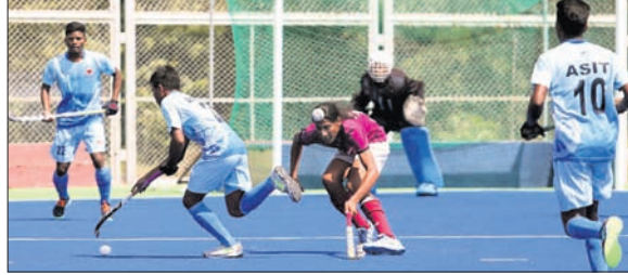
ରବିବାର ଅନୁଷ୍ଠିତ କ୍ୱାର୍ଟର ଫାଇନାଲ ମ୍ୟାଚ।

ଓଡ଼ିଶା ନାଭାଲ ଗାଟା ହକି ହାଇ ପରଫରମାନ୍ସ ସେଣ୍ଟର (ଓଡ଼ିଶା ଏସ୍‌ପିସି) କାଚାୟ ସର୍ବକ୍ରମିୟର ପୁରୁଷ ଏକାଡେମୀ ହକି ଚାମ୍ପିୟନଶିପର ସେମିଫାଇନାଲରେ ପ୍ରବେଶ କରିଛି। ରାଜସ୍ଥାନୀୟ ପଞ୍ଜାବ ହକି କ୍ଲବ୍ ଏକାଡେମୀ, ଏଓଜିପିସି ହକି ଏକାଡେମୀ ଓ ମଧ୍ୟସେମି ପ୍ରବେଶ କରିଛନ୍ତି। ରବିବାର ଅନୁଷ୍ଠିତ କ୍ୱାର୍ଟର ଫାଇନାଲରେ ଓଡ଼ିଶା ଏସ୍‌ପିସି ୧୦-୦ ଗୋଲରେ ଭାଡିପତି ରାଜା ହକି ଏକାଡେମୀକୁ ହରାଇ ଦେଇଛି। ବିଜୟୀ ଦଳ ପକ୍ଷରୁ ପ୍ରେମୟାଲ