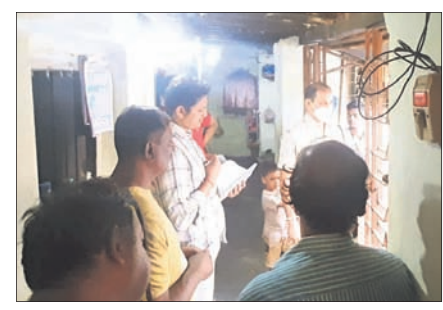
ପୋଲିସ ଘଟଣାସ୍ଥଳରେ ତଦନ୍ତ କରୁଛି।