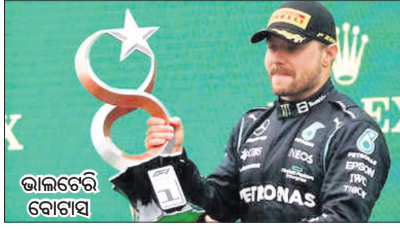
ବୁତତମ ବିବେଚିତ ହୋଇଥିଲେ ବିପରେ ଗାୟଲି ମଧ୍ୟ ଲକ୍ଷ୍ମୀ ନିୟମ ଉଲ୍ଲଂଘନ କରିଥିବାକୁ ତାଙ୍କୁ ୧୦ ସ୍ଥାନ ପୋନାଲ୍ଟି ହୋଇଥିଲା। ଫଳରେ ରବିବାର ରେସ୍ରେ ଗ୍ରାଉଁସ୍ ୧୧ତମ ସ୍ଥାନକୁ ଏବଂ ବିତାୟ ଗ୍ଲାନରେ ରହିଥିବା ବୋଟାସ ଗ୍ରାଉଁସ୍-୧ର ରେସ୍ ଆରମ୍ଭ କରିଥିଲେ। (ଆଲିଫା ଚାଉରି), ଲାଣ୍ଡୋ ନୋରସି (ମ୍ୟାକଲରେନ), କାଲୋସ ସେଞ୍ଜା କୁନିୟର (ଫୋରାରି), ଲାନ୍ସ ଷ୍ଟୋଲ (ଆଷ୍ଟନ ମାର୍ଟିନ) ଓ ଏଣ୍ଡିକାର୍ଡ ଓକନ (ଆଲପାଇନ୍) ଯଥାକ୍ରମେ ୬୫ରୁ ୧୦ମ ସ୍ଥାନରେ ରହିଥିଲେ।

ରେଡ୍‌ବୁଲ୍ ମାକ୍ସ ଉର୍ଷ୍ଟାପେନକୁ ପଛରେ ପକାଇ ମର୍ସିଡିଜ୍ ଭାଇଚେରି ବୋଟାସ ଭୁବନେଶ୍ୱର ଗ୍ରାଉଁସ୍ ଖିଲି ଖିଲିରେ ରେସ୍ ଜିତିଛନ୍ତି। ଚଳିତ ସିଜନରେ ଏହା ହେଉଛି ତାଙ୍କର ପ୍ରଥମ ଗୋଟିଏ ବିଜୟ। ବିତାୟ ଗ୍ଲାନ ଅଧିକାର କରିଥିବା ଉର୍ଷ୍ଟାପେନ ଗୋଟିଏ ରେସ୍ରେ ପୁନର୍ବାର ଶୀର୍ଷ ସ୍ଥାନକୁ ଫେରିଛନ୍ତି। ରବିବାର ଅନୁଷ୍ଠିତ ରେସ୍ରେ ସର୍ବିଓ ପେରେଜ (ରେଡ୍‌ବୁଲ୍) ଓ ଚାର୍ଲ୍ସ ଲେକ୍‌ରେକ୍ ଟୁଟାୟ ଓ ଚତୁର୍ଥ ହୋଇଥିବା ବେଳେ ବୋଟାସଙ୍କ ଟିମ୍‌ମେଟ୍ ଲୁଇସ୍ ହାମିଲଟନ ୫ ସ୍ଥାନରେ ରହିଥିଲେ। ସୂଚନାଯୋଗ୍ୟ, ଶନିବାର ଅନୁଷ୍ଠିତ କ୍ୱାଲିଫାୟର ରେସ୍ରେ ହାମିଲଟନ