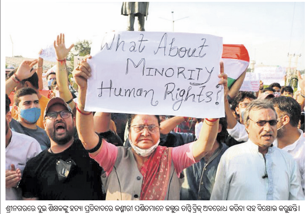
ଶ୍ରୀନଗରରେ ଦୁଇ ଶିଖଙ୍କୁ ହତ୍ୟା ପ୍ରତିବାଦରେ କମ୍ପାନୀ ପଞ୍ଚିତମାନେ ଜମ୍ମୁର ଚାଡ଼ି ଦ୍ୱିକ୍ ଅବରୋଧ କରିବା ସହ ବିକ୍ଷୋଭ କରୁଛନ୍ତି।

କାବଟ୍ ଉଦ୍ଧାର କରାଯାଇଥିବାବେଳେ ସେମାନଙ୍କ ମଧ୍ୟରୁ ଜଣକ ଅବସ୍ଥା ଗୁରୁତର ରହିଥିବା ଗାଏ୍ ମ୍ୟୁକ୍ ଏକ୍ସପ୍ରେସ୍ ପକ୍ଷରୁ କୁହାଯାଇଛି। ମେଡିକାଲିନ୍ସ୍ ସହର ନିକଟରୁ ବିମାନର ଭଗ୍ନାବଶେଷ ମିଳିଛି। ବିମାନରେ ୨୩ଜଣ ଯାତ୍ରୀ ଥିଲେ। ୨ଜଣଙ୍କୁ