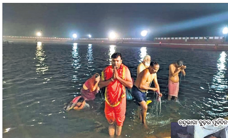
ଚନ୍ଦ୍ରଭାଗା ବୁଡ଼ାଇ ପୂର୍ବଦିନ ରାତ୍ରି।