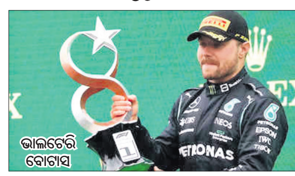
ବୁଡ଼ତମ ବିବେଚିତ ହୋଇଥିଲେ ମଧ୍ୟ ଇଣ୍ଡିଆନ ନିୟମ ଉଲ୍ଲଙ୍ଘନ କରିଥିବାରୁ ତାଙ୍କୁ ୧୦ ସ୍ଥାନ ପୋନାଲ୍ଡି ହୋଇଥିଲା। ଫଳରେ ରବିବାର ରେସ୍ରେ ଗ୍ରାଣ୍ଡି ୧୧ତମ ସ୍ଥାନରୁ ଏବଂ ବିପକ୍ଷରେ ରହିଥିବା ବୋଟାସ ଗ୍ରାଣ୍ଡି-୧ ରେସ୍ ଆରମ୍ଭ କରିଥିଲେ।

ଭଦ୍ରକ, ୧୦୧୯ ରେଡ୍‌ବୁଲ୍ ମାକ୍ସ ଉର୍ଷ୍ଟାପେନକୁ ପଛରେ ପକାଇ ମର୍ସିଡିଜ୍ ଭାଇଚେରି ବୋଟାସ ତୁର୍ନାମା ଫର୍ମୁଲା ଓଠିନ ମୋଟର ରେସ୍ ଜିତିଛନ୍ତି। ଚଳିତ ସିଜନରେ ଏହା ହେଉଛି ତାଙ୍କର ପ୍ରଥମ ଗୋଲ୍ଡେନ ବ୍ରିଟ୍। ବିପକ୍ଷରେ ଉର୍ଷ୍ଟାପେନ ଗୋଲ୍ଡେନ ବ୍ରିଟ୍ ଗ୍ରାଣ୍ଡି ହେଉଛି। ରବିବାର ଅନୁଷ୍ଠିତ ରେସ୍ରେ ସର୍ବିଓ ପେରେଜ (ରେଡ୍‌ବୁଲ୍) ଓ ଚାର୍ଲ୍ସ ଲେକ୍‌ରେନ୍ (ଟୁଟାୟ ଓ ଚତୁର୍ଥ ହୋଇଥିବା ବେଳେ ବୋଟାସଙ୍କ ଟିମ୍‌ମେଟ୍ ଲୁଇସ୍ ହାମିଲଟନ ୫ ସ୍ଥାନରେ ରହିଥିଲେ। ସୂଚନାଯୋଗ୍ୟ, ଶନିବାର ଅନୁଷ୍ଠିତ କ୍ୱାଲିଫାୟର ରେସ୍ରେ ହାମିଲଟନ