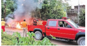
ଇକ୍ଷନ ନ ଥିବା ବେଳେ ଦୁର୍ଭିକ୍ଷ ଜାଣିଶୁଣି ନିଆଁ ଲାଗିଯାଇଥିବା ବେଳେ ଅଗ୍ନିଶମ ବାହିନୀକୁ ଖବର ଦେବାକୁ କର୍ମଚାରୀମାନେ ପହଞ୍ଚି ନିଆଁକୁ ଆୟତ୍ତ କରିଛନ୍ତି।

ଗାଉନ ଥାନା ମଧୁବନ ପାଣିଫଳ ଗଡିଆ ରାସ୍ତା ପାର୍ଶ୍ୱରେ ପଡିଥିବା ଏକ ପରିତ୍ୟକ୍ତ କାରରେ ରବିବାର ସକାଳେ ନିଆଁ ଲାଗିଯାଇଛି। କାରଟି ଦୀର୍ଘ ୮ବର୍ଷରୁ ଉର୍ଦ୍ଧ୍ୱ ଦିନ ଧରି ପଡିରହିଥିବା ବେଳେ କାରରେ ନିଆଁ ଲାଗିଥିଲା। ରାସ୍ତାରେ ଚଳପ୍ରଚଳ କରୁଥିବା ଲୋକେ ନିଆଁ ଦେଖି ଦମକକ ବାହିନୀକୁ ଖବର ଦେବାରୁ କର୍ମଚାରୀମାନେ ପହଞ୍ଚି ନିଆଁକୁ ଆୟତ୍ତ କରିଛନ୍ତି। ତେବେ ନଷ୍ଟ ହେବାକୁ ବସିଥିବା କାରରେ କୌଣସି