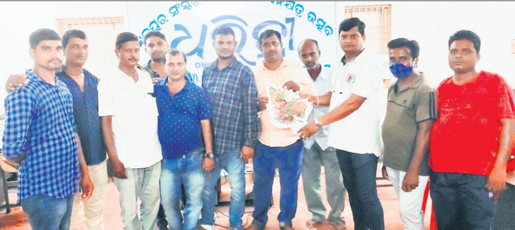
ଖବରକାଗଜ ବିତରକ ସଂଘ କର୍ମକର୍ତ୍ତାଙ୍କୁ ଧରିତ୍ରୀ ବ୍ରହ୍ମପୁର ସଂଘର ସର୍ବୋଚ୍ଚ ସର୍ବୋତ୍ତମ ନ୍ୟାୟାଳୟ ମନ୍ତ୍ରୀ କୁମାର ସାହୁ ସମ୍ବର୍ଦ୍ଧିତ କରୁଛନ୍ତି।