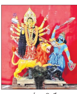
ମା ଦୁର୍ଗାଙ୍କ ପ୍ରତିମୂର୍ତ୍ତି