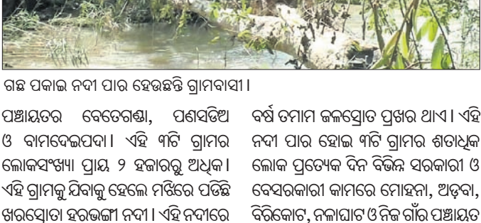
ଗଛ ପକାଇ ନଦୀ ପାର ହେଉଛନ୍ତି ଗ୍ରାମବାସୀ।

ମୋହନା ବ୍ଲକ୍ ସୁରମ୍ଭ, ଅପହଞ୍ଚି, କଳାଳ ଓ ପାହଚ ପର୍ବତ ଘେରା ମଧ୍ୟରେ ଅବସ୍ଥିତ ଆଦିବାସୀ ଅଧିଷ୍ଠିତ ଏହି ବ୍ଲକ୍‌ର ବହୁ ଗ୍ରାମ ଆଜି ବି ମୌଳିକ ସୁବିଧାକୁ ବଞ୍ଚିତ। ଏମିତି ବହୁ ଗ୍ରାମ ରହିଛି ଯେଉଁଠି ପ୍ରଶାସନ ଅଧିକାରୀମାନଙ୍କ ପାଦ ମଧ୍ୟ ପଡିନା। ପ୍ରଶାସନ କିଏ ସେମାନେ ଜାଣିନାହାନ୍ତି। ଦେଶ ସ୍ୱାଧୀନ ହେବାର ୭୫ ବର୍ଷ ବିତିଯାଇଥିଲେ ମଧ୍ୟ ଏମାନଙ୍କ ପାଇଁ ବିକାଶ ସାତ ସପନ। ପିଲାଙ୍କୁ ପଢ଼ାଇବା, ପଞ୍ଚାୟତ ଓ ବ୍ଲକ୍ କାର୍ଯ୍ୟାଳୟକୁ ଚଳୁଥିବା କାମରେ ଯାତାୟାତ ପାଇଁ ବାଧକ ସାଜିଛି ହରଭଙ୍ଗା ନଦୀ। ମୋହନା ବ୍ଲକ୍ ଅନ୍ତର୍ଗତ ରୁରୁକୁଳି