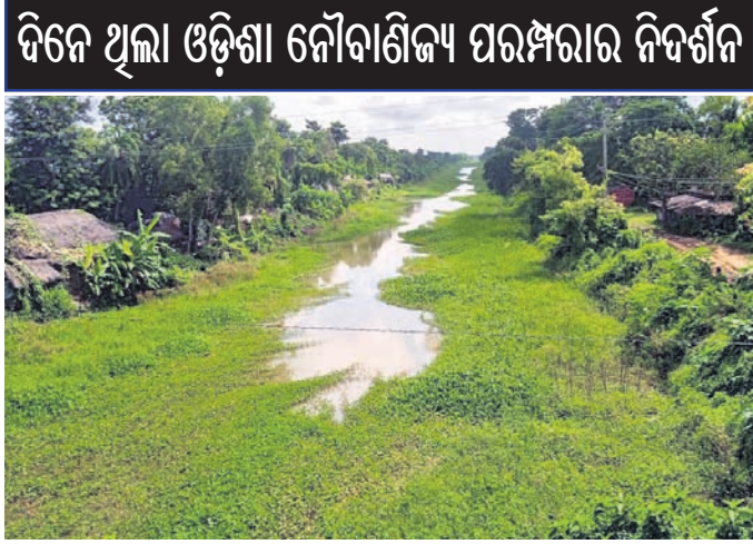
ଭୋଗରାଇ ରୁକ୍ ବାଟଗ୍ରାମ ବେଳ ଯାଇଥିବା କୋଷ୍ଠକେନାଲରେ ଦଳ ଭର୍ତ୍ତି ହୋଇରହିଛି।

ଓଡ଼ିଶା ନୌବାଣିଜ୍ୟ ପରମ୍ପରା ପରିଚୟ ବହନ କରିଥିବା କୋଷ୍ଠ କେନାଲ ଏବେ ରକ୍ଷଣାବେକ୍ଷଣ ଅଭାବରୁ ସ୍ଥିତି ହରାଇ ବସିଛି। ଦିନ ଥିଲା ଏହି କୋଷ୍ଠକେନାଲରୁ ଜଳସେଚନ କରାଯାଇ କୃଷିକ୍ଷେତ୍ରକୁ ଶସ୍ୟଶାମଳା କରାଯାଉଥିଲା। ଏହି କେନାଲ ଜଳକୁ କୃଷିକ୍ଷେତ୍ରରେ ଅଧିକ ବିନିଯୋଗ ଲାଗି ଉଭୟ ପାର୍ଶ୍ୱରେ ୧୧୦ ପଦନକାଳିତ ପାଣିପାଁ କାର୍ଯ୍ୟକାରୀ କରାଯାଇଥିଲା। ସେସବୁ ଏବେ ଅଟକ ହୋଇପଡ଼ିଛି। କୃଷି ଏବଂ ବାଣିଜ୍ୟ ବ୍ୟବସାୟରେ ବ୍ୟବହୃତ ହେଉଥିବା ଏହି କୋଷ୍ଠକେନାଲ ଦୁଇ ପାର୍ଶ୍ୱକୁ ଲୋକେ ପୋତି ଜବରଦଖଲ କରି ଘରଘାଟ କରିଥିବା ନଜରକୁ ଆସିଛି। ୧୮୬୬ରେ ଓଡ଼ିଶାର ନିଅଳ ଦୁର୍ଭିକ୍ଷ ସ୍ଥିତିକୁ ନଜରରେ ରଖି ଇଂରେଜ ସରକାର ୧୮୮୦ରେ ଓଡ଼ିଶା କୋଷ୍ଠକେନାଲ ଖନନ କରିଥିଲେ। ଏହି କାର୍ଯ୍ୟ ୧୮୮୫ରେ ଶେଷ ହୋଇଥିଲା। ବାଣିଜ୍ୟ ବ୍ୟବସାୟ ବୃଦ୍ଧି କମ୍ପାନୀଗୁଡ଼ିକ ଲାଗି ଜଳପଥ ହିଁ ସେତେବେଳେ ସୁଗମ ହେଉଥିଲା। ଇଷ୍ଟଇଣ୍ଡିଆ କମ୍ପାନୀ କଲିକତାରେ ବାଣିଜ୍ୟ ବ୍ୟବସାୟର ସାମ୍ରାଜ୍ୟ ବିଛାଇଥିଲେ ମଧ୍ୟ ଉତ୍କଳ ନୌବାଣିଜ୍ୟ ଉପରେ ନଜର ରହିଥିଲା। ଏଥିପାଇଁ ପଶ୍ଚିମବଙ୍ଗ ଗଙ୍ଗାନଦୀ ଗେଉଁଠାଠାରେ କୋଷ୍ଠ କେନାଲ ଖନନ