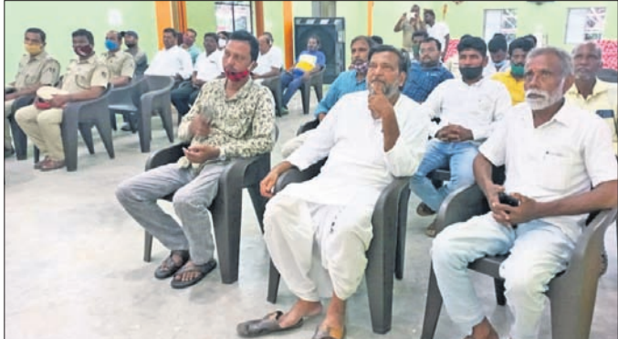
କାର୍ଯ୍ୟକ୍ରମରେ ଉପସ୍ଥିତ ଜନପ୍ରତିନିଧି ।