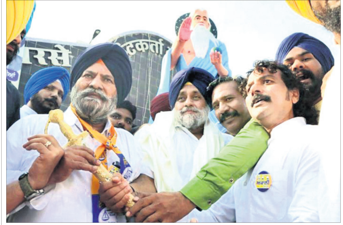
ପଞ୍ଜାବ ବିଧାନସଭା ନିର୍ବାଚନ ତାରିଖ ଘୋଷଣା ହୋଇ ନ ଥିବାବେଳେ ଶିରୋମଣି ଅକାଳୀ ଦଳ ଅଧ୍ୟକ୍ଷ ଗୁମ୍ବରାଜ ସିଂ ବାଦଲ(ମଝି) ରବିବାର ଅନୁତସରରେ ଦଳୀୟ ପ୍ରଚାର ଆରମ୍ଭ କରିଛନ୍ତି।

ତୁମେ ଯଦି ପରିବର୍ତ୍ତନ ଆଣିବାକୁ ଚାହୁଁଛ ତେବେ ମୋ ସହିତ ଆସ। ମୋ ସହ ସଂଘର୍ଷ କରି ଏହି ସରକାରକୁ ବଦଳାଇଦିଆ। ଏଠାରେ ପରିବର୍ତ୍ତନ ନ ଆଣିବା ଯାଏ ମୁଁ ଅଟକିଯିବି ନାହିଁ। -ପ୍ରିୟଙ୍କା ଗାନ୍ଧୀ ଭଦ୍ରା, କଂଗ୍ରେସ ସାଧାରଣ ସମାବେଶ