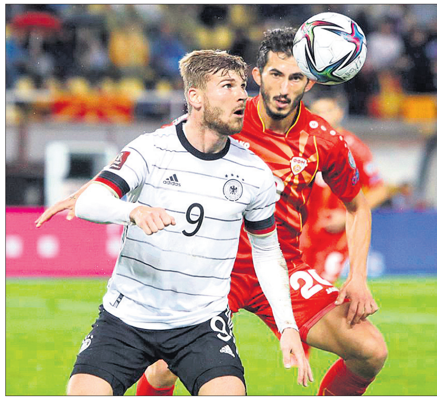
ଜର୍ମାନୀ ଓ ନର୍ଥ ମାସିଡୋନିଆ ମଧ୍ୟରେ ଅନୁଷ୍ଠିତ ଫିଫା ବିଶ୍ୱକପ୍ କ୍ୱାଲିଫାଲ୍ ମ୍ୟାଚ।

ପରାସ୍ତ କରି ବିଶ୍ୱକପ୍‌ରେ ନିଜର ସ୍ଥାନ ପକ୍ଷା କରିଛି। ଦ୍ୱିତୀୟାଂଶରେ ସବୁ ୪ଟି ଯାକ ଗୋଲ ଷ୍ଟୋର କରାଯାଇଥିଲା। ୫୦ତମ ମିନିଟ୍‌ରେ କାଲ କାଲ ହାଭେର୍ଟ, ୭୦ ଓ ୭୩ତମ ମିନିଟ୍‌ରେ ଚିମୋ ଫ୍ରେନର୍ ଓ ୮୩ତମ ମିନିଟ୍‌ରେ ଜମାଲ ମୁସିଆଲ ଗୋଲ ଷ୍ଟୋର କରି ଜର୍ମାନୀକୁ ଏକପାଖୁଆ ବିଜୟ ପ୍ରଦାନ କରିଥିଲେ। ତେବେ ଗତ ମାର୍ଚ୍ଚରେ ଜର୍ମାନୀ ନର୍ଥ ମାସିଡୋନିଆଠାରୁ