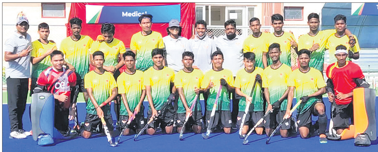
କାତାୟ ସବୁଜିନିୟର ପୁରୁଷ ଏକାଡେମୀ ହକି ଚାମ୍ପିୟନଶିପ୍ ଫାଇନାଲରେ ପ୍ରବେଶ କରିଥିବା ଓଡ଼ିଶା ନାଭାଲ ଗାଗା ହକି ହାଲ ପରଫର୍ମାନ୍ସ ସେଣ୍ଟର ଦଳ