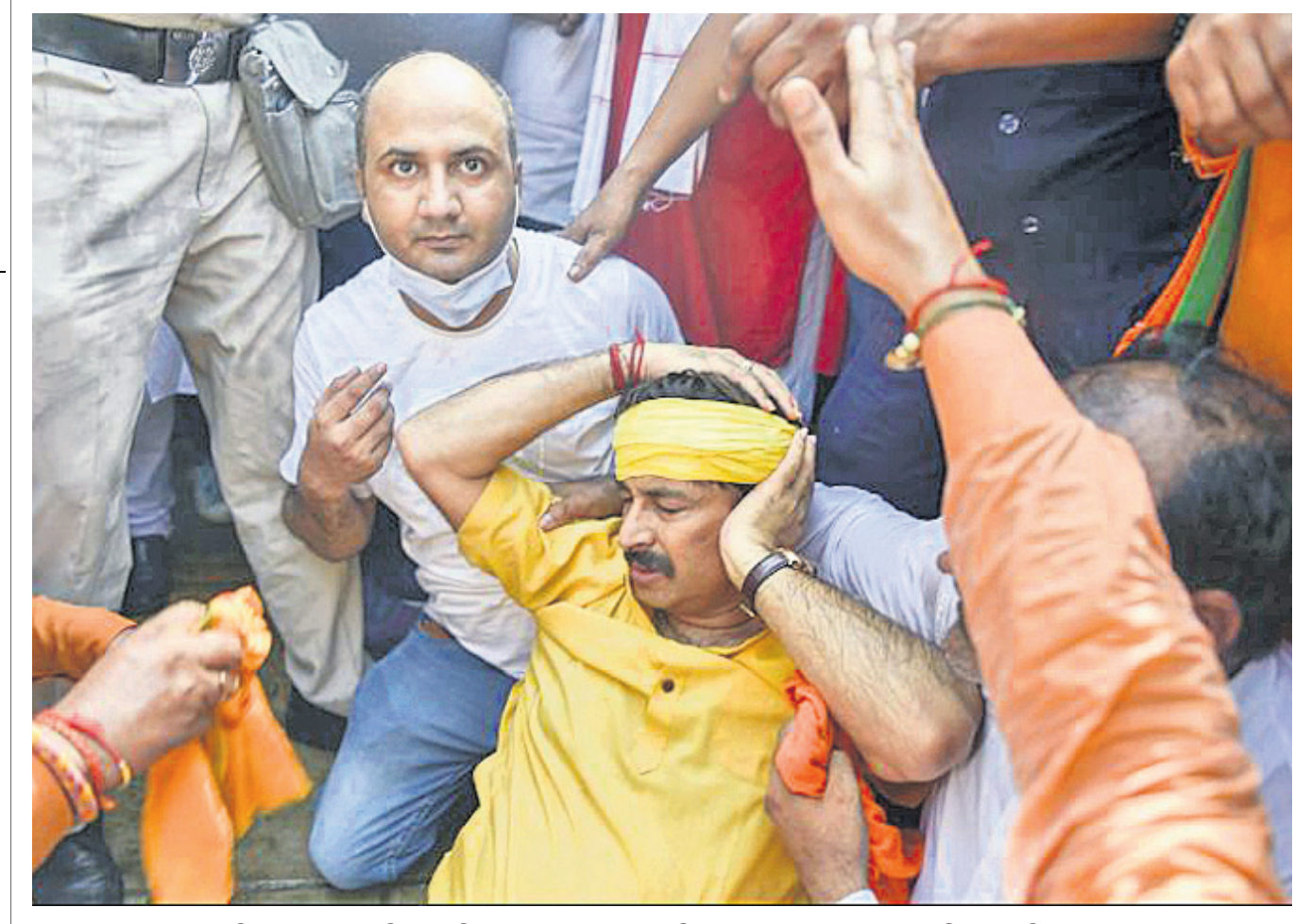
ଦିଲ୍ଲୀ ମୁଖ୍ୟମନ୍ତ୍ରୀ ଅରବିନ୍ଦ କେଜ୍ରିୱାଲଙ୍କ ବାସଭବନ ବାହାରେ ବିରୋଧୀ ବେଳେ ଆହତ ଭାଜପା ଏମ୍ପି ମନୋଜ ତ୍ରିପାଠୀ।