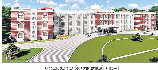
ସରକାରଙ୍କ ଯୋଷିତ ଆଇଆଇସି ପ୍ରକଳ୍ପ।

ରାଜ୍ୟ ସରକାରଙ୍କ ଅନେକ କର୍ମଚାରୀଙ୍କାକାରୀ ଯୋଜନା ଓ କାର୍ଯ୍ୟକ୍ରମ ଠିକଣା ସମୟରେ କାର୍ଯ୍ୟକାରୀ ହୋଇ ପାରୁନାହିଁ। ଏଭଳି ଏକ କର୍ମଚାରୀଙ୍କାକାରୀ ପ୍ରକଳ୍ପ ସମ୍ବନ୍ଧିତ ଭିତ୍ତିଭୂମି କେନ୍ଦ୍ର (ଆଇଆଇସି) ଏବେ ବଲାଙ୍ଗୀର ଜିଲ୍ଲାରେ ଆଗକୁ ବଢ଼ୁନାହିଁ। ପ୍ରତ୍ୟେକ ଜିଲ୍ଲାରେ ନିରାଶ୍ରୟ ବରିଷ୍ଠ ନାଗରିକ, ଭିକ୍ଷୁ, ମାନସିକ ଅନୁଗ୍ରହ ଓ ଅବସାଦଗ୍ରସ୍ତ, କିନ୍ତର, ଭିକାରି ଏବଂ ନିଶାସକ୍ତ ରହିବା, ସମ୍ପାନର ସହ ବଞ୍ଚିବା ଏବଂ ସେମାନଙ୍କୁ ଉନ୍ନତ ସେବା ଯୋଗାଇବା ଲକ୍ଷ୍ୟରେ ସରକାର ସମ୍ବନ୍ଧିତ ଭିତ୍ତିଭୂମି କେନ୍ଦ୍ର ପରିକଳ୍ପନା କରିଥିଲେ। ଏଥିପାଇଁ ୨୦୧୨-୧୬ ମସିହାରୁ ଭିକ୍ଷୁମାନଙ୍କ ସାମାଜିକ ସୁରକ୍ଷା ଓ ସମଗ୍ରୀକରଣ ବିଭାଗ ପକ୍ଷରୁ ୩୦ଟି ଜିଲ୍ଲାରେ ଆଇଆଇସି ନିର୍ମାଣ ପାଇଁ ୨୫ ଏକର ଲେଖାଏଁ ଜମି ଯୋଗାଇ ଦେବାକୁ ସମସ୍ତ ଆରତ୍ତିସି ଏବଂ ସମସ୍ତ ଜିଲ୍ଲାପାଳଙ୍କୁ ନିର୍ଦ୍ଦେଶ ଦେଇଥିଲେ। ମାମଲା ରୁଜୁ କରି ତଦନ୍ତ ଚାଲିଥିବା ଏସ୍ପି ପାଇକରାୟ ସୂଚନା ଦେଇଥିଲେ।