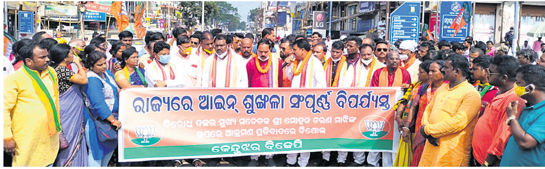
ଭାଜପା ବିଧାୟକ ଓ କର୍ମୀ ଗାମାଢ଼ ରାଜପଥ ଅବରୋଧ କରିଛନ୍ତି।