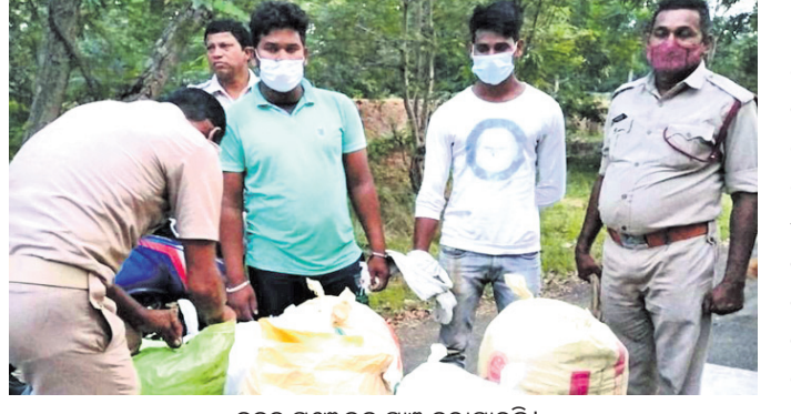
ଜବତ ଗଞ୍ଜାମକୁ ଯାତ୍ରା କରାଯାଇଛି।