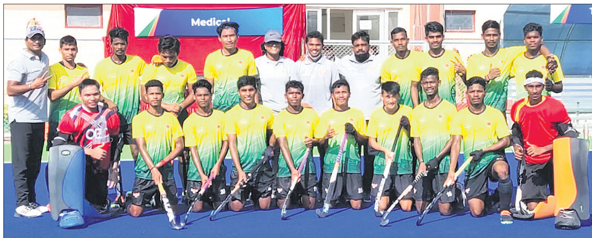
କାତାୟ ସବୁଜନିୟର ପୁରୁଷ ଏକାଡେମୀ ହକି ଚାମ୍ପିୟନଶିପ୍ ଫାଇନାଲରେ ପ୍ରବେଶ କରିଥିବା ଓଡ଼ିଶା ନାଭାଲ ଗାଗା ହକି ହାଲ ପରଫର୍ମାନ୍ସ ସେଣ୍ଟର ଦଳ