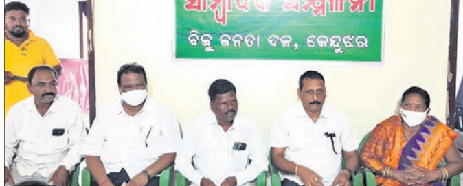
ଖବରଦାତା ସମ୍ମିଳନୀରେ ଉପସ୍ଥିତ ବିଜେଡି ନେତା।