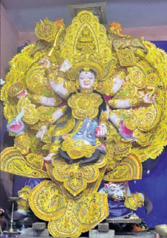
ମା' ଚକରାକୋଟା ଠାକୁରାଣୀ।