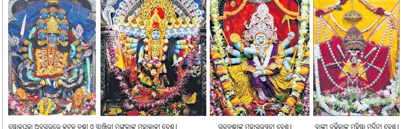
ଷୋକପୂର୍ଣ୍ଣା ଅବସରରେ କଟକ ଚଣ୍ଡୀ ଓ ଝାଞ୍ଜିରୀ ମଙ୍ଗଳାକା ମହାକାଳୀ ବେଶ। ଗଡ଼ଚଣ୍ଡୀଙ୍କ ମହାସରସ୍ୱତୀ ବେଶ। ବାଙ୍କୀ ଚର୍ଚ୍ଚକାଙ୍କ ମହିଷା ମର୍ଦ୍ଦିନୀ ବେଶ।