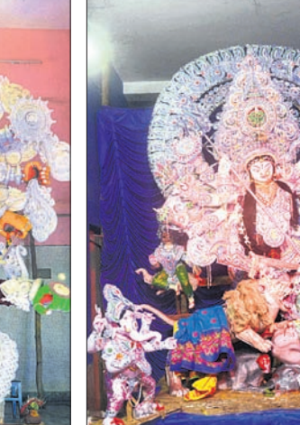
ଗୌତବସାହିର କହିଖାଲ ଠାକୁରାଣୀ।