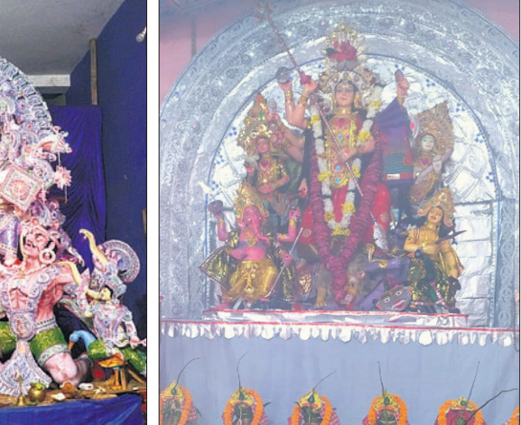
କୋଣାର୍କ ନୃସିଂହଦେବ କମିଟି ପକ୍ଷରୁ ପୂଜିତ ମା'ଙ୍କ ମୁଖ୍ୟା ପୂର୍ଣ୍ଣି।