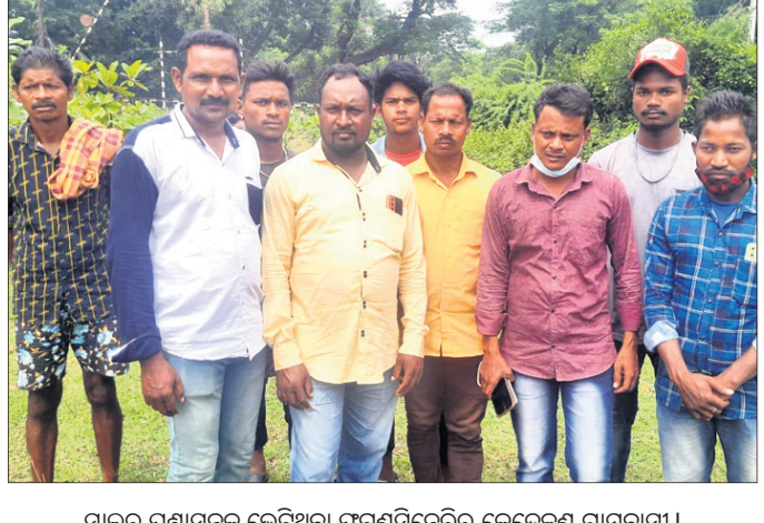
ସାଲୁର ପ୍ରଶାସନକୁ ଭେଟିଥିବା ଫରୁଗସିନେରିର କେତେଜଣ ଗ୍ରାମବାସୀ ।

କୋରାପୁଟ ଜିଲ୍ଲା ପଟ୍ଟାଚା ବ୍ଲକ ଅନ୍ତର୍ଗତ ତଥା ଆନ୍ଧ୍ର ରାଜ୍ୟ ସାମାନ୍ତ କୋଟିଆ ପଞ୍ଚାୟତର ଫରୁଗସିନେରି ଗ୍ରାମବାସୀ ଆନ୍ଧ୍ର ସହ ଅଛୁ ଓ ରହିବୁ ମତ ଦେଇ ଆଗାମୀ ଦିନରେ ଓଡ଼ିଶାରେ ହେବାକୁ ଥିବା ପଞ୍ଚାୟତ ନିର୍ବାଚନରେ ଭୋଟ ଦେବୁ ନାହିଁ ବୋଲି ପ୍ରକାଶ କରିଛନ୍ତି । ଓଡ଼ିଶାର ଏହି ତ୍ରିପୁରାୟ ପଞ୍ଚାୟତ ନିର୍ବାଚନରେ ଆମେ ୧୦ ଖଣ୍ଡ ଗ୍ରାମର ଲୋକ ଭୋଟଦେବୁ ନାହିଁ । ଆନ୍ଧ୍ର ସରକାରଙ୍କ ପକ୍ଷରୁ ଆମକୁ ଯେପରି ସହଯୋଗ କରାଯାଉଛି ସେହିପରି ସହଯୋଗ ଓଡ଼ିଶା ସରକାରଙ୍କ ପକ୍ଷରୁ କରାଯାଉନାହିଁ । ବର୍ତ୍ତମାନ ପଞ୍ଚାୟତ ନିର୍ବାଚନ ଥିବାରୁ ଓଡ଼ିଶାର କୋରାପୁଟ ଜିଲ୍ଲା ପ୍ରଶାସନ ତଥା ଗୁମାସ୍ତା ବ୍ଲକ ପ୍ରଶାସନ ଆମମାନଙ୍କ ନିକଟରେ ବାରମ୍ବାର ପହଞ୍ଚି ବିଭିନ୍ନ ପ୍ରତିଷ୍ଠିତ