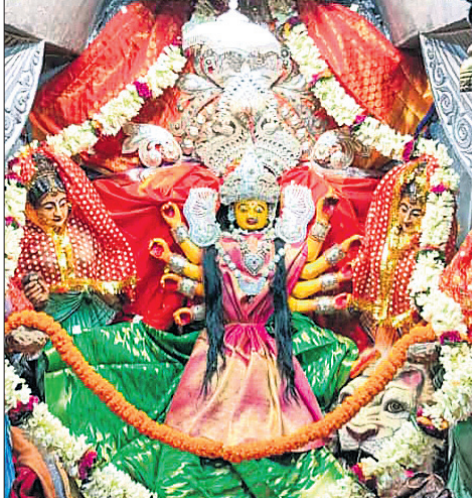
କଟକ: ମା' ଉରଭାୟଣୀଙ୍କ ସିଂହବାହିନୀ ବେଶ।