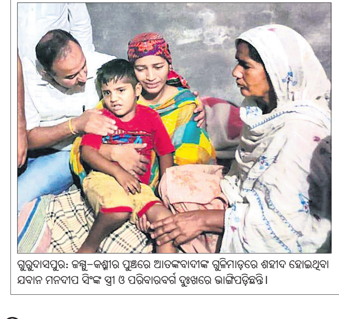
ରୁରୁଦାସପୁର: କମ୍-କମ୍ପାନ ପୁଞ୍ଜରେ ଆତଙ୍କବାଦୀଙ୍କୁ ରୁମିନାଡ଼ରେ ଶହାଦ ହୋଇଥିବା ସମାନ ମନବୀୟ ସଂକଳ୍ପ ୩ ଓ ପରିବାରବର୍ଦ୍ଧ ଟୁଖରେ ଭାଙ୍ଗିପଡ଼ିଛନ୍ତି।

ଯୋଗାଜୀବିଆସିବା ଜରୁରୀ। ମହିଳା ଓ ସଂଖ୍ୟାଲଘୁଙ୍କୁ ନେଇ ସେଠାରେ ଏକ ସମାବେଶୀ ସରକାର ଗଠନ କରାଯିବା ଦରକାର। ଆଫଗାନିସ୍ତାନବାସୀ ସମ୍ପୃକ୍ତ ହେଉଥିବା ଖୁସୀ ଓ କୁତ୍ସାପଣର ସନ୍ତୁଷ୍ଟକୁ ପ୍ରତ୍ୟେକ ଭାରତୀୟ ଅନୁଭବ କରୁଛନ୍ତି। ଜାତିସଂଘ ସୁରକ୍ଷା ପରିଷଦର ସଂକଳ୍ପନାମା ୨୫୯୩ ଭିତ୍ତିରେ ଏକ ଏକାକ୍ରତ ଅନ୍ତର୍ଜାତୀୟ ସହାୟତା ସମିତିରେ ସୁଧାର ଆଣିପାରିବ ବୋଲି ମୋଦି ପ୍ରକାଶ କରିଛନ୍ତି।