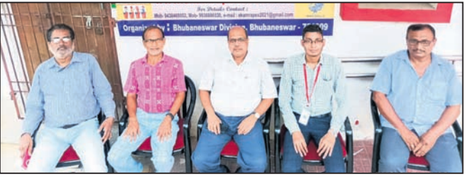
କର୍ମଶାଳାରେ ଉପସ୍ଥିତ ତାଙ୍କ ବିଭାଗର ଅଧିକାରୀମାନେ।