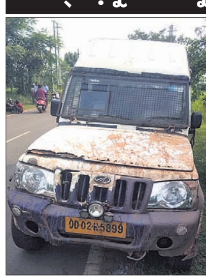
କରାଯାଇଥିବା କାର୍ ଡେକାନାଲ ଜିଲାର ବୋଲି ସୂଚନା ମିଳିଛି। ସେଥିରେ ଏକ ନକଲି ନମ୍ବର ଲୁଚ୍ରେ (ଓଡି ୦୨ ଏକେଡ-୪୨୯୪) ଲଗାଯାଇଥିଲା। ହେଲେ ତଦନ୍ତ ପରେ ଗାଡ଼ିର ପ୍ରକୃତ