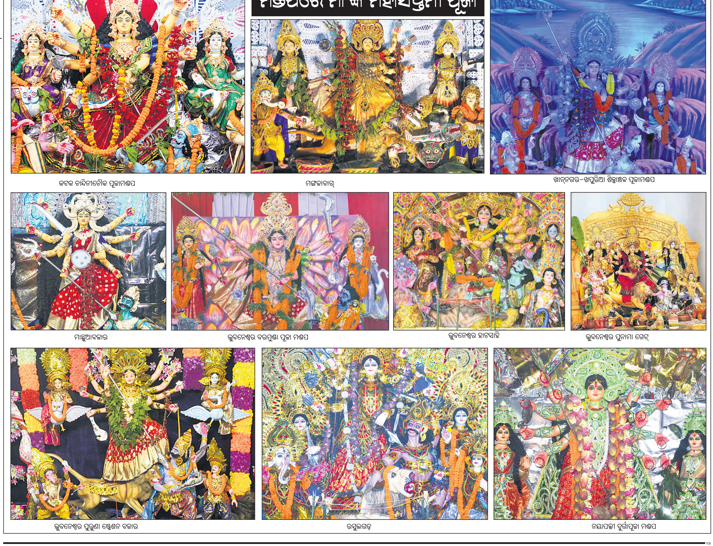
କଟକ ଚାନ୍ଦିନୀଗୌରୀ ପୂଜାମଣ୍ଡପ