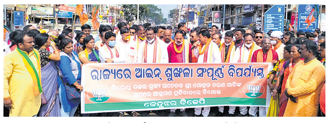
ଭାଜପା ବିଧାୟକ ଓ କର୍ମୀ ଜାଗାସ ରାଜପଥ ଅବରୋଧ କରିଛନ୍ତି ।