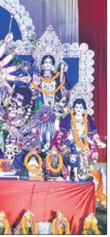
ଖୋର୍ଦ୍ଧା ଭଗଲ କୁବ ପକ୍ଷରୁ ପୂଜିତ ମା'ଙ୍କ ମୁଖ୍ୟା ପୂର୍ଣ୍ଣି।