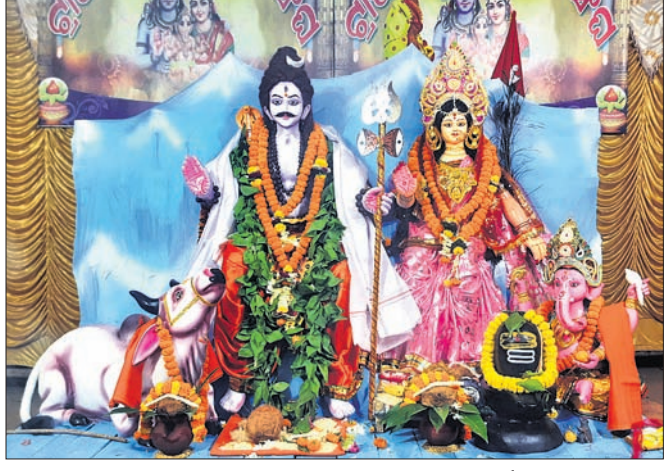
ଗ୍ରାମିକ ବ୍ୟବସାୟୀ ସଂଘ ପକ୍ଷରୁ ମଣ୍ଡଳରେ ପୂଜା ପାଉଥିବା ହରପାର୍ବତୀ।