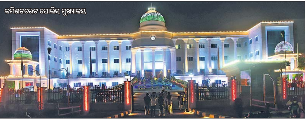
କମିଶନରେଟ ପୋଲିସ ପୁଖ୍ୟାଳୟ