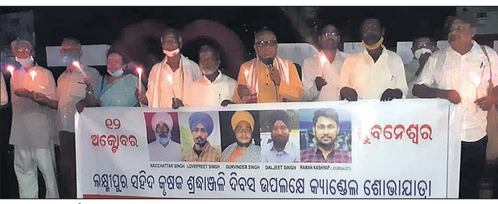
ସଂଯୁକ୍ତ କିଷାନ ମୋର୍ଚ୍ଚା ପକ୍ଷରୁ ଆୟୋଜିତ କ୍ୟାଣ୍ଟେଲ ଶୋଭାଯାତ୍ରା।

ଭୁବନେଶ୍ୱର, ୧୨।୧୦(ଭୁବନେଶ୍ୱର): ଉତ୍ତରପ୍ରଦେଶର ଲକ୍ଷ୍ମପୁର ଖେରିଠାରେ ଆନ୍ଦୋଳନରେ କୃଷକଙ୍କ ଉପରକୁ ଗାଡ଼ି ଡଳାଇଦେବା ଘଟଣାରେ ମୃତକଙ୍କ ଉଦ୍ଦେଶ୍ୟରେ ବୁଧବାର ମାଷ୍ଟରମାଇଣ୍ଡ ଛକଠାରେ ସଂଯୁକ୍ତ କିଷାନ ମୋର୍ଚ୍ଚା ପକ୍ଷରୁ ଏକ କ୍ୟାଣ୍ଟେଲ ଶୋଭାଯାତ୍ରା ଆୟୋଜିତ ହୋଇଯାଇଛି। ଶୋଭାଯାତ୍ରାରେ ସାମିଲ କର୍ମକର୍ତ୍ତାମାନେ ନୂତନ କୃଷି ଆଇନ ରଦ୍ଦ