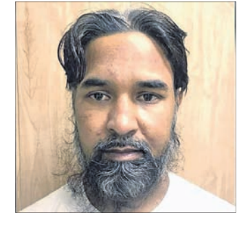
ଏପରି କି ପାକ୍ ଗୋଇନ୍ଦା ସଂସ୍ଥା ଉତ୍ତର-ସର୍ଭସେସ୍ ଇଣ୍ଡେଲିଟେସ୍