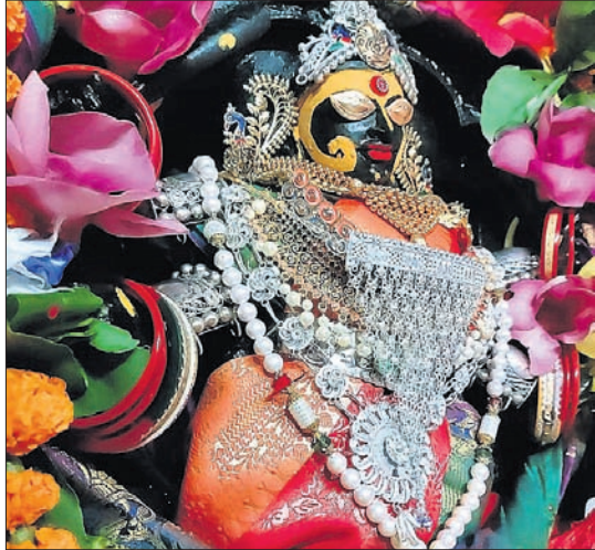
ନିରାକାରପୁର: ମା' ଉଗ୍ରତାରାଙ୍କ କାଳରାତ୍ରି ବେଶ।

ବାସଗୃହ ହରାଇଥିଲେ। ସରକାରୀ ପୁରରେ ବାସଗୃହ ଯୋଗାଇବା ପାଇଁ ସମସ୍ତ ପ୍ରକାର ହୋଇଥିଲେ ମଧ୍ୟ ବର୍ତ୍ତମାନ ପର୍ଯ୍ୟନ୍ତ ଲୋକେ ଜିଲାପାଳଙ୍କ କାର୍ଯ୍ୟାଳୟ ଆଗରେ ଧାରଣା ଦେଇ ଫାଇଲିନ ସହାୟତା ମାଗୁଛନ୍ତି। ଶ୍ରେଣୀ-୫ର ବାତ୍ୟାର ଭାବେ ମାନ୍ୟତା ପାଇଥିବା ଫାଇଲିନ ସାରା ଓଡ଼ିଶାକୁ ଓ ବିଶେଷ ଭାବେ ଉପକୂଳ ଓଡ଼ିଶାକୁ ଅକଥନୀୟ ଯନ୍ତ୍ରଣା ଦେଇ ଯାଇଛି। ମାତ୍ର ଏବେ ମଧ୍ୟ ଲୋକେ ଫାଇଲିନର କଷଣକୁ ଭୋଲୁଛନ୍ତି। ସେହିଭଳି ୨୦୧୪ ଅକ୍ଟୋବରରେ ହୁଡୁହୁଡୁ ବାତ୍ୟା ବିଶାଖାପାଟଣାରେ ସ୍ଥଳ ଭାଗ ଛୁଇଁଥିବା ବେଳେ ପୁରୀ ଜିଲାର ବିଭିନ୍ନ ସ୍ଥାନରେ କ୍ଷତିଗ୍ରସ୍ତ କରିଥିଲା।