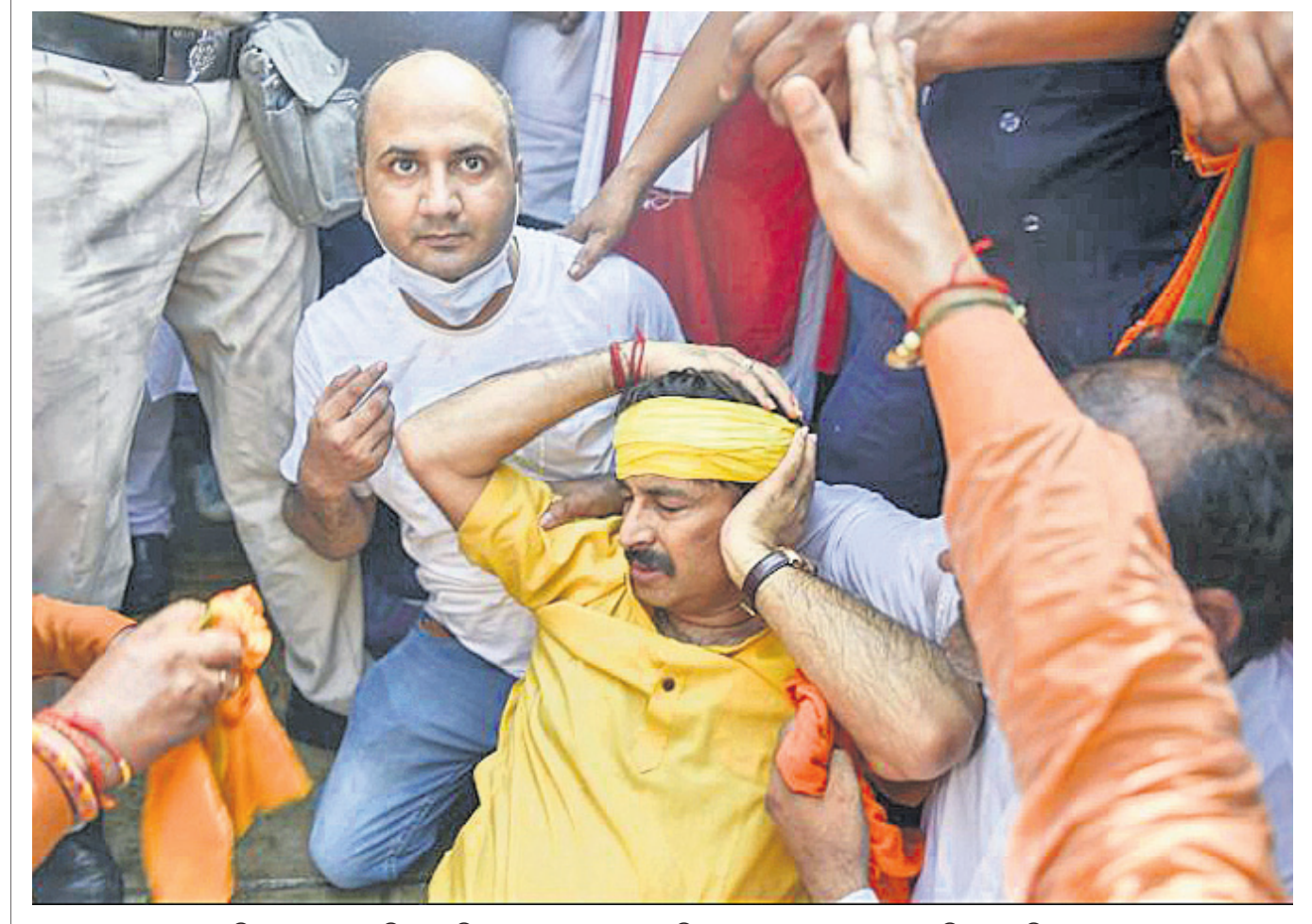
ତିଳା ମୁଖ୍ୟମନ୍ତ୍ରୀ ଅରବିନ୍ଦ କେଜ୍‌ରିୱାଲଙ୍କ ବାସଭବନ ବାହାରେ ବିକ୍ଷୋଭ ବେଳେ ଆହତ ଭାଜପା ଏମ୍ପି ମନୋଜ ତିପ୍ପାରୀ ।