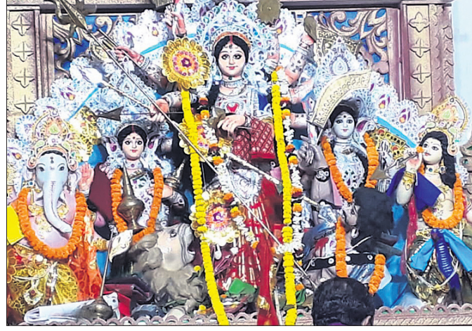
କଟକ ଚେଲପେ କଲୋନୀ।