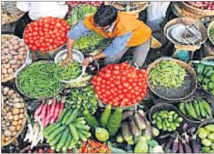
ଅଗଷ୍ଟ ମାସରେ ହୋଇଥିବା ୫.୭% ମୁଦ୍ରାସ୍ୱୀତି ୫.୧%, ତୃତୀୟରେ ୪.୫% ଧାର୍ଯ୍ୟ ଆକଳନ ଠାରୁ ଏହା ନିମ୍ନ। ଚଳିତ ଆର୍ଥିକ ବର୍ଷ ତୃତୀୟ ଟ୍ରେନାସରେ ଖୁରୁରା ମୁଦ୍ରାସ୍ୱୀତି ୫.୧%, ତୃତୀୟରେ ୪.୫% ଏବଂ ଚତୁର୍ଥରେ ୫.୮% ରହିପାରେ। ଆର୍ଥିକ ବର୍ଷ ୨୦୨୧-୨୨ ମୁଦ୍ରାସ୍ୱୀତି ୫.୧%, ତୃତୀୟରେ ୪.୫% ଏବଂ ଚତୁର୍ଥରେ ୫.୮% ରହିପାରେ। ଆର୍ଥିକ ବର୍ଷ ୨୦୨୧-୨୨ ମୁଦ୍ରାସ୍ୱୀତି ୫.୧%, ତୃତୀୟରେ ୪.୫% ଏବଂ ଚତୁର୍ଥରେ ୫.୮% ରହିପାରେ।

ସେପ୍ଟେମ୍ବରରେ ଖାଉଟି ମୂଲ୍ୟ ସୂଚୀ ଭିତ୍ତିକ ମୁଦ୍ରାସ୍ୱୀତି (ସିପିଆଇ) ୫ ମାସର ସର୍ବନିମ୍ନ ସ୍ତର ୪.୩୫% ସ୍ତରକୁ ଖସିଛି। ଏହା ଅଗଷ୍ଟରେ ୫.୫୯% ସ୍ତରରେ ରହିଥିଲା।