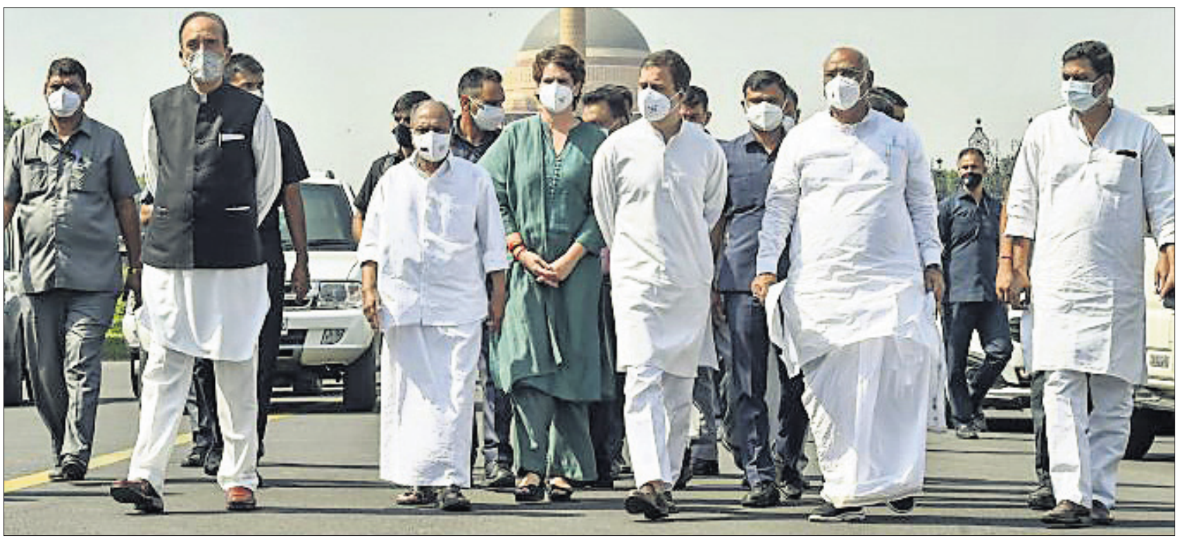
ରାଷ୍ଟ୍ରପତି ରାମନାଥ କୋବିନ୍ଦଙ୍କୁ ଭେଟିବା ପରେ କଂଗ୍ରେସ ନେତାମାନେ ରାଷ୍ଟ୍ରପତି ଭବନକୁ ଫେରୁଛନ୍ତି ।