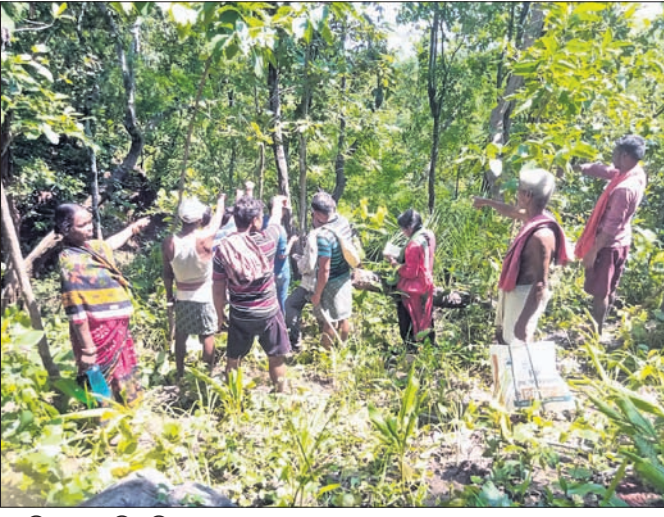
ସବୁଜିମାରେ ପୁରି ରହିଥିବା ଜଙ୍ଗଲ ।

ଅନୁଷ୍ଠାନଠାରୁ ସୂଚନା ମିଳିବା ପରେ ଗତ ୩ ବର୍ଷ ତଳେ ଗ୍ରାମବାସୀ ଏକ ବୈଠକ ଡାକିଥିଲେ । ଉକ୍ତ ବୈଠକର ନିଷ୍ପତ୍ତି ଅନୁଯାୟୀ ଗାଁ ଲୋକେ ଜଙ୍ଗଲ ଜରିବାକୁ ସ୍ଥିର କଲେ । ପ୍ରାୟ ୪ମାସ ପର୍ଯ୍ୟନ୍ତ ୨୦ରୁ ଊର୍ଦ୍ଧ୍ୱ ଲୋକ ଜଙ୍ଗଲକୁ କରିଲେ । ପରେ ପ୍ରତିଦିନ ୨ଜଣ ଲୋକ ଜଙ୍ଗଲ କରିଲେ । ହେଲେ ଗ୍ରାମବାସୀଙ୍କ ଏପରି ପଦକ୍ଷେପକୁ କାଠିମାଡ଼ିଆ ଓ ଶିକାରୀମାନେ ସହଜରେ ଗ୍ରହଣ କରି ପାରି ନ ଥିଲେ । ଏହାକୁ ନେଇ ସେମାନେ ଗାଁରେ ଗଣଗୋଳ କରିବା ସହ କେତେଜଣଙ୍କୁ ମାର୍ଡ଼ିପି କରିବାକୁ ପଛାଇ ନ ଥିଲେ । ଆଦିବାସୀ ଲୋକେ ସେମାନଙ୍କୁ ବୁଝାଶୁଣା କରି ଜଙ୍ଗଲକୁ ସୁରକ୍ଷା ଦେଲେ । ଇତିମଧ୍ୟରେ ୩ବର୍ଷ ବିତିଛି । ଦିନେ ଯେଉଁ ଜଙ୍ଗଲ ବୃକ୍ଷ ଓ ଜୀବଜନ୍ତୁମାନଙ୍କୁ ହୋଇ ଆସୁଥିଲା,