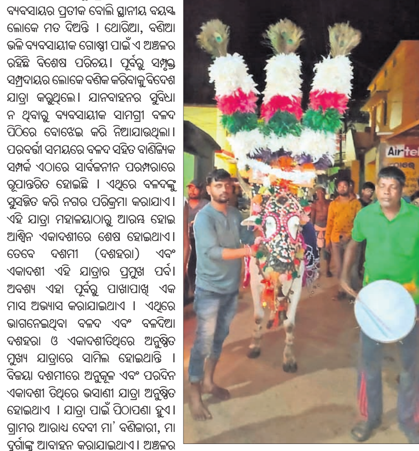
ବିଭିନ୍ନ ପୂଜା ଅନୁଷ୍ଠାନ ଏଥିରେ ସାମିଲ ହୋଇଥାନ୍ତି। ଭୟାଣୀ ପରେ ଯାତ୍ରା ଶେଷ ହୋଇଥାଏ। ତେବେ ଦୁଇ ବର୍ଷ ହେବ କରୋନା ମହାମାରୀ କାରଣରୁ ଏହି ପରମ୍ପରା ଫିକା ପଡ଼ିଯାଇଛି। -ବିପିନ ସିଂହାରୀ ସେଠୀ, ଭୁବନ

ଏସିଆ ମହାଦେଶର ସର୍ବବୃହତ ଗ୍ରାମ ଭାବେ ପରିଚିତ ଡେକାନୀଲ ଜିଲ୍ଲାର ଭୁବନ। ଦଶହରାରେ ବଳଦ ଯାତ୍ରା ଏହି ଗ୍ରାମର ଅନନ୍ୟ ପରମ୍ପରା। ପୂର୍ଣ୍ଣିକା କୁହାଯାଏ ଏହା ମନୁଷ୍ୟ ଏବଂ ପ୍ରାଣୀଙ୍କ ସମ୍ପର୍କର ପରିଚାୟ। ନିର୍ଦ୍ଦିଷ୍ଟ ଭାବେ ଜଣା ନଥିଲେ ବି ଏଠାକାର ଏହି ପରମ୍ପରା ବହୁ ପ୍ରାଚୀନ ଏବଂ ଏହା ବ୍ୟବସାୟର ପ୍ରତୀକ ବୋଲି ସ୍ଥାନୀୟ ବୟସ୍କ ଲୋକେ ମତ ଦିଅନ୍ତି। ଯୋଡିଆ, ବଣିଆ ଭଳି ବ୍ୟବସାୟୀଙ୍କ ଗୋଷ୍ଠୀ ପାଇଁ ଏ ଅଞ୍ଚଳର ରହିଛି ବିଶେଷ ପରିଚୟ। ପୂର୍ବରୁ ସମ୍ପୂର୍ଣ୍ଣ ସମ୍ପ୍ରଦାୟର ଲୋକେ ବଣିକ ବଣିକରୁ ବିଦେଶ ଯାତ୍ରା କରୁଥିଲେ। ଯାନବାହନର ସୁବିଧା ନ ଥିବାରୁ ବ୍ୟବସାୟୀଙ୍କ ସାମଗ୍ରୀ ବଳଦ ଘିଠିରେ ବୋହେଇ କରି ନିଆଯାଉଥିଲା। ପରବର୍ତ୍ତୀ ସମୟରେ ବଳଦ ସହିତ ବାଣିକୀଙ୍କ ସମ୍ପର୍କ ଏଠାରେ ସାମାଜିକ ପରମ୍ପରାରେ ରୁପାନ୍ତରିତ ହୋଇଛି। ଏଥିରେ ବଳଦକୁ ପୁସଜିତ କରି ନଗର ପରିକ୍ରମା କରାଯାଏ। ଏହି ଯାତ୍ରା ମହାଲକ୍ଷ୍ମୀଠାରୁ ଆରମ୍ଭ ହୋଇ ଆଶ୍ଵିନ ଏକାଦଶୀରେ ଶେଷ ହୋଇଥାଏ। ତେବେ ଦଶମୀ (ଦଶହରା) ଏବଂ ଏକାଦଶୀ ଏହି ଯାତ୍ରାର ପ୍ରମୁଖ ପର୍ବ। ଅବଶ୍ୟ ଏହା ପୂର୍ବରୁ ପାଖାପାଖି ଏକ ମାସ ଅଭ୍ୟାସ କରାଯାଇଥାଏ। ଏଥିରେ ଭାଗନେଇଥିବା ବଳଦ ଏବଂ ବଳଦିଆ ଦଶହରା ଓ ଏକାଦଶୀତିଥିରେ ଅନୁଷ୍ଠିତ ମୁଖ୍ୟ ଯାତ୍ରାରେ ସାମିଲ ହୋଇଥାନ୍ତି। ବିକୟା ଦଶମୀରେ ଅନୁକୂଳ ଏବଂ ପରଦିନ ଏକାଦଶୀ ତିଥିରେ ଭୟାଣୀ ଯାତ୍ରା ଅନୁଷ୍ଠିତ ହୋଇଥାଏ। ଯାତ୍ରା ପାଇଁ ପିଠାପଣା ହୁଏ। ଗ୍ରାମର ଆରାଧ୍ୟ ଦେବୀ ମା' ବଣିକାରୀ, ମା ଦୁର୍ଗାଙ୍କୁ ଆବାହନ କରାଯାଇଥାଏ। ଅଞ୍ଚଳର