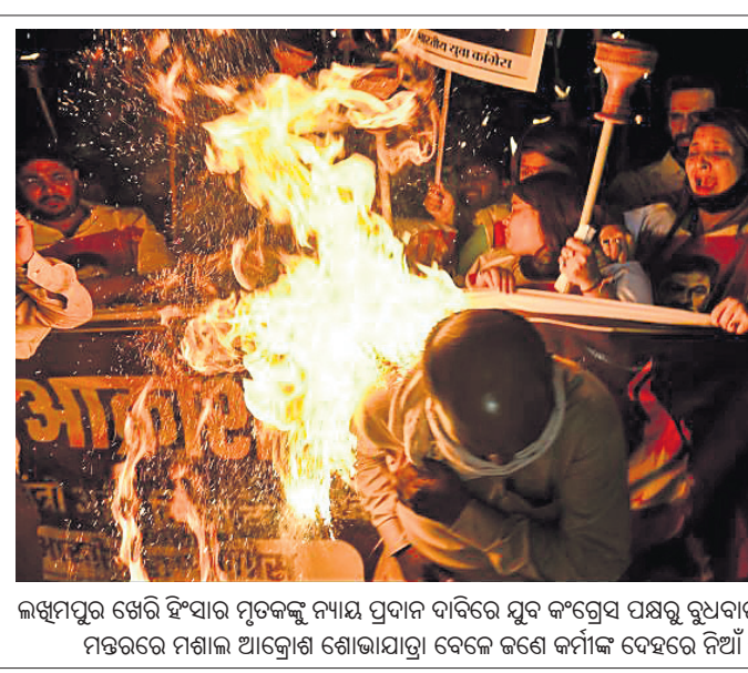
ଲକ୍ଷ୍ମଣପୁର ଖେରି ହିଂସାର ମୃତକଙ୍କୁ ନ୍ୟାୟ ପ୍ରଦାନ ଦାବିରେ ଯୁବ କଂଗ୍ରେସ ପକ୍ଷରୁ ରୁଧିବାର ନୂଆଦିଲ୍ଲୀର ଯତ୍ନ ମନ୍ତ୍ରଣାଳୟ ଆକ୍ରମଣ ଶୋଭାଯାତ୍ରା ବେଳେ ଜଣେ କର୍ମୀଙ୍କ ଦେହରେ ନିଆଁ ଲାଗିଯାଇଛି ।

ବୋଷ୍ଟନ, ୧୩।୧୦ ହୃଦିର ଲକ୍ଷ୍ମଣପୁର ଖେରି ହିଂସା ଅତ୍ୟନ୍ତ ନିନ୍ଦନୀୟ ବୋଲି ଆମେରିକା ଗସ୍ତରେ ଥିବା ଅର୍ଥମନ୍ତ୍ରୀ ନିର୍ମଳା ସୀତାରାମନ କହିଛନ୍ତି । ହାତୀ ଲୋକେ ଖୁଲିରେ ଏକ କଥାପଠକଣ କାର୍ଯ୍ୟକ୍ରମ ବେଳେ ମଙ୍ଗଳବାର ସୀତାରାମନଙ୍କୁ ଲକ୍ଷ୍ମଣପୁର ହିଂସା ସମ୍ପର୍କରେ ପ୍ରଶ୍ନ କରାଯାଇଥିଲା । ଏହାର ଉତ୍ତରରେ ସେ କହିଥିଲେ, ଏକାକି ଘଟଣା ଭାରତର ଅନ୍ୟ ଭାଗରେ ମଧ୍ୟ ଘଟୁଛି । ତେବେ ହୃଦିରେ ଭାଜପା ସରକାର ଥିବାରୁ ଏହି ପ୍ରସଙ୍ଗ ଉଠାଇବା ପାଇଁ ଅନ୍ୟମାନଙ୍କୁ ସୂଚିବା ହେଉଛି । ଏହାକୁ ନେଇ ସେ ଆମ୍ଭେମାନଙ୍କ ପାଇଁ ମତ୍ତବ୍ୟ ଦେବେ ନାହିଁ ।