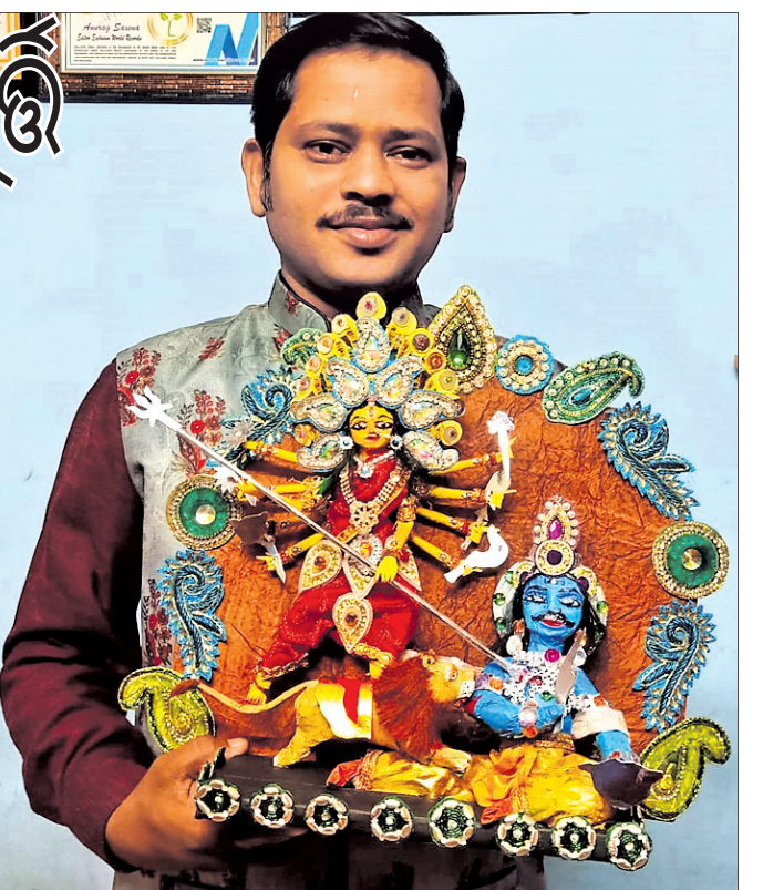
ସତ୍ୟଙ୍କ ଦ୍ୱାରା ନିର୍ମିତ ପ୍ରତିମୂର୍ତ୍ତି ।