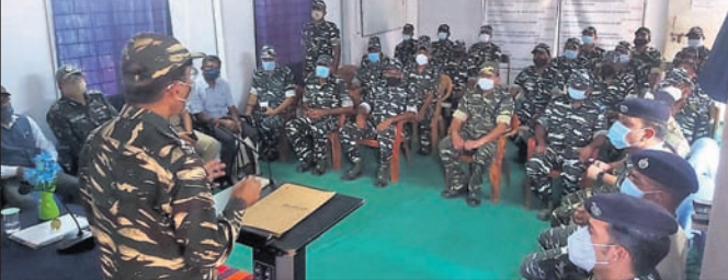
ଡିଜିପି ଅଭୟ ଆଲୋଚନା କରୁଛନ୍ତି ।