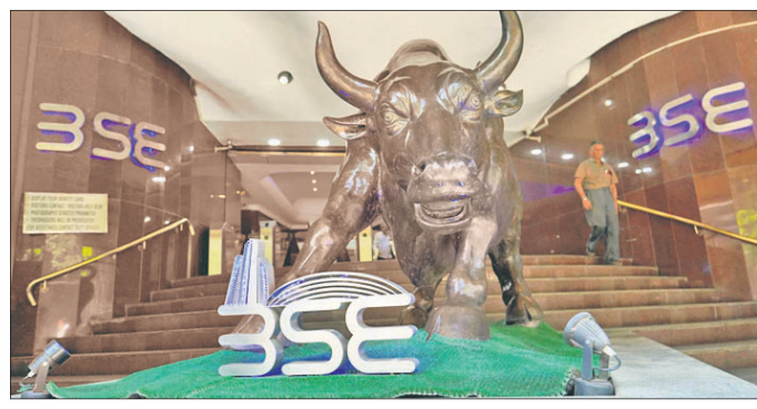
ହୋଇଥିଲା। ଲଗାତାର ୫ ଦିନ ହେବ ପୁଞ୍ଜି ବଜାର ଉଚ୍ଚରେ ରହିଛି। ଏହା ପୂର୍ବରୁ ସେନ୍‌ସେକ୍ସ ୬୦.୬୧୯ ପଏଣ୍ଟ ଏବଂ ନିଏଫ୍ ୧୮.୦୯୬ ପଏଣ୍ଟରେ ବନ୍ଦ ହୋଇଥିଲା। ୩୦ ଶେୟାର ସୁଚକାଙ୍କ ବିଶିଷ୍ଟ ୧୮.୨୩୭ ପଏଣ୍ଟ ସ୍ତରରେ ଛୁଇଁବାକୁ ସମର୍ଥନ ଦେଇଥିଲା।

ଲଗାତାର ତୃତୀୟ ଦିନ ଲାଗି ଭାରତୀୟ ପୁଞ୍ଜି ବଜାରର କାରବାର ଉର୍ଦ୍ଧ୍ୱଗାମୀ ରହିଛି। ରୁଧିରୀ ବସେ ଷ୍ଟକ ଏକ୍ସଚେଞ୍ଜ(ବିଏସ୍‌ଏ) ସେନ୍‌ସେକ୍ସ ୪୫୨ ପଏଣ୍ଟ ଉର୍ଦ୍ଧ୍ୱରେ ରହି ୬୦.୭୩୭ ପଏଣ୍ଟ ସ୍ତରରେ ବନ୍ଦ ହୋଇଛି। ସେହିଭଳି ନ୍ୟାଶନାଲ ଷ୍ଟକ ଏକ୍ସଚେଞ୍ଜ(ନିଏଫ୍) ୧୭୦ ପଏଣ୍ଟ ଉର୍ଦ୍ଧ୍ୱରେ ରହି ୧୮.୧୬୨ ପଏଣ୍ଟ ସ୍ତରରେ ବନ୍ଦ ହୋଇଛି। ବସେ ଷ୍ଟକ ଏକ୍ସଚେଞ୍ଜ (ବିଏସ୍‌ଏ) ସୁପାର୍‌କ୍ୟୁ କମ୍ପାନୀଗୁଡ଼ିକର ବଜାର ପୁଞ୍ଜିକରଣ ୨୭୧ ଲକ୍ଷ କୋଟି ଟଙ୍କା ଛୁଇଁଛି। ରୁଧିରୀ ସେନ୍‌ସେକ୍ସ ୬୦.୮୩୭ ପଏଣ୍ଟ ସ୍ତରରେ ଛୁଇଁଥିବା ବେଳେ ନିଏଫ୍ ୧୮.୨୩୭ ପଏଣ୍ଟ ସ୍ତରରେ ଛୁଇଁବାକୁ ସମର୍ଥନ ଦେଇଥିଲା। ଲଗାତାର ୫ ଦିନ ହେବ ପୁଞ୍ଜି ବଜାର ଉଚ୍ଚରେ ରହିଛି। ଏହା ପୂର୍ବରୁ ସେନ୍‌ସେକ୍ସ ୬୦.୬୧୯ ପଏଣ୍ଟ ଏବଂ ନିଏଫ୍ ୧୮.୦୯୬ ପଏଣ୍ଟରେ ବନ୍ଦ ହୋଇଥିଲା। ୩୦ ଶେୟାର ସୁଚକାଙ୍କ ବିଶିଷ୍ଟ ୧୮.୨୩୭ ପଏଣ୍ଟ ସ୍ତରରେ ଛୁଇଁବାକୁ ସମର୍ଥନ ଦେଇଥିଲା। ଲଗାତାର ୫ ଦିନ ହେବ ପୁଞ୍ଜି ବଜାର ଉଚ୍ଚରେ ରହିଛି। ଏହା ପୂର୍ବରୁ ସେନ୍‌ସେକ୍ସ ୬୦.୬୧୯ ପଏଣ୍ଟ ଏବଂ ନିଏଫ୍ ୧୮.୦୯୬ ପଏଣ୍ଟରେ ବନ୍ଦ ହୋଇଥିଲା। ୩୦ ଶେୟାର ସୁଚକାଙ୍କ ବିଶିଷ୍ଟ ୧୮.୨୩୭ ପଏଣ୍ଟ ସ୍ତରରେ ଛୁଇଁବାକୁ ସମର୍ଥନ ଦେଇଥିଲା।