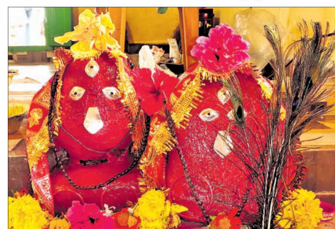
ସାଇ ବିହାର ମା' କାଳୁଆ ପୁରାତନ ମୂର୍ତ୍ତି ।

ସେବେଠାରୁ ମନ୍ଦିରକୁ ଶ୍ରଦ୍ଧାଳୁଙ୍କ ଆଗମନ ଓ ଦେବାଙ୍କ ପୂଜାର୍ଚ୍ଚନା ସମ୍ପୂର୍ଣ୍ଣ ବନ୍ଦ ରହିଥିଲା । ସମୟ ପ୍ରବାହ ସହ ନିମଖଣ୍ଡି ଅଞ୍ଚଳବାସୀ କିଛି ଦୂରରେ ବସତି ସ୍ଥାପନ କରିଥିଲେ । କେବଳ ଚୈତ୍ର ମଙ୍ଗଳବାର ଗାଁର ମହିଳା ଓ ପୁରୁଷ ଅନତି ଦୂରରେ ପଶାପାଣି ମା'ଙ୍କୁ ଅର୍ପଣ କରୁଥିଲେ । ଚଳିତ ବର୍ଷ ନବରାତ୍ର ଅରମ୍ଭରୁ ସାଇବିହାର ବାସିନ୍ଦା ଏକତ୍ରିତ ହୋଇ ପୁଣିଥରେ ମା'ଙ୍କ ପୂଜାର୍ଚ୍ଚନା ନିମନ୍ତେ ମନସ୍ଥ କରି ଏକକ୍ରମେ ହୋଇଥିଲେ । ସାହିର ପ୍ରାୟ ୩୦ ପରିବାର ମିଳିମିଶି ପରିତ୍ୟକ୍ତ ମନ୍ଦିରକୁ ପୁନଃ ନିର୍ମାଣ ସହ ଆବର୍ଜନା ସଫା କରିଥିଲେ ।