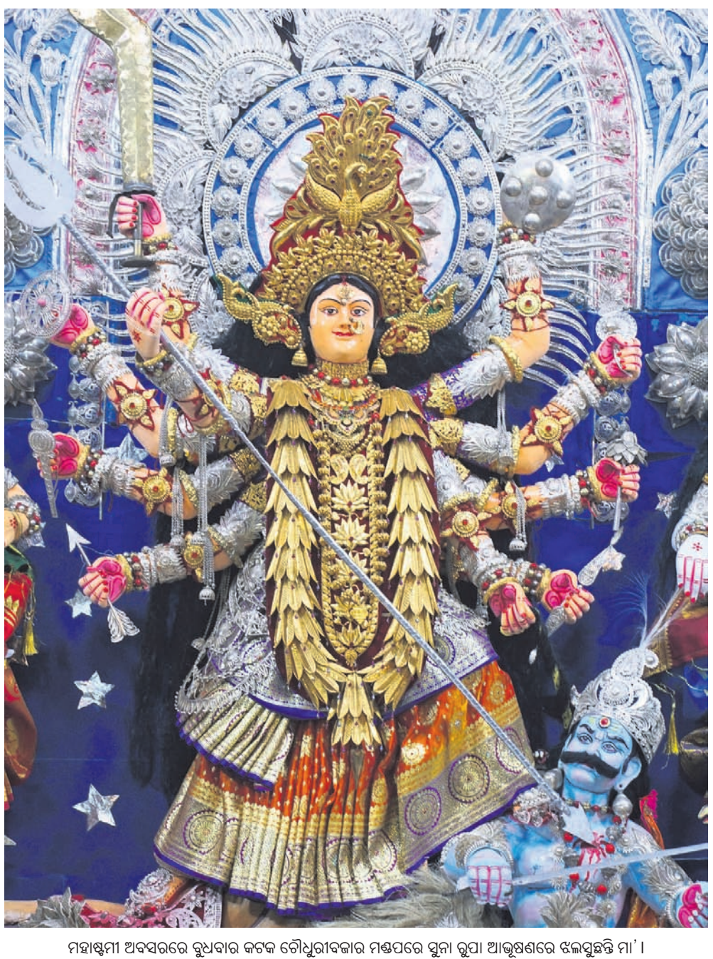
ମହାଶ୍ୱନୀ ଅବସରରେ ବୁଧବାର କଟକ ଚୌଧୁରୀବଜାର ମଣ୍ଡପରେ ପୁନା ରୂପା ଆଭୂଷଣରେ ଝଲସୁଇଚି ମା' ।