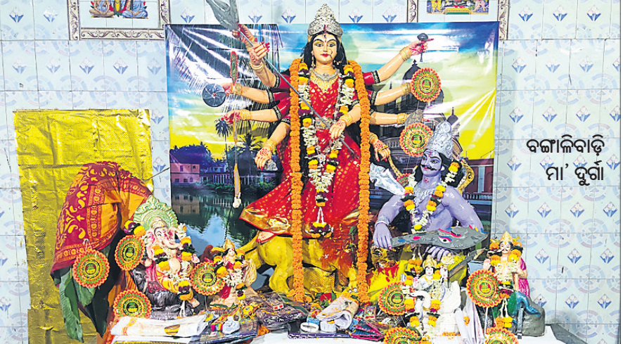
ବଙ୍ଗାଳିବାଡ଼ି ମା' ଦୁର୍ଗା

ବ୍ରହ୍ମପୁର ସହରରେ ସର୍ବପ୍ରଥମେ ୧୯୩୪ରେ ଦୁର୍ଗାପୂଜା ବଙ୍ଗାଳି ସମ୍ପ୍ରଦାୟ ଲୋକଙ୍କ ଦ୍ଵାରା ଷ୍ଟେଶନ ନିକଟରେ ଆରମ୍ଭ ହୋଇଥିଲା। ତଳିତ ବର୍ଷ ଏହି ପୂଜାକୁ ୮୮ ବର୍ଷ ହୋଇଛି। ସହରବାସୀଙ୍କ ନିକଟରେ ଏହା ବଙ୍ଗାଳିବାଡ଼ି ଦଶହରା ଭାବେ ପରିଚିତ। ଅନେକ କାରଣରୁ ଏହି ପୂଜା ମଣ୍ଡପ ସ୍ଥାନାନ୍ତର ହୋଇଥିଲା। ଷ୍ଟେଶନରୁ ଖଲିକୋଟ କଲେଜ ପଡ଼ିଆ ଏବଂ ପରେ ପୁରୁଣା ବ୍ୟସ୍ତାକ ନିକଟ ଚାଟାଣୀ କଲୋନୀକୁ ଯାଇଥିଲା। ୧୯୫୩ଠାରୁ ବର୍ତ୍ତମାନ ଯାଏ ସହରର ପ୍ରାୟ ୩୦୦ରୁ ଊର୍ଦ୍ଧ୍ଵ ବଙ୍ଗାଳି ପରିବାର ଚାଟାଣୀ କଲୋନୀସ୍ଥିତ ସଭାଗୃହରେ ପ୍ରତିବର୍ଷ ଦଶହରା ଉତ୍ସାହର ସହ ପାଳନ କରିଆସୁଛନ୍ତି। କିନ୍ତୁ ତଳିତ ବର୍ଷ ପାର୍ବଣ ଗାଳତ୍ ଲାଜତ୍ ଓ କଟକଣା ଯୋଗୁ ବଙ୍ଗାଳିବାଡ଼ି ଦୁର୍ଗା ପୂଜାର ବହୁ ପୁରାତନ ପରମ୍ପରା ଓ ସଂସ୍କୃତି ପ୍ରଭାବିତ ହୋଇଛି।