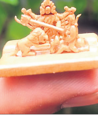
ଦିଲୀପଙ୍କ ଦ୍ୱାରା ନିର୍ମିତ ପ୍ରତିମୂର୍ତ୍ତି ।