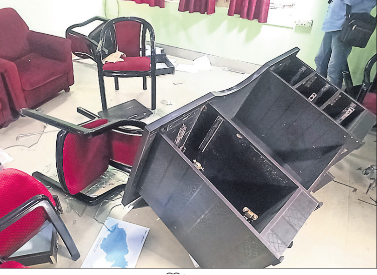
ସୁବ କଂଗ୍ରେସ ସଭାପତିଙ୍କ କାର୍ଯ୍ୟାଳୟରେ ଚେରା, ଚେରୁଳ ଭଙ୍ଗାଚୁରା ହୋଇ ପଡ଼ିଛି ।