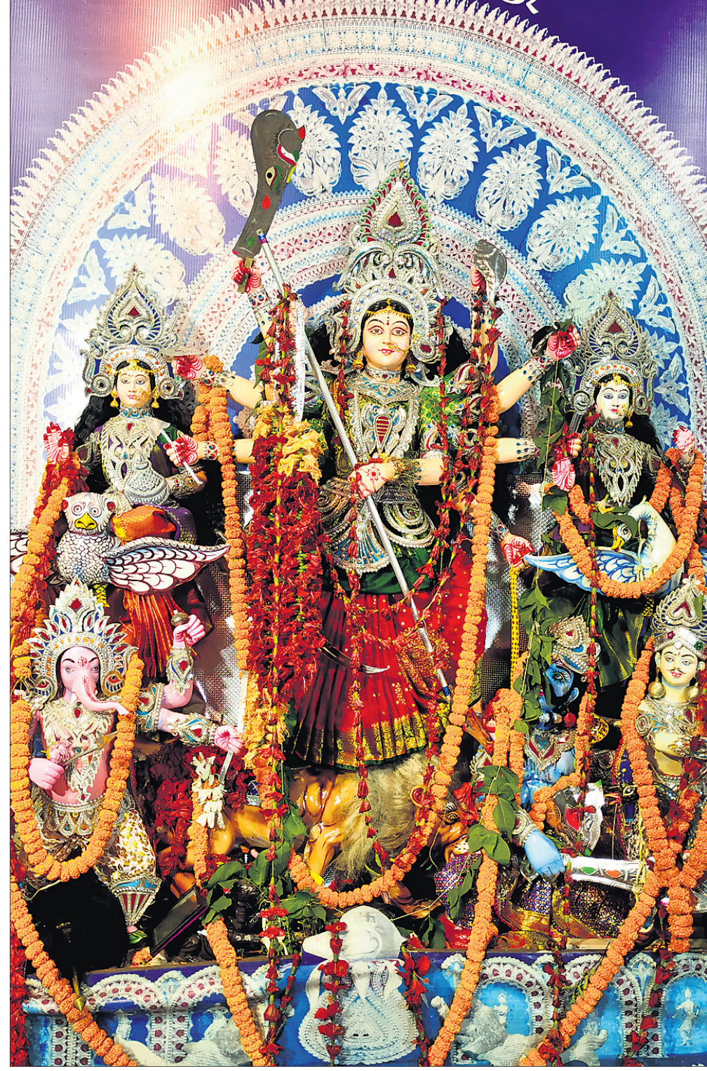
କଟକ ଗଙ୍ଗା ମନ୍ଦିର ମଣ୍ଡପରେ ପୂଜା ପାଉଛନ୍ତି ମା'। ଫଟୋ: ରାଜକିଶୋର ମହାନ୍ତି

ପ୍ରତିବର୍ଷ ପୂଜା ନିମନ୍ତେ ପ୍ରାୟ ସାଢ଼େ ୩ଲକ୍ଷର ବଜେଟ୍ ହୋଇଥାଏ। ସର୍ବବର୍ଷ ପୂଜା ୧୫ ଦିନ ପୂର୍ବରୁ କୋଲକାତାରୁ କାରିଗର ଆସି ମୂର୍ତ୍ତି ପ୍ରସ୍ତୁତ କରୁଥିଲେ। ଆରମ୍ଭରୁ ୯ ଦିନ ଯାଏ ନିୟମିତ ପ୍ରସାଦ ସେବନ, ସନ୍ଧ୍ୟାରେ ସାଂସ୍କୃତିକ କାର୍ଯ୍ୟକ୍ରମ ହେଉଥିଲା। କିନ୍ତୁ ଏବର୍ଷ ମା'ଙ୍କ ମୂର୍ତ୍ତି ବ୍ରହ୍ମପୁର ଗେଟ୍ ବଜାରରୁ କିଣାଯାଇଛି। ପୂଜା ନିମନ୍ତେ ମାତ୍ର ୭୦ ହଜାର ଟଙ୍କା ବଜେଟ୍ ଧାର୍ଯ୍ୟ ହୋଇଛି। ସଭାଗୃହ ମଣ୍ଡପରେ ମା'ଙ୍କୁ ସ୍ଥାପନ କରାଯାଇଛି। କିନ୍ତୁ ସାଜସଜ୍ଜା କରାଯାଇନାହିଁ। ଶ୍ରଦ୍ଧାଳୁଙ୍କ ପ୍ରବେଶକୁ ବାରଣ କରାଯାଇଛି। କଟକଣା ଯୋଗୁ ଦଶମୀ ଦିନ ହେଉଥିବା ସିନ୍ଦୂର ଖେଳ ଫିକା ପଡ଼ିବ। ମାତ୍ର ୪ ରୁ ୫ ଜଣ ସଦସ୍ୟଙ୍କ ମଧ୍ୟରେ ଏହି ଖେଳ ଅନୁଷ୍ଠିତ ବୋଲି ପୂଜା କମିଟି ସମ୍ପାଦକ ସରୋଜିତ ସରକାର କହିଛନ୍ତି। - ଡକ୍ଟର ନାହାକ, ଫଟୋ-ସମ୍ପାଦକ ରଥ, ବ୍ରହ୍ମପୁର