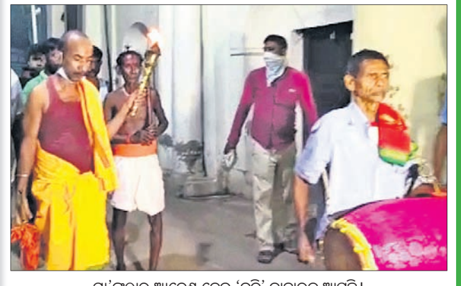
ମା'ଙ୍କଠାରୁ ଆଦେଶ ନେଇ 'ବଳି' ବାହାରକୁ ଆସୁଛି।