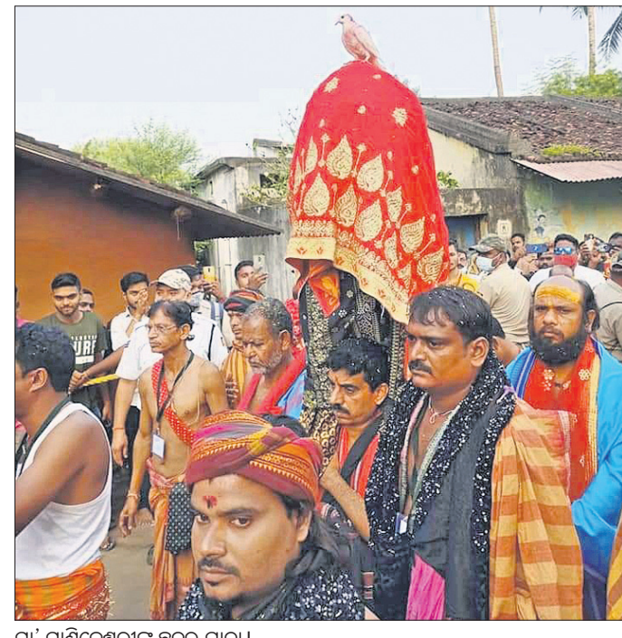
ମା' ମାଣିକେଶ୍ୱରୀଙ୍କ ଛତର ଯାତ୍ରା ।

କଳାହାଣ୍ଡି ଜିଲ୍ଲାର ଅଧିଷ୍ଠାତ୍ରୀ ଦେବୀ ଭବାନୀପାଟଣାସ୍ଥିତ ମା' ମାଣିକେଶ୍ୱରୀଙ୍କ ପ୍ରସିଦ୍ଧ ଛତର ଯାତ୍ରା ରୁଧିର ରାତି ଚୋରା ଚାଲିଛି । ଗତବର୍ଷ କରୋନା କଟକଣା ଯୋଗୁ ଭଲ୍ଲମାନେ ମା'ଙ୍କ ଦର୍ଶନକୁ ବଞ୍ଚିତ ହୋଇଥିଲେ । ଚଳିତବର୍ଷ ସେଥିରେ କିଛି କୋହଳ କରାଯାଇଥିବା ଦେଖିବାକୁ ମିଳୁଥିଲା । କରୋନା କଟକଣା ଓ ଜିଲ୍ଲା ପ୍ରଶାସନର ୧୪୪ ଧାରା ସହ ବ୍ୟାରିକେଡ଼ ଆରପାରିରେ ରହି ଭଲ୍ଲମାନେ ମା'ଙ୍କ ଯାତ୍ରା ଦେଖିଥିଲେ । ଭଲ୍ଲଙ୍କ ଆବେଗ ଓ ମାନସିକ ଆଗରେ ଶେଷରେ ପ୍ରଶାସନ ବି ହାର୍ ମାରିଲା । ୧୪୪ ଧାରା ପରିସର ବାହାରେ ରହି ଭଲ୍ଲମାନେ ନିଜ ମାନସିକ ପୂରଣ ପାଇଁ ହଜାର ହଜାର ସଂଖ୍ୟାରେ ବୋଦା, କୁକୁଡ଼ା ଆଦି ବଳି ଦେଇଥିଲେ । ସେହିପରି ଶାନ୍ତିର ପ୍ରତୀକ କପୋତ (ପାରା)କୁ ମଧ୍ୟ ଅନେକ ଭଲ୍ଲ ଯାତ୍ରା ସମୟରେ ଉଡ଼ାଉଥିବା ଦେଖିବାକୁ ମିଳୁଥିଲା । ବଳି ଯୋଗୁ ଜେନାଖାଲିଠାରୁ ମିନିର ଯାଏ ପ୍ରାୟ ୩ କି.ମି. ରତ୍ନ ରଞ୍ଜିତ ହୋଇଥିଲା । ରୁଧିର ରାତି ୪୫ ମିନିଟରେ ଜେନାଖାଲିରେ ମା' ମାଣିକେଶ୍ୱରୀଙ୍କୁ ଗୁପ୍ତ ପୂଜାର୍ଚ୍ଚନା ପରେ