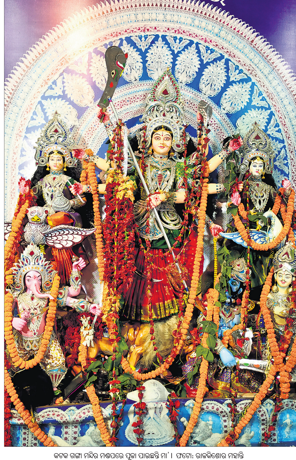
କଟକ ରାଜା ମନ୍ଦିର ମଣ୍ଡପରେ ପୂଜା ପାଉଛନ୍ତି ମା'।