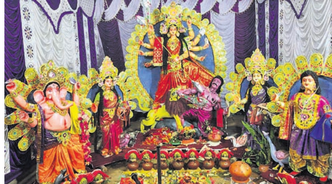
ଚିତ୍ରକୋଣ୍ଡା ଅଞ୍ଚଳରେ ଦୁଇଟି ସ୍ଥାନରେ ହୋଇଥିବା ପୂଜାମଣ୍ଡପ ।