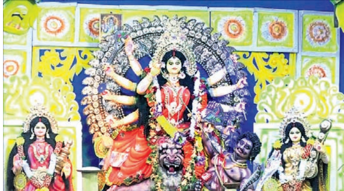
ମାଲକାନଗିରି ତେଲି ମାକେଟରେ ମା'ଙ୍କ ଅଷ୍ଟମୀ ପୂଜା ।