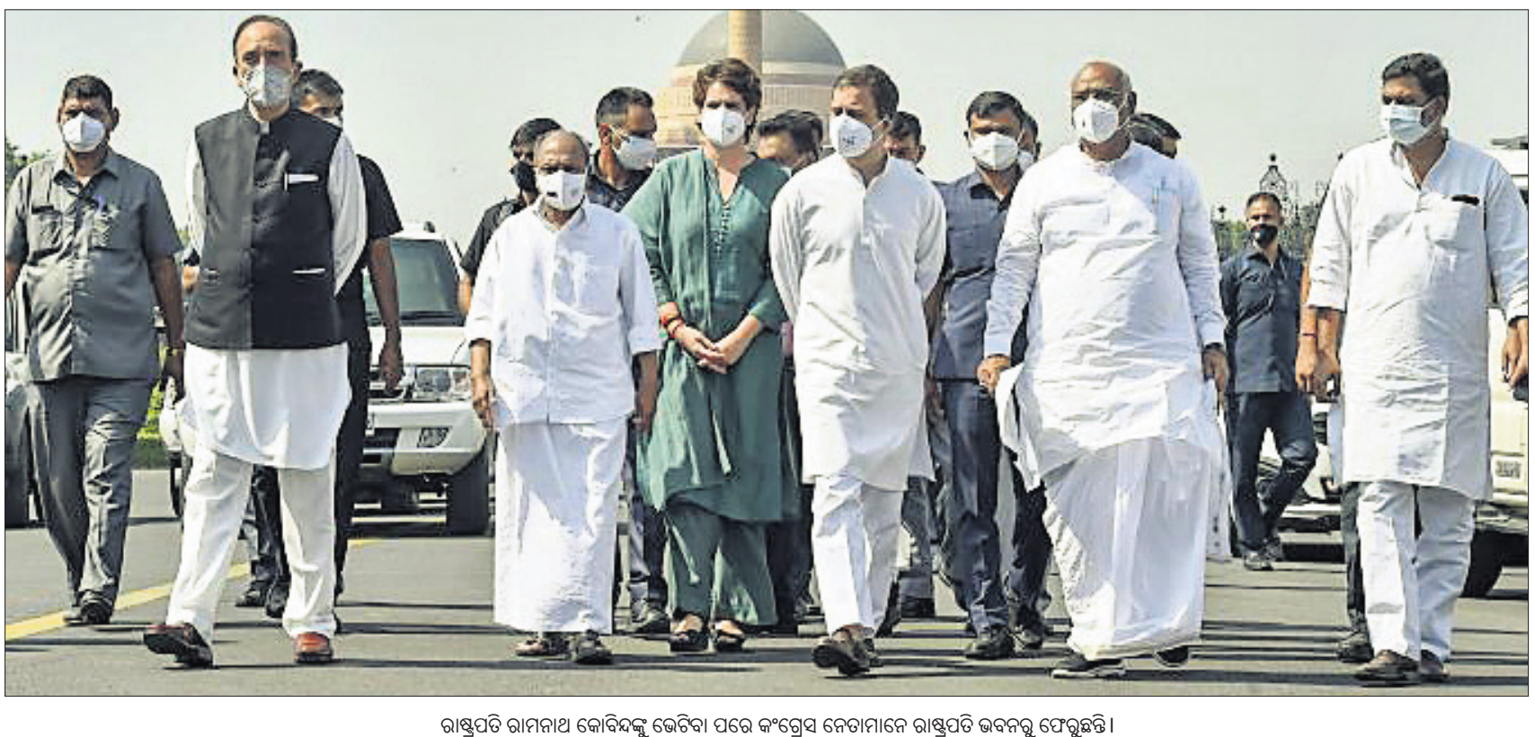
ରାଷ୍ଟ୍ରପତି ରାମନାଥ କୋବିନ୍ଦଙ୍କୁ ଭେଟିବା ପରେ କଂଗ୍ରେସ ନେତାମାନେ ରାଷ୍ଟ୍ରପତି ଭବନକୁ ଫେରୁଛନ୍ତି ।