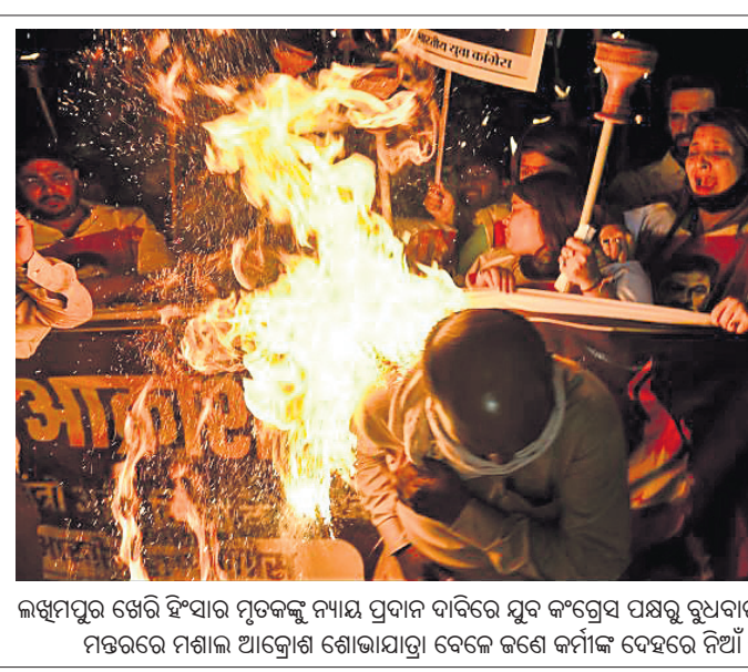
ଲକ୍ଷ୍ମଣପୁର ଖେରି ହିଂସାର ମୃତକଙ୍କୁ ନ୍ୟାୟ ପ୍ରଦାନ ଦାବିରେ ଯୁବ କଂଗ୍ରେସ ପକ୍ଷରୁ ରୁଧିବାର ନୂଆଦିଲ୍ଲୀର ଯତ୍ନ ମନ୍ତରରେ ମଣ୍ଡଳ ଆକ୍ରୋଶ ଶୋଭାଯାତ୍ରା ବେଳେ ଜଣେ କର୍ମୀଙ୍କ ଦେହରେ ନିଆଁ ଲାଗିଯାଇଛି ।

ବୋଷ୍ଟନ, ୧୩।୧୦ ହୃଦିତ ଲକ୍ଷ୍ମଣପୁର ଖେରି ହିଂସା ଅତ୍ୟନ୍ତ ନିନ୍ଦନୀୟ ବୋଲି ଆମେରିକା ଗସ୍ତରେ ଥିବା ଅର୍ଥମନ୍ତ୍ରୀ ନିର୍ମଳା ସୀତାରାମନ କହିଛନ୍ତି । ହାତୀର କେନ୍ଦେଡ଼ି ସ୍ଥଳରେ ଏକ କଥୋପକଥନ କାର୍ଯ୍ୟକ୍ରମ ବେଳେ ମଙ୍ଗଳବାର ସୀତାରାମନଙ୍କୁ ଲକ୍ଷ୍ମଣପୁର ହିଂସା ସମ୍ପର୍କରେ ପ୍ରଶ୍ନ କରାଯାଇଥିଲା । ଏହାର ଉତ୍ତରରେ ସେ କହିଥିଲେ, ଏକଜି ଘଟଣା ଭାରତର ଅନ୍ୟ ଭାଗରେ ମଧ୍ୟ ଘଟୁଛି । ତେବେ ହୃଦିତ ଭାଜପା ସରକାର ଥିବାରୁ ଏହି ପ୍ରସଙ୍ଗ ଉଠାଇବା ପାଇଁ ଅନ୍ୟମାନଙ୍କୁ ସୂଚିବା ହେଉଛି । ଏହାକୁ ନେଇ ସେ ଆମ୍ଭେମାନଙ୍କ ପାଇଁ ମତ୍ତବ୍ୟ ଦେବେ ନାହିଁ ।