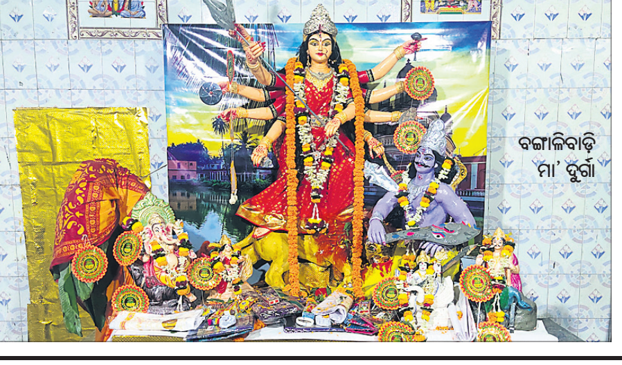
ବଙ୍ଗାଳିବାଡ଼ି ମା' ଦୁର୍ଗା

ବ୍ରହ୍ମପୁର ସହରରେ ସର୍ବପ୍ରଥମେ ୧୯୩୪ରେ ଦୁର୍ଗାପୂଜା ବଙ୍ଗାଳି ସମ୍ପ୍ରଦାୟ ଲୋକଙ୍କ ଦ୍ଵାରା ଷ୍ଟେଶନ ନିକଟରେ ଆରମ୍ଭ ହୋଇଥିଲା। ଚଳିତ ବର୍ଷ ଏହି ପୂଜାକୁ ୮୮ ବର୍ଷ ହୋଇଛି। ସହରବାସୀଙ୍କ ନିକଟରେ ଏହା ବଙ୍ଗାଳିବାଡ଼ି ଦଶହରା ଭାବେ ପରିଚିତ। ଅନେକ କାରଣରୁ ଏହି ପୂଜା ମଣ୍ଡପ ସ୍ଥାନାନ୍ତର ହୋଇଥିଲା। ଷ୍ଟେଶନରୁ ଖଲିକୋଟ କଲେଜ ପଡ଼ିଆ ଏବଂ ପରେ ପୁରୁଣା ବ୍ୟସ୍ତାକ୍ଷ ନିକଟ ଚାଟାଗାଁ କଲୋନୀକୁ ଯାଇଥିଲା। ୧୯୫୩ଠାରୁ ବର୍ତ୍ତମାନ ଯାଏ ସହରର ପ୍ରାୟ ୩୦୦ରୁ ଊର୍ଦ୍ଧ୍ଵ ବଙ୍ଗାଳି ପରିବାର ଚାଟାଗାଁ କଲୋନୀସ୍ଥିତ ସଭାଗୃହରେ ପ୍ରତିବର୍ଷ ଦଶହରା ଉତ୍ସାହର ସହ ପାଳନ କରିଆସୁଛନ୍ତି। କିନ୍ତୁ ଚଳିତ ବର୍ଷ ପାର୍ବଣ ଗାଳନ୍ଦ୍ ଲାଲନ୍ ଓ କଟକଣା ଯୋଗୁ ବଙ୍ଗାଳିବାଡ଼ି ଦୁର୍ଗା ପୂଜାର ବହୁ ପୁରାତନ ପରମ୍ପରା ଓ ସଂସ୍କୃତି ପ୍ରଭାବିତ ହୋଇଛି। ପ୍ରତିବର୍ଷ ପୂଜା ନିମନ୍ତେ ପ୍ରାୟ ସାଢ଼େ ୩ଲକ୍ଷର ବଜେଟ୍ ହୋଇଥାଏ। ସବୁବର୍ଷ ପୂଜା ୧୫ ଦିନ ପୂର୍ବରୁ କୋଲକାତାରୁ କାରିଗର ଆସି ମୂର୍ତ୍ତି ପ୍ରସ୍ତୁତ କରୁଥିଲେ। ଆରମ୍ଭରୁ ୯ ଦିନ ଯାଏ ନିୟମିତ ପ୍ରସାଦ ସେବନ, ସନ୍ଧ୍ୟାରେ ସାଂସ୍କୃତିକ କାର୍ଯ୍ୟକ୍ରମ ହେଉଥିଲା। କିନ୍ତୁ ଏବର୍ଷ ମା'ଙ୍କ ମୂର୍ତ୍ତି ବ୍ରହ୍ମପୁର ଗେଟ୍ ବଜାରରୁ କିଣାଯାଇଛି। ପୂଜା ନିମନ୍ତେ ମାତ୍ର ୭୦ ହଜାର ଟଙ୍କା ବଜେଟ୍ ଧାର୍ଯ୍ୟ ହୋଇଛି। ସଭାଗୃହ ମଣ୍ଡପରେ ମା'ଙ୍କୁ ସ୍ଥାପନ କରାଯାଇଛି। କିନ୍ତୁ ସାଜସଜ୍ଜା କରାଯାଇନାହିଁ। ଶ୍ରଦ୍ଧାଳୁଙ୍କ ପ୍ରବେଶକୁ ବାରଣ କରାଯାଇଛି। କଟକଣା ଯୋଗୁ ଦଶମୀ ଦିନ ହେଉଥିବା ସିନ୍ଦୂର ଖେଳ ଫିକା ପଡ଼ିବ। ମାତ୍ର ୪ ରୁ ୫ ଜଣ ସଦସ୍ୟଙ୍କ ମଧ୍ୟରେ ଏହି ଖେଳ ଅନୁଷ୍ଠିତ ବୋଲି ପୂଜା କମିଟି ସମ୍ପାଦକ ସରୋଜିତ ସରକାର କହିଛନ୍ତି। -ତନ୍ତୁଗ୍ରୀ ନାହାକ, ଫଟୋ-ସମୀର ରଥ, ବ୍ରହ୍ମପୁର