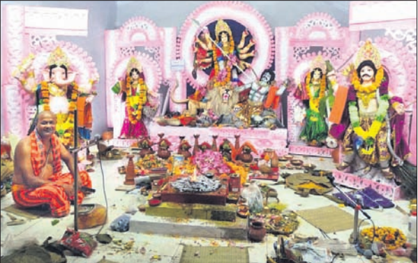
କୋରାପୁଟ ଓଏସ୍‌ପିଠାରେ ହୋଇଥିବା ପୂଜାମଣ୍ଡପ ।