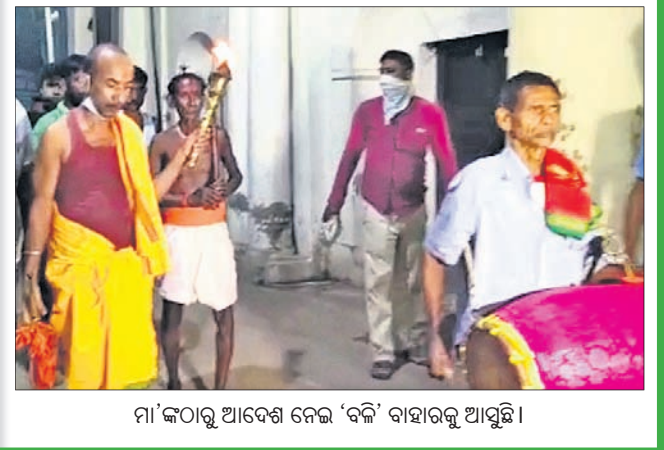
ମା'ଙ୍କଠାରୁ ଆଦେଶ ନେଇ 'ବଳି' ବାହାରକୁ ଆସୁଛି।