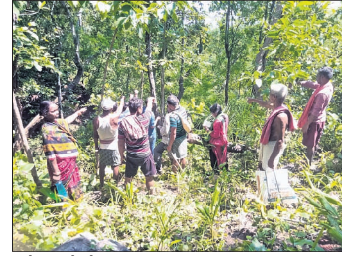
ସବୁଜିମାରେ ପୁରି ରହିଥିବା ଜଙ୍ଗଲ।

ଅରୁଣ୍ୟାଠାରୁ ସୂଚନା ମିଳିବା ପରେ ଗତ ୩ ବର୍ଷ ତଳେ ଗ୍ରାମବାସୀ ଏକ ବୈଠକ ଡାକିଥିଲେ। ଉକ୍ତ ବୈଠକର ନିଷ୍ପତ୍ତି ଅନୁଯାୟୀ ଗାଁ ଲୋକେ ଜଙ୍ଗଲ ଜରିବାକୁ ସ୍ଥିର କଲେ। ପ୍ରାୟ ୪ମାସ ପର୍ଯ୍ୟନ୍ତ ୨୦ରୁ ଊର୍ଦ୍ଧ୍ୱ ଲୋକ ଜଙ୍ଗଲକୁ ଜରିଲେ। ପରେ ପ୍ରତିଦିନ ୨ଜଣ ଲୋକ ଜଙ୍ଗଲ ଜରିଲେ। ହେଲେ ଗ୍ରାମବାସୀଙ୍କ ଏପରି ପଦକ୍ଷେପକୁ କାଠିମାଟିଆ ଓ ଶିଖାରୀମାନେ ସହଜରେ ଗ୍ରହଣ କରି ପାରି ନ ଥିଲେ। ଏହାକୁ ନେଇ ସେମାନେ ଗାଁରେ ଗଣଗୋଳ କରିବା ସହ କେତେଜଣଙ୍କୁ ମାର୍ଡ଼ିପି କରିବାକୁ ପଛାଇ ନ ଥିଲେ। ଆଦିବାସୀ ଲୋକେ ସେମାନଙ୍କୁ ରୁଦ୍ଧାଶୁଖି କରି ଜଙ୍ଗଲକୁ ସୁରକ୍ଷା ଦେଲେ। ଇତିମଧ୍ୟରେ ମାସ ବର୍ଷ ବିତିଛି। ଦିନେ ଯେଉଁ ଜଙ୍ଗଲ ବୃକ୍ଷ ଓ ଜୀବଜନ୍ତୁମାନଙ୍କ ହୋଇ ଆସୁଥିଲା,