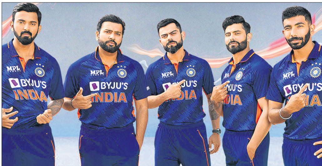
ଟି୨୦ ବିଶ୍ୱକପ୍ ପାଇଁ ପ୍ରସ୍ତୁତ କରାଯାଇଥିବା ଭାରତୀୟ ଦଳର ଖେଳାଳିମାନେ।

ଆଉ ୩ ଦିନ ପରେ ଆରମ୍ଭ ହେବାକୁ ଯାଉଥିବା ଟି୨୦ ବିଶ୍ୱକପ୍ ପାଇଁ ଭାରତୀୟ କ୍ରିକେଟ ଦଳର ନୂଆ ଜର୍ସି କୁଧର ଉନ୍ମୋଚିତ ହୋଇଛି। ଦୁଇଦିନ ପୂର୍ବରୁ ଉନ୍ମୋଚିତ ହୋଇଥିବା ଟି୨୦ ପ୍ରଥମ ମ୍ୟାଚ୍ ପାଇଁ ଉନ୍ମୋଚିତ ହୋଇଥିବା ଟି୨୦ ବିଶ୍ୱକପ୍ ଜର୍ସି ସହ ମେଲ ଖାଉଥିଲା। ଏହି ନୂଆ ଜର୍ସି ନେଇ ସ୍ଥୁର ଉନ୍ମୋଚିତ। ଏହା ଭାରତୀୟ କ୍ରିକେଟ କଣ୍ଠେଇ ବୋର୍ଡ (ବିସିଆଇ) ଦ୍ୱାରା ଉନ୍ମୋଚିତ କରାଯାଇଛି। ଟି୨୦ ବିଶ୍ୱକପ୍