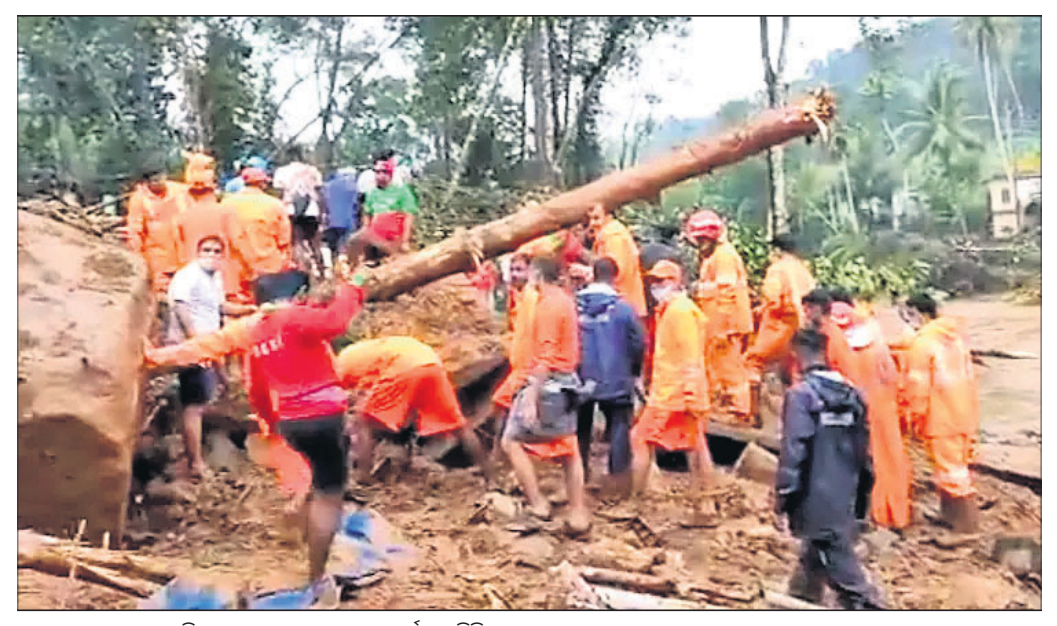
ଭୂସ୍ଥଳନ ସ୍ଥାନରେ ଏନ୍ଡିଆରଏଫ୍ ପକ୍ଷରୁ ଉଦ୍ଧାର କାର୍ଯ୍ୟ ଚାଲିଛି।

କେରଳରେ ଶୁକ୍ରବାରଠାରୁ ପ୍ରବଳ ବର୍ଷା ଲାଗିରହିଥିବାବେଳେ ବନ୍ୟା ଓ ଭୂସ୍ଥଳନରେ ୩ ଶିଖର ସମେତ ୨୬ ଜଣଙ୍କ ଜୀବନ ଗଲାଣି। କେବଳ କୋଟାୟାମ ଜିଲ୍ଲାରେ ୧୩ ଜଣଙ୍କ ମୃତ୍ୟୁ ଘଟିଥିବାବେଳେ ଇଡୁକିରେ ୯ ଏବଂ ଆଲପୁଷା ଜିଲ୍ଲାରେ ୪ ଜଣଙ୍କର ମୃତ୍ୟୁ ହୋଇଛି। କୁଟ୍ଟାଳରେ ଭୂସ୍ଥଳନରେ କୋଠା ଭୁକ୍ତି ପଡିବାକୁ ଗୋଟିଏ ପରିବାରର ୬ ଜଣଙ୍କ ମୃତ୍ୟୁ ହୋଇଥିଲା। ସେମାନଙ୍କ ମଧ୍ୟରୁ ୩ ଜଣଙ୍କ ମୃତଦେହ ଶନିବାର ମିଳିଥିବାବେଳେ ରବିବାର ଅନ୍ୟ ୩ ଜଣଙ୍କ ମୃତଦେହ ଠାବ କରାଯାଇଛି। ଉଦ୍ଧାର କାର୍ଯ୍ୟରେ ସେନାବାହିନୀ, ଏନ୍ଡିଆରଏଫ୍, ପୋଲିସ୍ ଏବଂ ଅଗ୍ନିଶମ କର୍ମଚାରୀଙ୍କୁ ନିୟୋଜିତ କରାଯାଇଛି। ସ୍ଥାନୀୟ ଲୋକେ ମଧ୍ୟ ଉଦ୍ଧାର କାର୍ଯ୍ୟରେ ସହାୟତା କରୁଛନ୍ତି। ଇଡୁକି ଜିଲ୍ଲାର କୋଟାୟାମ ଏବଂ କୋଟାୟାମ ଜିଲ୍ଲାର କୁଟ୍ଟାଳରେ ପ୍ରବଳ ବର୍ଷା ସାଙ୍ଗକୁ ଭୂସ୍ଥଳନ ହେବାରୁ ଅନେକ ଲୋକ ନିଖୋଜ ହୋଇଯାଇଛନ୍ତି। ମାଟି ଅତଡ଼ା ତଳୁ ନିଖୋଜ ଲୋକମାନଙ୍କୁ ଉଦ୍ଧାର କାର୍ଯ୍ୟ କରି ରହିଛି। ସାବରିମାଲା ମନ୍ଦିରକୁ ସୋମବାର ପର୍ଯ୍ୟନ୍ତ ଭକ୍ତମାନଙ୍କ ଲାଗି ବନ୍ଦ କରିଦିଆଯାଇଛି। ପାହାଡ଼ିଆ ଅଞ୍ଚଳକୁ ନ ଯାଇ ଘରେ ରହିବା ଲାଗି ଲୋକମାନଙ୍କୁ ପରାମର୍ଶ ଦିଆଯାଇଛି। ରବିବାର ସକାଳୁ ବର୍ଷାର ପରିମାଣ କମିଥିଲେ ମଧ୍ୟ ଲୋକଙ୍କ ଦୁର୍ଦ୍ଦଶା କମିନାହିଁ। ଅନେକ ଅଞ୍ଚଳ ଜଳାଶୁବ୍ଦ ରହିଥିବାବେଳେ