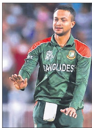
ଶକିବ ଅଲ୍ ହସନ

ଅଲ୍ ଅମରାଟ୍ (ଓମାନ), ୧୭୧୦ (ପି.ଟି.) ବାଂଲାଦେଶ ଅଲରାଉଉର ଶକିବ ଅଲ୍ ହସନ ରବିବାର ମୁଆ କାର୍ତ୍ତମାନ ଅର୍ଜନ କରିଛନ୍ତି। ଅନ୍ତର୍ଜାତୀୟ ଟି୨୦ କ୍ରମେ ସର୍ବାଧିକ ଉଇକେଟ