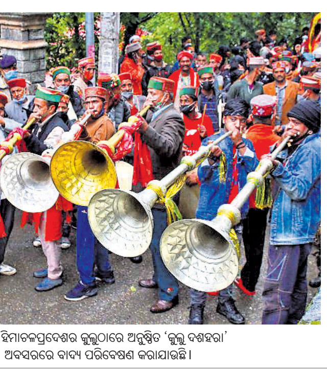
ହମାଚଳପ୍ରଦେଶର କୁଲୁଠାରେ ଅନୁଷ୍ଠିତ 'କୁଲୁ ଦଶହରା' ଅବସରରେ ବାଦ୍ୟ ପରିବେଷଣ କରାଯାଇଛି।