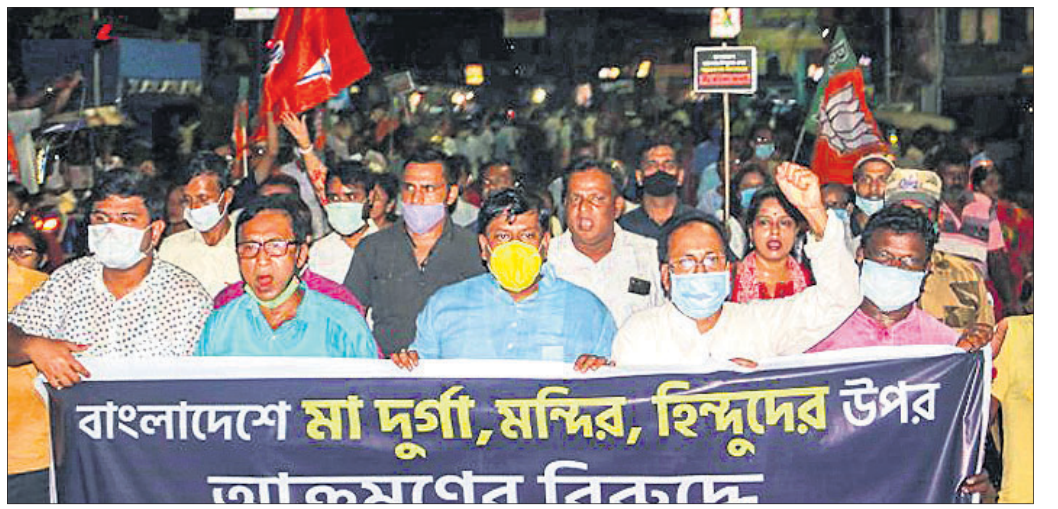
ବାଂଲାଦେଶରେ ହିନ୍ଦୁମନ୍ଦିର ଭଙ୍ଗାରୁଜା ପ୍ରତିବାଦରେ ପଶ୍ଚିମବଙ୍ଗର ଦକ୍ଷିଣ ଦିନାଜପୁରସ୍ଥିତ ବାଲୁରଘାବଠାରେ ବିକ୍ଷୋଭ ପ୍ରଦର୍ଶନ କରାଯାଇଛି।