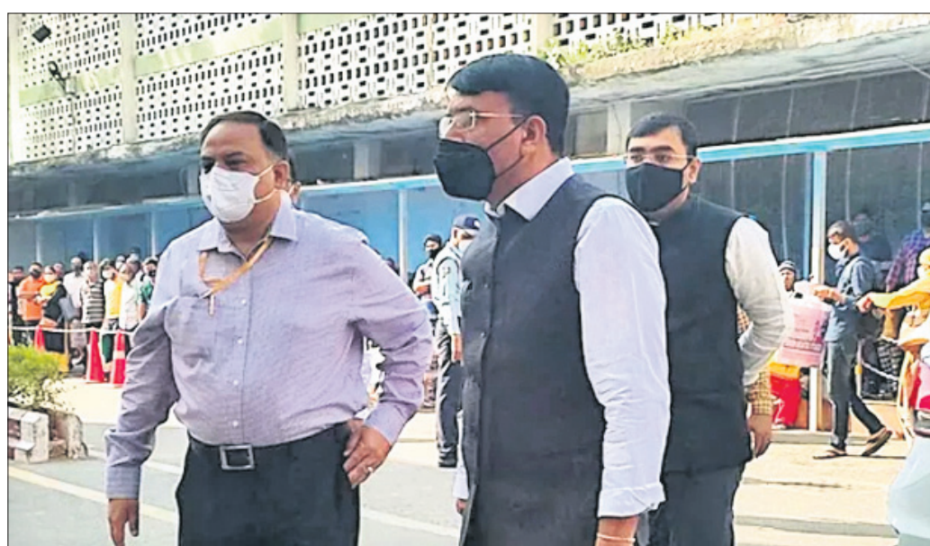
ଦିଲ୍ଲୀ ଏସ୍ତରେ ପୂର୍ବତନ ପ୍ରଧାନମନ୍ତ୍ରୀ ଡଃ ମନମୋହନ ସିଂଘ ଭେଟିବାକୁ ଯାଇଥିବା କେନ୍ଦ୍ର ସ୍ୱାସ୍ଥ୍ୟମନ୍ତ୍ରୀ ମାଣ୍ଡବ୍ୟ।

ଶିକ୍ଷା ମନ୍ତ୍ରାଳୟ ପ୍ରଥମେ ମହାବିଦ୍ୟାଳୟ, ପରେ ସ୍ୱୟଂଶାସିତ ମହାବିଦ୍ୟାଳୟ ଏବଂ ବର୍ତ୍ତମାନ ବିଶ୍ୱବିଦ୍ୟାଳୟରେ ପ୍ରତିଷ୍ଠିତ ହୋଇପାରିଛି। ଏହି ବିଶ୍ୱବିଦ୍ୟାଳୟକୁ ସୁସ୍ଥିର ପକ୍ଷରୁ ମାନ୍ୟତା ଦିଆଯିବା ସହ କେନ୍ଦ୍ରବିଦ୍ୟାଳୟ ତାଲିକାରେ ଅନ୍ତର୍ଭୁକ୍ତ କରାଯାଇଛି। ଏହା ନିଶ୍ଚିତ ଭାବେ ପଶ୍ଚିମ ଓଡ଼ିଶାର ଛାତ୍ରଛାତ୍ରୀଙ୍କ ଆଶା ଓ ଆଶାକୁ ପୂରଣ କରିବାର ବିଶେଷ ସହାୟକ ହେବ।