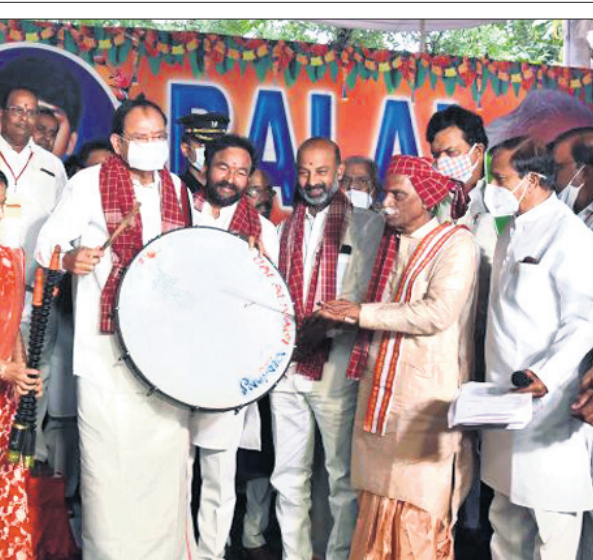
ହାଇଦ୍ରାବାଦରେ ଦଶହରା ପରେ ରବିବାର ଅଲାଇ ଭଲାଇ କାର୍ଯ୍ୟକ୍ରମରେ ଭପରାସ୍ତ୍ରପତି ଏମ୍. ଭେଙ୍କାୟା ନାଭିକା ସହ କେନ୍ଦ୍ରମନ୍ତ୍ରୀ କି. କିଶନ ରେଞ୍ଜା ଏବଂ ହରିୟାଣା ରାଜ୍ୟପାଳ ବନ୍ଧୁ ଦତ୍ତାତ୍ରେୟ।