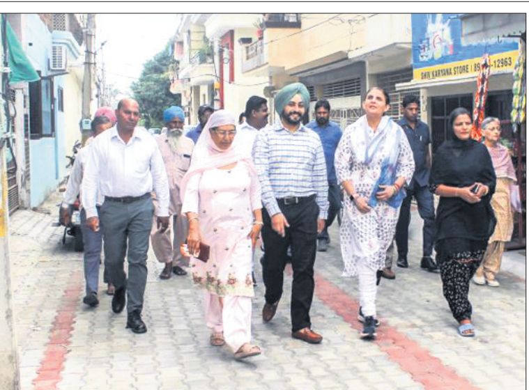
ପଞ୍ଜାବର ପୂର୍ବତନ ମୁଖ୍ୟମନ୍ତ୍ରୀ ଅମରୀନ୍ଦର ସିଂଘ ଡିଏ ଜୟ ଇନ୍ଦର କୌର ପରିଆଳରେ ଆଗାମୀ ନିର୍ବାଚନ ଲାଗି ବାପାଙ୍କ ପାଇଁ ପ୍ରଚାର କରୁଛନ୍ତି।