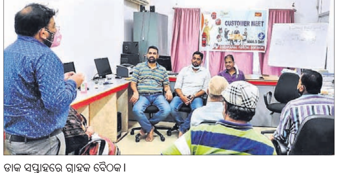
ଡାକ ସମ୍ପ୍ରଦାୟରେ ଗ୍ରାହକ ବୈଠକ।