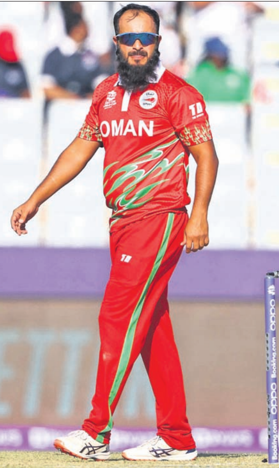
ମ୍ୟାଚ୍ ଅଫ୍ ଦି ମ୍ୟାଚ୍ ଜିତାନ ମକସୁଦ୍

ଅଲ ଆମର୍ଟ (ଓମାନ), ୧୭୧୦ (ପି.ଟି.) ରବିବାରଠାରୁ ଚିତ୍ରକୋଟ୍ ଟିମ୍ ଆରମ୍ଭ ହୋଇଛି । ପ୍ରଥମ ରାଉଣ୍ଡ ଟ୍ରାପ୍ ଦି ମ୍ୟାଚ୍ରେ ଓମାନ ୧୦ ରନରୁ ଜିତିଥିଲେ । ପାଞ୍ଚାଶ ଲାଖ ଟ୍ରାପ୍ ଦି ମ୍ୟାଚ୍ରେ ଓମାନ ୧୦ ରନରୁ ଜିତିଥିଲେ । ପାଞ୍ଚାଶ ଲାଖ ଟ୍ରାପ୍ ଦି ମ୍ୟାଚ୍ରେ ଓମାନ ୧୦ ରନରୁ ଜିତିଥିଲେ । ପାଞ୍ଚାଶ ଲାଖ ଟ୍ରାପ୍ ଦି ମ୍ୟାଚ୍ରେ ଓମାନ ୧୦ ରନରୁ ଜିତିଥିଲେ ।