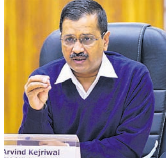
ଦିଲ୍ଲୀ ମୁଖ୍ୟମନ୍ତ୍ରୀ ଅରବିନ୍ଦ କେଜ୍ରିୱାଲ

କିଛି କୃଷକଙ୍କୁ ସହାୟତା ଦେଉନାହାନ୍ତି। ତାହାକୁ ନେଇ ସେ ରୁଜୁ କରାଯାଇଛି। ବିଶେଷକରି ଗତ ୩-୪ ଦିନ ଧରି ରୋକି ବାୟୁ ପ୍ରଦୂଷଣ ହ୍ରାସ କରିବାରେ ନିଜ ଉଦ୍‌ଦେଶ୍ୟ ରଖିଛନ୍ତି ନିର୍ବାଚନ ପ୍ରତିଦ୍ୱନ୍ଦ୍ୱୀମାନେ।