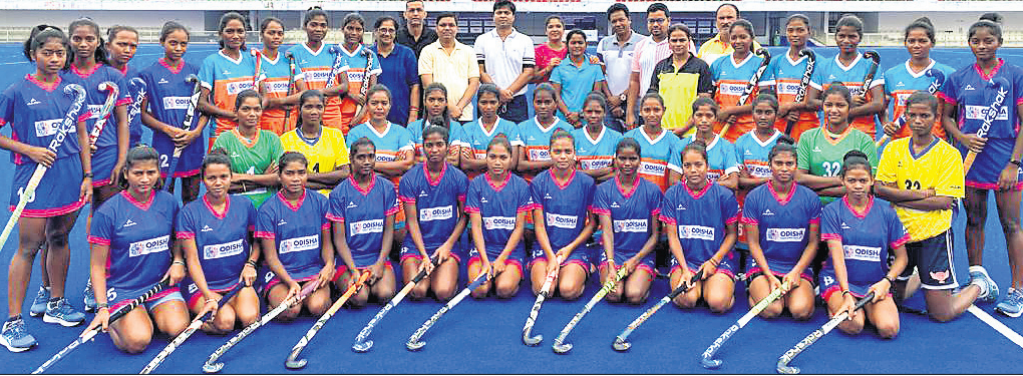
ଜାତୀୟ ମହିଳା ହକି ଦଳର ମନୋନୀତ ଓଡ଼ିଶା ସିନିୟର ଓ ଜୁନିୟର ଦଳର ଖେଳାଳିମାନେ ଅତିଥି ଓ କର୍ମଚାରୀଙ୍କ ସହ।