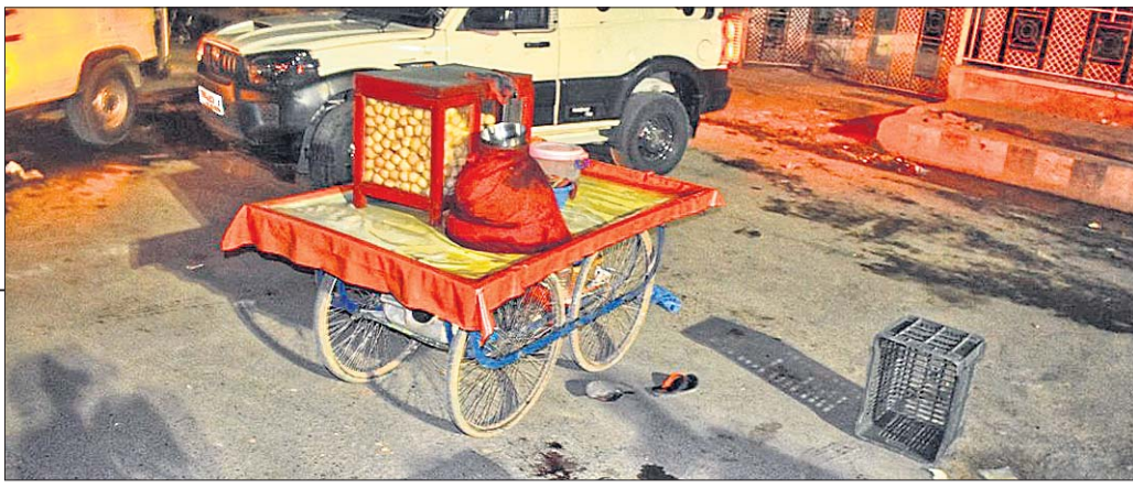
ଶ୍ରୀନଗରରେ ହତ୍ୟାର ଶିକାର ହୋଇଥିବା ଜଣେ ବିହାରୀଙ୍କ ଠେଲି ପଡ଼ିରହିଛି।