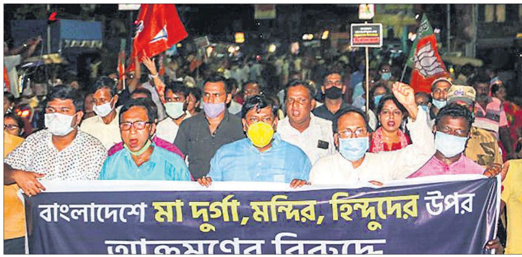
ବାଂଲାଦେଶରେ ହିନ୍ଦୁମନ୍ଦିର ଭଙ୍ଗାରୁଜା ପ୍ରତିବାଦରେ ପଶ୍ଚିମବଙ୍ଗର ଦକ୍ଷିଣ ଦିନକପୁରସ୍ଥିତ ବାଲୁରଘାବଠାରେ ବିକ୍ଷୋଭ ପ୍ରଦର୍ଶନ କରାଯାଇଛି।

ବାଂଲାଦେଶରେ ଦୁର୍ଗାପୂଜା ବେଳେ ଲକ୍ଷ୍ମୀନାଥ ଧର୍ମ ପ୍ରତି ଅସମ୍ମାନ କରାଯାଇଥିବା ବାର୍ତ୍ତା ପ୍ରଚାର ହେବାକୁ ଏହାକୁ ନେଇ ଉଡ଼େଜନା ପ୍ରକାଶ ପାଇବା ସହ ମନ୍ଦିର ଭଙ୍ଗାରୁଜା ଓ ହିଂସାକାଣ୍ଡ ଜାରି ରହିଛି। ଏହାର ପ୍ରତିବାଦରେ ସଂଖ୍ୟାଲଘୁମାନଙ୍କ ପକ୍ଷରୁ ଦେଶବ୍ୟାପୀ ଅନଶନ ଡାକରା ଦିଆଯାଇଛି। ଜଣେ ହିନ୍ଦୁ ଦେବତାଙ୍କ ଆଶୁ ଉପରେ କୋରାନ ରଖାଯାଇଥିବାର ଫଟୋ ପ୍ରସାରିତ ହେବା ପରେ ଏହାକୁ ନେଇ ଉଡ଼େଜନା ସୃଷ୍ଟି ହୋଇଥିଲା। ସଂଖ୍ୟାଗରିଷ୍ଠ ମୁସଲମାନମାନେ କେତେକ ସ୍ଥାନରେ ଦୁର୍ଗାପୂଜା ପୋଷାଳ