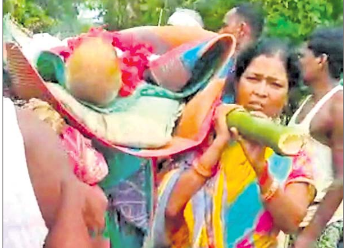
ବାପାଙ୍କ ପାର୍ଥିକ ଶରୀରକୁ ମଶାଣିକୁ ନେଉଛନ୍ତି ୪ ଦିବ୍ୟାଙ୍ଗ ଔଅ ।

ପୁଅଟିଏ ହେଲେ ମା'ବାପାଙ୍କ ମୃତ୍ୟୁ ପରେ ଶବକୁ କାନ୍ଧ ଦେବା ସହ ମୁଖାଗ୍ନି ଦେବ ବୋଲି ସମସ୍ତେ ଆଶା କରିଥାନ୍ତି । ହେଲେ ବାଲେଶ୍ୱର ଜିଲ୍ଲା ରେମୁଣା ଥାନା ନିକାମପୁର ପଞ୍ଚାୟତ ବ୍ରହ୍ମପୁରା ଗ୍ରାମର ୪ ଦିବ୍ୟାଙ୍ଗ ଔଅ ଅସହାୟ ହୋଇଥିବା ସତ୍ତ୍ୱେ ପୁଅମାନଙ୍କ ଭଲ ବୁଝା ବାପାଙ୍କ ମୃତ୍ୟୁ ପରେ ନିଜେ କାନ୍ଧରେ ବୋହି ମଶାଣିକୁ ନେବା ସହ ସଂସ୍କାର କାର୍ଯ୍ୟ ସମ୍ପନ୍ନ କରିଛନ୍ତି । ଔଅମାନଙ୍କ ଏଭଳି କାର୍ଯ୍ୟ ଦେଖି ଗ୍ରାମବାସୀ ସହଯୋଗର ହାତ ବଢ଼ାଇଛନ୍ତି ।