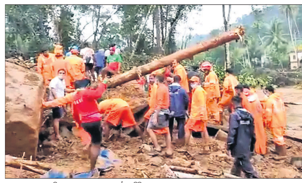
ଭୂସ୍ଥଳନ ସ୍ଥାନରେ ଏନ୍ଡିଆରଏଫ୍ ପକ୍ଷରୁ ଉଦ୍ଧାର କାର୍ଯ୍ୟ ଚାଲିଛି।

କେରଳରେ ଶୁକ୍ରବାରଠାରୁ ପ୍ରବଳ ବର୍ଷା ଲାଗିରହିଥିବାବେଳେ ବନ୍ୟା ଓ ଭୂସ୍ଥଳନରେ ୩ ଶିଖର ସମେତ ୨୬ ଜଣଙ୍କ ଜୀବନ ଗଲାଣି। କେବଳ କୋଟାୟାମ ଜିଲ୍ଲାରେ ୧୩ ଜଣଙ୍କ ମୃତ୍ୟୁ ଘଟିଥିବାବେଳେ ଇଡୁକିରେ ୯ ଏବଂ ଆଲପୁଷା ଜିଲ୍ଲାରେ ୪ ଜଣଙ୍କର ମୃତ୍ୟୁ ହୋଇଛି। କୁଟ୍ଟାଳରେ ଭୂସ୍ଥଳନରେ କୋଠା ଭୁକ୍ତି ପଡିବାକୁ ଗୋଟିଏ ପରିବାରର ୬ ଜଣଙ୍କ ମୃତ୍ୟୁ ହୋଇଥିଲା। ସେମାନଙ୍କ ମଧ୍ୟରୁ ୩ ଜଣଙ୍କ ମୃତଦେହ ଶନିବାର ମିଳିଥିବାବେଳେ ରବିବାର ଅନ୍ୟ ୩ ଜଣଙ୍କ ମୃତଦେହ ଠାଏ କରାଯାଇଛି। ଉଦ୍ଧାର କାର୍ଯ୍ୟରେ ସେନାବାହିନୀ, ଏନ୍ଡିଆରଏଫ୍, ପୋଲିସ୍ ଏବଂ ଅଗ୍ନିଶମ କର୍ମଚାରୀଙ୍କୁ ନିୟୋଜିତ କରାଯାଇଛି। ଗୁଆୟ ଲୋକେ ମଧ୍ୟ ଉଦ୍ଧାର କାର୍ଯ୍ୟରେ ସହାୟତା କରୁଛନ୍ତି। ଇଡୁକି ଜିଲ୍ଲାର କୋଟାୟାମ ଏବଂ କୋଟାୟାମ ଜିଲ୍ଲାର କୁଟ୍ଟାଳରେ ପ୍ରବଳ ବର୍ଷା ସାଙ୍ଗକୁ ଭୂସ୍ଥଳନ ହେବାରୁ ଅନେକ ଲୋକ ନିଖୋଜ ହୋଇଯାଇଛନ୍ତି। ମାଟି ଅତଡ଼ା ତଳୁ ନିଖୋଜ ଲୋକମାନଙ୍କୁ ଉଦ୍ଧାର କାର୍ଯ୍ୟ କରି ରହିଛି। ସାବରିମାଲା ମନ୍ଦିରକୁ ସୋମବାର ପର୍ଯ୍ୟନ୍ତ ଭକ୍ତମାନଙ୍କ ଲାଗି ବନ୍ଦ କରିଦିଆଯାଇଛି। ପାହାଡ଼ିଆ ଅଞ୍ଚଳକୁ ନ ଯାଇ ଘରେ ରହିବା ଲାଗି ଲୋକମାନଙ୍କୁ ପରାମର୍ଶ ଦିଆଯାଇଛି। ରବିବାର ସକାଳୁ ବର୍ଷାର ପରିମାଣ କମିଥିଲେ ମଧ୍ୟ ଲୋକଙ୍କ ଦୁର୍ଦ୍ଦଶା କମିନାହିଁ। ଅନେକ ଅଞ୍ଚଳ ଜଳାଶୁଦ୍ଧ ରହିଥିବାବେଳେ