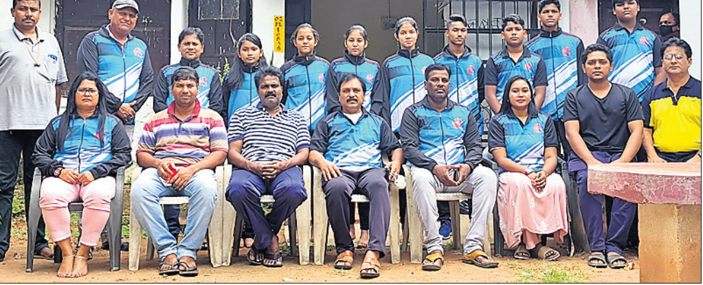
ଜାତୀୟ ଉତ୍ସୁ ଚାମ୍ପିୟନଶିପ୍‌ ପାଇଁ ମନୋନୀତ ଓଡ଼ିଶା ଦଳ।