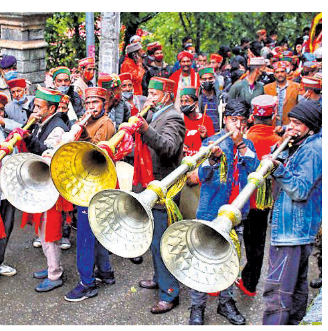
ହମାଚଳପ୍ରଦେଶର କୁଲୁଠାରେ ଅନୁଷ୍ଠିତ 'କୁଲୁ ଦଶହରା' ଅବସରରେ ବାଦ୍ୟ ପରିବେଷଣ କରାଯାଇଛି।