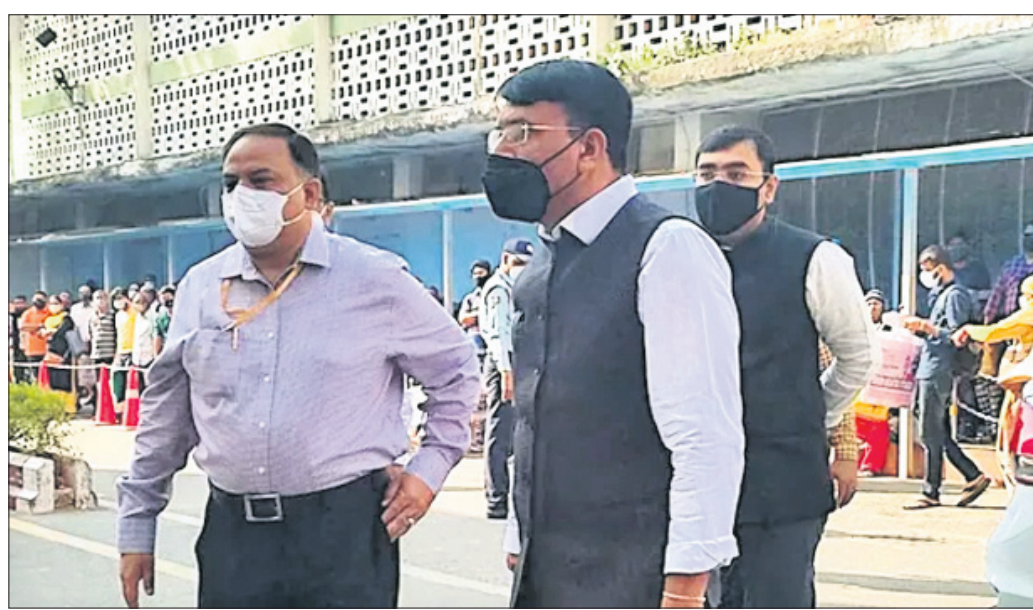
ଦିଲ୍ଲୀ ଏସ୍‌ସ୍‌ରେ ପୂର୍ବତନ ପ୍ରଧାନମନ୍ତ୍ରୀ ଡ଼ା. ମନମୋହନ ସିଂହଙ୍କୁ ଭେଟିବାକୁ ଯାଇଥିବା କେନ୍ଦ୍ର ସ୍ୱାସ୍ଥ୍ୟମନ୍ତ୍ରୀ ମନମୋହନ ମାଣ୍ଡବ୍ୟ।