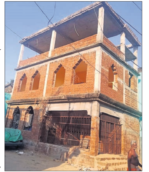
ଉଚ୍ଚ କାର୍ଯ୍ୟ ୨୦୧୮ ଦ୍ୱିତୀୟା ପୂର୍ବରୁ ହସ୍ତାନ୍ତର କରିବାକୁ ସମ୍ପୂର୍ଣ୍ଣ ସଂସ୍ଥା ପ୍ରତିଷ୍ଠିତ ବେଇଥିଲେ। ମାତ୍ର ପ୍ରତିଷ୍ଠିତ ମତେ କାର୍ଯ୍ୟ

ଦୀର୍ଘ ୬ ବର୍ଷରୁ ବିତି ଯାଇଥିଲେ ହେଁ ଶ୍ରୀନାଳମାଧବ କାଉ ମନ୍ଦିର କାର୍ଯ୍ୟାଳୟ କାର୍ଯ୍ୟ ଅଧା ହୋଇ ପଡ଼ିଛି। କାମ କରୁଥିବା ଇନଟାକ ସଂସ୍ଥାର କାର୍ଯ୍ୟାଳୟ ରକ୍ତ କରାଯାଇ ଦେବୋତ୍ତର ବିଭାଗ ସୁଧ