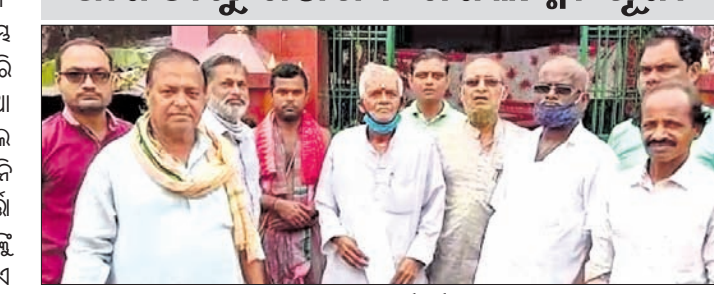
କେନ୍ଦ୍ରାପଡ଼ା ପୁରୁଣା ବସ୍ ଷ୍ଟାଣ୍ଡଠାରେ ମଣ୍ଡପର କର୍ମକର୍ତ୍ତାଙ୍କ ସହ ପଞ୍ଚତମାରେ ।

ବିଧି ପାଇଁ ଅନୁନ ୬ ଘଣ୍ଟା ଆବଶ୍ୟକ । ତେବେ ରାତ୍ରକାଳୀନ କର୍ପ୍ୟ ୧୦ଟାରୁ ପ୍ରଶାସନ ପକ୍ଷରୁ ସହରର ୬୮ ମଣ୍ଡପରେ କରାଯିବ ବୋଲି ପଞ୍ଚିତ ପତି ପ୍ରକାଶ କରିଛନ୍ତି । ତିରପର୍ବ କୋଣା ପର୍ଯ୍ୟନ୍ତ ଜିଲ୍ଲା ପ୍ରଶାସନ ପକ୍ଷରୁ କୌଣସି ନିଷ୍ପତ୍ତି ନିଆଯାଇନାହିଁ ।