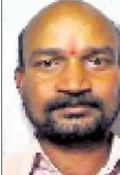
ଖଣ୍ଡପଡ଼ା କ୍ଲକ ଅଧୀନ ମର୍ଦ୍ଦରାଜପୁର

ତ. ପୋମା ରୁଟୁ ୨୦୨୦ ଅକ୍ଟୋବର ୨୦ରେ କର୍ମିଲୋ ଶ୍ରୀନାଳମାଧବ କାଉ ମନ୍ଦିର ପରିବର୍ତ୍ତନ ସମୟରେ ସମ୍ପୂର୍ଣ୍ଣ କାର୍ଯ୍ୟାଳୟର ଅଧିକାରୀ ଆ କାର୍ଯ୍ୟ