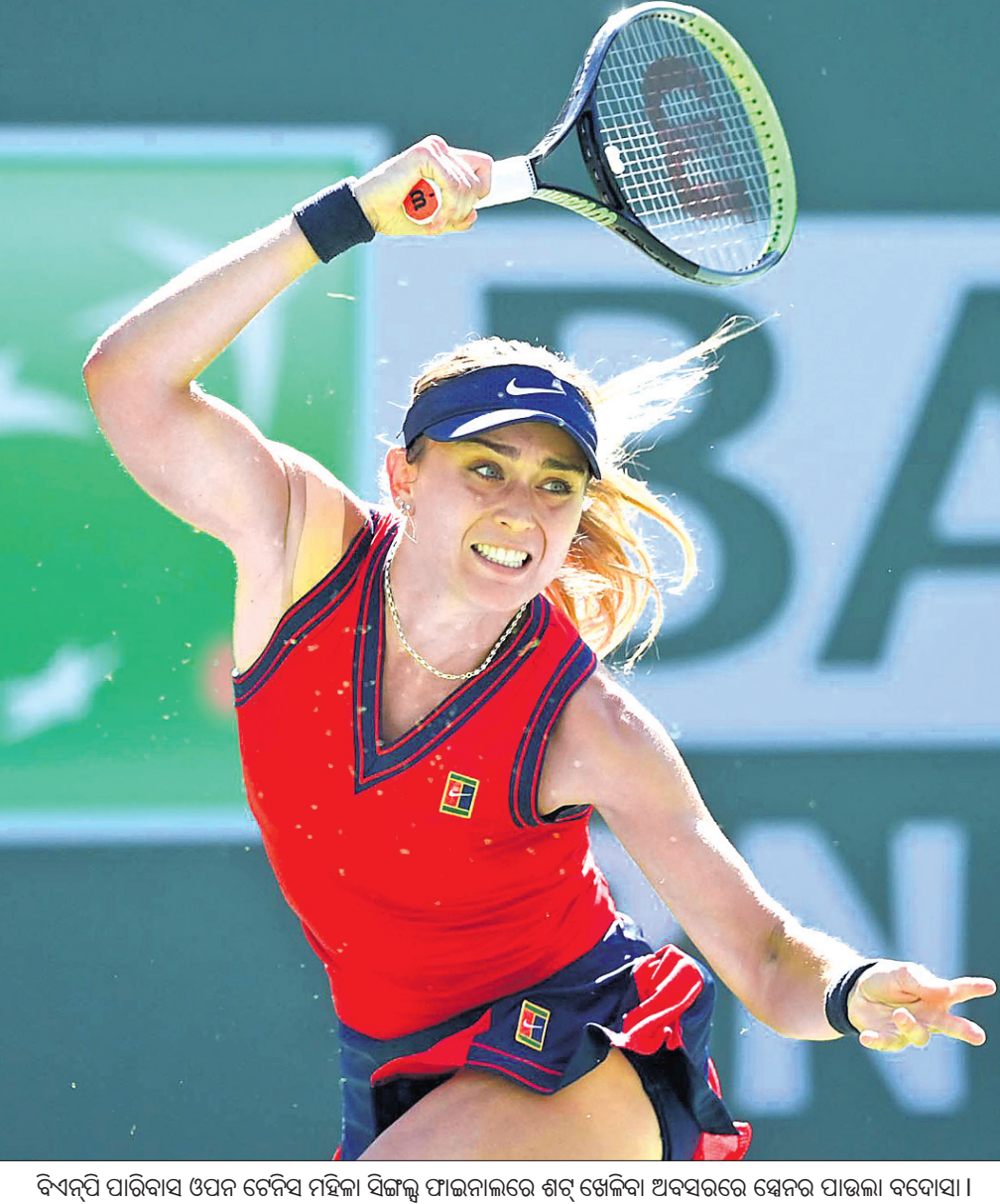
ବିଦ୍ୟୁତ୍ ପାରିବାସ ଓପନ ଚେମ୍ପିୟନ ହିଲ୍ସା ସିଙ୍ଗଲ୍ ପାଇନାଲରେ ଶର୍ବ୍ ଖେଳିବା ଅବସରରେ ସ୍ନେନ ପାଉଲ ବଦୋସା ।