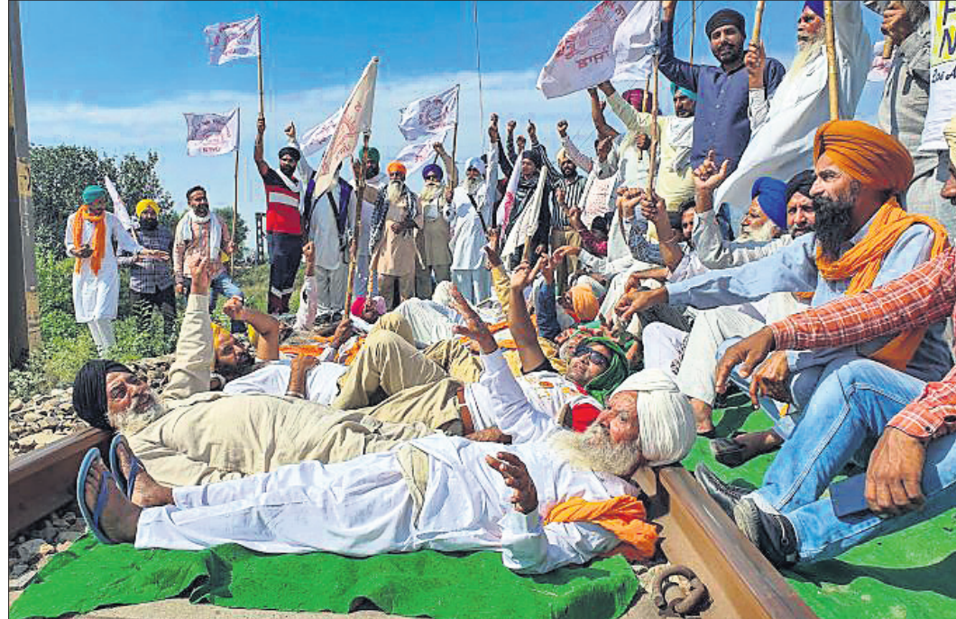
ପଞ୍ଜାବର ଅନୁତସର ଜିଲ୍ଲା ଦେବା ଦାସପୁରଠାରେ କୃଷକମାନେ ରେଳଧାରଣରେ ବିଶୋଭ ପ୍ରଦର୍ଶନ କରୁଛନ୍ତି ।