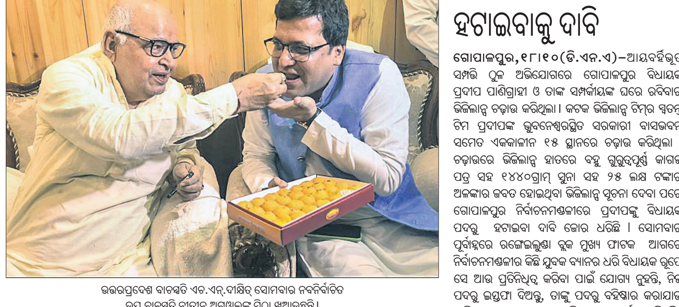
ଉତ୍ତରପ୍ରଦେଶ ବାବୁସାହି ଏବଂ ଏ.ଏ.ବୀଣିକର ସୋମବାର ନବନିର୍ବାଚିତ ଉପ ବାବୁସାହି ନାଟ୍ୟ ଅଗ୍ରଣୀକୁ ମିଠା ଖୁଆଉଛନ୍ତି ।

ଭୁବନେଶ୍ୱର, ୧୮।୧୦(ଭୁବନେଶ୍ୱର): ଏହିଭଳି ୪୦ ଜଣ ବିଭେଦ ନେତା ଓ ରାଜ୍ୟ ସରକାରଙ୍କ ଉଚ୍ଚପଦସ୍ଥ ଅଧିକାରୀମାନେ ଶାସନ କ୍ଷମତାକୁ ଉପଭୋଗ କରିବା ସହିତ ଶହ ଶହ କୋଟି ଟଙ୍କା ଆର୍ଥିକ କ୍ଷତି କରିଛନ୍ତି। ଏହାର ମଧ୍ୟ ପ୍ରକୃତ ତତ୍ତ୍ୱ ହେବା ନିହାତି ଆବଶ୍ୟକ। ନିଜ ଅସ୍ତିତ୍ୱ ଓ ବିଶ୍ୱାସନୀୟତା ହରାଇ ବସିଥିବା ଓଡ଼ିଶା ଲୋକମୁଣ୍ଡ ନିଜ ପଦ ଓ ସମ୍ମାନ ଚୋରା ଅଭିବା ପାଇଁ ନିଜ ଆତ୍ମ ପୁଣ୍ୟମନ୍ତ୍ରୀଙ୍କୁ ୩୦ରୁ ୪୦ ଘନିଷ୍ଠ ସହଯୋଗୀଙ୍କୁ ଆୟ ବହିର୍ଭୂତ ସମ୍ପର୍କରେ ତଦତ୍ତ ପାଇଁ ନିର୍ଦ୍ଦେଶ ଦେବା ନିହାତି ଆବଶ୍ୟକ ଅଟେ। ସେମାନେ ସମ୍ପର୍କ କବଚ ହୋଇଛି ବୋଲି ରାଜ୍ୟ ସରକାର ଜଣାଇଛନ୍ତି।