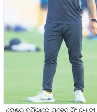
ମେଣ୍ଟର ଭୂମିକାରେ ମହେନ୍ଦ୍ର ସିଂ ଧୋନୀ