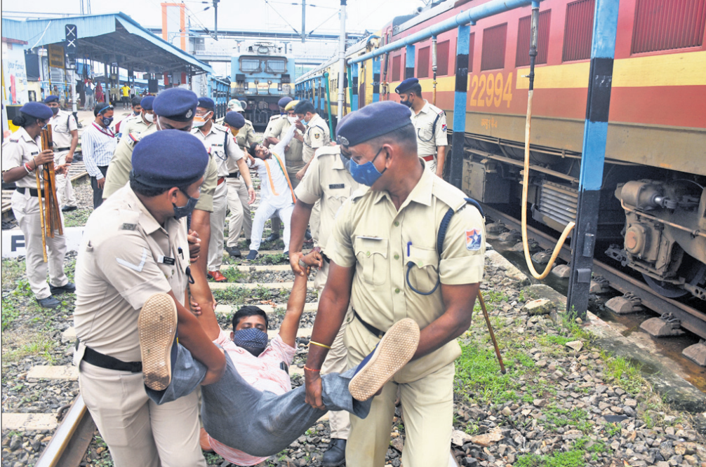
କଂଗ୍ରେସ ପକ୍ଷରୁ ଭୁବନେଶ୍ୱର ରେଳଷ୍ଟେଶନଠାରେ ସୋମବାର କେନ୍ଦ୍ର ଗୃହ ରାଷ୍ଟ୍ରମନ୍ତ୍ରୀ ଅକ୍ଷୟ ମିଶ୍ରଙ୍କୁ ବରଖାସ୍ତ୍ର ଦାବିରେ ଜଣେ ବିଶୋଭକାରୀଙ୍କୁ ପୋଲିସ୍ ଉଠାଇ ନେଉଛି ।