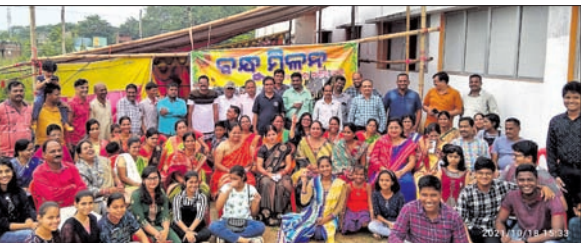
କଷ୍ଟ ମିଳନରେ ଏକାଠି ହୋଇଥିବା ସହପାଠୀ ଓ ପରିବାର ସଦସ୍ୟ।

କେନାଲରେ ରୁଦ୍ଧ ଯୁବକ ମୃତ ଧରାକୋଟ, ୧୮୧୦(ଡି.ଏ.ଏ.ଏ.): ଧରାକୋଟ ନିକଟସ୍ଥ ମୁଖମୋରା ରଖିକୂଳା