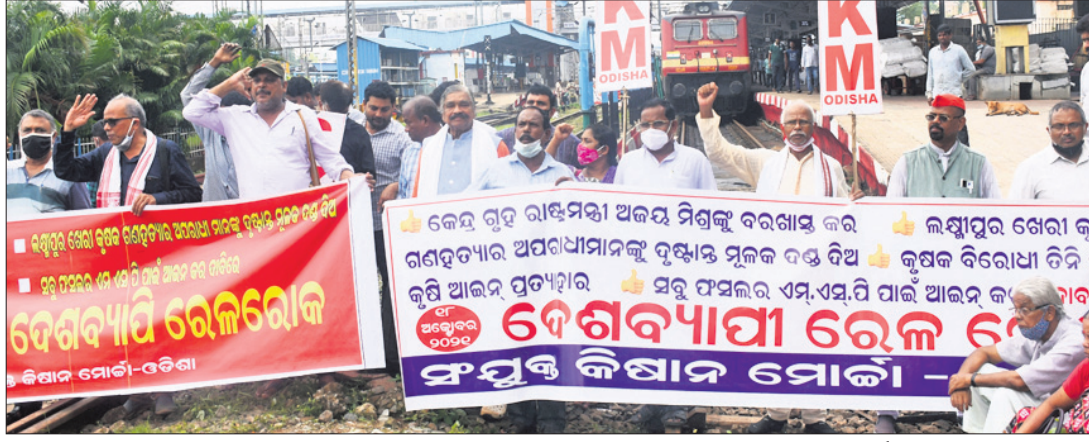
କେନ୍ଦ୍ର ଗୃହ ରାଷ୍ଟ୍ରମନ୍ତ୍ରୀ ଅକ୍ଷୟ ମିଶ୍ରଙ୍କୁ ବରଖାସ୍ତ୍ର ଓ ଅନ୍ୟାନ୍ୟ ୪ ଦଫା ଦାବିରେ ସଂଯୁକ୍ତ କିଷାନ ମୋର୍ଚ୍ଚା ପକ୍ଷରୁ ସୋମବାର କଂଗ୍ରେସ ପକ୍ଷରୁ କରାଯାଇଥିବା ରେଳରୋକ ।