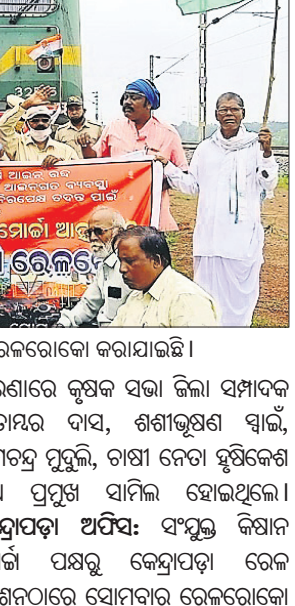
କେନ୍ଦ୍ରାପଡ଼ାରେ ସଂଯୁକ୍ତ କିଷାନ ମୋର୍ଚ୍ଚା ପକ୍ଷରୁ ରେଳରୋକେ କରାଯାଇଛି ।