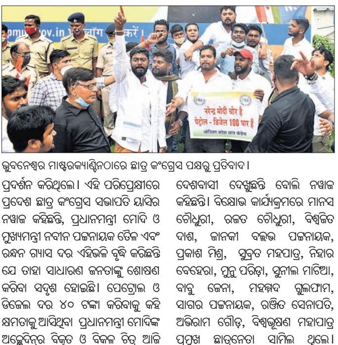
ଭୁବନେଶ୍ୱର ମାଷ୍ଟରକ୍ୟାଣ୍ଟିନଠାରେ ଛାତ୍ର କଂଗ୍ରେସ ପକ୍ଷରୁ ପ୍ରତିବାଦ ।

ଭୁବନେଶ୍ୱର, ୧୮।୧୦(ଭୁବନେଶ୍ୱର): ଉତ୍ତରପ୍ରଦେଶ ଓ ତିଳ ଦର ବୃଦ୍ଧି ପ୍ରତିବାଦରେ ପ୍ରଦେଶ ଛାତ୍ର କଂଗ୍ରେସ ପକ୍ଷରୁ ସୋମବାର ମାଷ୍ଟରକ୍ୟାଣ୍ଟିନଠାରେ ପ୍ରତିବାଦ କରାଯାଇଛି। ପ୍ରଦେଶ ଛାତ୍ର କଂଗ୍ରେସ ସମେତ ଭୁବନେଶ୍ୱର ଛାତ୍ର କଂଗ୍ରେସ, ଏକାମ୍ର ଭୁବନେଶ୍ୱର, ମଧ୍ୟ ଭୁବନେଶ୍ୱର ଓ ଉତ୍ତର ଭୁବନେଶ୍ୱର ଛାତ୍ର କଂଗ୍ରେସର ସଭାପତି ଓ କର୍ମକର୍ମୀମାନେ ଆନ୍ଦୋଳନରେ ସାମିଲ ହୋଇ ବିଶୋଭ କରିଥିଲେ। ଦରବୃଦ୍ଧି ପାଇଁ ପ୍ରଧାନମନ୍ତ୍ରୀ ଓ ମୁଖ୍ୟମନ୍ତ୍ରୀଙ୍କୁ ଦାୟୀ କରି ସେମାନଙ୍କୁ ଲୁଗାପୁରାଣ ଦାୟିତ୍ୱ କରାଯାଇଥିଲା। ଏଥିପାଇଁ ବିଭିନ୍ନ ବ୍ୟାଂକରରେ ଥିବା କଂଗ୍ରେସରୁ ପୁଣି ସେମାନେ ପୋଷ୍ଟର ଲାଗାଇ ପ୍ରତିବାଦ କରିଥିଲେ। ବିଶୋଭ ପ୍ରଦର୍ଶନ ସମୟରେ ଛାତ୍ର କଂଗ୍ରେସର କର୍ମକର୍ମୀମାନେ ମାଷ୍ଟରକ୍ୟାଣ୍ଟିନ ପୋଷ୍ଟର ଲାଗାଇ ପ୍ରତିବାଦ କରିଥିଲେ।