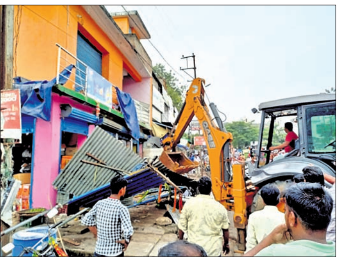
ବଜାରରୁ ସ୍ଥାନାନ୍ତର କରାଯାଇଥିବା ପକ୍ଷରୁ କେହି ଲାଗାଇ ଜବରଦଖଲ ଉଚ୍ଛେଦ କରାଯାଇଛି।

ନୟାଗଡ଼ ସହରରେ ଜବରଦଖଲ ବୃଦ୍ଧି ଚାଲିଛି। ବ୍ୟବସାୟୀମାନେ ଯିଏ ଯେଉଁଠି ପାଇଲେ ସେଠାରେ ଜବରଦଖଲ କରି ଅସ୍ଥାୟୀ ଦୋକାନ ପକାଇଛନ୍ତି।