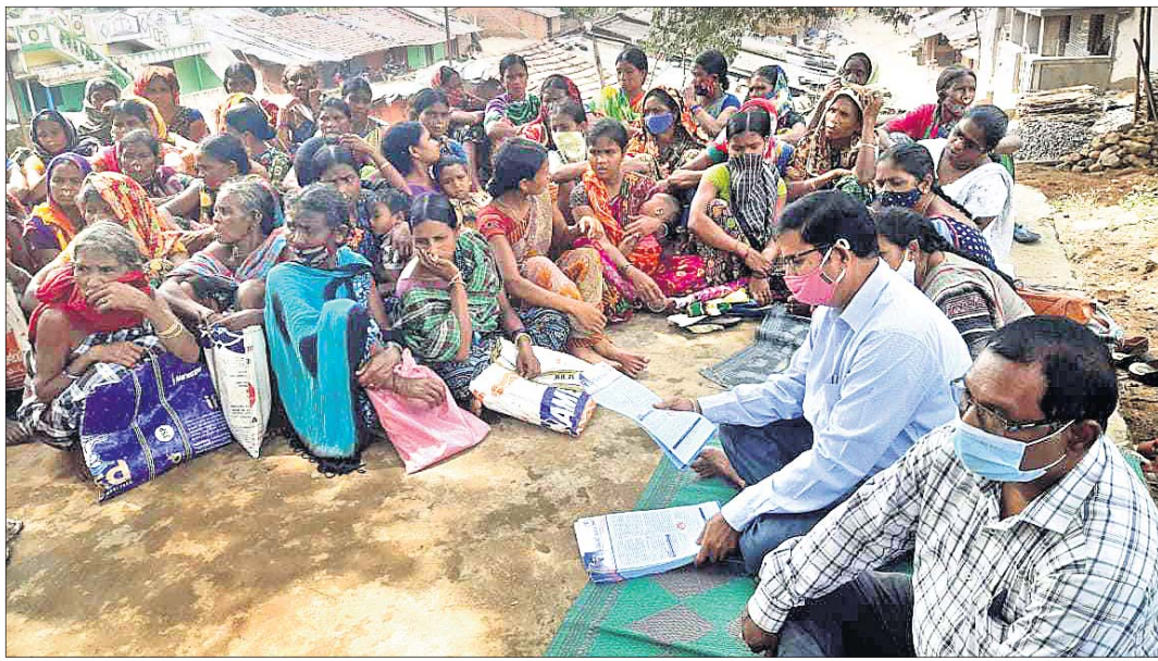
ଆନ୍ଧ୍ର ଅଧିକାରୀମାନେ ଫାରୁସିନେରି ଗ୍ରାମରେ ବୈଠକ କରୁଛନ୍ତି।

କୋରାପୁଟ, ୧୮୧୦(ସ.ପ୍ର.) ଆନ୍ଧ୍ର ଉପରେ ପଡ଼ିନାହିଁ। ସୋମବାର ଆନ୍ଧ୍ର ଅଧିକାରୀ ଓ କର୍ମଚାରୀମାନେ କୋଟିଆର ଫାରୁସିନେରି ଗ୍ରାମକୁ ଆସି ଫେରସନ ଓ ଖାଉଟିକାର୍ତ୍ତବ୍ୟନ କରିଛନ୍ତି। ଆନ୍ଧ୍ର ଅଧିକାରୀ ଫାରୁସିନେରି ଗ୍ରାମରେ ପହଞ୍ଚିବାପାଇଁ ସହ ଆଲୋଚନା କରୁଥିବା ବେଳେ ପଞ୍ଚାଙ୍ଗା ବିଧାୟକ ପ୍ରାଚୀନ ପାଠାକ ସହ ଯୁଦ୍ଧାୟୁ ହୋଇଥିଲେ। ଆଉ ଏଠିକୁ ନ ଆସିବାକୁ ପ୍ରଦାନ କରିଥିବା ଜଣାପଡ଼ିଛି। ୨ଟି ବାଉଁଶ ଚାରିଦ କରିଥିଲେ। ଏହାର କୌଣସି ପ୍ରଭାବ ଆନ୍ଧ୍ର ଉପରେ ପଡ଼ିନାହିଁ। ସୋମବାର ଆନ୍ଧ୍ର ଅଧିକାରୀ ଓ କର୍ମଚାରୀମାନେ କୋଟିଆର ଫାରୁସିନେରି ଗ୍ରାମକୁ ଆସି ଫେରସନ ଓ ଖାଉଟିକାର୍ତ୍ତବ୍ୟନ କରିଛନ୍ତି। ଆନ୍ଧ୍ର ଅଧିକାରୀ ଫାରୁସିନେରି ଗ୍ରାମରେ ପହଞ୍ଚିବାପାଇଁ ସହ ଆଲୋଚନା କରୁଥିବା ବେଳେ ପଞ୍ଚାଙ୍ଗା ବିଧାୟକ ପ୍ରାଚୀନ ପାଠାକ ସହ ଯୁଦ୍ଧାୟୁ ହୋଇଥିଲେ। ଆଉ ଏଠିକୁ ନ ଆସିବାକୁ ପ୍ରଦାନ କରିଥିବା ଜଣାପଡ଼ିଛି। ୨ଟି ବାଉଁଶ ଚାରିଦ କରିଥିଲେ। ଏହାର କୌଣସି ପ୍ରଭାବ