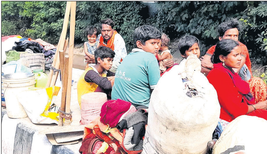
ଘରକୁ ଫେରିବା ଲାଗି ଜଣ୍ଠି ରେଳଷ୍ଟେଶନ ନିକଟ ଯୁବପାଞ୍ଚରେ ଅପେକ୍ଷାରତ ପ୍ରବାସୀ ଶ୍ରମିକ।

କଣ୍ଠାରରେ ବାହାର ରାଜ୍ୟର ଲୋକଙ୍କୁ ଚାର୍ଜେଟ କରି ହତ୍ୟା ଯୋଗୁ ଏବେ ଭୟ ଓ ଆତଙ୍କରେ ପ୍ରବାସୀ ଶ୍ରମିକ ଏବଂ ଛୋଟମୋଟ ବ୍ୟବସାୟୀ ପେଟ ପୋଷିବା ବଦଳରେ କାବନ ବଞ୍ଚାଇବା ସେମାନଙ୍କ ପାଇଁ ବଡ଼ କଥା। ଆତଙ୍କବାଦୀଙ୍କ ପରବର୍ତ୍ତୀ ଶିକାର ହେବା ଆଶଙ୍କାରେ କାମଧାରୀ ଛାଡ଼ି ଏବେ ସେମାନେ ଘରପୁଛୁଆଁ। କୌଣସି ମତେ ଘରେ ପହଞ୍ଚିବାକୁ ଜଣ୍ଠି ରେଳ ଷ୍ଟେଶନ ଏବଂ ବାହାରେ ସୋମବାରରେ ବହୁ ସଂଖ୍ୟାରେ ଲୋକଙ୍କ ଘରକୁ ଦେଖିବାକୁ ମିଳିଛି। ଯୁବପାଞ୍ଚରେ ବସି ଟ୍ରେନ୍‌କୁ ଅପେକ୍ଷା କରିଥିବା କେତେଜଣ ପ୍ରବାସୀ କହିଛନ୍ତି 'ଆଉ କେବେ କଣ୍ଠାର ଆସିବୁ ନାହିଁ'।