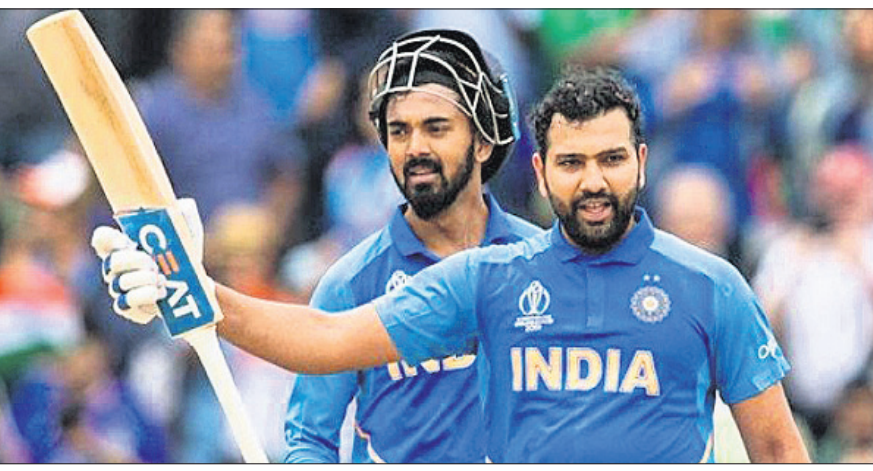
ଲୋକେଶ ରାହୁଲ ଓ ରୋହିତ ଶର୍ମା ।

କ୍ରୀଡ଼ା, ୧୮୧୦ (ପି.ଟି.) ୧୨୦ ବିଶ୍ଵକପ ଯୋଗ୍ୟତା ପର୍ଯ୍ୟାୟ ଉଦ୍‌ଘାଟନାରୁ ଆରମ୍ଭ ହୋଇଯାଇଛି । ଯୋଗ୍ୟତା ଅର୍ଜନ କରିଥିବା ଦଳଗୁଡ଼ିକର ଫର୍ମାଟ୍‌ସ୍ ମଧ୍ୟ ଆରମ୍ଭ ହୋଇଛି । ଚିନ୍ତା କମିଶନରୁ ପ୍ରତ୍ୟେକ ଦଳ ଗୁଡ଼ିକ ଦେଖିଛନ୍ତି । ଭାରତୀୟ ଦଳ ଚିନ୍ତା କମିଶନର ସମ୍ପର୍କରେ ସମୀକ୍ଷା କରୁଛି । ଭାରତ ପକ୍ଷରୁ ରୋହିତ ଶର୍ମା ଓ ଲୋକେଶ ରାହୁଲ ଇନିଂସ ଓପନ କରିବେ । ନିଜେ କୋହଲି