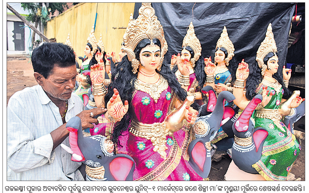
ଗଜଲକ୍ଷ୍ମୀ ପୂଜାର ଅବ୍ୟବହୃତ ପୂର୍ବରୁ ସୋମବାର ଭୁବନେଶ୍ୱର ଯୁନିଟ୍-୧ ମାର୍କେଟ୍‌ରେ ଜଣେ ଶିଳ୍ପୀ ମା'ଙ୍କ ମୃଣ୍ମୟା ମୂର୍ତ୍ତିରେ ଶେଷସର୍ଗ ଦେଇଛନ୍ତି।