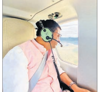
ଆକାଶମାର୍ଗରୁ ବନ୍ୟାଞ୍ଚନା ପରିବର୍ତ୍ତନ କରୁଛନ୍ତି ଉତ୍ତରାଖଣ୍ଡ ମୁଖ୍ୟମନ୍ତ୍ରୀ ପୁଷ୍କର ସିଂ ଧାମି।