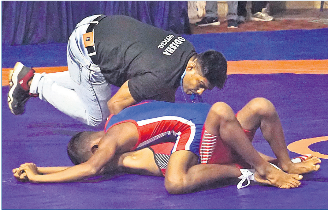
କଟକ ବାରବାଟୀ ଷ୍ଟାଡ଼ିୟମ କ୍ଲବ ହାଉସରେ ମଙ୍ଗଳବାର ଆରମ୍ଭ ହୋଇଥିବା ରାଜ୍ୟ କ୍ଷୁଦ୍ର ଚାମ୍ପିୟନସିପ୍ସର ବାଳକ ଓ ବାଳିକା ବିଭାଗରେ ଅନୁଷ୍ଠିତ ଲଢ଼େଇ।

ମେଲବୋର୍ନ, ୧୯୧୦: ବର୍ଷର ପ୍ରଥମ ଗ୍ରୀଷ୍ମସ୍ତର ଚୁର୍ଣ୍ଣମେଷ୍ ଥାଏଡ଼ା କାନ୍ଦୁୟାରାରେ ମେଲବୋର୍ନରେ ଖେଳାୟିବାର କାର୍ଯ୍ୟକ୍ରମ ରହିଛି। ତେବେ ଏହି ମେଡ଼ା ଇଭେଣ୍ଟ ପାଇଁ ଆୟୋଜକମାନେ କଡ଼ା ନିୟମ ଜାରି କରିଛନ୍ତି। ଯେଉଁ ଟେନିସ୍ ଖେଳାଳିମାନେ କୋଭିଡ୍ ଟିକା ନେଇ ନ ଥିବେ ସେମାନଙ୍କୁ ଅଷ୍ଟ୍ରେଲିଆ ଭିଜା ଦେବନାହିଁ ବୋଲି ସେଠାକାର ରାଜନେତାମାନେ କହିଛନ୍ତି।