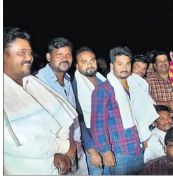
ବିଜୟୀ ଦଳ ପୁରସ୍କାର ଗ୍ରହଣ କରୁଛି।