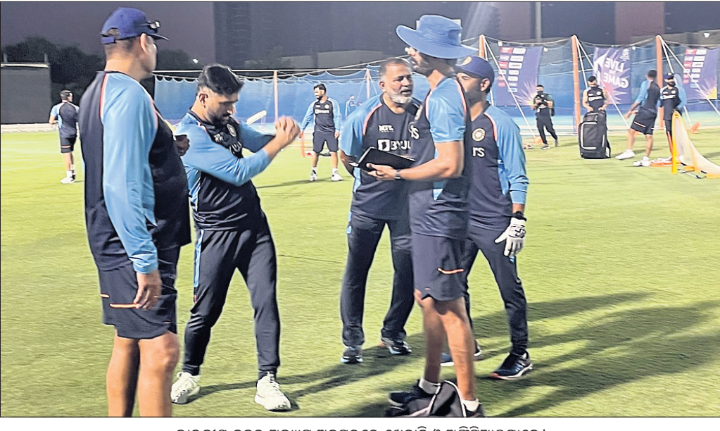
ଭାରତୀୟ ଦଳର ଅଭ୍ୟାସ ଅବସରରେ ଖେଳାଳି ଓ ଅଫିସିଆଲ୍‌ମାନେ।

ବୋଲର ବିକଳ ରହିବାର ଆବଶ୍ୟକତା ରହିଛି। ଇଂଲଣ୍ଡ ବିପକ୍ଷରେ ଭୁବନେଶ୍ଵର କୁମାର ବହୁତ ରନ ସୃଷ୍ଟି କରିଥିଲେ। ତେବେ ଯଶପ୍ରୀତ ସୁନାମ କଣ୍ଠସ୍ଵର ବୋଲି କହିଥିଲେ। ୩ ଉଲ୍‌କେଟ୍ ଅଭିଆର କରିଥିଲେ ମଧ୍ୟ ମହଜୁବ ସାମି ମଧ୍ୟ ମହଜୁ ସହ ୨୯ ରନକରି ଅପରାଜିତ ରହିଥିଲେ। ସୂର୍ଯ୍ୟକୂମାର ମାତ୍ର ୮ ରନକରି ଆଉଟ ହୋଇଥିଲେ। ରୋହିତ ଇଂଲଣ୍ଡ ବିପକ୍ଷରେ ୪ ଟେକା ଓ ୩ ଛକା ସହ ୨୦ରନ କରି ଚିରାୟତ୍ ନିର୍ଦ୍ଦୋଷ ରହିଥିବା ଜଣାଣ କରି ଅଭିମତ ବ୍ୟକ୍ତ କରିଛନ୍ତି। ସୂର୍ଯ୍ୟକୂମାର ପକ୍ଷରେ ପକ୍ଷୀ ଉଲ୍‌କେଟ୍‌କିପର ବ୍ୟାଟ୍‌ସମାନ ଜିତିଥିଲୁ। ଏଥର ନଭେମ୍ବର ୧୪ରେ ମୋ ଲାୟା ଚିତ୍ତ ସ୍ଥିରେ ଭାରତର ଆଉ ଏକ ବିକଳ ପୁସ୍ତକ ଦେଖିବା ଲାଗି ଯୁଁ ଅପେକ୍ଷା କରି ରହିଛି। (ବାନେଶୀ ଚୋପ୍ରା ମିଡ଼ିଆ/ଗେମ୍‌ସ୍‌ପାକ)।