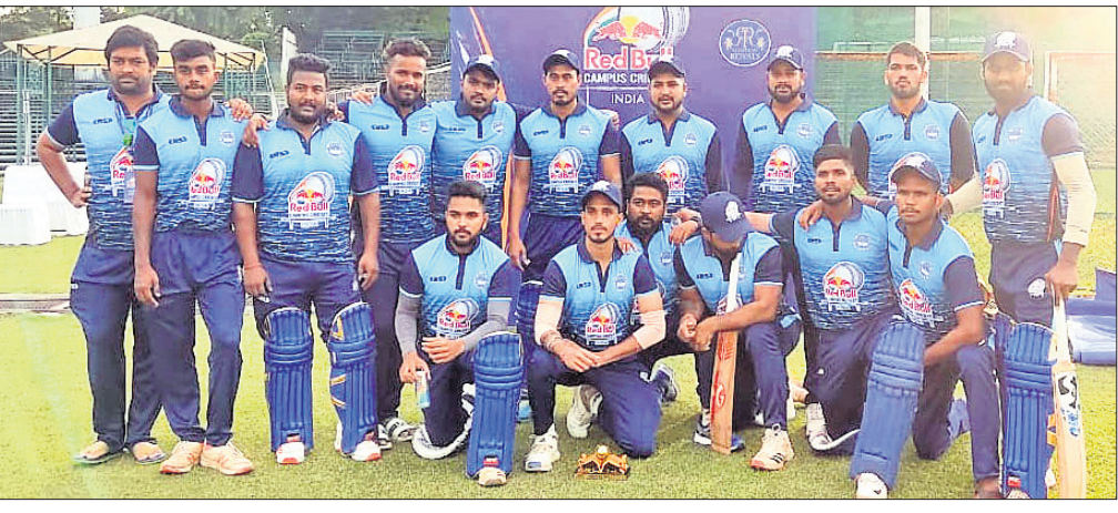
ଚଣ୍ଡିଗଡ଼ରେ ଚାଲିଥିବା ରେଡ୍‌ବୁଲ୍ କ୍ୟାମ୍ପସ୍ କ୍ରିକେଟ୍ ନ୍ୟାଶନାଲ୍ ଫାଇନାଲ୍‌ରେ ଅଂଶଗ୍ରହଣ କରିଥିବା ଭୁବନେଶ୍ଵର ମହର୍ଷି କଲେଜ୍ ଦଳ।

ଭୁବନେଶ୍ଵର, ୧୯୧୦(କ୍ରୀଡ଼ା ପ୍ରତିନିଧି) କଲେଜ୍‌ର ଯୁବ କ୍ରୀଡ଼ା ପ୍ରତିଭାକୁ ଖୋଜି ଅନ୍ତର୍ଜାତୀୟ ସ୍ତରରେ ଖେଳିବା ସୁଯୋଗ ଦେବା ଲକ୍ଷ୍ୟରେ ଆରମ୍ଭ ହୋଇଥିବା ରେଡ୍‌ବୁଲ୍ କ୍ୟାମ୍ପସ୍ କ୍ରିକେଟ୍ ନ୍ୟାଶନାଲ୍ ଫାଇନାଲ୍ ଚଣ୍ଡିଗଡ଼ରେ ଆରମ୍ଭ ହୋଇଛି। ଏହି ଡିଏମ୍ ଚୁର୍ଣ୍ଣମେଷ୍‌ରେ ସହର କ୍ଵାଲିଫାୟର୍ ଏବଂ ଆଞ୍ଚଳିକ କର ବା ମର ସ୍ଥିତି ପୂର୍ଣ୍ଣ ହୋଇଛି।