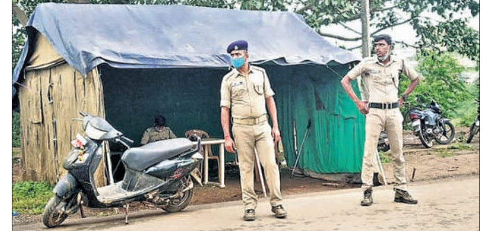
ଚେକପୋଷ୍ଟରେ ୨ଜଣ ପୋଲିସ ଜଗି ରହିଛନ୍ତି ।

କନ୍ୟାପୁର ବେଲ ବାହାର ରାଜ୍ୟକୁ ଚନ୍ଦ୍ର ଗଞ୍ଜେଇ ଚାଲାଣ ହେଉଛି। ଦୈନିକ କନ୍ୟାପୁର ସଦର ପୋଲିସ ଗଞ୍ଜେଇ ଜବତ କରି ଚାଲାଣକାରୀଙ୍କୁ ଗିରଫ କରୁଛନ୍ତି। ତଥାପି ମଧ୍ୟ ଚାଲାଣକାରୀ ବିଭିନ୍ନ ଉପାୟରେ ବାହାର ରାଜ୍ୟକୁ ଗଞ୍ଜେଇ ପଠାଉଛନ୍ତି। ଏଥିରେ ରୋକ ଲାଗାଇବାକୁ ସହର ପ୍ରବେଶ ପଥ ସତୀ ନଦୀ ନିକଟରେ ଜିଲ୍ଲା ପୋଲିସ ନିର୍ଦ୍ଦେଶରେ ନାକାବନ୍ଦି କରାଯାଇଛି। ୨୪ ଘଣ୍ଟା ସେଠାରେ ପୋଲିସ ମୁତୟନ ରହି ସହରକୁ ପ୍ରବେଶ କରୁଥିବା ଗାଡ଼ିକୁ ଯାଞ୍ଚ କରିବେ। କୋରାପୁଟର ମାଛକୁଣ୍ଡ, ଲମତାପୁଟ, ଜଳାପୁଟ ସହ ମାଲକାନଗିରି ଜିଲ୍ଲାରୁ ଗଞ୍ଜେଇ ଆଣି କନ୍ୟାପୁର ବେଲ ଛତିଶଗଡ଼, ମଧ୍ୟପ୍ରଦେଶ, ଦିଲ୍ଲୀ, ଉତ୍ତରପ୍ରଦେଶ ଚାଲାଣ ହେଉଛି। ଛତିଶଗଡ଼ ପୁଷ୍ପାମୁଦ୍ରା ଗଞ୍ଜେଇ ଚାଲାଣ ପାଇଁ ଓଡ଼ିଶା ସରକାରଙ୍କୁ ଦାସୀ କରିଥିଲେ ବେଳେ ଏହାପରେ କନ୍ୟାପୁରରେ ପମ୍ପୁ ପ୍ରବେଶ ପଥରେ ୨୪ ଘଣ୍ଟା ପୋଲିସ ଜଗିବ। ଜିଲ୍ଲା ପୋଲିସର ଏହି ପଦକ୍ଷେପ ପରେ ଗଞ୍ଜେଇ ଚାଲାଣକାରୀଙ୍କ ମଧ୍ୟରେ କୋକୁଆ ଭୟ ସୃଷ୍ଟି ହୋଇଥିବା ଅନୁମାନ କରାଯାଇଛି।