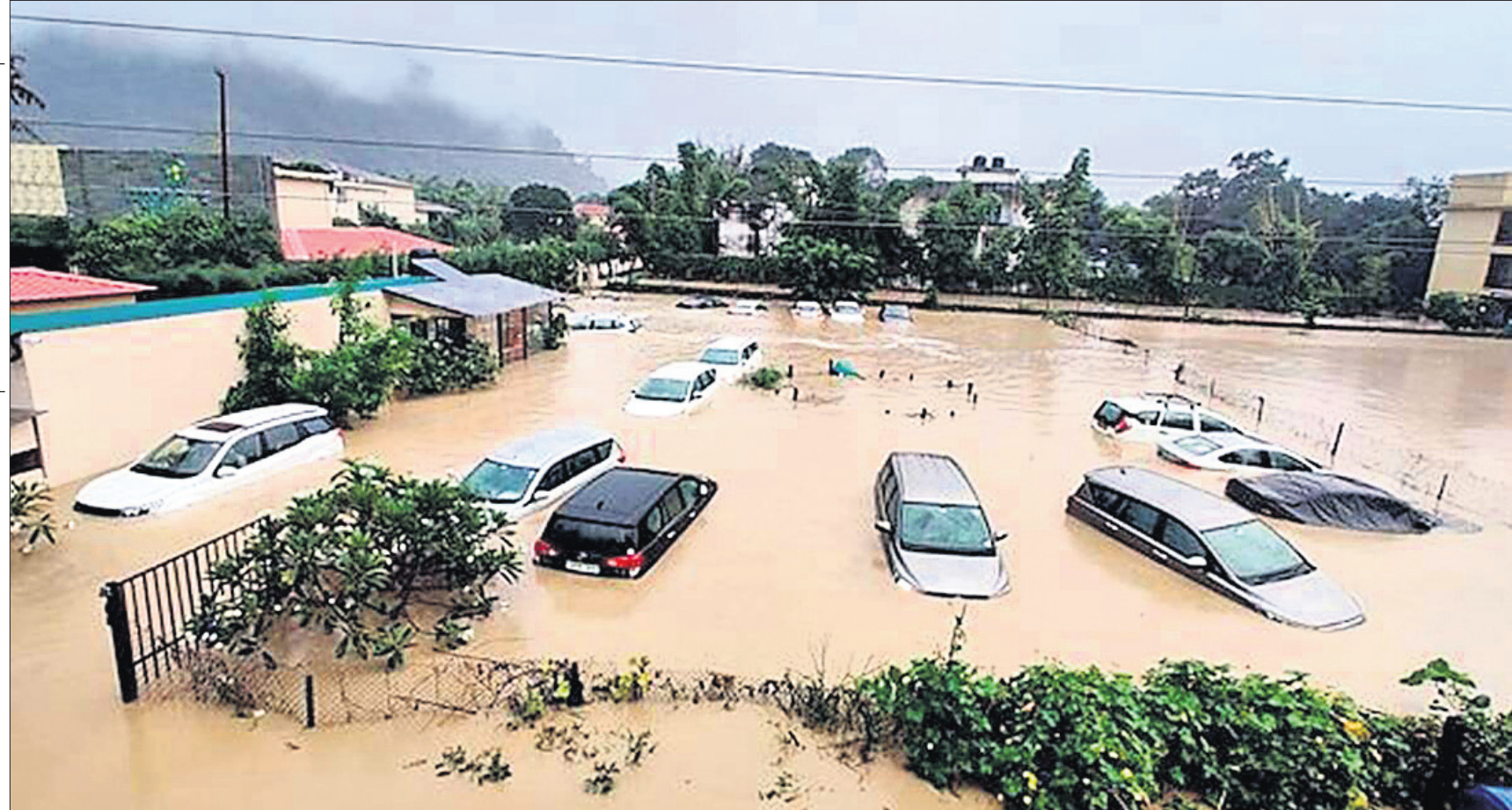
ଉତ୍ତରାଖଣ୍ଡରେ ପ୍ରବଳ ବର୍ଷା ଯୋଗୁ କୋଶୀ ନଦୀରେ ବନ୍ୟା ଆସିଛି। କିମ୍ କୋରବେନ୍ ଜାତୀୟ ଉଦ୍ୟାନରେ ଥିବା କାରଗୁଡ଼ିକ ବନ୍ୟାପାଣିରେ ବୁଡ଼ିଯାଇଛି।

ବିକ୍ରିତ ନ୍ୟାୟ, ନ୍ୟାୟ ରୁହେଁ ତେଣୁ ଆପରାଧୀଙ୍କ ବିଚାର ବ୍ୟବସ୍ଥାର ପ୍ରମୁଖ ଅଙ୍ଗ କୁହାଯାଉଥିବା ପୋଲିସ୍ ତଦନ୍ତ ପ୍ରକ୍ରିୟାକୁ ନିର୍ଦ୍ଦିଷ୍ଟ ସମୟସୀମା ମଧ୍ୟରେ ଶେଷ କରିବାର ନିୟମ ରହିଛି। ହେଲେ କେତେକ କ୍ଷେତ୍ରରେ ଅବହେଳା କାରଣରୁ ତଦନ୍ତ ପ୍ରକ୍ରିୟା ଠିକ୍ ସମୟରେ ଶେଷ ହୋଇପାରୁ ନାହିଁ। ଫଳରେ ବିଚାରାଧୀନ ଅଭିଯୁକ୍ତଙ୍କ ସାଧାରଣ ଅଧିକାର କ୍ଷୁଣ୍ଣ ହେବା ଭଳି ସ୍ଥିତି ସୃଷ୍ଟି ହେଉଛି। ତେଣୁ ନିର୍ଦ୍ଦିଷ୍ଟ ସମୟ ସୀମା ଠିକ୍ ତଦନ୍ତ ପ୍ରକ୍ରିୟା ବିଳମ୍ବ ହେଲେ କାହାରିକୁ ଅବହେଳାକୁ ଜାମିନ ବା ଡିଫାନ୍ଦ୍ ବେଲ୍ ପାଇବା ଅଧିକାରକୁ ବଞ୍ଚିତ କରାଯାଇପାରିବ ନାହିଁ ବୋଲି ଦିଲ୍ଲୀ ହାଇକୋର୍ଟ ଏକ ଗୁରୁତ୍ୱପୂର୍ଣ୍ଣ ରାୟରେ ଉଲ୍ଲେଖ କରିଛନ୍ତି। ନୂଆଦିଲ୍ଲୀ, ୧୯।୧୦ କୋଭିଡ୍-୧୯ ମହାମାରୀ ସମୟରେ ନିର୍ଦ୍ଦିଷ୍ଟ ସମୟ ମଧ୍ୟରେ ତଦନ୍ତ ପ୍ରକ୍ରିୟା ଶେଷ ହୋଇ ନ ଥିବା ଦର୍ଶାଇ ଜଣେ ବିଚାରାଧୀନ ବନ୍ଦୀଙ୍କ ହାଜତ ମିଆଦକୁ ବୃଦ୍ଧି କରାଯାଇ ଥିଲା, ଯାହାକି ତାଙ୍କର