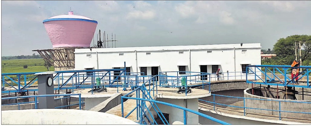
ନିର୍ମାଣାଧୀନ ପାନୀୟ ଜଳ ପ୍ରକଳ୍ପ ।

ଉମରକୋଟ ଓଡ଼ିଶା ନିର୍ମାଣ ଚାଳିଛି ୬୦ ହକାର ଲିଟର କ୍ଷମତା ବିଶିଷ୍ଟ ପାନୀୟଜଳ ପ୍ରକଳ୍ପ। ଉକ୍ତ ପ୍ରକଳ୍ପ କାମ ସରିବା ସହ ଏହା କାର୍ଯ୍ୟକ୍ଷମ ହେଲେ ପୌରାଞ୍ଚଳର ପ୍ରାୟ ୪୦ ହକାର ଲୋକେ ଏଥିରେ ଉପକୃତ ହେବେ।