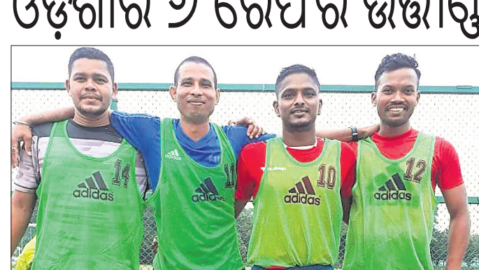
ଫିଟ୍‌ନେସ୍ ଟେଷ୍ଟରେ ଉତ୍ତୀର୍ଣ୍ଣ ହୋଇଥିବା ଓଡ଼ିଶାର ସହକାରୀ ରେଫରିମାନେ।

ସୁଯୋଗ ପାଇବେ ସେଥିପାଇଁ ରେଡ୍‌ବୁଲ୍ ୨୦୧୨ରୁ ପ୍ରତିବର୍ଷ ଏହି ଡିଏମ୍ ଚୁର୍ଣ୍ଣମେଷ୍ ଆଇପିଏଲ୍ ପ୍ରାଞ୍ଚଳକୁ ଦଳ ରାଜସ୍ଥାନ ରୟାଲ୍‌ସ୍ ଚୁର୍ଣ୍ଣମେଷ୍‌ପାଇଁ ସହଯୋଗର ହାତ ବଢ଼ାଇଛି। ମହର୍ଷି କଲେଜ୍ ଗ୍ରୁପ୍ ଏବଂ ପ୍ରଥମେ ଜୟପୁରର ଏସ୍‌ଏସ୍ ଜିନି ସୁବୋଧ କଲେଜ୍, ଦ୍ଵିତୀୟରେ ହାଇଦ୍ରାବାଦ ଟିକେଆରଭି କଲେଜ୍ ଏବଂ ତୃତୀୟରେ ପୁଣେର ଏମ୍‌ଏମ୍‌ସି କଲେଜ୍‌କୁ ଭେଟିବା କାର୍ଯ୍ୟକ୍ରମ ରହିଛି।