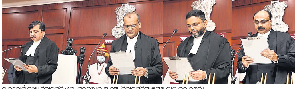
ହାଇକୋର୍ଟ ପୁଞ୍ଜ୍ୟ ବିଚାରପତି ଏସ୍. ପୁରଲୀଧର ୩ ନୂଆ ବିଚାରପତିଙ୍କୁ ଶପଥ ପାଠ କରାଉଛନ୍ତି।