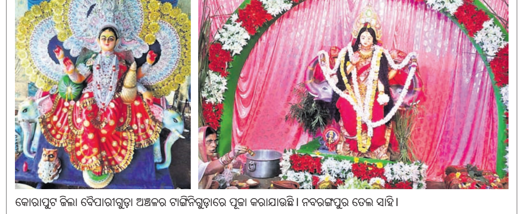
କୋରାପୁଟ ଜିଲ୍ଲା ବୈଦାରାଗୁଡ଼ା ଅଞ୍ଚଳର ଗାଜିଗୁଡ଼ାରେ ପୂଜା କରାଯାଇଛି । ନବରଙ୍ଗପୁର ପତଳ ସାହି ।