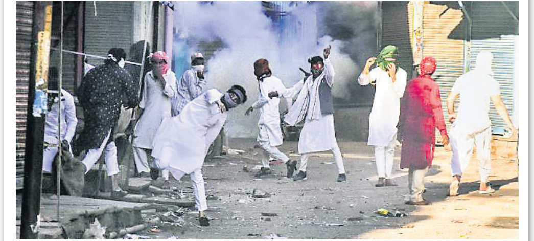
ମଧ୍ୟପ୍ରଦେଶର ଜବଲପୁରରେ ଏକ ନିର୍ଦ୍ଦେଶ ରୁଟିରେ ଇଏ-ଏ-ନିଲାଦ ଉନ୍ ନବି ଶୋଭାଯାତ୍ରା ପାଇଁ ଅନୁମତି ନ ମିଳିବାରୁ ମଙ୍ଗଳବାର ଅପରାହ୍ନରେ ପୋଲିସ୍ ସହ ଦେହଘଣ୍ଟା ଧରି ସଂଖ୍ୟାଲଘୁ ସମୁଦାୟର ସଂଘର୍ଷ ହୋଇଛି। ମୁଖ୍ୟମନ୍ତ୍ରୀମାନେ ପୋଲିସ୍ ଉପରକୁ ଟେକାମାଡ଼ କରିବା ସହ ବାଣରେ ନିଆଁ ଲଗାଇ ଫିଙ୍ଗିଥିଲେ। ଭିଡ଼କୁ ଘଉଡ଼ାଇବା ପାଇଁ ପୋଲିସ୍ ଲୁହବୁଜା ବାସ୍ତୁ ସହ ବକ ପ୍ରୟୋଗ କରିଛି।

ହରାଇଥିବା ଲୋକଙ୍କୁ ୧.୯ ଲକ୍ଷ ଟଙ୍କା ଲେଖାଏ ପ୍ରଦାନ କରିବାକୁ ଘୋଷଣା କରିଛନ୍ତି। ପ୍ରଧାନମନ୍ତ୍ରୀ ନରେନ୍ଦ୍ର ମୋଦି ଏବଂ ସ୍ଵରାଷ୍ଟ୍ର ମନ୍ତ୍ରୀ ଅମିତ ଶାହା ଏ ସମ୍ପର୍କରେ ଧ୍ୟାନ ଦେଇ ସହ ଆଲୋଚନା କରିଛନ୍ତି। କେନ୍ଦ୍ର ପକ୍ଷରୁ ରାଜ୍ୟକୁ ସମସ୍ତ ସହାୟତା ଯୋଗାଇଦିଆଯିବ ବୋଲି ପ୍ରଧାନମନ୍ତ୍ରୀ କହିଛନ୍ତି। ବିଭିନ୍ନ ସ୍ଥାନରେ ଉଦ୍ଧାରଣ ଯୋଗୁ ଉଦ୍ଧାର କାର୍ଯ୍ୟ ବାଧାପ୍ରାପ୍ତ ହୋଇଛି। ଉଦ୍ଧାର ପକ୍ଷରୁ ଉଦ୍ୟମ କରାଯାଉଛି।