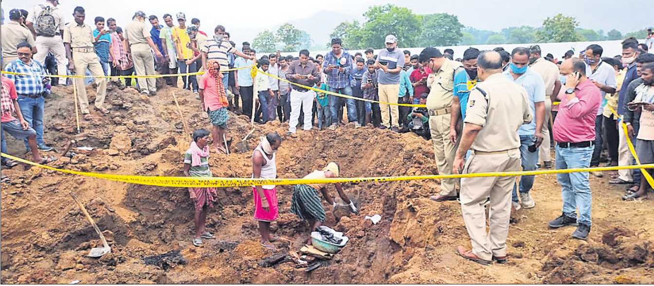
ମହାଲିଙ୍ଗ ହାଇସ୍କୁଲର ନିର୍ମାଣାଧୀନ କ୍ଷୁଦ୍ରମରେ କେସିବି ବ୍ଲକ୍ ମାଟି ଖୋଳାଯାଉଥିବା ବେଳେ ଲୋକଙ୍କ ଭିଡ଼।