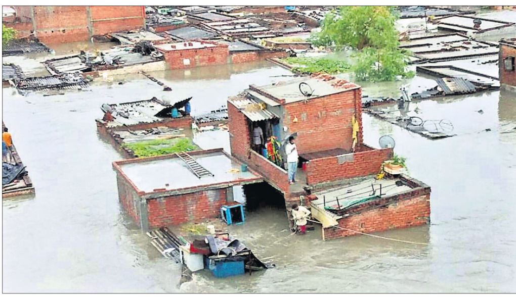
ଲଗାଣ ବର୍ଷରେ ରୁଦ୍ରପୁରର ଘରଗୁଡ଼ିକ ବୁଡ଼ିଯାଇଛି।

ଦେବକୁମ୍ଭି ଉତ୍ତରାଖଣ୍ଡକୁ ବିପତ୍ତିକୁ ଡାକି ଆଣିଛି ଲଗାଣ ବର୍ଷ। ବାଦଲଫତା ବର୍ଷା ଓ ଭୃଷ୍ଟକନ ଯୋଗୁ ମଙ୍ଗଳବାର ୨୪ ଜଣଙ୍କ ମୃତ୍ୟୁ ଘଟିଛି। ଏହାସହ ମୃତକଙ୍କ ସଂଖ୍ୟା ୩୪୪କୁ ବୃଦ୍ଧି। ରେଷ୍ଟୁ ଅପରେଶନରେ ନିୟୋଜିତ ଏନ୍ଡିଆରଏଫ୍ ଅଧ୍ୟକ୍ଷ ୩୦୦ ଜଣଙ୍କୁ ସୁରକ୍ଷିତ ଭାବେ ଉଦ୍ଧାର କରିଥିବା କହିଛି।