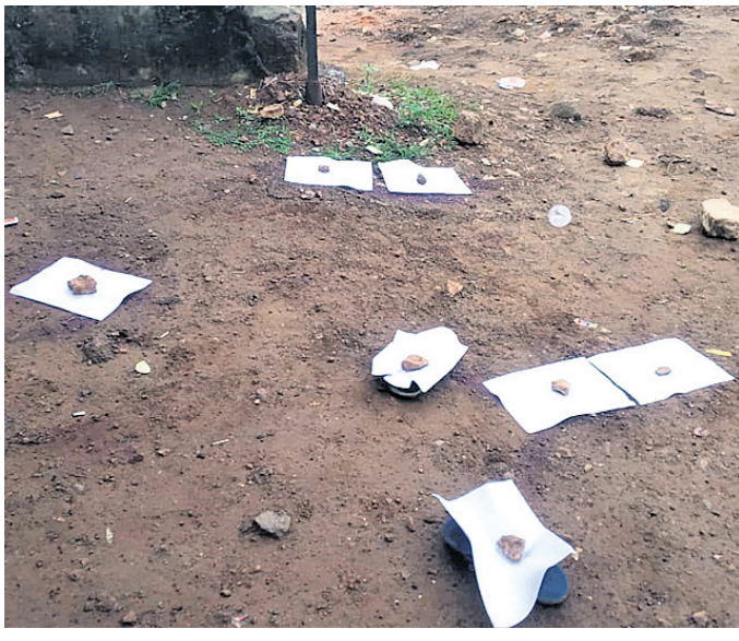
ରୁକ୍ଷକାଣ୍ଡ ହୋଇଥିବା ସ୍ଥାନ ।