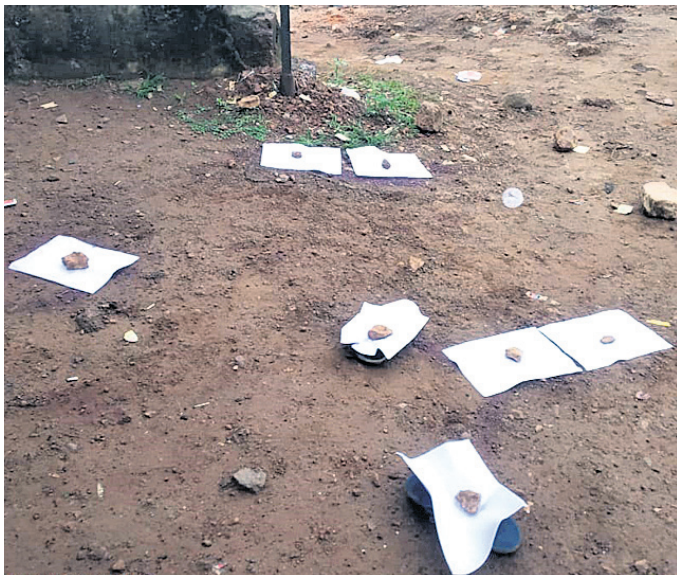
ରୁକ୍ମିକାଣ୍ଡ ହୋଇଥିବା ସ୍ଥାନ।