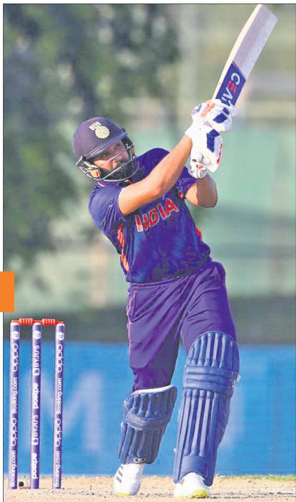
ଅର୍ଦ୍ଧଶତକୀୟ ଇନିଂସ୍ ଅବସରରେ ରୋହିତ ଶର୍ମା ।

ଦ୍ଵିତୀୟ ତଥା ଅନ୍ତିମ ଅଭ୍ୟାସ ମ୍ୟାଚରେ ୧୩ଟି ବଲ୍ ବାକି ଥାଇ ଭାରତ ୮ ଉଇକେଟରେ ଅଷ୍ଟ୍ରେଲିଆକୁ ପରାସ୍ତ କରିଛି । ଏଥିସହ ଭାରତ ବିଶ୍ଵକପ୍ ପୂର୍ବରୁ ତା'ର ପ୍ରସ୍ତୁତି ଜୋରଦାର କରିଛି । ଏହାପୂର୍ବରୁ ଭାରତ ପ୍ରଥମ ଖ୍ରୀଷ୍ଟିୟ ମ୍ୟାଚରେ ଇଂଲଣ୍ଡକୁ ୭ ଉଇକେଟରେ ପରାସ୍ତ କରିଥିଲା । ରୁଧିରାଣୀ ଗାନ୍ଧୀ ଆଇସିସି ଏକାଡେମୀରେ ଖେଳାଯାଇଥିବା ଏହି ମ୍ୟାଚରେ ହାର୍ଦିକ ପାଣ୍ଡା ଛକା ମାରି ଭାରତକୁ ଜିତାଇଥିଲେ । ସେ ଜିତି ଅଷ୍ଟ୍ରେଲିଆ ପ୍ରଥମେ