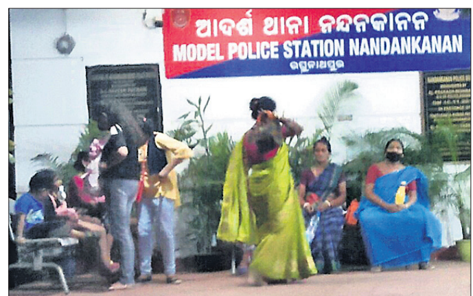
ନନ୍ଦନକାନନ ଆନାକୁ ଅଭିଯୋଗ କରିବାକୁ ଆସିଥିବା ପର୍ଯ୍ୟଟକ।

ବସିବାପରେ ନନ୍ଦନକାନନର କୌଣସି ଅଧିକାରୀ ନ ଆସିବାରୁ ବାଧ୍ୟହୋଇ ନନ୍ଦନକାନନ ଆଗରେ ଅଭିଯୋଗ କରିବା ପରେ ଗାଲ୍‌ଡ୍ କାଉଣ୍ଟର ବାଧିତ୍ୱରେ ଥିବା ଗାଲ୍‌ଡ୍‌ମାନେ ଆନାକୁ ଯାଇ ଟଙ୍କା ଫେରାଇବା ପରେ ରାତି ୭ଟାରେ ପର୍ଯ୍ୟଟକମାନେ ଫେରିଥିଲେ। ସୂଚନା ଅନୁଯାୟୀ, ଅପରାହ୍ନ ୪ଟାରେ ପଶ୍ଚିମବଙ୍ଗ ପୂର୍ବିକାବାଦ ଅଞ୍ଚଳକୁ ଅଧିକ ନିକାର ଓ ସୁନତା କରାଇ ପରିବାର ଏବଂ ସମ୍ପ୍ରଦାୟକ ସହ ନନ୍ଦନକାନନ ବୁଲିବାକୁ ଆସିଥିଲେ।