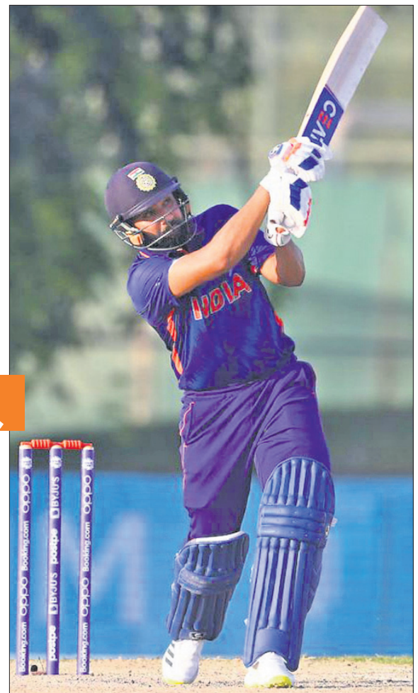
ଅର୍ଦ୍ଧଶତକୀୟ ଇନିଂସ୍ ଅବସରରେ ରୋହିତ ଶର୍ମା।

ବୁବଲ, ୨୦୧୯ ଦ୍ୱିତୀୟ ତଥା ଅନ୍ତିମ ଅଭ୍ୟାସ ମ୍ୟାଚରେ ୧୩ଟି ବଲ ବାଜି ଥାଇ ଭାରତ ୮ ଉଇକେଟରେ ଅଷ୍ଟ୍ରେଲିଆକୁ ପରାସ୍ତ କରିଛି। ଏଥିସହ ଭାରତ ବିଶ୍ୱକପ୍ ପୂର୍ବରୁ ତା'ର ପ୍ରସ୍ତୁତି ଜୋରଦାର କରିଛି। ଏହାପୂର୍ବରୁ ଭାରତ ପ୍ରଥମ ଖ୍ରୀଷ୍ଟିୟ ମ୍ୟାଚରେ ଇଂଲଣ୍ଡକୁ ୭ ଉଇକେଟରେ ପରାସ୍ତ କରିଥିଲା। ବୁଧବାର ସ୍ଥାନୀୟ ଆଇସିସିଏ ଏକାଡେମୀରେ ଖେଳାଯାଇଥିବା ଏହି ମ୍ୟାଚରେ ହାର୍ଦିକ ପାଣ୍ଡା ଛକା ମାରି ଭାରତକୁ ଜିତାଇଥିଲେ। ସେ ଜିତି ଅଷ୍ଟ୍ରେଲିଆ ପ୍ରଥମେ