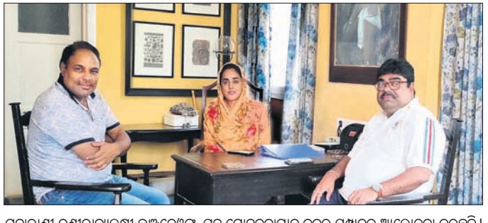
ମହାରାଜା ରଘୁରାଜ୍ୟକଳା ଭଣ୍ଡାରରେ ସହମେନାଗାରୀ କ୍ଳବ ସମାପନ ଆଲୋଚନା କରୁଛନ୍ତି

ମୟୂରଭଞ୍ଜରେ ବନ୍ଦ ଥିବା ଶ୍ରୀରାମଚନ୍ଦ୍ର ମେମୋରିଆଲ ଫୁଟବଲ ଟୁର୍ଣ୍ଣାମେଣ୍ଟ ପୁଣିଥରେ ଆରମ୍ଭ ହେବ