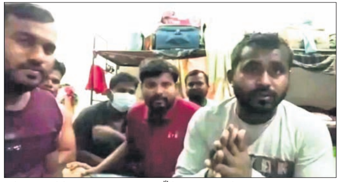
ଶ୍ରମିକମାନେ ଭିଡିଓ ମାଧ୍ୟମରେ ଉଦ୍ଧାର ପାଇଁ ନିବେଦନ କରୁଛନ୍ତି ।