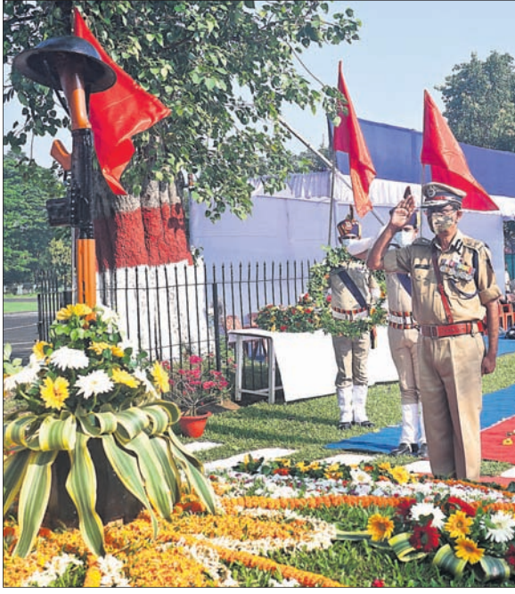
କଟକସ୍ଥିତ ପୋଲିସ ମୁଖ୍ୟାଳୟରେ ଶହାଦ ଦିବସ ପାଳିତ ହୋଇଥିଲା।

ପୋଲିସ ମୁଖ୍ୟାଳୟ ପରିସରରେ ଗୁରୁବାର ୨୨ତମ ରାଜ୍ୟପୁରାଇ ପୋଲିସ ଶହାଦ ଦିବସ ପାଳିତ ହୋଇଯାଇଛି।