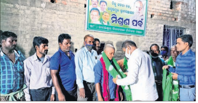
ନୂତନ କର୍ମୀମାନଙ୍କୁ ବିଧାୟକ ଉଦ୍‌ଘୋଷଣା କରାଯାଇଛି

ବାଲେଶ୍ୱର ସଦର ବ୍ଲକ୍ ଅଧୀନ ରସଲପୁର ପଞ୍ଚାୟତରେ ବିଜେଡିର ଏକ ମିଶ୍ରଣ ପର୍ବ ଅନୁଷ୍ଠିତ ହୋଇଯାଇଛି