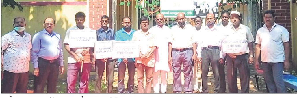
ବାଲେଶ୍ୱର ଅତି ଉତ୍ସାହ ପତ୍ର ଉପରେ ବାଲେଶ୍ୱର ଜିଲ୍ଲା କଲେକ୍ଟରଙ୍କ ଦ୍ୱାରା ପ୍ରଦତ୍ତ ଅଧିକାରୀଙ୍କ ଦ୍ୱାରା