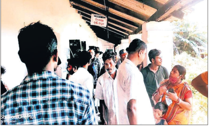
ଶିବିରରେ ବିଦ୍ୟାଳୟାଳୟ ସାମ୍ବ୍ୟ ପରୀକ୍ଷା କରାଯାଇଛି

ବାଲେଶ୍ୱର ଜିଲ୍ଲା ବାହାନଗା ବ୍ଲକ୍ ବାହାନଗା ପଞ୍ଚାୟତର ଉପସଭାରେ ବିଦ୍ୟାଳୟ ପରିସରରେ ଭୀମଭୋଇ ସାମର୍ଥ୍ୟ ଶିବିର ଅନୁଷ୍ଠିତ ହୋଇଛି