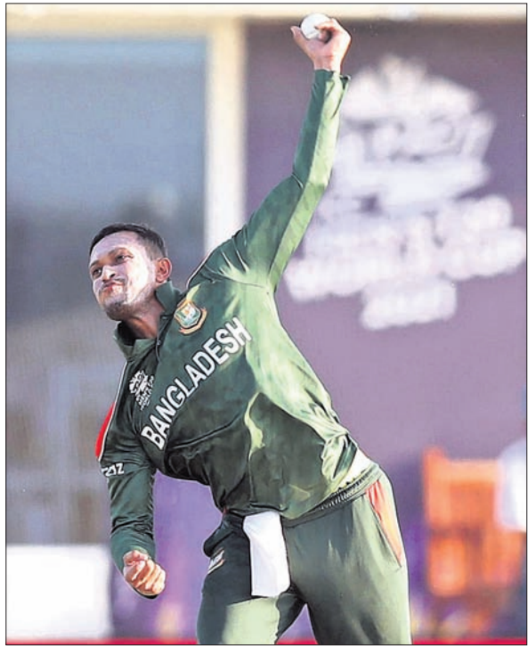
ମ୍ୟାନ ଅଫ୍ ଦି ମ୍ୟାଚ୍ ଶକିବ ଅଲ୍ ହାସନ।

(୩୭ ବଲ୍, ୩ ରନ) କରିଥିବା ବାଂଲାଦେଶ ଅଲରାଉଣ୍ଡର ଶକିବ ଅଲ୍ ହାସନ ପୁରୁସ୍କାର ଅର୍ଜନ କରିଥିଲେ। ୧୯.୩ ଓଭରରେ ୯୬ ରନରେ ଅଲରାଉଣ୍ଡ ହୋଇ ପରାସ୍ତ ହୋଇଥିଲା। ୯ ରନ ଦେଇ ୪ ରନକେଟ ଅଭିଆର କରିବା ସହ ଦ୍ରୁତ ୪୬ ରନ