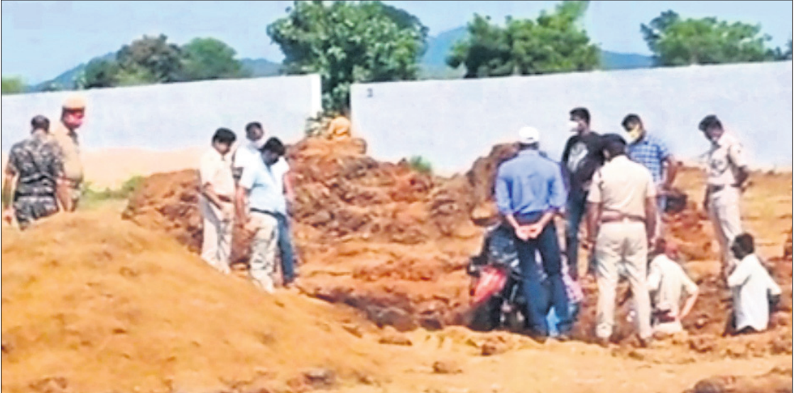
ତିଆଇଜି ଓ ଏସ୍ପି ତଦନ୍ତ କରୁଛନ୍ତି ।