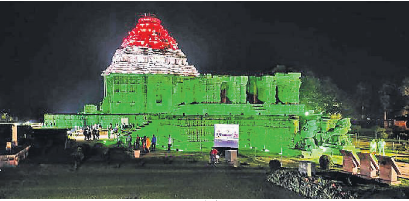
କୋଭିଡ଼ ଟିକାକରଣ ଗୁରୁବାର ୧୦୦ କୋଟି ଟପିବା ଅବସରରେ ଏଏସଆଇ ପକ୍ଷରୁ କୋଣାର୍କ ସୂର୍ଯ୍ୟ ମନ୍ଦିରକୁ ଡିଜିଟାଲ ଆଲୋକମାଳାରେ ସଜ୍ଜିତ କରାଯାଇଛି।