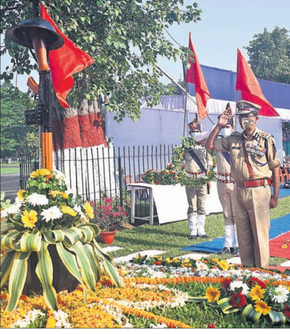
କଟକସ୍ଥିତ ପୋଲିସ ମୁଖ୍ୟାଳୟରେ ଶହାଦ ଦିବସ ପାଳିତ ହୋଇଥିଲା।

ପୋଲିସ ମୁଖ୍ୟାଳୟ ପରିସରରେ ଗୁରୁବାର ୨୨ତମ ରାଜ୍ୟପୁରାଇ ପୋଲିସ ଶହାଦ ଦିବସ ପାଳିତ ହୋଇଯାଇଛି।