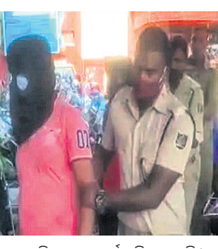
କରୋନା ଅଭିଯୁକ୍ତଙ୍କ କୋର୍ଟକୁ ନିଆଯାଇଛି।