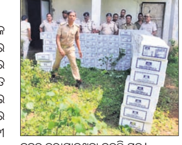
ଜବତ କରାଯାଇଥିବା ନକଲି ମଦ।