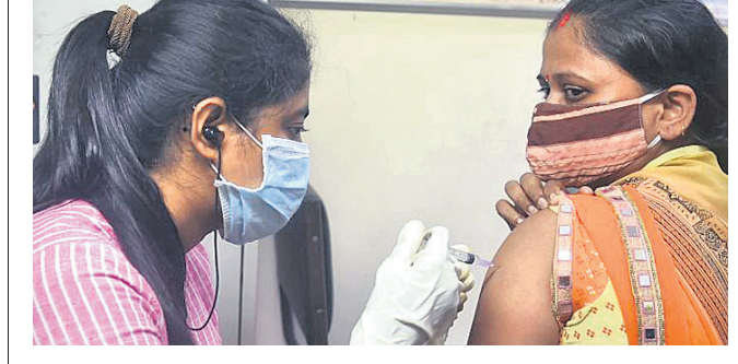
କୋଲକାତାରେ ଏକ ଟିକାକରଣ କେନ୍ଦ୍ରରେ ଶୁକ୍ରବାର ଜଣେ ମହିଳା ଭାବିନ ନେଉଛନ୍ତି।

ଟିକା ସଫଳତାକୁ ନେଇ ଉତ୍ସବ ପାଳିବା ପରିବର୍ତ୍ତେ ଦେଶ ସମ୍ପୂର୍ଣ୍ଣାନ୍ତ ହୋଇଥିବା ସମସ୍ୟା ପ୍ରସଙ୍ଗରେ ପ୍ରଧାନମନ୍ତ୍ରୀ କହିବା ଉଚିତ। ମୋଦି ଦେଶବାସୀଙ୍କୁ ମିଛ ତଥ୍ୟ ଦେଇ ବିଭ୍ରାନ୍ତ କରୁଛନ୍ତି। ଚାଇନା ସେପ୍ଟେମ୍ବର ମୁଖ୍ୟ ୨୧୬ କୋଟି ଡୋଲ୍ ଟିକା ଦେଇଥିବାବେଳେ ଭାରତ ପ୍ରଥମ ଦେଶ ଭାବେ ୧୦୦ କୋଟି ଟପିବା ମିଳିଛି। ଚାଇନା ୮୦% ଲୋକଙ୍କୁ ତଦଳ ଡୋଲ୍ ଟିକା ଦେଇଥିବାବେଳେ ଭାରତ ମାତ୍ର ୨୧%କୁ ଦେଇଥିବା ସେ କହିଛନ୍ତି। ପ୍ରଧାନମନ୍ତ୍ରୀ ଟିକାକରଣ ସଫଳତା ସମ୍ପର୍କରେ ଉଦ୍‌ବୋଧିତା ଦେବା ଅବସରରେ ସରକାରଙ୍କ ସାମର୍ଥ୍ୟକୁ ନେଇ ପ୍ରଶଂସା କରୁଥିବା ଲୋକଙ୍କୁ ଉପଯୁକ୍ତ ଜବାବ ମିଳିଛି ବୋଲି କହିଥିଲେ। ନୂଆ ଭାରତ କଠିନ ଲକ୍ଷ୍ୟ ଧାର୍ଯ୍ୟ କରି ତାହା ହାସଲ କରିପାରେ ବୋଲି ମୋଦି ଦୃଢ଼ଭାବେ କହିଥିଲେ।