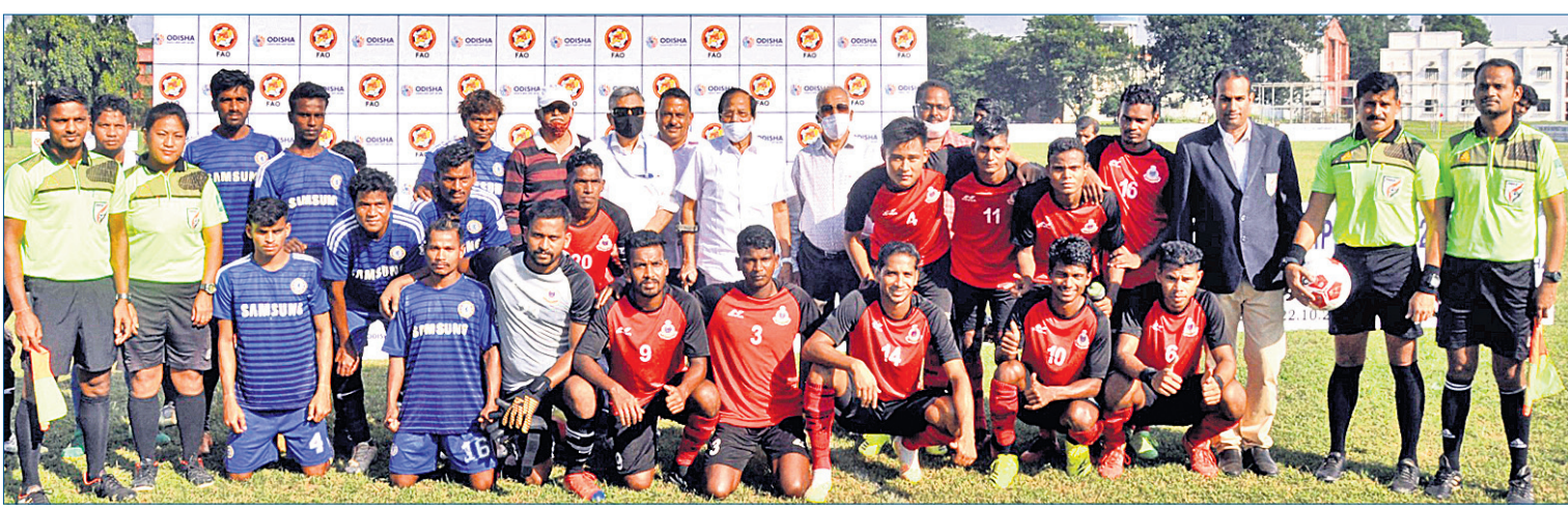
ଆକ୍ଷୟଜିଲା କୁବ ପୁଟବଲ ଚାମ୍ପିୟନଶିପର ଉଦ୍ଘାଟନା ଉତ୍ସବରେ ଅତିଥିକ ସହ ଖେଳାଳିମାନେ।