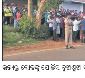
ଉତ୍ତରକୋଟ ପୋଲିସ୍ ବୁଝାଶୁଝା କରୁଛି।

ବିଶାଖାପାଟଣା ସ୍ଥାନାନ୍ତର କରାଯାଇଛି। ହିରଣ୍ୟଙ୍କ ଚିକିତ୍ସା କୋରାପୁଟରେ ଚାଲିଛି। ମୃତ ଧବଳୁଙ୍କ ମୃତଦେହ ବ୍ୟବଚ୍ଛେଦ ପରେ ପରିବାର ଲୋକଙ୍କୁ ହସ୍ତାନ୍ତର କରାଯାଇଛି। ତେବେ ଆସ୍ଥାଳୟ ଯୋଗେ ଗାଁକୁ ମୃତଦେହ ନେବାବେଳେ ଦୁର୍ଘଟଣାସ୍ଥଳ ରେଡ୍‌ଲାଇନ୍ ହୋଇଥିଲା ନିକଟରେ ମୃତଦେହ ରଖି କ୍ଷତିପୂରଣ ଦାବିରେ ପରିବାର ଲୋକେ ଏବଂ ଗ୍ରାମବାସୀ ଚିକିତ୍ସା-ତଜାସିଲ ରାସ୍ତା ଅବରୋଧ କରିଥିଲେ। ଖବରପାଇ ଚିକିତ୍ସା ପୋଲିସ୍ ପହଞ୍ଚି ପରିବାର ଲୋକଙ୍କୁ ବୁଝାଶୁଝା କରିଥିଲା। ଦୁର୍ଘଟଣା ଘଟଣାସ୍ଥଳ ବାଇକ ବାଲିକ ୧ଲକ୍ଷ ଟଙ୍କା କ୍ଷତିପୂରଣ ଦେବା ପରେ ରାସ୍ତାରୋକ ହଟିଥିଲା।