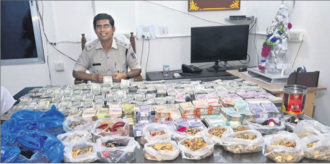
ଖଲିକୋଟ ଖୋଜାପଲିର ନିଶା ବେପାରୀଙ୍କ ଘରୁ ଜବତ ତଙ୍କା, ସୁନା ଓ ଗିରଫ ଅଭିଯୁକ୍ତ ସମ୍ପର୍କରେ ଏସ୍ପି ବିଭାଗର ଉପ ସୂଚନା ଦେଉଛନ୍ତି।

ନିର୍ବାଚିତ ଜଗଜମାଳି, ପ୍ରବାଦ, ପ୍ରବଚନ ଓ ଅନ୍ୟାନ୍ୟ - ପ୍ରାଚୀ ସାହିତ୍ୟ ପ୍ରତିଷ୍ଠାନ