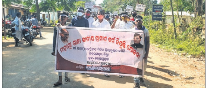
ଗାଁ ସାଥୀମାନେ ଶୋଭାଯାତ୍ରାରେ ସହର ପରିକ୍ରମା କରୁଛନ୍ତି।