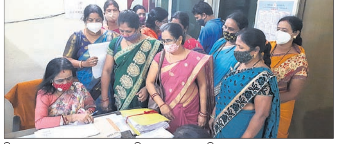
ଜିଲା ସମାଜ କଲ୍ୟାଣ ଅଧିକାରୀ ଦାବିପତ୍ର ଗ୍ରହଣ କରୁଛନ୍ତି।

ପଦକ୍ଷେପ ନ ନେଲେ ପରିବାର ସହ ବାଧ୍ୟ ହୋଇ ଧାରଣାରେ ବସିବ ବୋଲି ସେମାନେ ଚେତାବନୀ ଦେଇଛନ୍ତି। ରାଜ୍ୟ ସରକାରଙ୍କ ନିର୍ଦ୍ଦେଶକ୍ରମେ