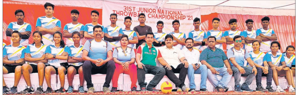
ଜାତୀୟ କ୍ରୀଡ଼ା ଫୋର୍ମାସନ୍ ପ୍ରତିଯୋଗିତାରେ କ୍ୱାର୍ଟର ପାଇନାଲରେ ପ୍ରବେଶ କରିଥିବା ଓଡ଼ିଶା ବାଳିକା ଓ ବାଳକ ଦଳର ଖେଳାଳିମାନେ କର୍ମଚାରୀଙ୍କ ସହ।

ଏକାଡେମୀ ଏକାଡେମୀ ଆଲୋକାଣ୍ଡୋଭା କ୍ରେମ୍‌ଲିନ୍ କିଟ୍ ଚେନିସ ଟୁର୍ନାମେଣ୍ଟ ମହିଳା ସିଙ୍ଗଲ୍ ସେମିଫାଇନାଲରେ ପ୍ରବେଶ କରିଛନ୍ତି। କ୍ୱାର୍ଟରପାଇନାଲରେ ସେ ଆରିନା ସାବାଲେଙ୍କାଙ୍କୁ ୬-୩, ୬-୪ ସେଟ୍‌ରେ ପରାସ୍ତ କରିଛନ୍ତି। କରୋନାକୁ ସୁସ୍ଥ ହେବା ପରେ ସାବାଲେଙ୍କାଙ୍କର ଏହା ହେଉଛି ପ୍ରଥମ ଟୁର୍ନାମେଣ୍ଟ। ପ୍ରତିଯୋଗିତାରେ ୨ଟି ମ୍ୟାଚ ପରେ ତାଙ୍କ ଅଭିଯାନ ଶେଷ ହୋଇଛି। ଆଲୋକାଣ୍ଡୋଭା ସେମିଫାଇନାଲରେ ମାରିଆ ସାବାଲି କିମ୍ପା ସିମୋନା ହାଲେପଙ୍କୁ ଭେଟିବେ। ମାର୍କେଟା ଭେଟୋସୋଭା ଆନାସ୍ତାସିଆ ପ୍ୟାଲକ୍ୟୁରେଙ୍କୋଭାଙ୍କୁ ୬-୪, ୬-୨ ସେଟ୍‌ରେ ପରାସ୍ତ କରିଛନ୍ତି।