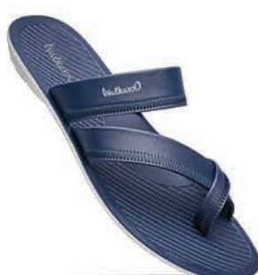
WG5340 | MRP: ₹ 279.00*