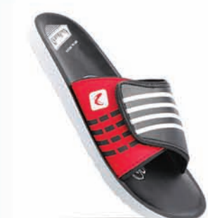
WG5319 | MRP: ₹ 319.00*