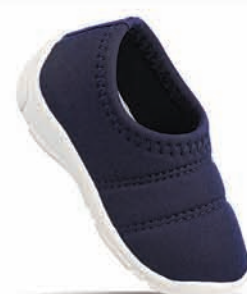
571 | MRP: ₹ 169.00*