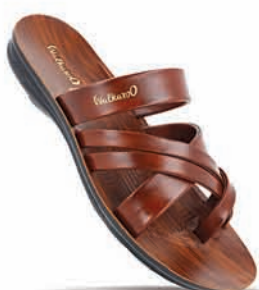
W5687 | MRP: ₹ 309.00*