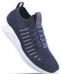
WS9507 | MRP: ₹ 898.00*