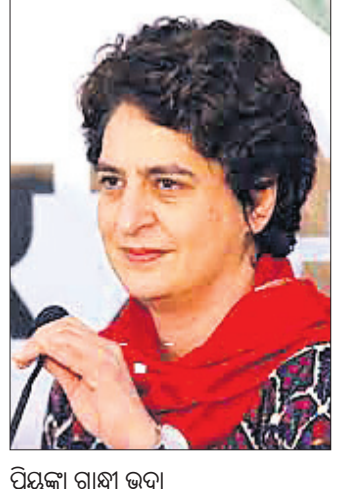
ପ୍ରୟୋଗ ଗୋଆ ଭଦ୍ରା

ଆରାମୀ ଉତ୍ତରପ୍ରଦେଶ ବିଧାନସଭା ନିର୍ବାଚନରେ କଂଗ୍ରେସ ଉପରାଜ୍ୟ ସଭାକୁ ଆସିଲେ ମହାମାରୀ ସମୟରେ ବିଦ୍ୟୁତ୍ ବିଲ୍ ଛାଡ଼ି କରାଯିବ ବୋଲି କହିଛନ୍ତି। ପ୍ରମୋଦଙ୍କୁ ଗୋଆ ମୁଖ୍ୟମନ୍ତ୍ରୀ ପଦରୁ ହଟାଇବାକୁ ବୋଧହୁଏ ବୋଲି କହିଛନ୍ତି।