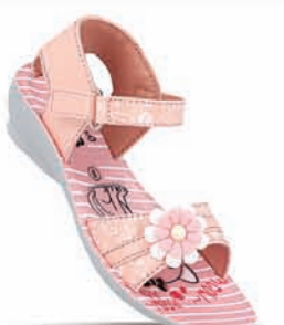
WK768 | MRP: ₹ 256.00*| ₹ 279.00*