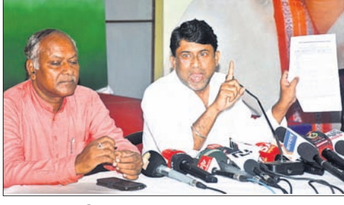
ଖବରଦାତା ସମ୍ମିଳନୀରେ ସତ୍ୟପ୍ରକାଶ (ତାହାଣ୍ଡା)।