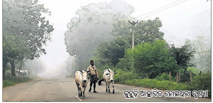
କୁହୁଡ଼ି ଆଣ୍ଡାଦିତ ହୋଇଥିବା ଦୁଗଣ୍ଡା

ଓଡ଼ିଶାର କଣ୍ଠାର କୁହାଯାଉଥିବା କନ୍ଧମାଳ ଜିଲ୍ଲା ଦାରିଙ୍ଗବାଡ଼ିରେ ଚଳିତବର୍ଷର ପହିଲି ଶୀତ ଅନୁଭୂତ ହୋଇଛି। ଗୋଟିଏ ଦିନରେ ପାରଦ ୫ ଡିଗ୍ରୀ ଡାଳୁ ଖସିଛି। ଶୁକ୍ରବାର ଏଠାରେ ସର୍ବନିମ୍ନ ତାପମାତ୍ର ୧୬ ଡିଗ୍ରୀ ରହିଥିବା ବେଳେ ଶନିବାର ୧୧ ଡିଗ୍ରୀ ଖସିଥିବା ପ୍ରଶଂସନ ପକ୍ଷରୁ ସୂଚନା ଦିଆଯାଇଛି। ଅଞ୍ଚଳରେ ହଠାତ୍ ଶୀତ ଆସିଥିବାରୁ ପର୍ଯ୍ୟଟକମାନେ ଖୁସି ଅନୁଭବ କରୁଛନ୍ତି। ରାତି ଓ ଭୋରରେ ଅଧିକା ଶୀତ ଅନୁଭୂତ ହେଉଥିବାରୁ ଲୋକେ ଶୀତବସ୍ତ୍ର ବ୍ୟବହାର ସହ ନିଆଁ ନିକଟରେ ବସୁଥିବା ଦେଖାଯାଇଛି। ପ୍ରାତଃ ଭ୍ରମଣକାରୀମାନେ ଖରା ପଡ଼ିବା ପରେ ଘରୁ ବାହାରିଛନ୍ତି। ଗତ