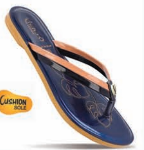
WL7051 | MRP: ₹ 249.00*