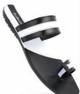
WG1317 | MRP: ₹ 279.00*