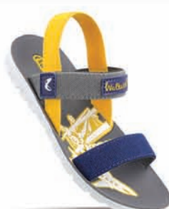
WK756 | MRP: ₹ 199.00*| ₹ 219.00*