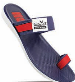
WG5328 | MRP: ₹ 269.00*