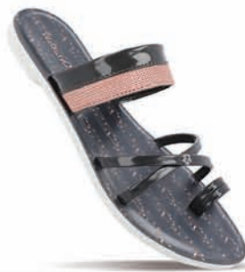
WL7374 | MRP: ₹ 29.00*