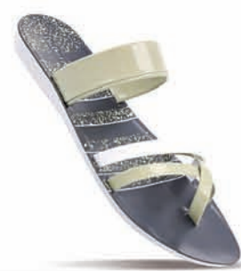
WL7364 | MRP: ₹ 234.00*