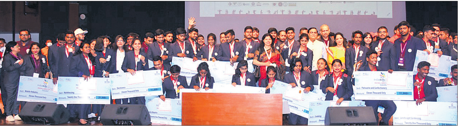
ପାଟଣାସ୍ଥିତ ବାପୁ ସଭାଗାରଠାରେ ଆୟୋଜିତ ପୂର୍ବାଞ୍ଚଳ ଲକ୍ଷ୍ମିଆ ସିଲ୍ଲୁ ପ୍ରତିଯୋଗିତାରେ ଉତ୍ତୀର୍ଣ୍ଣପତ୍ର ଦିବସରେ ଓଡ଼ିଶା କୃତୀ ପ୍ରତିଯୋଗୀମାନେ ।