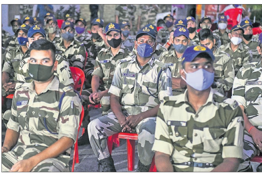
ମୁଖାଭିମୁଖ ସିଆଇଏସ୍‌ଏସ୍ କ୍ୟାମ୍ପରେ ଯବାନମାନେ ରବିବାର ଭାରତ-ପାକିସ୍ତାନ ଚିନ୍ତା ବିଶ୍ଵକପ ମ୍ୟାଚ ଦେଖୁଛନ୍ତି।

ରହିବା ସହ ଦଳକୁ ଜିତାଇଥିଲେ। ପଞ୍ଚମ ଉଇକେଟରେ ଅସଲଙ୍କା ଓ ରାଜପାକ୍‌ସେ ୫୨ ବଲରୁ ଗୁରୁତ୍‌ପୂର୍ଣ୍ଣ ୮୭ ରନ ସଂଗ୍ରହ କରିଥିଲେ। ବୋଲିଂରେ ବାଂଲାଦେଶ ତରଫରୁ ନମ୍ପୁ ଓ ଶକିବ ୨ଟି ଲେଖାଏ, ମହମ୍ମଦ ସୈଦୁଲ୍‌ଲୀ ଗୋଟିଏ ଉଇକେଟ ଅଭିଆର କରିଥିଲେ। ଚ୍ୟ ହାରି ବ୍ୟାଟି ପାଇଁ ଆମନ୍ତ୍ରଣ ପାଇଥିବା ବାଂଲାଦେଶ ତରଫରୁ ଓପନର ମହମ୍ମଦ ନଲମ୍ ଓ ମୁସ୍‌ଫିକର ରହି ଅପରାଜିତ ଅର୍ଦ୍ଧଶତକ ଲାଭ କରିଥିଲେ। ସମ୍ପାନକନକ ଷ୍ଟୋର ପ୍ରଦାନ କରିଥିଲେ। ଅନ୍ୟତମ ଓପନର ଲିଟେନ ଦାସ ୧୬, ଅଲରାଉଣ୍ଡର ଶକିବ ୧୦, ଅଫିସ୍ ହୋସେନ ୭ ରନକରି ପ୍ୟାଭଲିୟନ ଫେରିଥିଲେ।