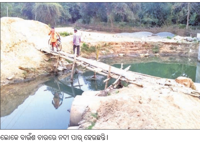
ଲୋକେ ବାଉଁଶ ଚାରରେ ନଦୀ ପାର ହେଉଛନ୍ତି।

ଜନସାଧାରଣଙ୍କ ଦାବି କ୍ରମେ ଏମିତି ଓ ବିଧାୟକଙ୍କ ସହଯୋଗରେ ଏଠାରେ ବିକ୍ଷୁ ସେତୁ ନିର୍ମାଣ ପାଇଁ ୪ କୋଟି ୨୧ ଲକ୍ଷ ୯୨ ହଜାର ୪୨୦ ଟଙ୍କାର ପ୍ରକଳ୍ପ ମଞ୍ଜୁର ହୋଇଥିଲା। ପୋଲ ନିର୍ମାଣ ଲାଗି ବେଶ୍ଵର ପ୍ରକ୍ରିୟା ଶେଷ ହେବା ପରେ ପୁଣ୍ୟମନ୍ତ୍ରୀ ଶିଳାନ୍ୟାସ କରିଥିଲେ। ୨୦୧୭ ଫେବୃଆରୀ ୪ରେ ନିର୍ମାଣ କାର୍ଯ୍ୟ ଆରମ୍ଭ ହୋଇ ୨୦୧୭ ଅକ୍ଟୋବର ୩ରେ ଶେଷ ହେବାର ଥିଲା। କିନ୍ତୁ ଅବଧି ଶେଷ ହେବା ପରେ ବିଳମ୍ବରେ ତଥା ୨୦୨୦ ଜୁନ୍ ବେଳକୁ କାମ ସରିଥିଲା। ଏହି ଗୋଲ ନିର୍ମାଣ ହେଲେ ଶ୍ରୀରାମପୁର, ଗୋପାନାଥପୁର, ଚିକିରା ଆଦି ଗ୍ରାମର ୮ ହଜାର ଲୋକେ ଉପକୃତ ହେବେ ବୋଲି ଫଳକରେ ଉଲ୍ଲେଖ କରାଯାଇଛି। ଗ୍ରାମ୍ୟ ଉନ୍ନୟନ ବିଭାଗ ପକ୍ଷରୁ ପୋଲ ନିର୍ମାଣ ସରିଥିଲେ ମଧ୍ୟ ଏଯାଏ