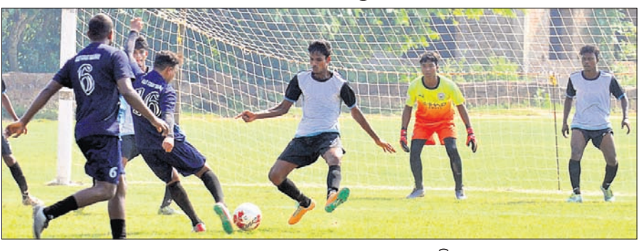
ଇଣ୍ଡୋନେସିଆ ରେକର୍ଡ଼ ଓ ଶ୍ରୀ ନାଳଚକ୍ର କ୍ଲବ ମଧ୍ୟରେ ଅନୁଷ୍ଠିତ ମ୍ୟାଚ।

ଭୁବନେଶ୍ଵର, ୨୪।୧୦ (ବ୍ରାହ୍ମା ପ୍ରତିନିଧି): ପୁରୀରୁ ଆସିଥିବା ଶକିବଙ୍କୁ ଚାଲିଥିବା ଆନ୍ତର୍ଜାତୀୟ କ୍ଲବ ପୁରୀରୁ ଚାମ୍ପିୟନଶିପର ୩ୟ ଦିବସରେ ରବିବାର ୧୦ଟି ମ୍ୟାଚ ଅନୁଷ୍ଠିତ ହୋଇଛି। ଏଥିରେ କେବଳ ସ୍ପୋର୍ଟ୍ସ ହଷ୍ଟେଲ ୭-୦ ଗୋଲରେ ବାଲେଶ୍ଵର ଚାଉଁସ କ୍ଲବ, ଓଡ଼ିଶା ପୋଲିସ ୪-୦ ଗୋଲରେ ବୋକର ଗୋଲହାମା କ୍ଲବ, କେକ