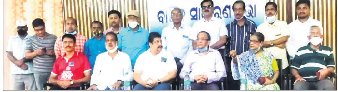
ବାର୍ଷିକ ସାଧାରଣ ସଭାରେ ଉପସ୍ଥିତ ପୁରାତନ ଛାତ୍ରସଂସଦର କର୍ମକର୍ତ୍ତା ।