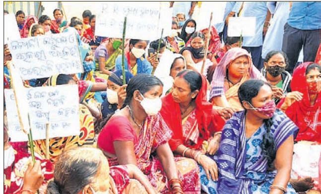
କମ୍ପାନୀ ଗେଟ ବନ୍ଦକରି ଧାରଣା ଦେଇଛନ୍ତି ବିସ୍ମାପିତ।