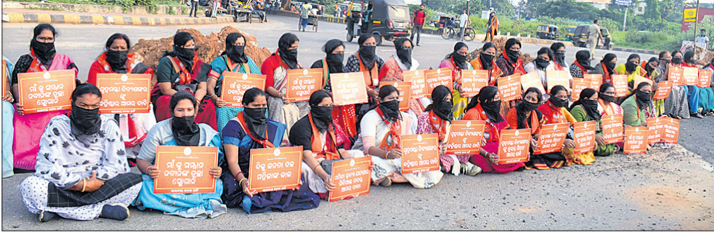
ଭୁବନେଶ୍ୱର ମାଷ୍ଟର କ୍ୟାଣ୍ଟିନ୍‌ଠାରେ ସୋମବାର ଭାଜପା ମହିଳା ମୋର୍ଚ୍ଚା ପକ୍ଷରୁ ମୌନ ଧାରଣା।