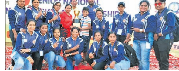
ବ୍ରୋଞ୍ଜି ପଦକ ଜିତିଥିବା ଓଡ଼ିଶା ବାଳିକା ଦଳ କର୍ମକର୍ତ୍ତାଙ୍କ ସହ।