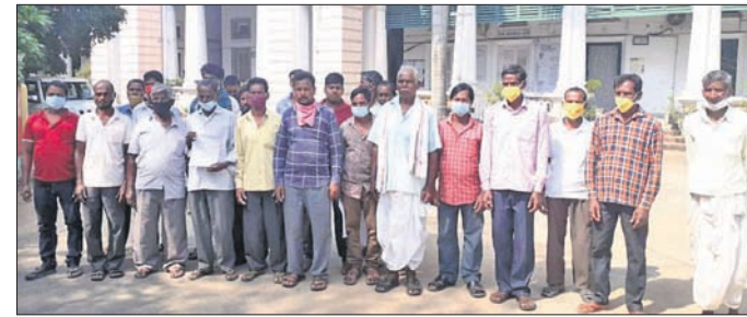
ଦାସ କମିଟି କାର୍ଯ୍ୟକାରୀ ପାଇଁ ଛାଟିଆ ଗ୍ରାମବାସୀ ଜିଲ୍ଲାପାଳଙ୍କ ଦ୍ୱାରସ୍ଥ ହୋଇଛନ୍ତି।

ଦାସ କମିଟି କାର୍ଯ୍ୟକାରୀ ପାଇଁ ବିଦ୍ୟୁତ୍ ସଂଯୋଗକରଣ ହୋଇ ନ ଥିବାରୁ ଏହା ହୋଇପାରିନାହିଁ।