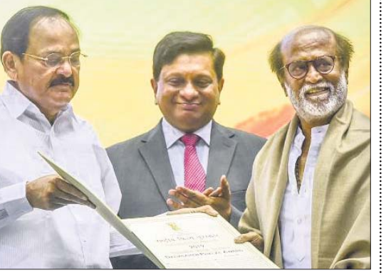
ଉପରାଷ୍ଟ୍ରପତି ଏନ୍. ଭେଙ୍କାୟା ନାଲନ୍ଦୁଙ୍କଠାରୁ ଦାଦା ସାହେବ ଫାଲ୍‌କେ ଆଘାତ ଗ୍ରହଣ କରୁଥିବା ପୁସ୍ତକର ରଜନୀକାନ୍ତ

ନୂଆଦିଲ୍ଲୀ, ୨୫.୧୦ ନୂଆଦିଲ୍ଲୀରେ ବିଜ୍ଞାନ ଭବନରେ ସୋମବାର ଆୟୋଜିତ ୬୭ତମ ଜାତୀୟ ଫିଲ୍ମ ପୁରସ୍କାର ସମାରୋହରେ ପୁସ୍ତକର ରଜନୀକାନ୍ତ ସମ୍ମାନଜନକ ଦାଦା ସାହେବ ଫାଲ୍‌କେ ଆଘାତ ଗ୍ରହଣ କରିଛନ୍ତି। ସବୁ ବୟସ ବର୍ଗର ଲୋକଙ୍କ ପାଇଁ ଆବଶ୍ୟକ ପାଠ୍ୟପୁସ୍ତକ ତଥା ଆଲୋଚନା (ଗୋପିନାଥ ନେତା) ଭାବେ ପରିଚିତ ରଜନୀକାନ୍ତଙ୍କୁ ୨୦୧୯ ବର୍ଷ ପାଇଁ ସିନେମା ଜଗତର ସର୍ବୋଚ୍ଚ ସମ୍ମାନ ମିଳିଛି। ଉପରାଷ୍ଟ୍ରପତି ଏନ୍. ଭେଙ୍କାୟା ନାଲନ୍ଦୁ ତାଙ୍କୁ ଏହି ପୁରସ୍କାର ପ୍ରଦାନ କରିଥିଲେ।