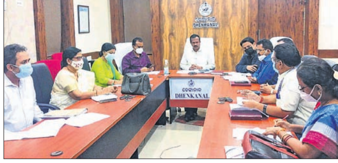
ଜିଲ୍ଲାପାଳଙ୍କ ସହ ଅନ୍ୟ ଅଧିକାରୀମାନେ ସମୀକ୍ଷା କରୁଛନ୍ତି।

ଦେଶାନ୍ତ ଜିଲ୍ଲା କାର୍ଯ୍ୟାଳୟ ଓସ୍ତାନ ହଲଠାରେ ଯୋଜନା କରାଯାଇଥିବା ଲକ୍ଷ୍ମୀପୂଜା ସମୟରେ ଲକ୍ଷ୍ମୀପୂଜା ପୂଜା ପାଇଁ ଯାମାଜିକ ଦୂରତ୍ୱ ଓ ମାସ୍କ ପ୍ରଦାନ କରାଯାଇଥିଲା।