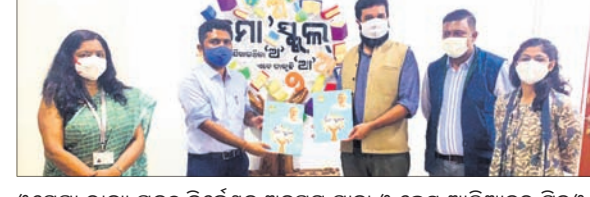
'ମୋ ସ୍କୁଲ ଅଭିଯାନ', 'କ୍ୱେଷ୍ଟ ଆଲିଆନ୍ସ' ମଧ୍ୟରେ ଏମ୍ପ୍ଲୟ

ସରକାରୀ ଏବଂ ସରକାରୀ ଅନୁଦାନପ୍ରାପ୍ତ ବିଦ୍ୟାଳୟରେ ଶିକ୍ଷାଲାଭ କରୁଥିବା ଛାତ୍ରୀଛାତ୍ର ଏବଂ ଶିକ୍ଷକମାନଙ୍କୁ ଏକଦିନ ଶିକ୍ଷକ ଚେକ୍ଚୁଟାଇଲ ଏବଂ ପଠନଶିଳ୍ପୀ ସମ୍ବନ୍ଧରେ ପ୍ରଶିକ୍ଷଣ ପ୍ରଦାନ ପାଇଁ ସେମାନଙ୍କୁ 'କ୍ୱେଷ୍ଟ ଆଲିଆନ୍ସ' ଏବଂ 'ମୋ ସ୍କୁଲ ଅଭିଯାନ' ମଧ୍ୟରେ ଏକ ଏମ୍ପ୍ଲୟ ସ୍ୱାଗତୀୟ ହୋଇଯାଇଛି।