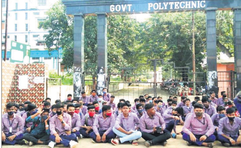
ପଲିଟେକନିକ୍ ସ୍ନାତ୍ତକୋତ୍ତର ଧାରଣାରେ ବସିଛନ୍ତି।