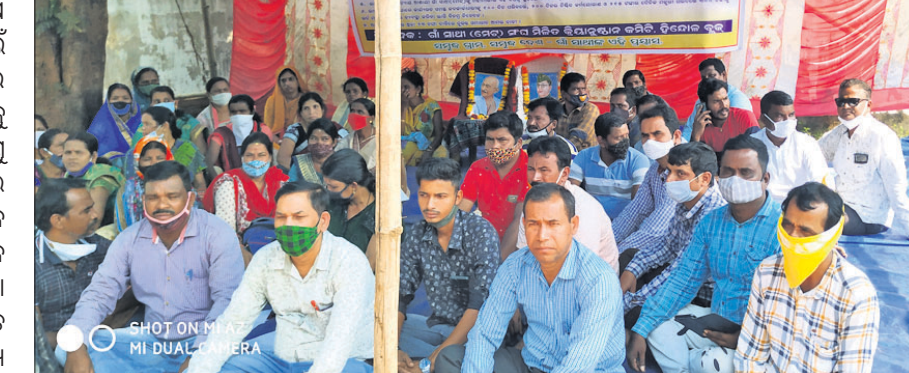
ଗ୍ରାମବାସୀମାନେ ରୁକ୍ଷ କାର୍ଯ୍ୟାଳୟ ସମ୍ମୁଖରେ ଧାରଣାରେ ବସିଛନ୍ତି।

ସେପ୍ଟେମ୍ବରରେ ଦ୍ୱିତୀୟ ସେମିଷ୍ଟର ପରୀକ୍ଷା ଶେଷ ହୋଇଛି। ବର୍ତ୍ତମାନ ତୃତୀୟ ସେମିଷ୍ଟର ପାଇଁ ପାଠପଢ଼ା ଚାଲିଥିବା ବେଳେ ପ୍ରଥମ ସେମିଷ୍ଟର ପରୀକ୍ଷା ପାଇଁ ନୋଟିସ୍ ଜାରି ହୋଇଛି।