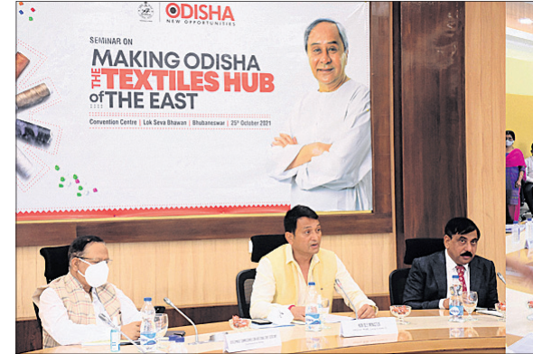
ଶିଳ୍ପ ଅନୁକୂଳ ହବ୍ରେ ପରିଣତ କରିବ

ଶିଳ୍ପ ଅନୁକୂଳ ବାତାବରଣ ରାଜ୍ୟକୁ ଏକ ଚେକ୍ଚୁଟାଇଲ ହବ୍ରେ ପରିଣତ କରିବ। ରାଜ୍ୟର ସ୍ୱଳ୍ପ ଶିଳ୍ପନୀତି ଏବଂ କଞ୍ଚାମାଲ, ଦକ୍ଷ ଓ କୁଶଳ ମାନବ ସମ୍ପଦ, ରାଜ୍ୟର ବଳୀୟ ବିଭିନ୍ନ ଉତ୍ପାଦନ କ୍ଷେତ୍ରରେ ଚେକ୍ଚୁଟାଇଲ ହବ୍ରେ ପରିଣତ କରିବ।