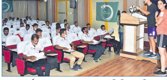
କର୍ମଶାଳାର କ୍ୱାସରୁ ସେସନରେ ଟ୍ରେନିଂ ଦିଆଯାଉଛି।