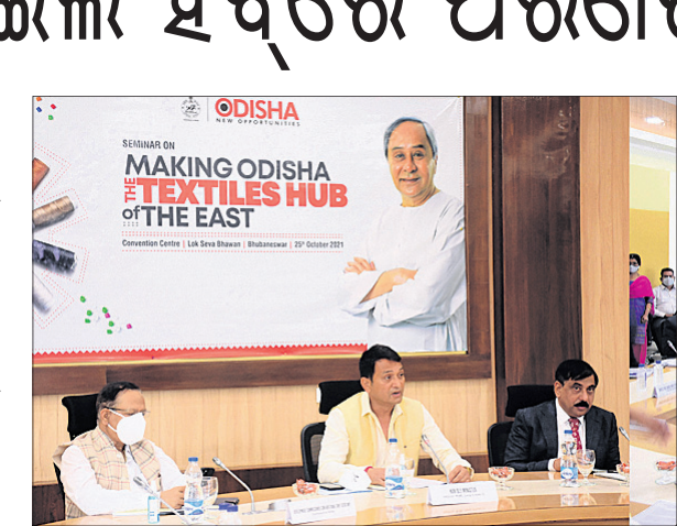
ଶିଳ୍ପ ଅନୁକୂଳ ବାତାବରଣ ରାଜ୍ୟକୁ ଟେକ୍ସଟାଇଲ ହବ୍‌ରେ ପରିଣତ କରିବ