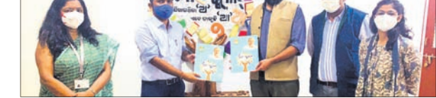
ଡିଜିଟାଲ କ୍ଷେତ୍ରରେ ଦକ୍ଷ ହେବେ ଛାତ୍ରୀଛାତ୍ର, ଶିକ୍ଷକ

'ମୋ ସ୍କୁଲ ଅଭିଯାନ', 'କ୍ୱେଷ୍ଟ ଆଲିଆନ୍ସ' ମଧ୍ୟରେ ଏମ୍‌ପ୍ଲୟ