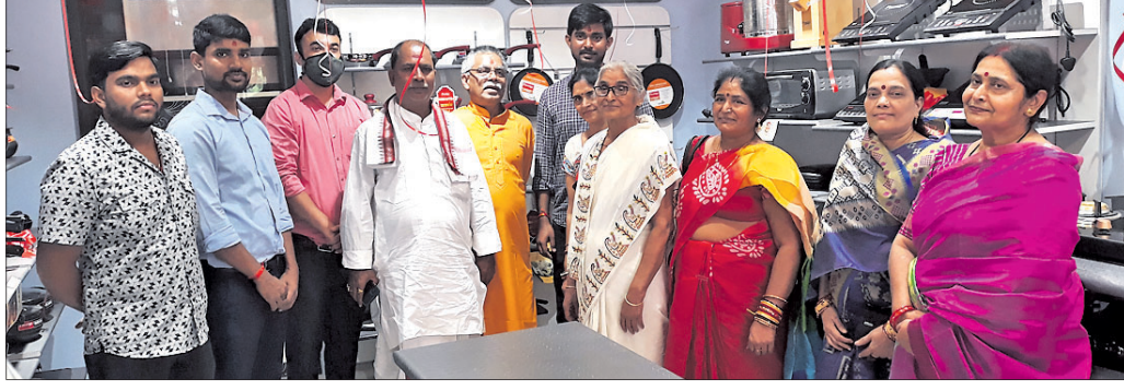
ଝାରସୁଗଡ଼ ଅଫିସ୍, ୨୬ ଅକ୍ଟୋବର

ପ୍ରମୁଖ ବ୍ରାଣ୍ଡ ପ୍ରେକ୍ଷିତ ପକ୍ଷରୁ ଝାରସୁଗଡ଼ରେ ନୂଆ ଷ୍ଟୋର ଶୁଭାରମ୍ଭ ହୋଇଛି।