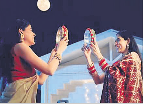
କହିଥିଲେ। ଏଭଳି ବିଜ୍ଞାପନ ତୁରନ୍ତ ହଟାଇବା ପାଇଁ ଡାକ୍ତରଙ୍କୁ ନିର୍ଦ୍ଦେଶ ଦେବାକୁ ପୋଲିସ୍ କୁହାଯାଇଥିଲା।

ଦିବାଦାୟ ‘କରଓଡୋଥ୍’ ବିଜ୍ଞାପନକୁ ନେଇ ଟ୍ରୋଲ୍ ହେବା ପରେ ପ୍ରାୟତଃ ଏଫଏମସି କମ୍ପାନୀ ଡାକ୍ତର ଚାହାଣୁ ମଙ୍ଗଳବାର ହଟାଇଦେଇଛି। ଏଥିପାଇଁ ଏହି ବିଜ୍ଞାପନ ପାଇଁ କମ୍ପାନୀ ନିର୍ଦ୍ଦେଶ ଦେଇଛି। ଯଦିପ୍ରକାଶ ମିଳିଥାନ୍ତୁ କମ୍ପାନୀର କ୍ୟାମ୍ପେନ୍ସକୁ ହଟାଇଦିଆଯାଇଛି। ଲୋକଙ୍କ ଭାବନାକୁ ଅଧିକାଂଶ ଭାବେ ଆଘାତ ପହଞ୍ଚାଇଥିବାକୁ କମ୍ପାନୀ ଏକ ବିବୃତିରେ ଧନ୍ୟବାଦ ଦେଇଛି। ତାହାର ଏହାର ବିଜ୍ଞାପନରେ ଦୁଇ ସମଲିଙ୍ଗୀଙ୍କୁ ପ୍ରଦର୍ଶିତ କରିଥିଲା। ଦୁଇ ଜଣ ଯୁବକ କିପରି ପରସ୍ପର ପାଇଁ କରଓଡୋଥ୍ ପାଲଟି ଚାହାନ୍ତି ଏଥିରେ ଦେଖିବାକୁ ମିଳିଥିଲା। ଏ ନେଇ ମଧ୍ୟପ୍ରଦେଶ ଗୃହମନ୍ତ୍ରୀ ନରେନ୍ଦ୍ର ମୋଦି କମ୍ପାନୀକୁ ସମାଲୋଚନା କରିଥିଲେ। ଆଜିକିଞ୍ଚିତ୍ ୨ ପୁରୁଷ ଛିଦ୍ମ ନୀତି ଅନୁଯାୟୀ ‘ଫୋର୍’ ନେତୃତ୍ଵାଧୀନ ଦୃଶ୍ୟ ମଧ୍ୟ ଦେଖାଇବା ବୋଲି ସେ