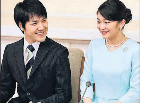
ଦୁର୍ଘଟଣାରେ ସମ୍ପୂର୍ଣ୍ଣ ଥିବା ନେଇ ଗଣମାଧ୍ୟମରେ ଖବର ପ୍ରକାଶ ପାଇବା ପରେ ବିବାହକୁ ସ୍ଵୀକୃତ ରଖାଯାଇଥିଲା।

ଜାପାନ ରାଜକନ୍ୟା ମାକୋ ଚାକ୍ କଲେଜ ସହପାଠୀ ପ୍ରେମିକ କେଇ କୋମୁରୋକୁ ବିବାହ କରିଛନ୍ତି। ଏକ ସାଧାରଣ ପରିବାରରେ ବିବାହ କରିଥିବାରୁ ମାକୋଙ୍କୁ ରାଜକନ୍ୟା ମାନ୍ୟତା ହରାଇବାକୁ ପଡ଼ିଛି। ମଙ୍ଗଳବାର ଟୋକିଓରେ ଏକ ଖବରଦାତା ସମ୍ମିଳନୀରେ ସେମାନେ ଏଥିପାଇଁ ଦୁଃଖ ପ୍ରକାଶ କରିଛନ୍ତି। ରାଜ ପରିବାର ବାହାରେ ଜଣେ ଛାତ୍ରଙ୍କ ସହ ସମ୍ପର୍କ ରଖିବା ନେଇ ମାକୋ ସମାଲୋଚନାରେ ସରସ୍ୟ ହୋଇ ଆସୁଥିଲେ, ଯାହା ଚାକ୍ ମାନସିକ ସ୍ଵାସ୍ଥ୍ୟକୁ ପ୍ରଭାବିତ କରିଥିଲା। ସେମାନେ ବିବାହ କରିସାରିଛନ୍ତି ବୋଲି ଘୋଷଣା କରିବା ସହ ଅନ୍ୟ ପ୍ରଶ୍ନଗୁଡ଼ିକୁ ଏତାଲି ଯାଇଥିଲେ। ୨୦୧୮ ନଭେମ୍ବରରେ ସେମାନଙ୍କର ବିବାହ ଅନୁଷ୍ଠିତ ହେବାକୁ ଥିଲା। ତେବେ କୋମୁରୋଙ୍କ ମାଆ ଏକ ଦୁର୍ଘଟଣାରେ ସମ୍ପୂର୍ଣ୍ଣ ଥିବା ନେଇ ଗଣମାଧ୍ୟମରେ ଖବର ପ୍ରକାଶ ପାଇବା ପରେ ବିବାହକୁ ସ୍ଵୀକୃତ ରଖାଯାଇଥିଲା।