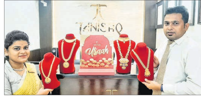
ଭୁବନେଶ୍ୱର, ୨୬ ଅକ୍ଟୋବର

ଉତ୍ସବ ରତ୍ନକୁ ଧ୍ୟାନରେ ରଖି ପ୍ରମୁଖ ଗହଣା ବ୍ରାଣ୍ଡ ତନିଷ ପକ୍ଷରୁ ଆକର୍ଷଣୀୟ ଅଫର ଘୋଷଣା କରାଯାଇଛି।