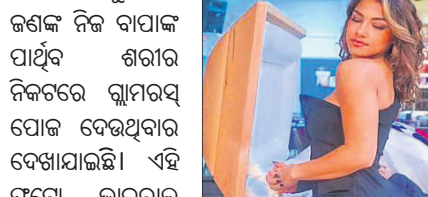
ମୁସା: ୧୦ ଦଶକରେ ବଳିଭତ୍ତ ମସ୍ତ-ମସ୍ତ ଗର୍ଲ ଭାବେ ଜଣାଶୁଣା ରବିନା ବଣ୍ଡନ ମଙ୍ଗଳବାର ୪୭ ବର୍ଷରେ ପହଞ୍ଚିଛନ୍ତି।

ଝାଟ୍ଟି: ଘୋସିଆଲ ମିଡିଆରେ ଜଣେ ଆମେରିକୀୟ ମୁବତ୍ତାକ ଫଟୋ ଭାଇରାଲ ହୋଇଛି।