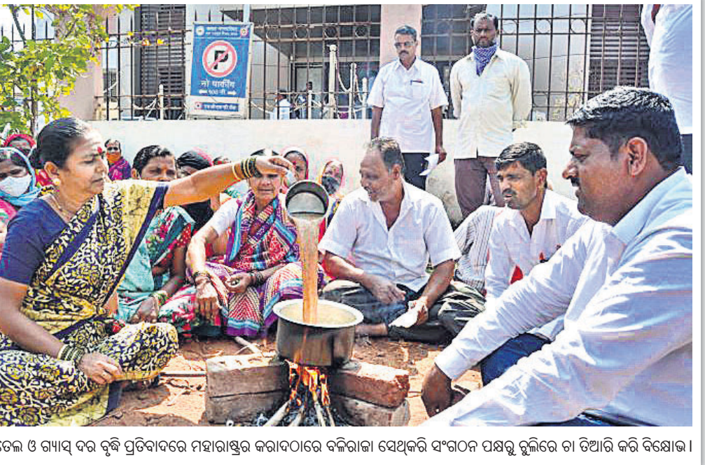
ତେଲ ଓ ଗ୍ୟାସ୍ ବର ବୃଦ୍ଧି ପ୍ରତିବାଦରେ ମହାରାଷ୍ଟ୍ରର କରାଦଠାରେ ବଳିରାଣା ସେଥିକରି ସଂଗଠନ ପକ୍ଷରୁ ପ୍ରତିବାଦ କରି ବିରୋଧୀ।

ମିଳିଆରେ ଭାଇଭାଇ ହୋଇଛି। ଅନ୍ୟ ଏକ ଘଟଣାରେ ରାଜସ୍ଥାନ ଉତ୍ସବପୁରର ଏକ ଘରୋଇ ସ୍କୁଲର ଶିକ୍ଷୟିତ୍ରୀଙ୍କୁ ଚାକିରିରୁ ବହିଷ୍କାର କରାଯିବା ସହ ତାଙ୍କ ବିରୋଧରେ ମାମଲା ରୁଜୁ ହୋଇଛି। ପାକିସ୍ତାନର ବିକ୍ଷୟ ପରେ ନିର୍ଦ୍ଦିଷ୍ଟ ଅଧିକାର ନାହିଁ। ଉକ୍ତ ଶିକ୍ଷୟିତ୍ରୀ ‘ଆମେ ଚିନ୍ତା’ ବୋଲି ସ୍ଵାସ୍ଥ୍ୟାଧିକାରୀ ଆବେଦନ କରିଥିଲେ, ଯାହାର ଫଳ ଯୋଡ଼ିଆଇ ମିଳିଆରେ ଭାଇଭାଇ ହୋଇଛି।