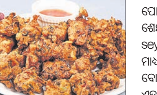
ଚେଷ୍ଟା ଚେଷ୍ଟର ଅର୍ଥାତ୍ ସ୍ୱାଦ ଚାଖିବା ପାଇଁ ଲୋକଙ୍କୁ ଦରମା ଦେବ ବୋଲି ଘୋଷଣା କରିଛି ଟିକେନ ପକୋଡ଼ା, ବ୍ରିଷ୍ଟଲ, ବ୍ରିଷ୍ଟଲ, ସର୍ବ ଆଦିକୁ ପରପେଟ୍ଟୁ

ଲକ୍ଷ୍ମଣ: ବ୍ରିଟେନର ଏକ କମ୍ପାନୀ ଟିକେନ ପକୋଡ଼ା ଖାଇଲେ ୧ ଲକ୍ଷ ଟଙ୍କାର ଦରମା ମିଳିବ ବୋଲି ଘୋଷଣା କରିଛି।