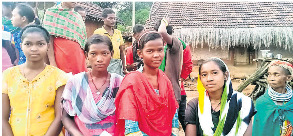
ଆନ୍ଧ୍ରରେ ବନ୍ଧା ଛାତ୍ରାଛାତ୍ର, ମୁଦତାମୁଦକ ନିଖୋଜ ଏବଂ ଅତ୍ୟନ୍ତ ଗରିବ ନେଇ ଅଭିଯୋଗ କରିଥିବା ୪ ବନ୍ଧା ମୁଦତା।

ବନ୍ଧା ଜନଜାତିର ବହୁ କୋମଳମତି ନାବାଳିକା, ନାବାଳକଙ୍କ ପାଠପଢ଼ାରେ ଡୋରି ବାନ୍ଧିଦେଲା କରୋନା। ଏହାପରେ ସେମାନେ ଆସିଗଲେ ଆନ୍ଧ୍ର ଦଳାଳଙ୍କ ଗାଡ଼ିରେ, ସାଜିଗଲେ ଦାଦନ ଶ୍ରମିକ। ନିୟୋଜିତ ହେଲେ ଅସ୍ଵାସ୍ଥ୍ୟକର ପରିବେଶ ଭିତରେ ବିପଦଜନକ କାର୍ଯ୍ୟରେ ସେମାନଙ୍କ ମଧ୍ୟରୁ କେତେକଙ୍କ ସେଠାରେ ପ୍ରାଣ ହରାଇଥିବାବେଳେ ଅନ୍ୟ କେତେକଙ୍କ ଗୁରୁତର ଅବସ୍ଥାରେ ଗାଁକୁ ଫେରି କାଦନ ହାରିଛନ୍ତି। ଦୁର୍ଦ୍ଦଶା ଏଠି ସରିଯାଇନି, ଏବେବି ବନ୍ଧା ଜନଜାତିର ବହୁ ଶିଶୁ ଶ୍ରମିକ, ମୁଦତାମୁଦକ ଆନ୍ଧ୍ରରେ ଦୁର୍ବିଷୟ ଅବସ୍ଥାରେ ବନ୍ଧା ପଡ଼ିଛନ୍ତି। ଅନେକଙ୍କ ସହ ପରିବାର ଲୋକଙ୍କ ଯୋଗାଯୋଗ ନାହିଁ। ଅଶିକ୍ଷିତ ଏବଂ ଅତ୍ୟନ୍ତ ଗରିବ ମା'ବାପା ସେମାନଙ୍କ ଝିଅପୁଅଙ୍କ ନିଖୋଜ ସମ୍ପର୍କରେ କାହାକୁ ଜଣାଇବେ ତାହା ମଧ୍ୟ କାଣିପାଲୁନାହାନ୍ତି। କେବଳ ଆଖିରୁ ଲୁହ ଗଢ଼ାଉ ଚାହିଁ ରହିଛନ୍ତି ସହାୟକ ଫେରିବା ବାଟକୁ।