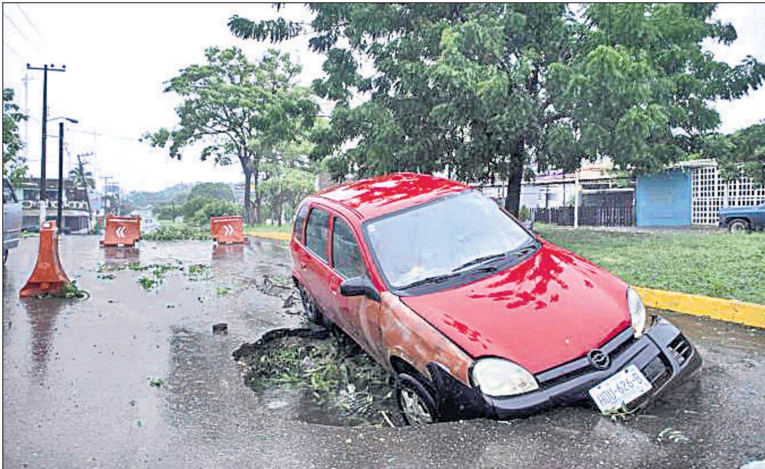
ମେକ୍ସିକୋରେ ହରିକେନ୍ ରିକ୍ ବ୍ୟାପକ କ୍ଷୟକ୍ଷତି ଘଟାଇଛି। ପ୍ରବଳ ଝଡ଼ବର୍ଷାରେ ଲାକାରୋ କାର୍ଡେନାସ୍ରେ ରାସ୍ତା ଭାଙ୍ଗିଯାଇଥିବାବେଳେ ଏକ କାର୍ ପଡ଼ିଯାଇଛି।

ଦୁର୍ଯ୍ୟୋଧନ ପାତ୍ର ମାଲକାନଗିରି, ୨୬/୧୦ ମାଲକାନଗିରି ଜିଲ୍ଲା ଖଇରପୁଟ ବ୍ଲକ୍ ବନ୍ଧାଘାଟିରେ ରହୁଛନ୍ତି ବନ୍ଧା ଆଦିବାସୀ। ଏହି ଆଦିମ ଜନଜାତିକ ଜୀବନମାନରେ ଉନ୍ନତି ଆଣିବା ପାଇଁ ସରକାରୀ ଓ ଘରୋଇ ସଂସ୍ଥା ପକ୍ଷରୁ ବେଶ୍ଵା ହୋଇଛି। କିନ୍ତୁ ତାହା ସମ୍ଭବ ହୋଇପାରିନାହିଁ। ଏହାର ପୁଞ୍ଜ୍ୟ କାରଣ ହେଲା ବନ୍ଧା ଗ୍ରାମଗୁଡ଼ିକର ଭୌଗୋଳିକ ଅବସ୍ଥିତି। ପାହାଡ଼ ଉପରେ ଘଞ୍ଚ ଜଙ୍ଗଲରେ ଥିବା ଉକ୍ତ ଗ୍ରାମଗୁଡ଼ିକୁ ପହଞ୍ଚିବା କଷ୍ଟସାଧ୍ୟ। ଏହାର ଫଳଦା ଉଠାଉଛନ୍ତି ପଡ଼ୋଶୀ