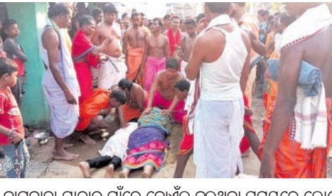
ନାଗବାଚା ଯାତ୍ରାର ଗାଁରେ ବୋଧୂଳି ବୁଲୁଥିବା ସମୟରେ ଲୋକେ ଅଧିକା ପଡ଼ିଛନ୍ତି।

ନୂଆପଡ଼ା ଜିଲା କୋମନା ବୁକ୍ ଠିକପାଳି ପଞ୍ଚାୟତର ଶୁକ୍ଳିମୁଣ୍ଡି ଗାଁରେ ନାଗବାଚା ଯାତ୍ରା ଆରମ୍ଭ ହୋଇଯାଇଛି। ବିଶ୍ୱ ଯାତ୍ରା ପ୍ରଦାନବାର ପାଳନ କରାଯାଇଥିଲା। ଉପବାସ ରହି ମହାହୁରେ ଗ୍ରାମ ପୋଖରୀକୁ ଯାଇ ଶୁକ୍ଳସ୍ନାନ ସାରି ପୋଖରୀ ପାଖରେ ଥିବା ଶିବ ମନ୍ଦିରରେ ପୂଜାର୍ଚ୍ଚନା କରାଯାଏ। ସେଠାରେ ମାଟିର ନାଗଦେବତା ନିର୍ମାଣ କରି ନାଗଦେବତା ବରୁଣ କରି ଯାଜ୍ଞରେ ଧରି ପ୍ରତିଦିନ ପୂଜା ହେଉଥିବା ସ୍ଥାନକୁ ଆଣି ସ୍ଥାନ କରାଯାଏ। ସୂକ୍ଷ୍ମରେ ପୂଜା କରା ଯାଇଥାଏ। ନାଗଦେବତା ବରୁଣ କରି ଆଶିବା ସମୟରେ ରାସ୍ତାରେ କାଲିସି ଆସଥାଏ। ଗାଁରେ ବୋଧୂଳି ବୁଲିଥାଏ। ସେହି ସମୟରେ ଗାଁର ଲୋକେ ଅଧିକା ପଡ଼ିଥାନ୍ତି। ଭିଜ ଭିଜ ଲୋକଙ୍କ ଶିରରେ ଅନେକ ପ୍ରକାର ଦେବା ଦେବୀ ଆସି ଅଧିକା ପଡ଼ିଥିବା ଲୋକଙ୍କୁ ବଚନ ଦେଇଥାନ୍ତି। ମା' ଠାରେ ରୁହାରୀ କଲେ ସବୁ ମନସାମନା ପୂର୍ଣ୍ଣ ବୋଲି ଲୋକେ ବିଶ୍ୱାସ କରି ମା' ଠାରେ ଅଧିକା ପଡ଼ି ରୁହାରୀ ଜଣାଇଥାନ୍ତି। ଏହି ନାଗବାଚା ଯାତ୍ରାର ନିୟମ ରହିଛି। ଗାହା ବିଧି ଅନୁସାରେ ପାଳନ କରିବାକୁ ପଡ଼େ। ଗୋଟିଏ ସପ୍ତାହକୁ ଗୋଟିଏ ପାଳନ ୩,୫,୭ ଏହିପରି ପାଳନ ରହିଛି। ନାଗବାଚା ଭକ୍ତମାନେ ୩,୫ କିମ୍ବା ୭ ସପ୍ତାହ ବିଧି ଅନୁସାରେ ପାଳନ କରି ପୂଜାର୍ଚ୍ଚନା