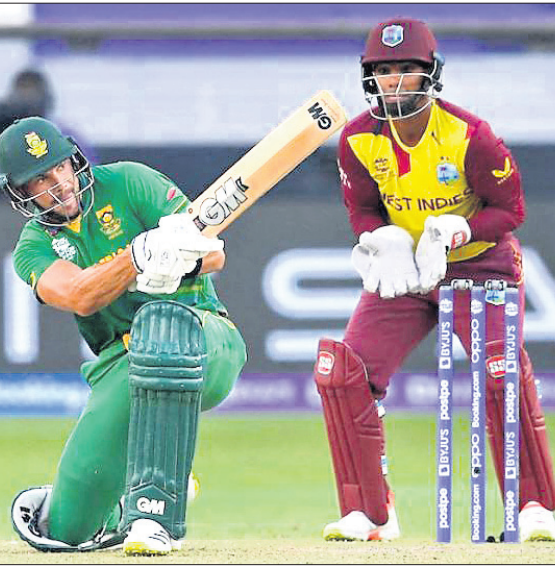
ଆକ୍ରମଣାତ୍ମକ ଶବ୍ଦ ଖେଳୁଛନ୍ତି ଏତେ ମାରାତ୍ମକ।

ଦକ୍ଷିଣ ଆଫ୍ରିକା ଟପ୍ ହାରି ବ୍ୟାଟି ପାଇଁ ଆମନ୍ତ୍ରଣ ପାଇଥିବା ଫ୍ରେସ୍ୱିଲଣ୍ଡ ୮ ଉଇକେଟ ହରାଇ ୧୮୩ ରନରେ ସୀମିତ ରହିଥିଲା। ଜବାବରେ ଦକ୍ଷିଣ ଆଫ୍ରିକା ୨ ଉଇକେଟ ହରାଇ ୧୮.୨ ଓଭରରେ ବିଜୟ ଲାଭ ହାସଲ କରିନେଇଥିଲା। ଅନ୍ୟମାନଙ୍କ ମଧ୍ୟରେ ଓପନର ମହମ୍ମଦ ରିଜ୍ୱାନ ୩୩, ବାବର ଆଜମ ୯, ଫଖର ଜମାନ ୧୧, ମହମ୍ମଦ ହାଫିଜ ୧୧ ଓ ଜମାଦ ଖ୍ରୀସିନ ୧୧ ରନ କରି ଆଉଟ ହୋଇଥିଲେ। ବୋଲିଂରେ ଚ୍ୟୁଟିଲାଣ୍ଡ ଟପ୍ ହାରି ଚ୍ୟୁଟିଲାଣ୍ଡ ୨, ମିଚେଲ ସାଣ୍ଡନ, ଟମ ସୋପି ଓ ଟ୍ରେଣ୍ଡ ବୋଲ୍ ଗୋଟିଏ ଲେଖାଏ ଉଇକେଟ ଅଭିଆର କରିଥିଲେ। ଟପ୍ ହାରି ବ୍ୟାଟି ପାଇଁ ଆମନ୍ତ୍ରଣ ପାଇଥିବା ଫ୍ରେସ୍ୱିଲଣ୍ଡ ଏକଦା ୮ ଓଭରରେ ଗୋଟିଏ ଉଇକେଟ ହରାଇ ୫୦ରୁ ଉର୍ଦ୍ଧ୍ୱ ରନ ସଂଗ୍ରହ କରି ବେଶ୍ ଭଲ ଆରମ୍ଭ କରିଥିଲା। ୨୦ଟି ବଲ୍ରେ ସମ୍ପୂର୍ଣ୍ଣ ହୋଇ ଅଭିଜ୍ଞ ଓପନର ମାର୍ଟିନ ରୁଭ୍ରିଲ ପ୍ରଥମେ ୧୭ ରନ କରି