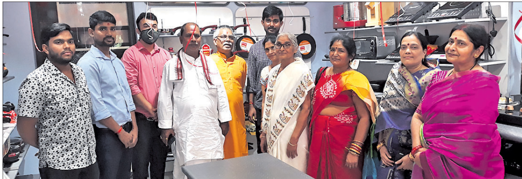
ଝାରସୁଗଡ଼ା ଅଫିସ୍, ୨୬।୧୦

ପ୍ରମୁଖ ବ୍ରାଣ୍ଡ ପ୍ରେଷ୍ଟିଜ ପକ୍ଷରୁ ଝାରସୁଗଡ଼ାରେ ନୂଆ ଷ୍ଟୋର ଶୁଭାରମ୍ଭ ହୋଇଛି।