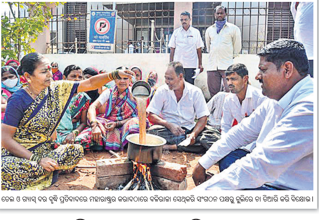
ତେଲ ଓ ଗ୍ୟାସ୍ ବନ୍ଦ ବୃଦ୍ଧି ପ୍ରତିବାଦରେ ମହାରାଷ୍ଟ୍ରର କରାଦଳରେ ବଳରାଜା ସେଥିକରି ସଂଗଠନ ପକ୍ଷରୁ ହୁଲିରେ ତା ଡିଆରି କରି ବିରୋଧୀ।

ଶ୍ରୀନଗର/କରମପୁର, ୨୬।୧୦: ଶ୍ରୀନଗରର ମେଡିକାଲ କଲେଜର କେତେକ ଛାତ୍ରୀଙ୍କ ବିରୋଧରେ ଆତଙ୍କବାଦ ନିରୋଧୀ ଆଇନ ଏବଂ ବେଆଇନ କାର୍ଯ୍ୟକଳାପ ନିରାକରଣ ଆଇନ (ସୁଧପିଏ)ରେ ମାମଲା ରୁଚି ହୋଇଛି। ଗତ ରବିବାର ବୈଠିକ୍-୨୦ ବିଷୟକ୍ତ ମ୍ୟାଗିସ୍ଟରେ ଭାରତ ବିରୋଧରେ ପାକିସ୍ତାନ କ୍ରିକେଟ୍ ଟିମ୍ ବିଳୟରେ ସେମାନେ ବାଣୀ ପୁସ୍ତକ ଉତ୍ପାଦନ କରାଯାଇଛି।