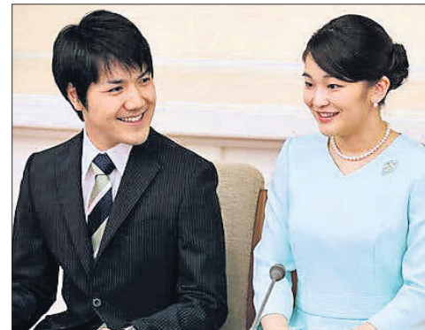
ଦୁର୍ନୀତିରେ ସମ୍ପୂର୍ଣ୍ଣ ଥିବା ନେଇ ଗଣମାଧ୍ୟମରେ ଖବର ପ୍ରକାଶ ପାଇବା ପରେ ବିବାହକୁ ସ୍ଥିତି ରଖାଯାଇଥିଲା।

ଜାପାନ ରାଜକନ୍ୟା ମାକୋ ଟାକ୍ କଲେଜ ସହପାଠୀ ପ୍ରେମିକ କେଲ କୋମୁରୋକୁ ବିବାହ କରିଛନ୍ତି। ଏକ ସାଧାରଣ ପରିବାରରେ ବିବାହ କରିଥିବାରୁ ମାକୋଙ୍କୁ ରାଜକନ୍ୟା ମାନ୍ୟତା ହରାଇବାକୁ ପଡ଼ିଛି।