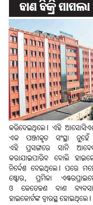
ବାଣ ବିକ୍ରି ମାମଲା