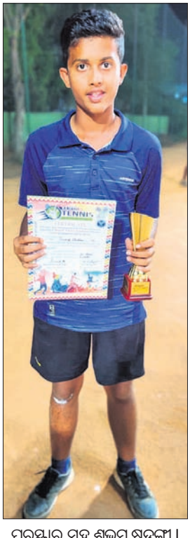
ପୁରସ୍କାର ସହ ଶୁଭେଚ୍ଛା ସୂଚନା।