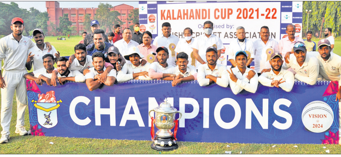
କଳାହାଣ୍ଡି କପ୍ ଚାମ୍ପିୟନ କଟକ ‘ଏ’ ଦଳ ଗୁପ୍ତି ସହ ଅତିଥିକ ଗହଣରେ।