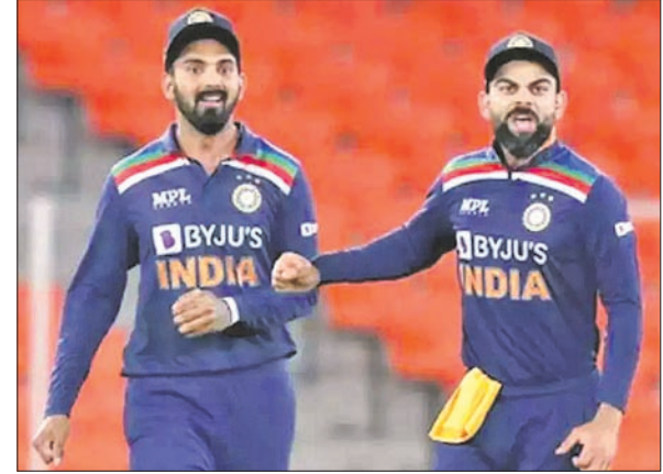
ଲୋକେଶ ରାହୁଲ ଓ ବରାଟ କୋହଲି ।

ସଦ୍ୟ ପ୍ରକାଶିତ ଅନ୍ତର୍ଜାତୀୟ କ୍ରିକେଟ କାର୍ଡନସିଲ (ଆଇସିସି) ଟି୨୦ ର୍ୟାଙ୍କିଂରେ ଭାରତୀୟ ଅଧିନାୟକ ରୋହିତ କୋହଲି ଓ ତାରକା ଓପନର ଲୋକେଶ ରାହୁଲ ଡକ୍ଟର ଖସିଲେ । ଚଳିତ ଟି୨୦ ବିଶ୍ୱକପରେ ପାକିସ୍ତାନ ବିପକ୍ଷରେ ଅନ୍ତର୍ଜାତୀୟ ଇନିଂସ ଖେଳିଥିଲେ ମଧ୍ୟ ବ୍ୟାଟିଂ ତାଲିକାରେ କୋହଲି ଗୋଟିଏ ଗ୍ଲାନ ଡକ୍ଟର ଖସି ପଞ୍ଚମ ଗ୍ଲାନରେ ରହିଛନ୍ତି । ସେହିପରି ରାହୁଲ ଦୁଇଟି ଗ୍ଲାନ ଡକ୍ଟର ଖସି ଅଷ୍ଟମ ଗ୍ଲାନରେ ରହିଛନ୍ତି । ବୁଧବାର ପ୍ରକାଶିତ ର୍ୟାଙ୍କିଂରେ କୋହଲି ୭୨୫ ରେଟିଂ ପଏଣ୍ଟ ହାସଲ କରିଛନ୍ତି । ସେ ୪୯ଟି ବଲର ସମ୍ମୁଖୀନ ହୋଇ ୫୭ ରନର ଅର୍ଦ୍ଧଶତକୀୟ ଇନିଂସ ଖେଳିଥିଲେ । ସେହିପରି ୬୮୪ ରେଟିଂ ପଏଣ୍ଟ ହାସଲ କରିଥିବା ରାହୁଲ ମାତ୍ର ୩ ରନ ସଂଗ୍ରହ କରି