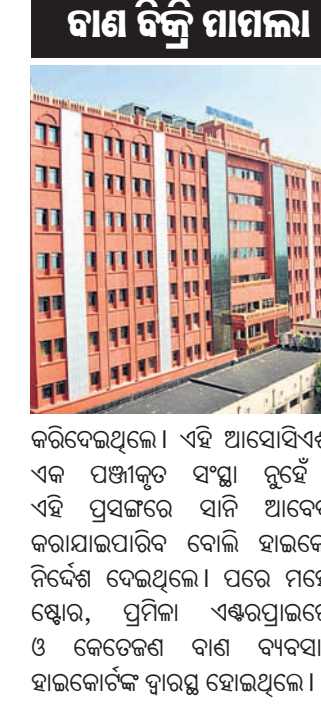
ବାଣ ବିକ୍ରି ମାମଲା