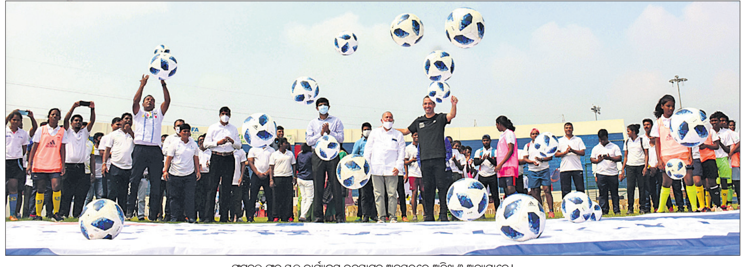
ଫୁଟବଲ ପାଇଁ ଶୁଭକାରୀଙ୍କୁ ଉଦ୍‌ଘାଟନ ଅବସରରେ ଅତିଥି ଓ ଅନ୍ୟମାନେ ।

ଭୁବନେଶ୍ୱର, ୨୭।୧୦ (କ୍ରୀଡ଼ା ପ୍ରତିନିଧି): ଫେଡେରେଶନ ଇଣ୍ଡିଆନ ଇଣ୍ଡିଆନ ଟିମ୍ ଫୁଟବଲ ଆସୋସିଏସନ (ଫିଫା) ଓ କଲିଙ୍ଗ ଇନ୍‌ସ୍ପିରାସନ୍ ଅଫ୍ ସୋସିଆଲ ସାଇଟ୍ସ (କିସ୍)ର ମିଳିତ ସହଯୋଗରେ ବୁଧବାର ଫୁଟବଲ ପାଇଁ ଶୁଭକାରୀଙ୍କୁ ମୁଖ୍ୟମନ୍ତ୍ରୀ ନବୀନ ପଟ୍ଟନାୟକ ଭାର୍ତ୍ତୀୟ ଉଦ୍‌ଘାଟନ କରିଛନ୍ତି । ଫିଫା ସହଯୋଗରେ ପ୍ରଥମଥର ଲାଗି ଭାରତରେ ଏହି କାର୍ଯ୍ୟକ୍ରମ ଆରମ୍ଭ ହୋଇଛି । “କ୍ରୀଡ଼ା କ୍ଷେତ୍ରରେ ବିନିଯୋଗ ହିଁ ଯୁବଗୋଷ୍ଠୀ ପାଇଁ