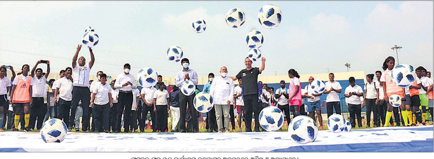
ଫୁଟବଲ ପାଇଁ କାର୍ଯ୍ୟକ୍ରମ ଉଦ୍ଘାଟନ ଅବସରରେ ଅତିଥି ଓ ଅନ୍ୟମାନେ।

ଭୁବନେଶ୍ୱର, ୨୭।୧୦ (କ୍ରୀଡ଼ା ପ୍ରତିନିଧି): ଫେଡେରେଶନ ଇଣ୍ଡିଆନ୍ କ୍ରୀଡ଼ା ଓ ଫୁଟବଲ ଆସୋସିଏସନ (ଫିଫା) ଓ କଲିଙ୍ଗ ଇନ୍‌ସ୍ପୋର୍ଟ ଅଫ୍ ଯୋସିଆଲ ସାଇଟ୍ସ (କିସ୍)ର ମିଳିତ ସହଯୋଗରେ ବୁଧବାର ଫୁଟବଲ ପାଇଁ କାର୍ଯ୍ୟକ୍ରମକୁ ମୁଖ୍ୟମନ୍ତ୍ରୀ ନବୀନ ପଟ୍ଟନାୟକ ଉଦ୍ଘାଟନ କରିଛନ୍ତି। ଫିଫା ସହଯୋଗରେ ପ୍ରଥମଥର ଲାଗି ଭାରତରେ ଏହି କାର୍ଯ୍ୟକ୍ରମ ଆରମ୍ଭ ହୋଇଛି। "କ୍ରୀଡ଼ା କ୍ଷେତ୍ରରେ ବିନିଯୋଗ ହିଁ ମୁବଗୋଷ୍ଠୀ ପାଇଁ