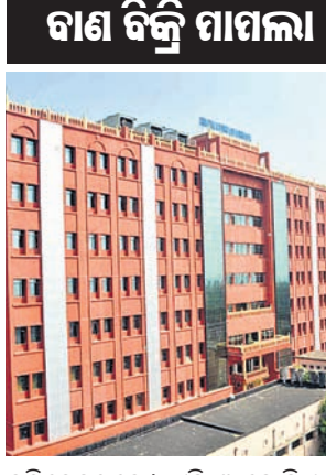
ବାଣ ବିକ୍ରି ମାମଲା

କରିଦେଇଥିଲେ। ଏହି ଆସୋସିଏସନ ଏକ ପଞ୍ଜୀକୃତ ସଂସ୍ଥା ନୁହେଁ ଓ ଏହି ପ୍ରସଙ୍ଗରେ ସାଧି ଆବେଦନ କରାଯାଇପାରିବ ବୋଲି ହାଇକୋର୍ଟ ନିର୍ଦ୍ଦେଶ ଦେଇଥିଲେ। ପରେ ମହେଶ ଷ୍ଟୋର, ପ୍ରମିଳା ଏଣ୍ଡରପ୍ରାଇଭେଟ୍ ଓ କେତେଜଣ ବାଣ ବ୍ୟବସାୟୀ ହାଇକୋର୍ଟଙ୍କ ଦ୍ୱାରସ୍ଥ ହୋଇଥିଲେ।