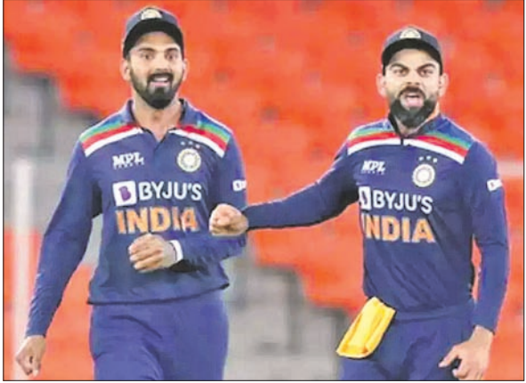
ଲୋକେଶ ରାହୁଲ ଓ ବରାଟ କୋହଲି।

ସମ୍ୟ ପ୍ରକାଶିତ ଅନ୍ତର୍ଜାତୀୟ କ୍ରିକେଟ କାଉନ୍‌ସିଲ (ଆଇସିସି) ଟି୨୦ ର୍ୟାଙ୍କିଂରେ ଭାରତୀୟ ଅଧିନାୟକ ରୋହିତ କୋହଲି ଓ ତାରକା ଓପନର ଲୋକେଶ ରାହୁଲ ଡଳୁ ଖସିଛନ୍ତି। ଚଳିତ ଟି୨୦ ବିଶ୍ୱକପରେ ପାକିସ୍ତାନ ବିପକ୍ଷରେ ଅନ୍ତର୍ଜାତୀୟ ଇନିଂସ ଖେଳିଥିଲେ ମଧ୍ୟ ବ୍ୟାଟିଂ ତାଲିକାରେ କୋହଲି ଗୋଟିଏ ଗ୍ଲାନ ଡଳୁ ଖସି ପଞ୍ଚମ ଗ୍ଲାନରେ ରହିଛନ୍ତି। ସେହିପରି ରାହୁଲ ଦୁଇଟି ଗ୍ଲାନ ଡଳୁ ଖସି ଅଷ୍ଟମ ଗ୍ଲାନରେ ରହିଛନ୍ତି। ରୁସ୍‌ବାଦ ପ୍ରକାଶିତ ର୍ୟାଙ୍କିଂରେ କୋହଲି ୭୨୫ ରେଟିଂ ପଏଣ୍ଟ ହାସଲ କରିଛନ୍ତି। ସେ ୪୯ଟି ବଲର ସମ୍ମୁଖୀନ ହୋଇ ୫୭ ରନର ଅର୍ଦ୍ଧଶତକୀୟ ଇନିଂସ ଖେଳିଥିଲେ। ସେହିପରି ୬୮୪ ରେଟିଂ ପଏଣ୍ଟ ହାସଲ କରିଥିବା ରାହୁଲ ମାତ୍ର ୩ ରନ ସଂଗ୍ରହ କରି