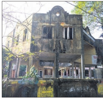
ପୁରୁପାତ ହୋଇଛି ବିକାଶର ପର୍ବ । ତଥାପି ଏରସମାସାୟାଳ ମନରେ ସେଦିନର ଦୃଶ୍ୟ ଅଲିଭା ସ୍ମୃତି ହୋଇ ରହିଯାଇଛି ।

ମହାବାତ୍ୟାର ଲୋମଟାକୁରା ଘଟଣାବଳୀକୁ ଏବେବି ଲୋକେ ଭୁଲି ପାରିନାହାନ୍ତି । ୨୨ ବର୍ଷ ତଳେ ଅର୍ଥାତ୍ ୧୯୯୯, ଅକ୍ଟୋବର ୨୯ରେ ତାହା ଘଟିଥିଲା ।