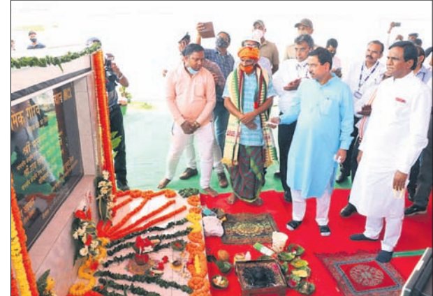
ହିଲୁକା ଏରିଆରେ ଖାତର ପାର୍କର ଭିଡିପ୍ରସ୍ତର ସ୍ଥାପନ କରୁଛନ୍ତି କେନ୍ଦ୍ରମନ୍ତ୍ରୀ ।

୫୦ ବର୍ଷ ପୂର୍ତ୍ତି ପାଳନ ୫୦ ବର୍ଷ ପୂର୍ତ୍ତି ପାଳନ ପାଇଁ ପ୍ରସ୍ତୁତ ହୋଇଛି ବିଜୟ ମଣିଲ ।